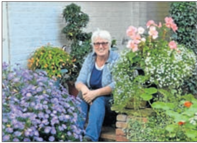
Foto-expositie in 't Brederode Huys

Santpoort-Noord - Donderdag 8 december is er weer een grote bingo met loterij in Dorpshuis Het Terras aan de Santpoortsedreef 1. De bingo wordt gehouden van 13.30 tot circa 16.30 uur. Men is van harte welkom vanaf 13.00 uur. De toegang bedraagt 1,50 euro en men ontvangt het eerste bingoletje gratis. Er zijn weer vele prijzen zoals altijd. Kaarten zijn verkrijgbaar bij de beheerder van Het Terras of op de dag zelf aan de deur als er voldoende plaats is.