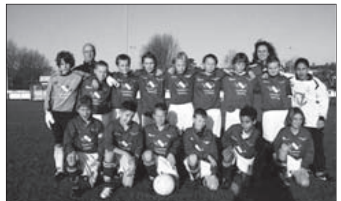
Stormvogels D2 ziet er prachtig uit in het nieuwe tenue, dankzij sponsor Lindeman Holding