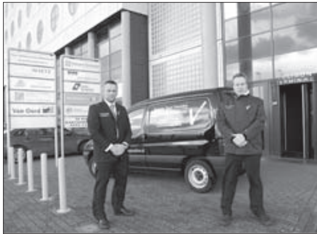
Security Team IJmuiden werkt vanuit de Felison Terminal

met een herinnering aan de verkeersregel en spraken ouders en kinderen aan die zich niet aan de regels hielden. Er werden heel wat herinneringen uitgedeeld en de kinderen kregen veel positieve reacties. Politie en school spraken van een zeer geslaagde actie.