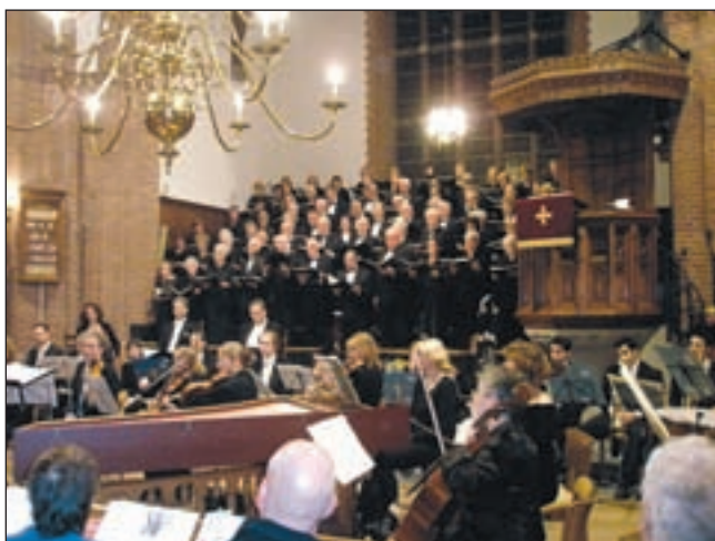
De COV tijdens de uitvoering van het najaarsconcert in de Nieuwe Kerk