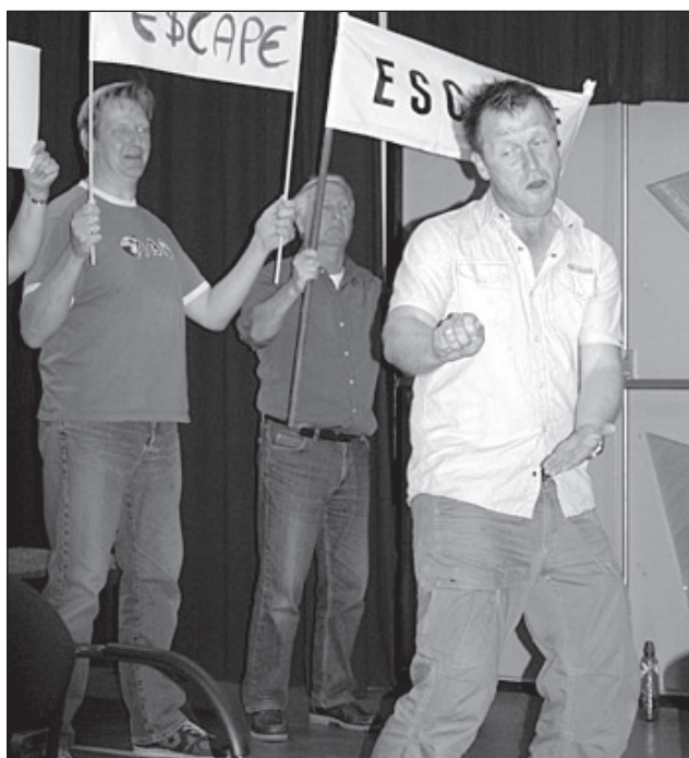
De repetities zijn nog in volle gang

Hij is daarvoor verhoord en er wordt proces-verbaal tegen hem opgemaakt.