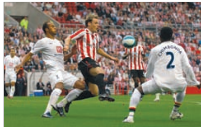
Cruiseverrymaatschappij DFDS Seaways heeft voor veel thuiswedstrijden van de gerenommeerde voetbalclubs Newcastle United, Middlesbrough en Sunderland tickets beschikbaar

Niet voor niets wordt de aquacultuur en viskweek in potentie net zo belangrijk als de bloembollen- en bloemteelt. Zeker als er combinaties van vis- en bloemteelt worden gevonden. Nederland geeft water de ruimte, dan moeten we deze ruimte ook benutten. Kortom, het is de hoogste tijd dat we alle realistische wateruitdagingen een kans geven! (zie advertentie elders in deze krant). Floor Bal