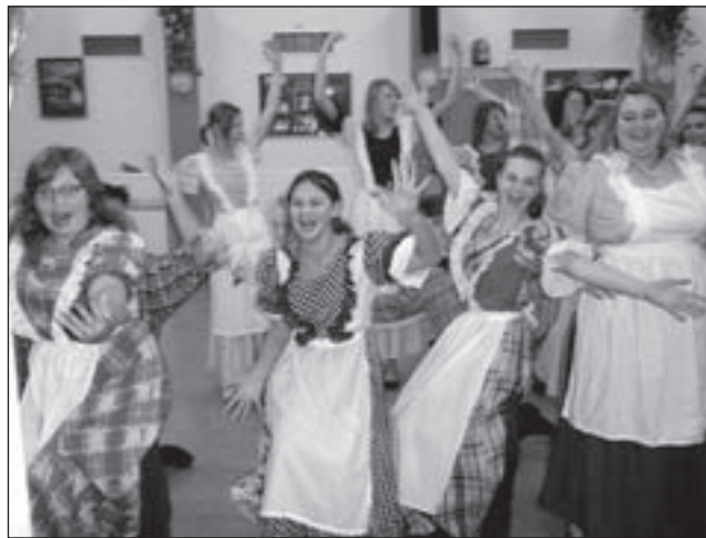
De Jonge Stem is klaar voor de musical Oklahoma