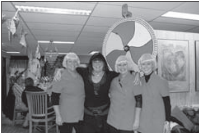
De dames van de studio in Pink Ribbon stijl bij het rad van fortuin