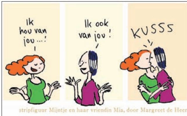
stripfiguur Mijntje en haar vriendin Mia, door Margreet de Heer

Stort u alstublieft zo af en toe wat op de rekening van de Stichting. Kitty en 'haar kinderen' zijn u er zo dankbaar voor. Alle giften zijn fiscaal aftrekbaar.