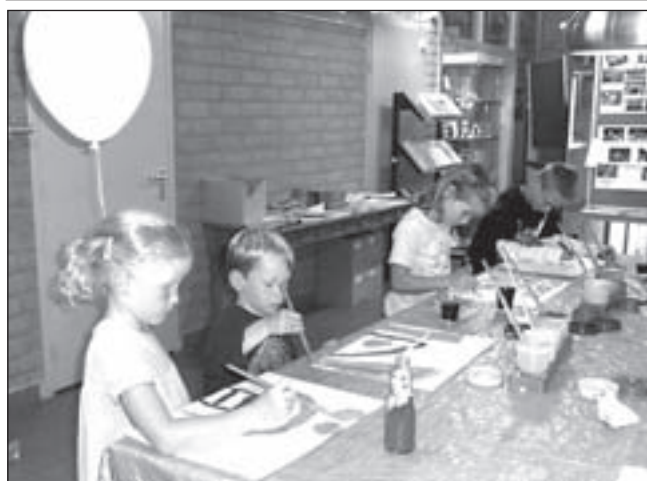
Kinderen aan het schilderen tijdens de open dag van buurtcentrum de Brulboei

De slagboom naar het kleine strand wordt vanaf zondagavond 8 september opengezet, zodat de strandhuisjesbewoners van het kleine strand ook kunnen beginnen aan het opruimen en afvoeren van hun strandhuisjes. Aan het eind van het strandseizoen wordt deze slagboom definitief verwijderd.