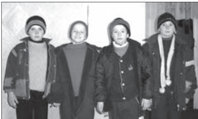
Jongens uit het weeshuis van Leova

dat de woningen niet meer voldeden aan de kwaliteitseisen van deze tijd. Het wijkontwikkelingsplan Velsen-Noord streeft vooral naar verhoging van de kwaliteit van de woningen. AWV Eigen Haard wil hier aan mee werken door een gedeelte van de woningen in Velsen-Noord te slopen en te vervangen door nieuwbouw. Het Architectenbureau Reus en Leeuwenkamp heeft de 11 eengezinswoningen en 17 appartementen ontworpen. In samenwerking met het Bouwfonds en AWV Eigen Haard is de bouw uitgevoerd door de firma Meijer. Maar ook de bewonerscommissie was nauw betrokken bij de totstandkoming van het project. AWV Eigen Haard streeft ernaar om in december 2008 het tweede blok woningen van het project Ladderbeek te slopen en de grond over te dragen aan het Bouwfonds. Het Bouwfonds zal