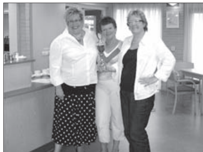
De clubkampioenen van De Kennemers

Wilt u ook deelnemen aan deze gezellige markt? Dan kunt u zich opgeven via telefoonnummer 0255-518380 of 06-42456182.