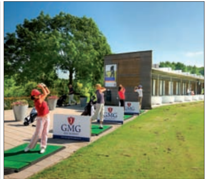
Golfbaan Spaarnwoude is met zijn vele faciliteiten de populairste golfbaan van Nederland

De openingstijden blijven ongewijzigd en Mara Home Decorations blijft telefonisch bereikbaar via 0255-520956.