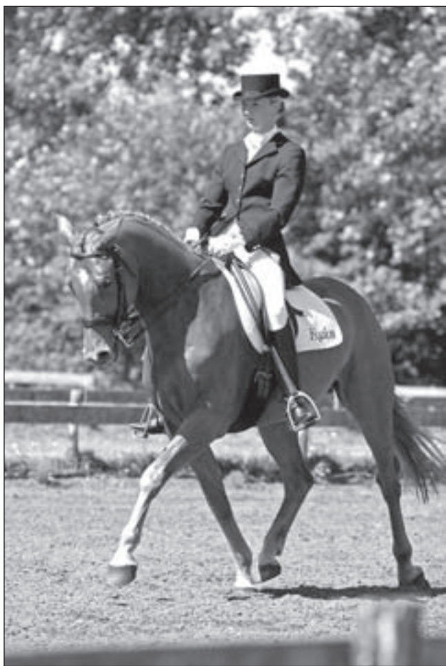
Saskia met Robin Hood