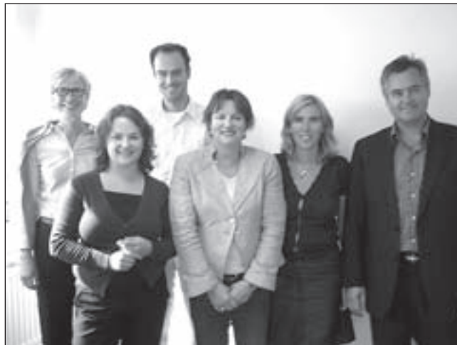
Het team van Parriger & de Heer bestaat uit vijf deskundige medewerkers

bij inlevering van deze bon voor de film SHINE A LIGHT op 12 en 13 september 2008 om 20.30 uur.