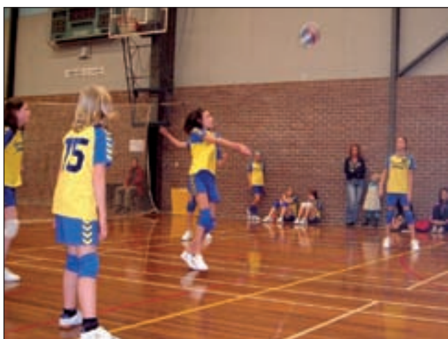
Meisjes C2 aan het werk

Bel voor meer informatie met 0251-205803 of kijk op www.bc-ijmond.nl . U bent van harte welkom om op een dinsdag- of donderdagavond een kijkje te komen nemen. Tot ziens in sporthal IJmuiden-Oost.