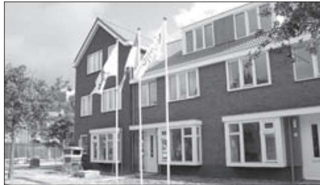
De nieuwbouwwoningen aan de Geelvinkstraat zijn een sieraad voor de buurt

Vrijdag 12 september belooft een spectaculaire dag te worden. De dag wordt begeleid door Arnold Vanderlijde, tweevoudig winnaar van het brons bij het boksen op de Olympische Spelen van 1984 en 1988. Gerard Nijboer heeft in de aanloop van de Zorgmarathon diverse loopclinics gegeven. Hij zal op 12 september het startschot geven en de lopers motiveren. Op www.sdbzorgmarathon.nl staan meer gegevens over deze eerste landelijke Zorgmarathon.