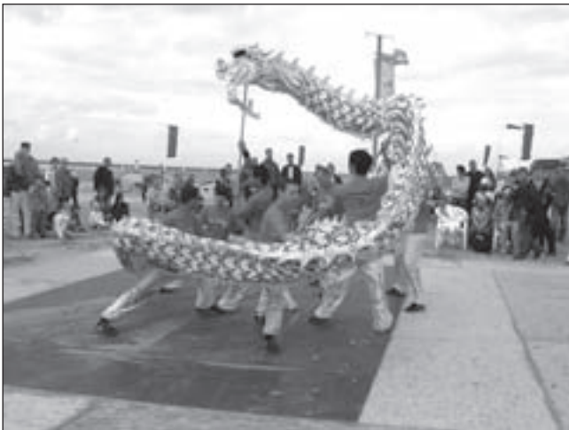
Deelnemers van sportschool Bao Trieu laten een drakendans zien