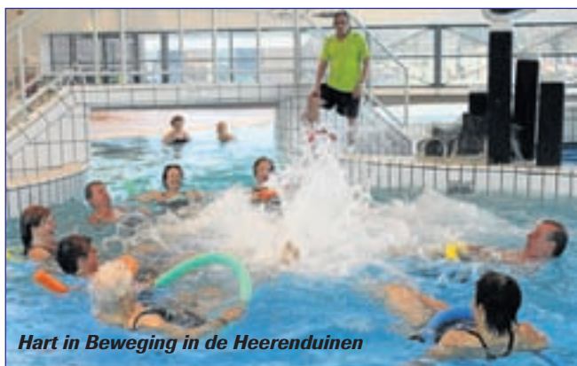
Hart in Beweging in de Heerenduinen

Na de wervelende show in Stadsschouwburg Velsen als afsluiting van het vorige seizoen, gaan de onze danskids ook dit jaar weer hard aan de slag om een mooie show te maken. Ben je tussen de 6 en 16 jaar? Vind je het leuk om te dansen en om onder leiding van de dansdocentes te oefenen voor een show in de stadsschouwburg, kom dan eens langs voor een paar proeflessen. Kijk voor meer informatie, tarieven, lesrooster en adresgegevens, op www.oyama.nu .