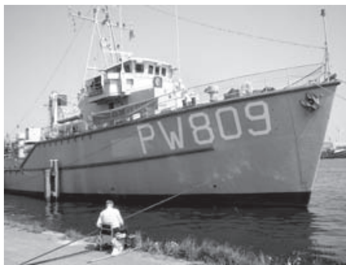
De Naaldwijk tijdens een eerder bezoek aan het Havenfestival

Als je 'gestrekte koers stuurboord' vaart heb je formeel voorrang op grote schepen. Of je gebruik maakt van dat recht moet je beoordelen volgens 'Goed Zeemanschap'. Hoe dat allemaal in elkaar steekt leer je in het kader van het Vaarbewijs. Zie ook www.toplicht.nl.