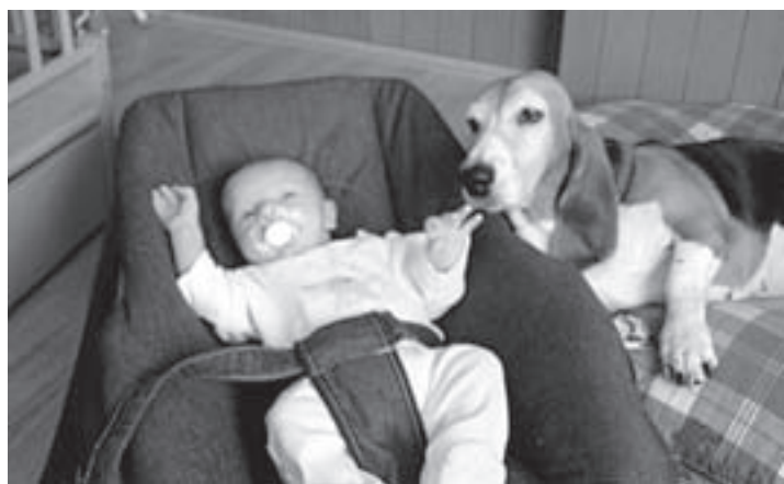
De kleine Dainilo samen met Toulouse