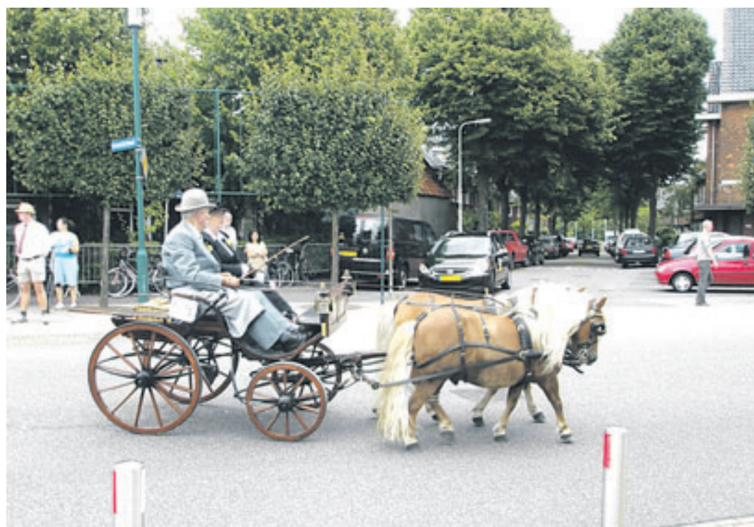
De Shetlandse ponypaardjes Barry en Pascal trekken de Oostenrijkse boodschappenkar, hier passeren zij het Broekbergerplein

IJmuiden aan Zee - Het lijkt voor velen misschien nog ver weg, maar in werkelijkheid is het Havenfestival al heel nabij. Op zaterdag 30 en zondag 31 augustus zal een groots nautisch en cultureel evenement losbarsten op de Havenkade in IJmuiden. Dit jaar is het thema vis. Wilt u gezellig meeëten, varen op de Minerva (zie foto) of mee op rondleiding naar Corus, dan kunt u zich nu al opgeven voor deze betaalde activiteiten. Elders in deze krant vindt u de bijzonderheden.