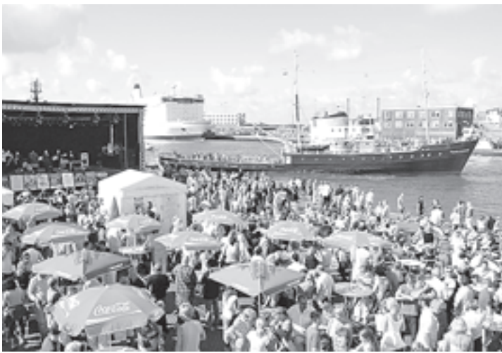
Drukte tijdens het Havenfestival vorig jaar