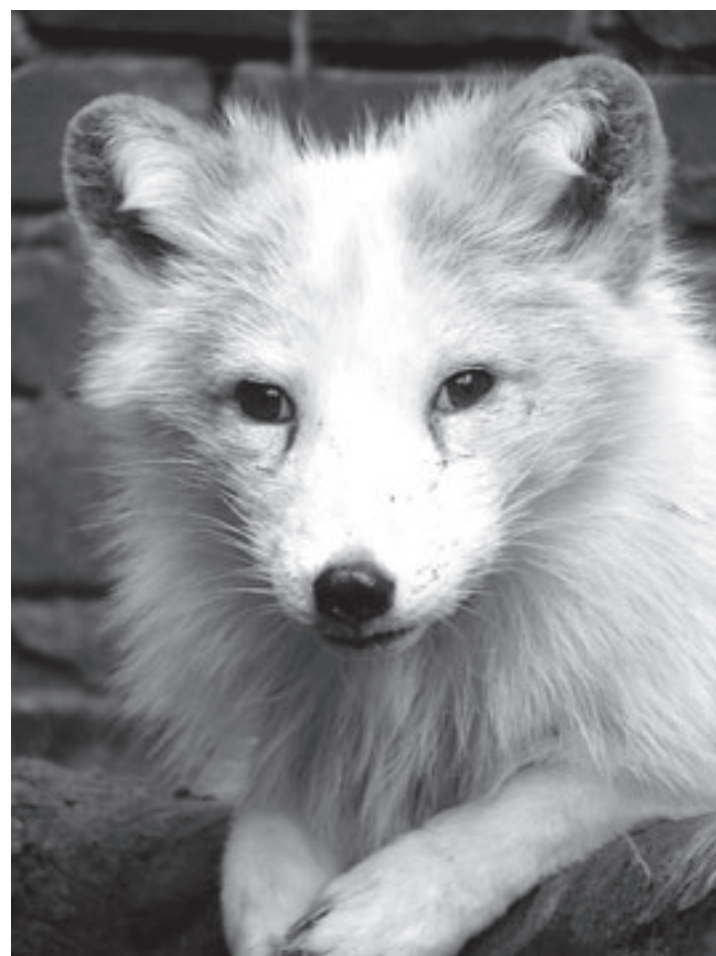
Poolvos Evy krijgt met haar maatje Bart een eigen mini Noordpool

Gelukkig kon met hulp van andere het bootje weer overeind worden getrokken en hoefde de brandweer alleen maar te assisteren bij het bergen van de boot. Bij het ongeval raakte verder niemand gewond.