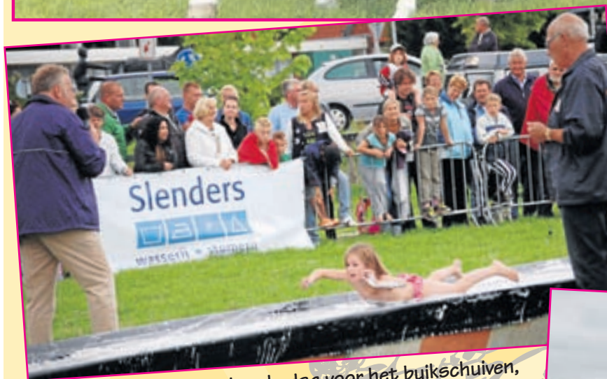
Het was zaterdag een koude dag voor het buikschuiven, toch ging het buikschuiven ook met kippenvel prima

Harry van Kaam, de zanger van Stout, stond zondag heel ondeugend op de bar bij Bartje te zingen