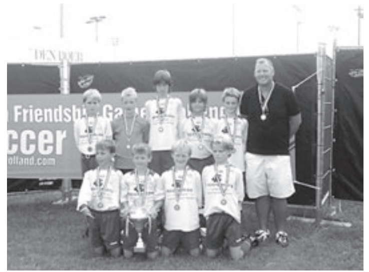
Dit zijn de Super Stars van RKVV Velsen