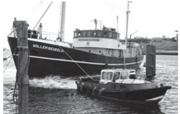
De Willem Beukelsz kwam zaterdag weer terug in IJmuiden

Bij de tentoonstelling worden familiedagen georganiseerd: Kindertheater Grrr speelt de onderwatervoorstelling Zeebeesten (22 juni); biologe Annelies Pierrot verzorgt de kinderlezing Wat leeft er in de diepste oceaan? (24 augustus). Tevens vindt een speciale Diepzee Modeshow plaats waarin kinderen verkleden monnen komen als hun favoriete zeemonster, piraat of zee-meermin (14 september). De tentoonstelling werd voorbereid in samenwerking met NIOZ en Ecomare en komt mede tot stand dankzij Stichting Zabaawas.