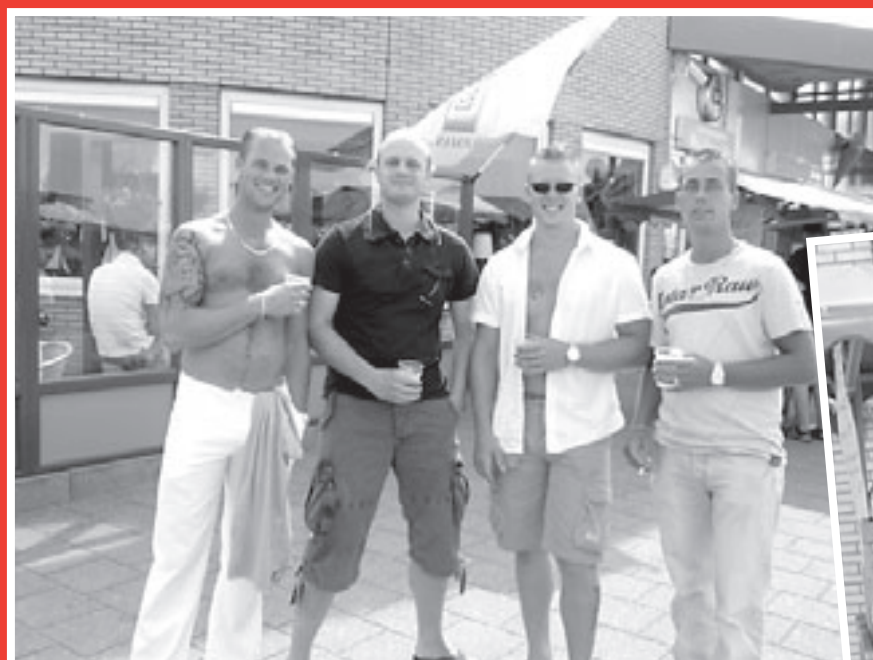
Het biertje smaakt prima!

Die avond barst Het Zandhuis zowat uit zijn voegen, waar de Ruud Jansen Band op swingende wijze traditiegetrouw de week afsluit. Een mooie afsluiting van een geslaagde feestweek. (Carla Zwart)