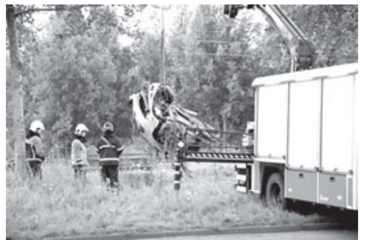
De brokstukken van de auto werden tientallen meters uit elkaar terug gevonden

Om en om zou nu een strafschop genomen moeten worden, de tiende strafschop bracht RKVV Velsen Super Stars de overwinning. Bart Spring in 't Veld scoorde beheerst, toen vervolgens Holland Stars de paal raakte barstte het feest los. RKVV Velsen Super Stars was winnaar van de B-finale E11 Regio Haarlem Cup 2008.