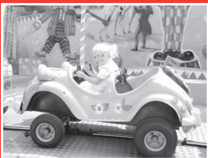
Een ritje in de minicars op de kermis is ook leuk