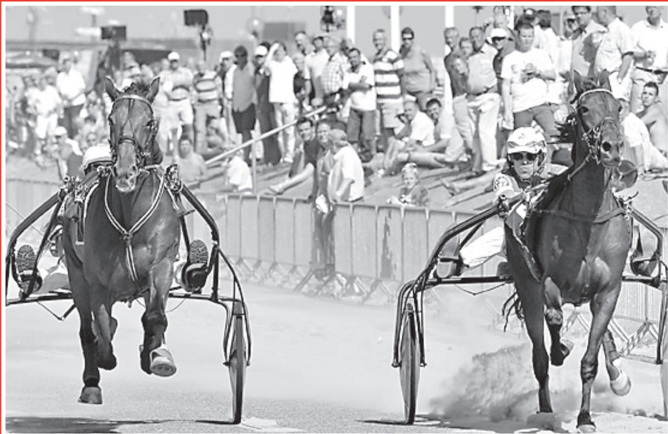
Kortebaandraverij trekt veel bezoekers