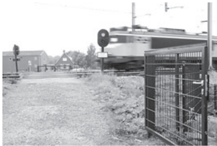
De hek steeds onbewaakte overweg bij de Van Dalenlaan

hun portretten, maar ook voor hun landschappen. Opvallend is, dat ze zich beiden de afgelopen twee jaar hebben laten inspireren door de Ruïne van Brederode te Santpoort. Het is boeiend te ervaren hoe beiden het zogenaamd 'zelfde onderwerp' van alle kanten en onder verschillende omstandigheden hebben gezien, geschilderd en getekend. Beide schilders laten ook hun eigen visie zien bij de portretten van veelal dezelfde portretmodellen. Zie ook www.abdijvanegmond.nl .