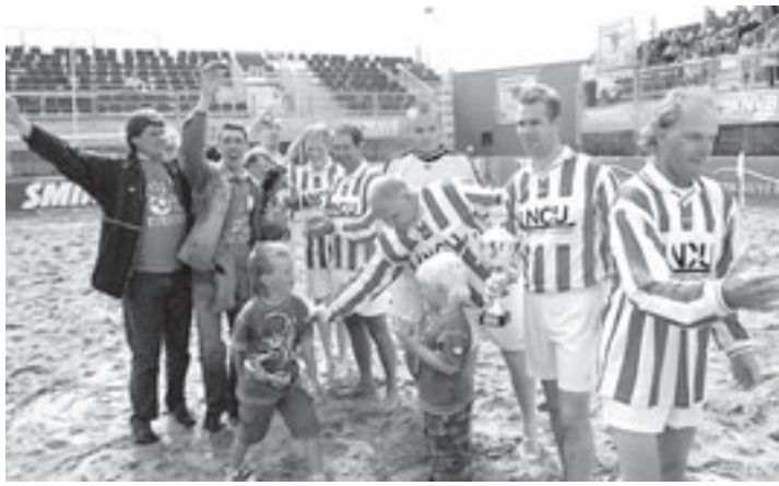
Het winnende G1 team van Waterloo

Tegen 17.00 uur was het winnende team weer terug in Driehuis, waar de hapjes en drankjes al klaar stonden. Maar de voetballers waren erg moe van de zware dag. Daarom wordt er binnenkort nog een groot feest voor de kampioenen gehouden.