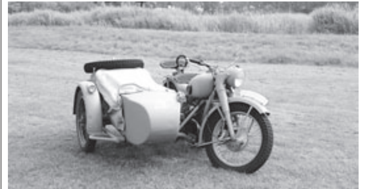
Authentieke voertuigen zijn vaak te bewonderen bij het Bunkermuseum

Per dag kan er gekozen worden uit twee activiteiten. De eerste ronde activiteiten vindt plaats tussen 12.00 en 14.00 uur en de tweede ronde tussen 15.00 en 17.00 uur. De kosten bedragen 2,50 euro per dag en het evenement vindt plaats bij recreatiegebied de Veerplas in Haarlem bij de KPN-toren. Aanvang elke dag: 11.30 uur restaurant Splaza. Summerfun wordt mede mogelijk gemaakt door Jantje Beton, Madurodam Steunfonds, SportSupport en het Recreatieschap Spaarndam. Voor meer informatie: www.sport-support.nl of 023-5260302.