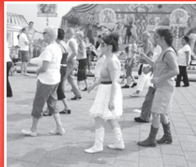
Line dancers in actie.