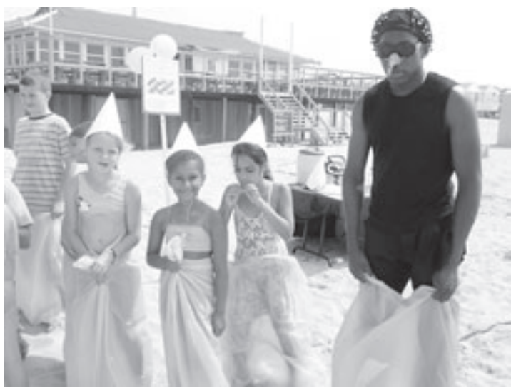
De kinderen staan samen met Dudley (Gargamel) klaar voor het zaklopen