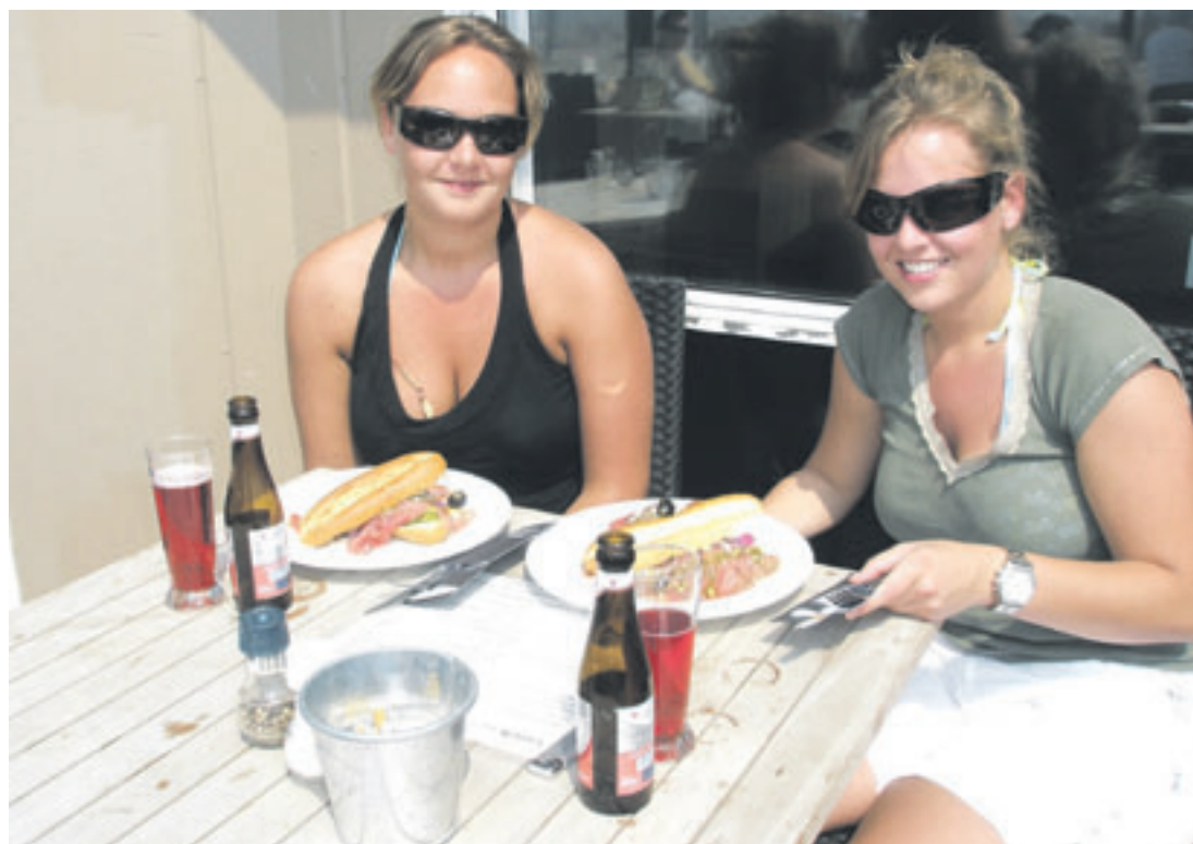
Het is goed uit te houden op het terras van Zilt aan Zee