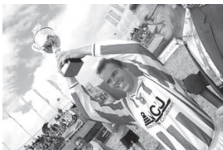
De beker is binnen!