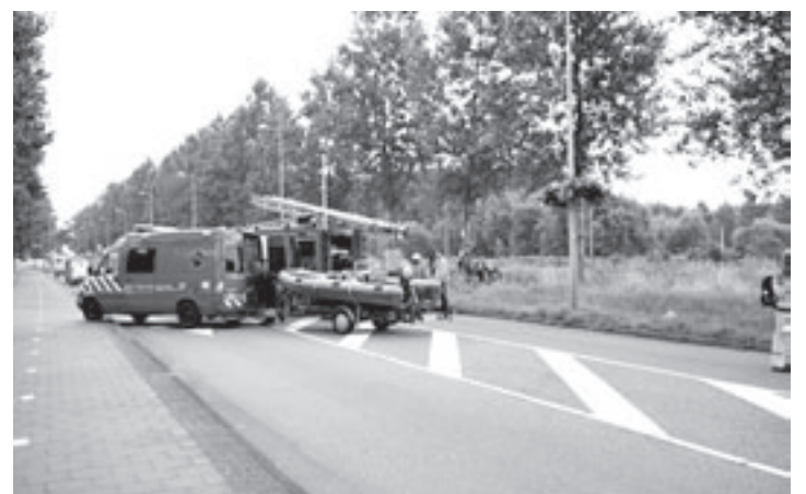
De brandweer zocht naar meer inzittenden

len meters verwijderd van elkaar werden aangetroffen. Aanvankelijk is met behulp van een helikopter een warmtecamera nog gezocht naar een mogelijk derde slachtoffer, maar dit werd niet aangetroffen. De traumahelikopter uit Nijmegen is ter plaatse geweest, maar kon in eerste instantie geen geschikte plek vinden om te landen. Het toestel vloog drie rondjes laag over de naastgelegen woonwijk, waardoor veel bewoners werden opgeschrikt. Uiteindelijk zette de piloot de helikopter aan de grond bij de sportvelden aan de Sint Aagteindijk.