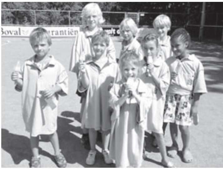
De voetballers van De Blauwe Hyena in hun gesponsorde T-shirts