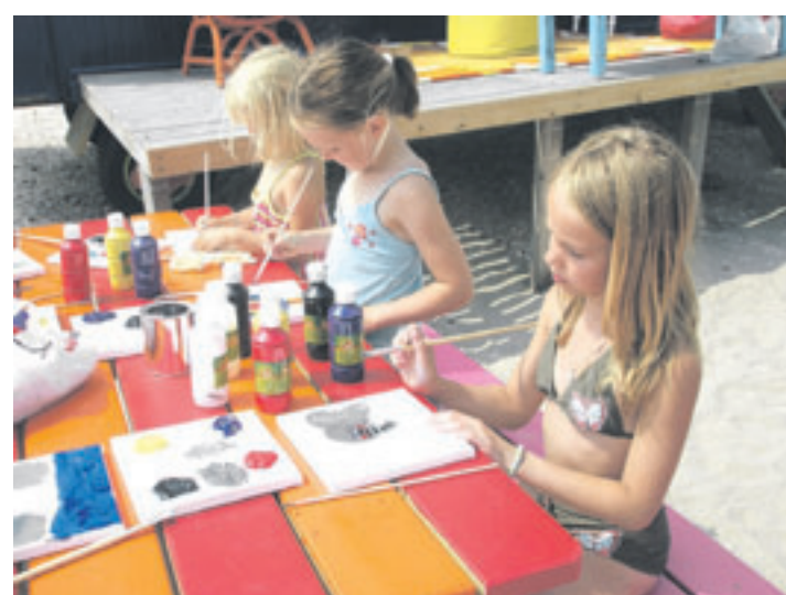
Er worden mooie schilderijen gemaakt bij de strandbieb