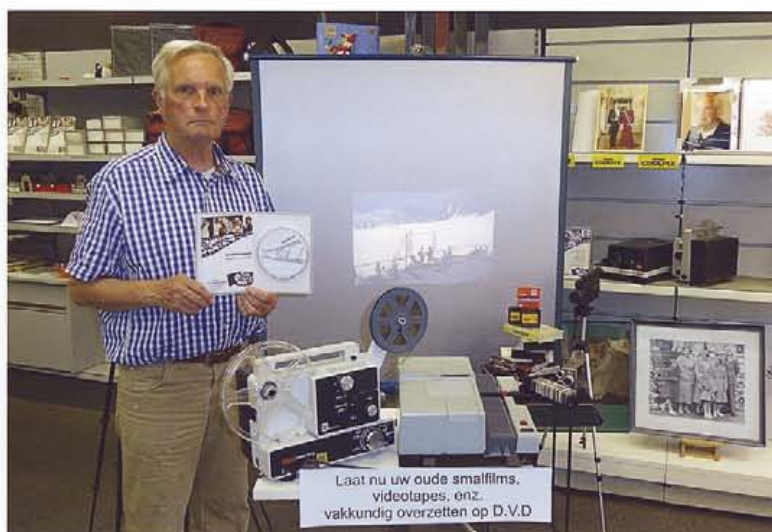
Laat nu uw oude smalfilms, videotapes, enz. vakkundig overzetten op D.V.D

FOTO LOEK ANDERSON KENNEMERLAAN 85-87 IJMUIDEN TEL. 0255-515962 fotoloek.anderson@gmail.com