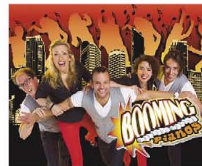
Vanavond Booming Pianos (podium 1).

Kom kijken op onze kraam tijdens de jaarmarkt 19 juli voor onze Biba aanbieding