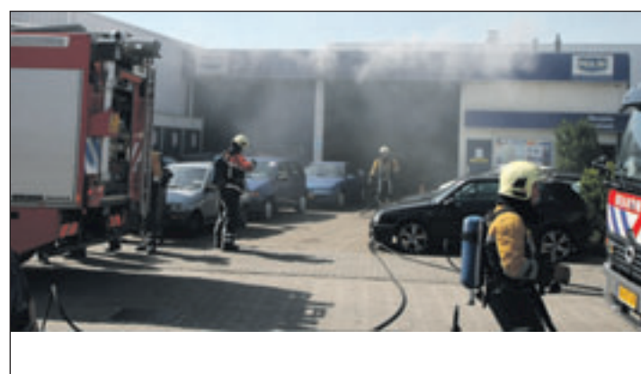
Bij autobedrijf Van der Peijl in Velselbroek ontstond zaterdag brand in de werkplaats

Over de herkomst van de aangetroffen partij kan op dit moment, in het belang van het onderzoek, geen verdere mededeling worden gedaan.