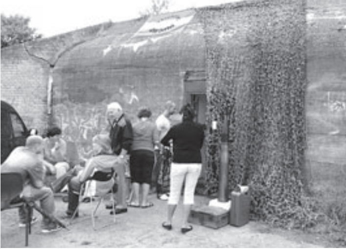
Gezellige drukte bij het Bunkermuseum van Stichting AWMM

maar voor de eerst aankomende is er de 7 van Santpoort-bokaal. Een bokaal uit 1907 die is opgedoken uit de harddraverij-archieven. De starttijden zijn dit jaar gewijzigd. De jeugdloop start om 18.30 uur, de 7 van Santpoort begint om 19.00 uur. Digitaal inschrijven kan vanaf nu via www.inschrijven.nl