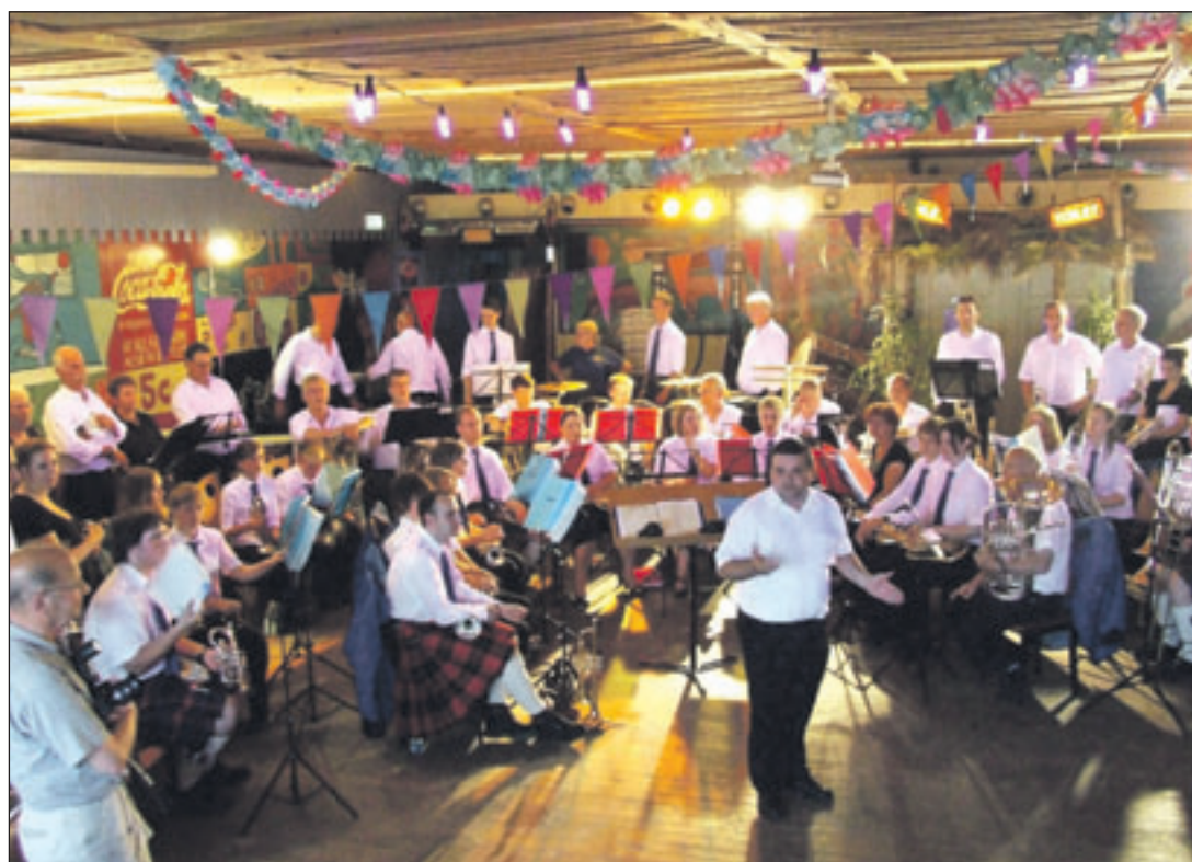
Het concert wordt door beide brassbands gezamenlijk afgesloten

aan de beurt is, zegt ze tegen Captijn: „Doe mij maar een extra pets.” De pastor laat zich dat geen tweede keer zeggen en hij haalt flink uit met de wijwaterkwast. Mevrouw Schoorl schrikt even en duikt in elkaar, maar even later kan ze er hartelijk om lachen. Dan staat er een vrouw tegenover Fons Captijn, zonder fiets of rolator. Hij kijkt haar vragend aan, de vrouw wijst naar beneden: „Mijn voeten. Ik wil mijn voeten laten zegenen, die gaan ook over de weg. Ik ben veel te blij dat ze het nog zo goed doen, ik ben ook geen twintig jaar verder mag gaan.” Met kletsnatte schoenen wandelt de Santpoortse mevrouw de Krom (86) vrolijk verder. (Carla Zwart)