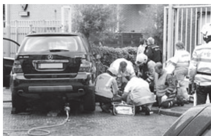
Het slachtoffer wordt bevrijd door de brandweer en daarna overgebracht naar het ziekenhuis