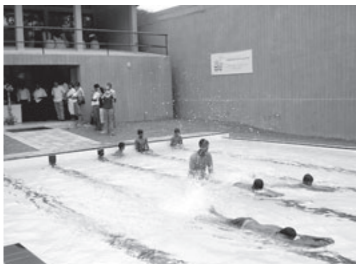
Direct na de opening krijgen de eerste jongeren zwemles. Het is niet ongebruikelijk dat sommige kinderen gekleed te water gaan

roeft iemand vanuit de hut. „Ja”, geeft Marc direct toe. „Maar ik heb die naam op de hut geschilderd.” De hut wordt binnen en buiten geverfd. Op de muren binnen verschijnen in verf een lamp, een boekenkast, een vaas met bloemen en een televisie. „Met plasmascerm”, roept Marnix. De hut is groot, zelfs Marc met zijn geringe lengte van twee meter en vier centimeter kan er rechtop in staan. De overburen hebben een verdieping op hun hut gebouwd, die heet 'Villa'. Daarnaast staat een hut die gedeeltelijk in de grond is gebouwd. De hut is laag, je kunt er alleen in kruipen. Dit bouwwerk heeft wel een hele creatieve naam: 'Chill (H)Out'. Dinsdag waren de hutten net waterdicht gemaakt en die kon meteen getest worden, want er viel een hevige plensbui. Ze hielden het droog. Als laatste is er nog een kleine hut, gemaakt door de jongste deelnemers. „Wij hebben nog geen naam bedacht”, zegt Kaj (10). „Noem ons maar de Hut Zonder Naam.” (Carla Zwart)