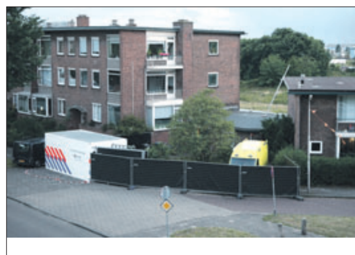
Uit voorzorg wordt de omgeving van de woning afgezet