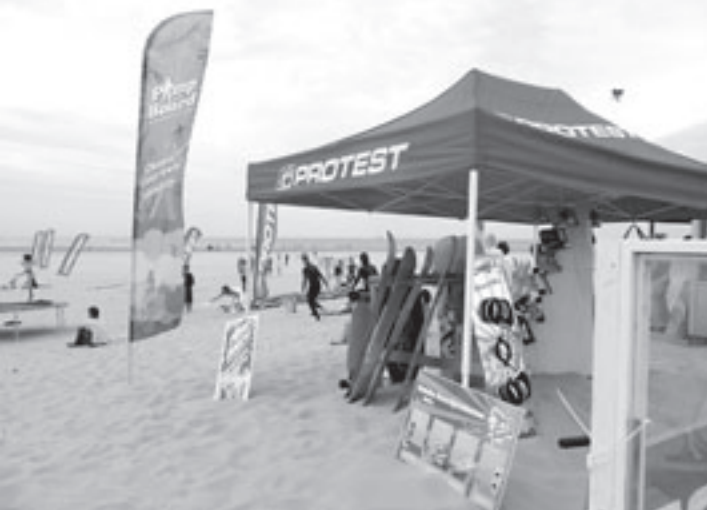
Zo'n honderd sportievelingen kwamen dit weekeinde naar het strand van Velsen-Noord voor een heerlijk surfweekeinde

Engelmunduskerk in Velsen Zuid, Galerie de Gang, het Pieter Vermeulen museum en de Engelmunduskerk in IJmuiden. Er komt ook een splinternieuw lokatieproject ergens in Oud IJmuiden. Kijk voor meer informatie over het programma op www.cultuurweekendvelsen.nl Passes-partout kosten €10,- in de voorverkoop en €12,50 tijdens het Cultuurweekend. Nieuw is het passes-partout voor kinderen: dit kost €5,-. Passes-partout kunnen nu al aangeschaft worden via het digitale bestelformulier van de Stadsschouwburg (zie www.stadsschouwburgvelsen.nl ) Vanaf maandag 1 september worden er passes-partout verkocht op de volgende locaties: de Bibliotheek (tijdens openingstijden), de Stadsschouwburg en het Witte Theater (tijdens kantooruren en voor aanvang van de voorstellingen).