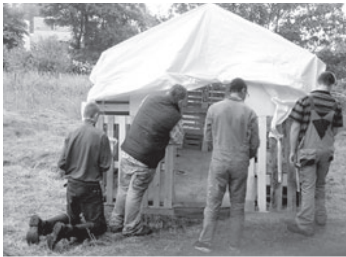
De laatste hand wordt aan 'De Gouden Kooi' gelegd

Filmschuur Haarlem: 19.15: Notes on a Scandal. 19.30: Be Kind Re-wind. 21.15: La noche de los Girasoles. 21.30: Control. Stadsorgelconcert: Internationaal Orgel Improvisatieconcours. Grote of St. Bavokerk, Oude Groenmarkt Haarlem. Aanvang 20.15 uur. Patronaat, Zijlsingel 2 Haarlem: Café: La Vie de Bohème. Aanvang 21.30 uur. Toegang gratis.