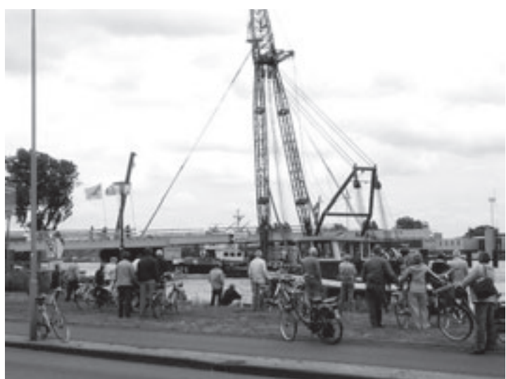
Veel toeschouwers aan het Spaarne tijdens het plaatsen van de eerste liggers van de Schoterbrug

vuilend autoverkeer' gaven zij aan wat hun gerief is tegen deze brug. In een tijd dat het glashelder wordt dat het autoverkeer moet afnemen geeft de gemeente 70 miljoen euro uit aan nieuw asfalt voor betere en snellere verbindingen tussen de A200 en de A208. Hiermee wordt verkeer dat niets in Haarlem te zoeken heeft een sluisroute aangeboden. Prettig voor Amsterdam, dat hiermee een bypass voor de overvolle A9 krijgt, maar slecht voor Haarlem, aldus de actievoerders.