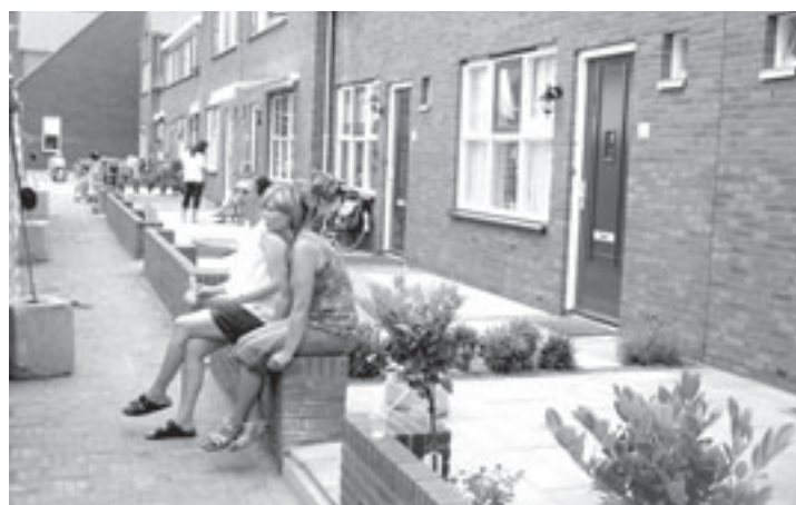
De eerste fase van het nieuwe Rode Dorp is klaar

de rondvaartboot heen. Sympathisant en leden van Milieudefensie ontrollen keer op keer een groot spandoek met de tekst 'Schoterbrug & Oostweg lokken meer vervuillend autoverkeer'. Op de kade is er weinig sympathie voor de actie. „Dach-nu nog kunnen tegenhouden. Die bouw gaat gewoon door hoor.” Een ander vult aan: „Hier bij ons voor de deur raken we de files kwijt dankzij de brug.”