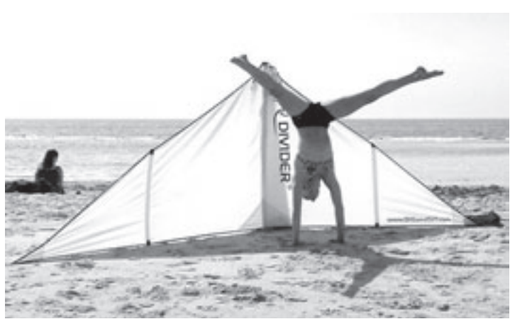
Het unieke Divider windscherm is, net als de Dig&Sit ontworpen door IJMuidenaar