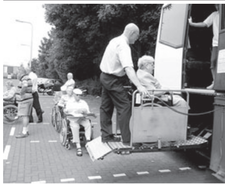
De vakantie-gangers gaan de bus in, op weg naar Helvoirt

Meer over lindyhop op youtube onder Haarlem Swing Night. Zie ook www.lindyhop.nl