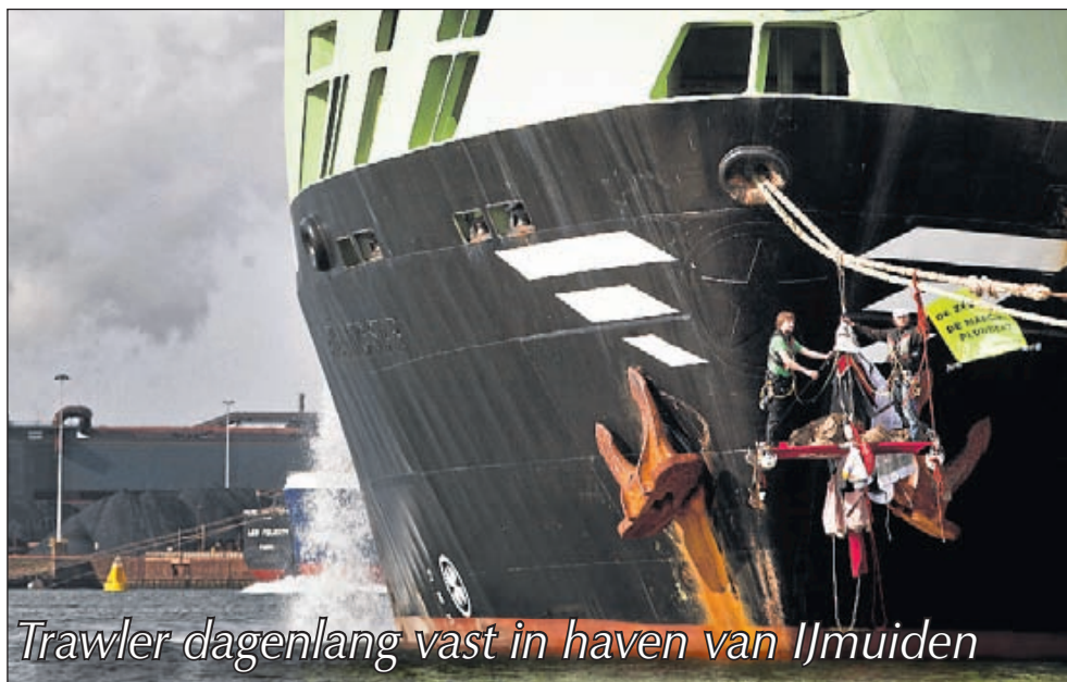
Trawler dagenlang vast in haven van IJmuiden