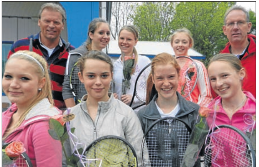
Meidenteams De Gieteling - Voor het derde opeenvolgende jaar zijn de meiden van de Gieteling kampioen in hun klasse geworden. Het eerste team won alle wedstrijden in de eerste klasse meisjes tot en met 14 jaar. Het tweede team versloeg Cromme Bal en werd zodoende de sterkste in de tweede klasse tot en met 14 jaar.