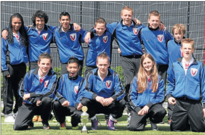
VVH/Velserbroek C1 - Dit leuke gemengde team VVH/Velserbroek C1 is onlangs kampioen geworden in hun klasse. Bravo!