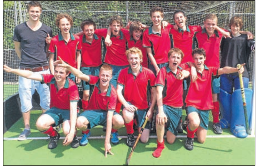
Strawberries Jongens B1 - De Jongens B1 van Strawberries werd op de laatste speeldag kampioen door met overtuigende cijfers te winnen van HBS.