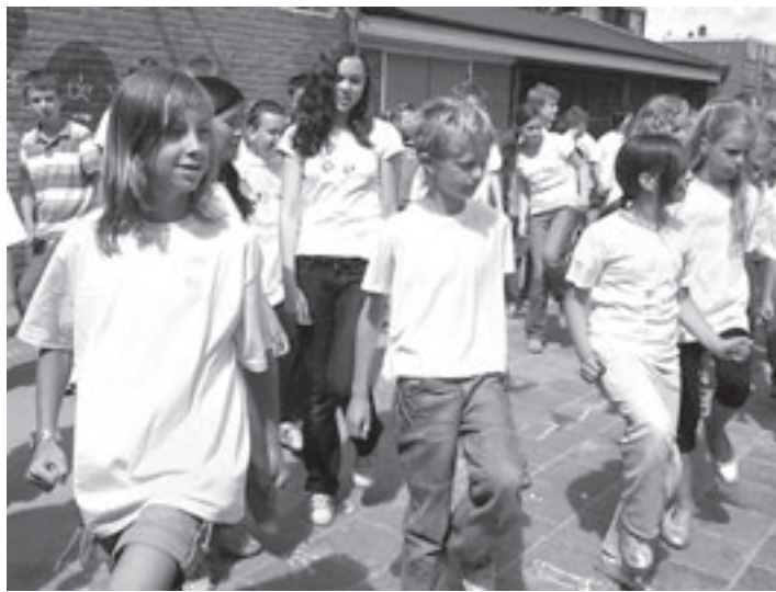
De groepen zeven en acht tijdens hun danspresentatie

te leven met deze handicap. Niemand vindt het prettig een ander een hand te geven die nat is. Dat is voor de ontvanger net zoiets als een natte zoen van een wildvreemde.” De meeste antizweetoperaties worden uitgevoerd voor handen en oksels. Volgens Dur zijn het vooral stewardessen, leraren en mensen die voor hun beroep veel handen schudden die voor de ingreep kiezen. Het Rode Kruis Ziekenhuis doet tien tot vijftien operaties per jaar. Die bestaat uit een kijkoperatie in de borstholte, waarbij enkele centimeters van het autonome zenuwstelsel aan beide kanten wordt weggenomen. „Dit geeft in ieder geval een blijvend resultaat”, aldus de arts.