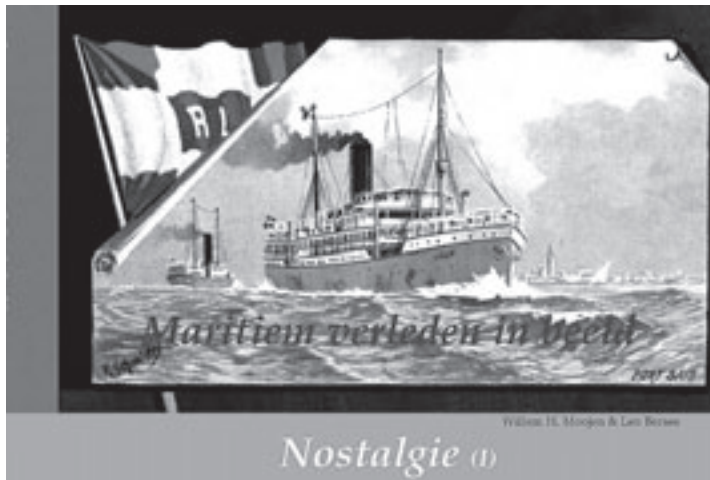
Een prachtig boekwerk van Willem Moojen met gedichten van Leo Bersee

laatste mode, er is een visagist om een echte 'beachlook' te geven en een aantal masseuses zorgen voor de nodige ontspanning. DJ's draaien de dagen aan elkaar en op zaterdagavond organiseert Timboektoe een relaxte 'beachparty'. Protest zorgt ervoor dat alle deelnemers bekapt en bezakt naar huis gaan. Ride On is zowel bedoeld voor mannen als vrouwen. De lessen worden afzonderlijk gegeven, de rest van de activiteiten is gezamenlijk. Deelname aan Ride On kost 85 euro per persoon, dit is inclusief lessen, huur van surfpak en surfplank, BBQ, deelname aan de meeste activiteiten, een T-shirt van Protest en een 'goodiebag'. De dagen beginnen om 10.00 uur, de afsluitende BBQ start rond 17.30 uur. Op zaterdag 5 juli vindt aansluitend een groot feest plaats. Inschrijven kan via www.ridesevents.nl