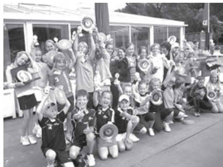
De finalisten op woensdag

De Rabobank is dé stabiele factor in de spaarmarkt. Zij hebben als enige bank in Nederland een triple A-status en daardoor bieden zij veruit de meeste zekerheid. Vroeger, nu en in de toekomst! Rabobank Velsen en Omstreken, het is tijd voor u.