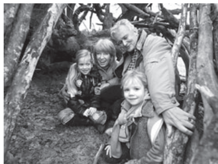
Sparen voor de mooie dingen in het leven

Ben Rietdijk Sport is te bereiken via 023-5384002 of via info@benrietdijksport.nl