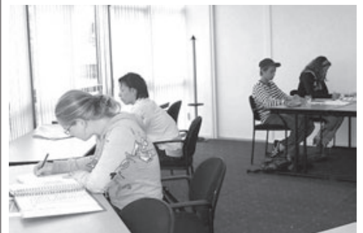
Study Consultancy gaat met examentraining en de combinatie naar sport verder dan alleen huiswerkbegeleiding en bijles

Nieuw bij het Servicepaspoort is het thema 'gezonde voeding tijdens en na de zwangerschap'. Eind augustus kan deze thema-avond bijgewoond worden in Heemstede. Voor meer informatie en/of aanmelding kunt u bellen naar het Servicepaspoort: telefoon 023-8918 440 of ga naar www.servicepaspoort.nl