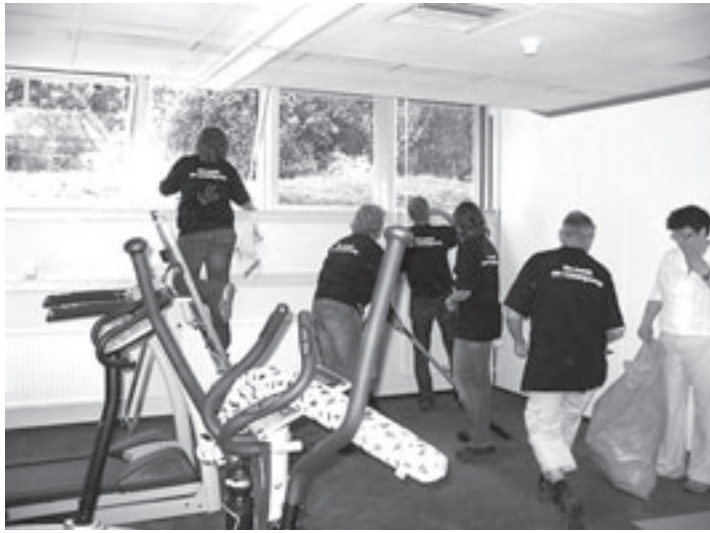
Medewerkers van Corus hebben geen hart van staal, maar van goud. Zij klussen deze weken voor het goede doel met de Hartenactie

Pogingen van FNV Bondgenoten om met Bovag te onderhandelen over een CAO voor tankstations liepen in april op niks uit. Bovag weigerde te praten over meer dan 2 procent loonsverhoging. Vrijdag 27 juni heeft Berghuis opnieuw overleg met BOVAG over een CAO voor tankstations. Tegelijkertijd wordt door werknemers van tankstations die dag actie gevoerd.