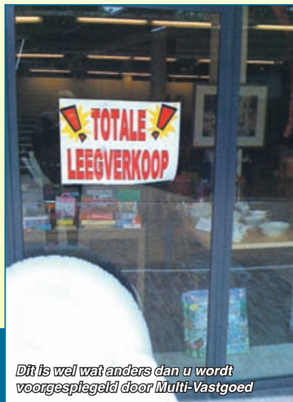
Dit is wel wat anders dan u wordt voorgespiegeld door Multi-Vastgoed

Amicitia ligt in het verlengde van het winkelcentrum, aan de stadsring, 2 zijdig winkels, uitstraling zelfde als IJmuidense plannen.