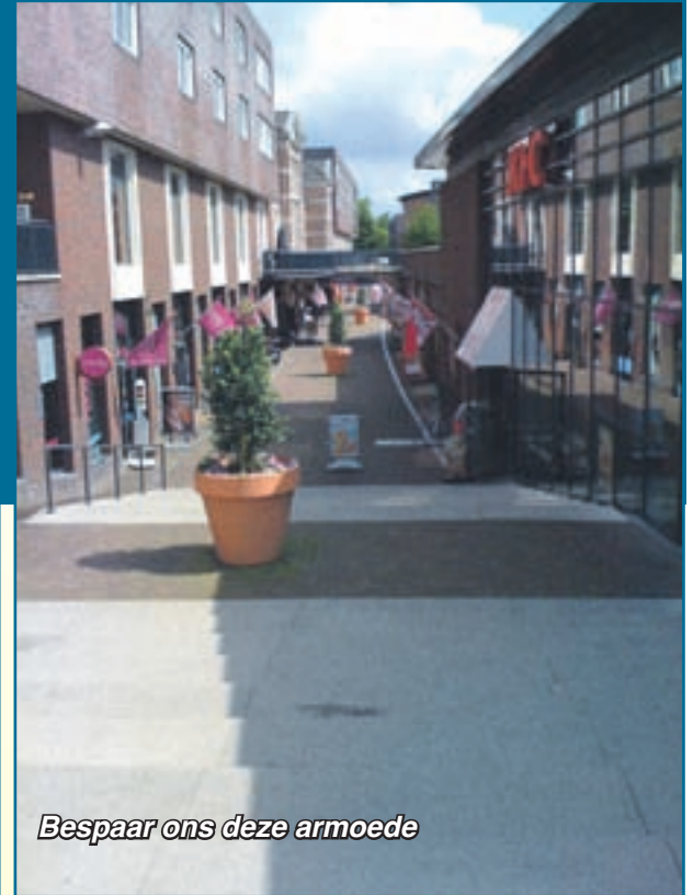
Bespaar ons deze armoede

Resultaat na 10 jaar koopgoot: van de 32 winkels zijn er nu nog slechts 11 over.