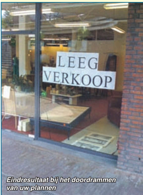
Eindresultaat bij het doordrammen van uw plannen

U bent gewaarschuwd! De komende 10 jaar zullen bijzonder slecht worden voor omzetting in de winkels gezien de vooruitzichten op koopkrachtvermindering en explosieve groei van webwinkels. Het eindresultaat van al uw ongewenste plannen is dus nu te zien in koopgoot Amicitia in Amersfoort.