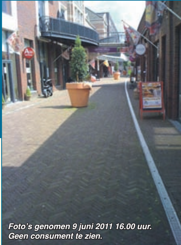
Foto's genomen 9 juni 2011 16.00 uur. Geen consument te zien.

Op 80km afstand van IJmuiden ligt Amersfoort, slechts 1 uurtje autorijden. Daar ligt de enige koopgoot van Nederland die is te vergelijken met de geplande koopgoot in IJmuiden. Rotterdam heeft ook een koopgoot maar dat is appels met peren vergelijken. Feestelijk geopend in 2001 heeft de Amersfoortse koopgoot Amicitia alleen maar ellende gebracht.