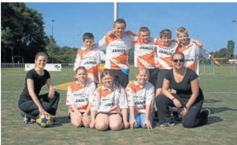
DKV D1 is zaterdag 21 mei veldkampioen korfbal 2011 geworden. Een prachtig resultaat!