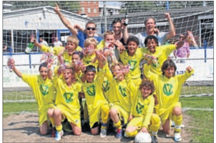
Stormvogels D1 - Zaterdag 7 mei is Stormvogels D1 kampioen geworden van de Hoofdklasse A. Na een loodzwaar seizoen wisten zij de spannende competitie met Vollandam D2 in hun voordeel te beslissen.