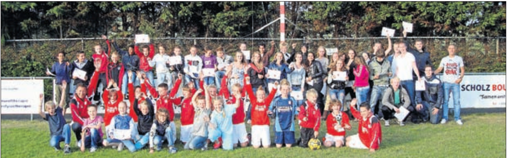
Kampioenenfeest bij VSV - In de kantine van VSV kregen de F3, E-top, D2, MB2 en B1 hun kampioensdiploma. Daarna ging dit hele gezelschap naar het hoofdveld om daar deze foto te laten maken. De avond werd afgesloten met een hapje en een drankje.