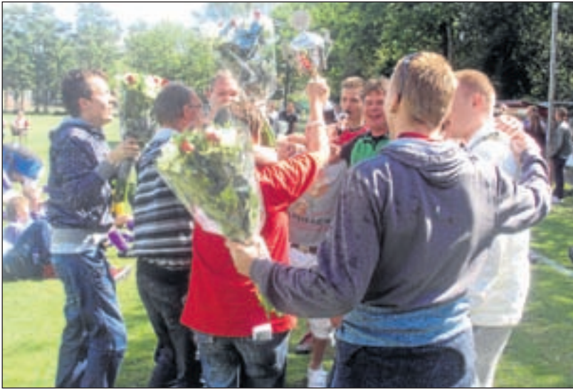
Waterloo G1 - Het eerste van VV Waterloo Gehandicaptten, G1, kampioen geworden. Dat was een groot feest met bloemen en champagne.