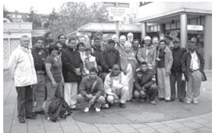
De Srilankanen met hun gastouders op de gedenksteen in de Gallepromenade