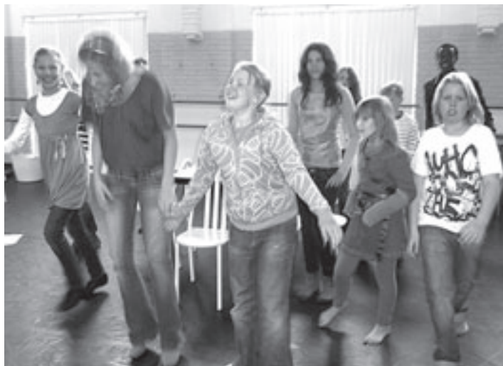
De jongeren van de theaterschool tijdens de openbare repetitie