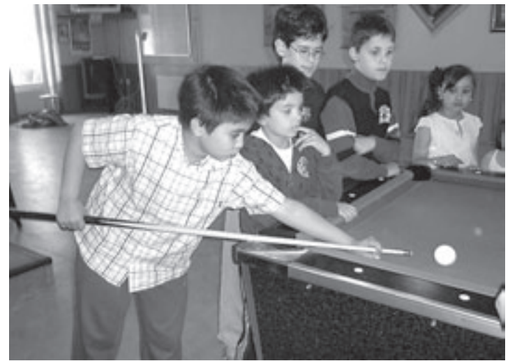
Poolen is ook een sport, het wordt met enthousiasme gespeeld