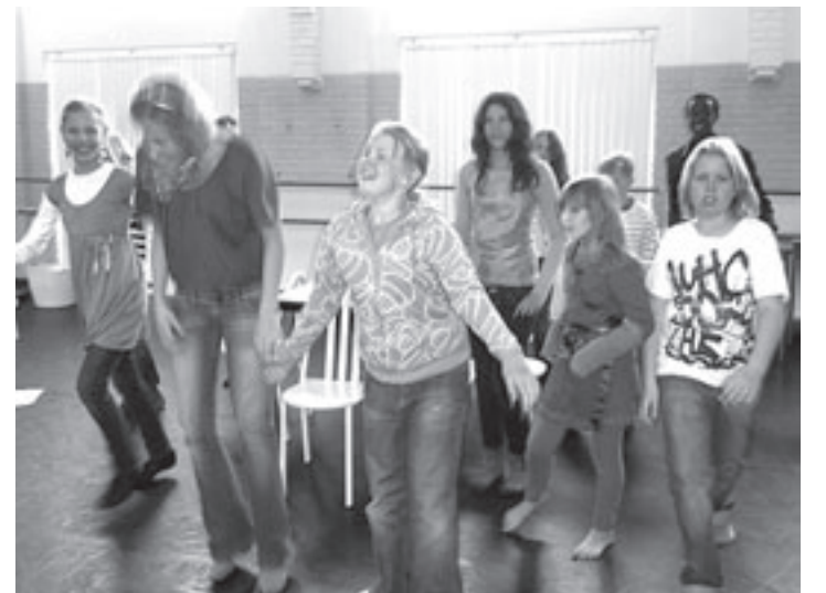
De jongeren van de theaterschool tijdens de openbare repetitie