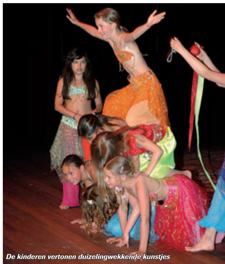
De kinderen vertonen duizelingwekkende kunstjes

Driehuis - Op de Lodewijk van Deijssellaan heeft de politie vrijdag om 16.15 uur een 14-jarige jongen uit IJmuiden aangehouden op verdenking van vernieling. Samen met twee vriendjes had hij geprobeerd een brommobiel te stelen. Die was onafgesloten en de verdachten hadden geprobeerd het contactslot uit te boren. Ook de twee medeverdachten, een 15-jarige jongen uit Driehuis en een 14-jarige jongen uit Velsen-Zuid, zijn aangehouden. Tegen alle drie is proces-verbaal opgemaakt.