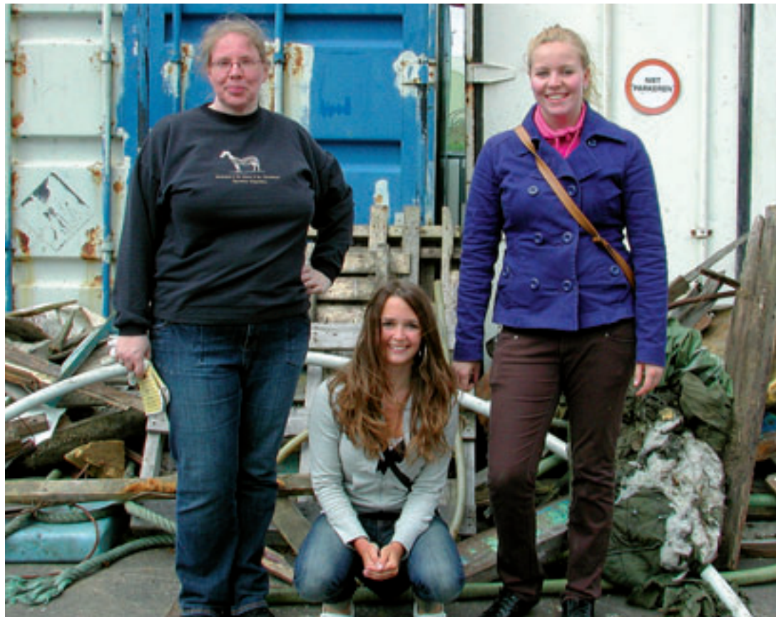
De vrijwilligers en stagiaires van de zwerfkattenstichting waren aan het eind van de dag moe maar zeer voldaan. „We zamelden wel vaker een zak vuil in om weg te gooien, maar dit zet echt zoden aan de dijk!” lachen de meiden tevreden