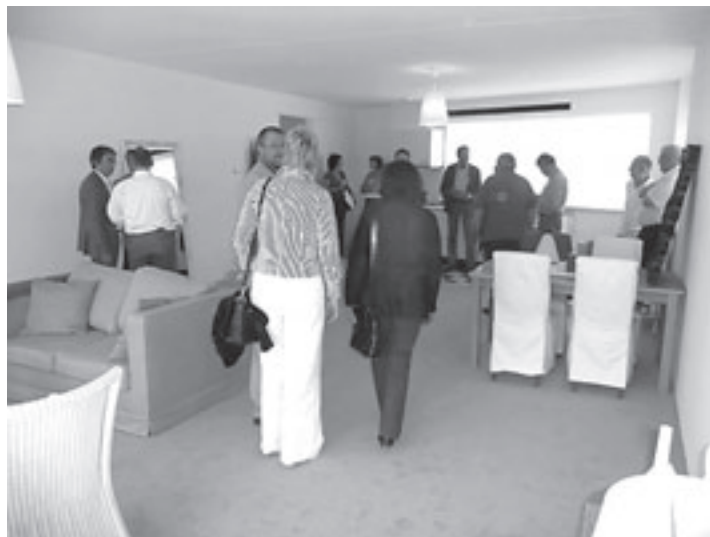
Veel belangstelling voor de fraai ingerichte modelwoning