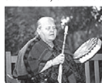
Grandmother Waynaha Two World

Voor opgave en informatie: Centrum Aditi, telefoon 0255-512391. Kijk ook op wish1well@quicknet.nl