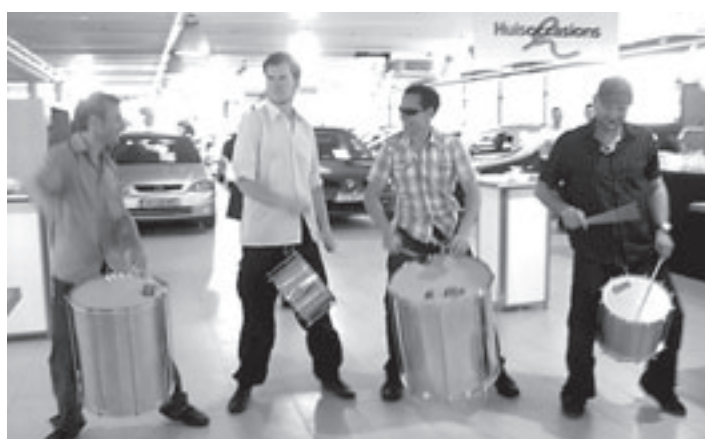
Met veel tamtam kwamen de trommelaars binnen

Velsbroek - Afgelopen zaterdag 10 mei was in het centrum van Velsbroek een speciaal moederdagwinkeltje neergezet. Deze moederdagwinkeltjes staan door het hele land en voor de tweede keer in de Velsbroek. Dit jaar was het wederom een groot succes. In deze speciale winkel konden kinderen voor maximaal vijf euro een leuk cadeautje voor moeder kopen. Ook mochten zij zelf de strikken, lintjes en het cadeaupapier uitzoeken. En als ze niet konden kiezen? Dan mochten ze ze gewoon allemaal! (Daniëlle Mooij)