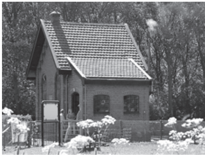
Het gemaal

Haarlem - Zaterdagavond omstreeks 20.35 uur hielden politieagenten op aanwijzing van een getuige twee jongens aan in Haarlem-Noord. Dat waren Haarlemmers van 13 en 14 jaar oud. Zij worden ervan verdacht kort daarvoor op de Spaarnedamseseweg twee zestienjarige meisjes te hebben aangerand. De verdachten zijn voor nader onderzoek ingesloten.