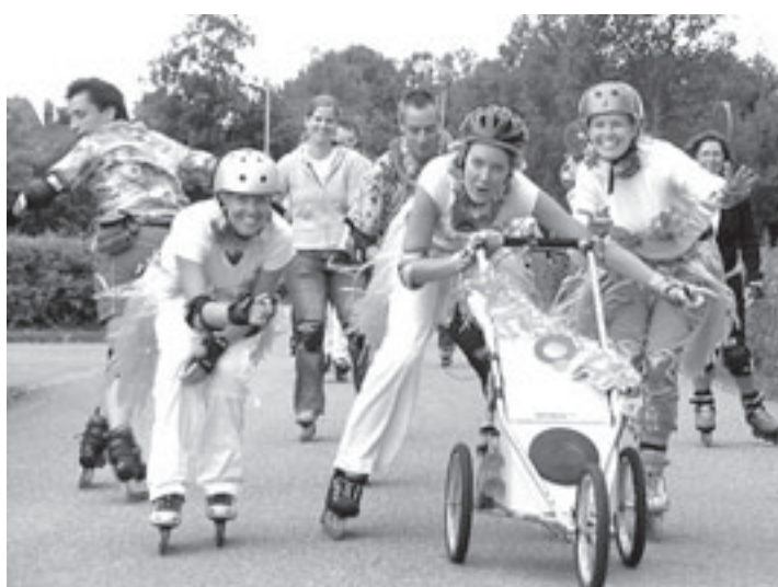
Ondanks het niet al te hoge tempo is de HaarlemNightSkate bedoeld voor gevorderde skaters

bouwplan dat veel geld kost. Een bijdrage ter ondersteuning van de dagelijkse gang van zaken is dus zeer welkom', aldus penningmeester Ton Maks. Het bestuur van VTZ IJmond heeft in april een positief resultaat over 2007 gepresenteerd. Dat is een knappe prestatie omdat de stichting volledig afhankelijk is van subsidies en donaties. De bijdrage wordt gestort in een nieuw op te richten opleidingsfonds van VTZ IJmond. Hieruit zullen de komende jaren de opleidingskosten voor de vrijwilligers worden betaald. Het Bijna Thuis Huis is tijdelijk gevestigd in Velselhoofd in Santpoort-Noord. Het is de bedoeling om in Driehuis een nieuw huis te bouwen. Dat moet eind 2009 gereed zijn.