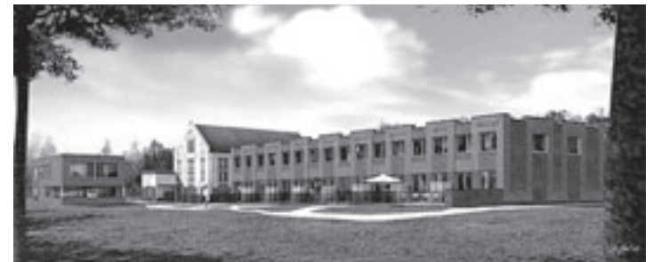
Het Watertorenparck zoals dat er in de toekomst uit gaat zien

Haarlem - Ook deze maand mag de geliefde Retro Deluxe-dansavond natuurlijk niet ontbreken in Patronaat. Zaterdag 17 mei, in supersizevorm, is het plezier nog eens dubbel zo groot! In de grote zaal staan de huis-DJs van Retro Deluxe klaar om je te verwennen met al die vertrouwde hits en natuurlijk de nodige grappen en grullen. Aanvang 23.00 uur, entree 9 euro, leeftijd 18+.