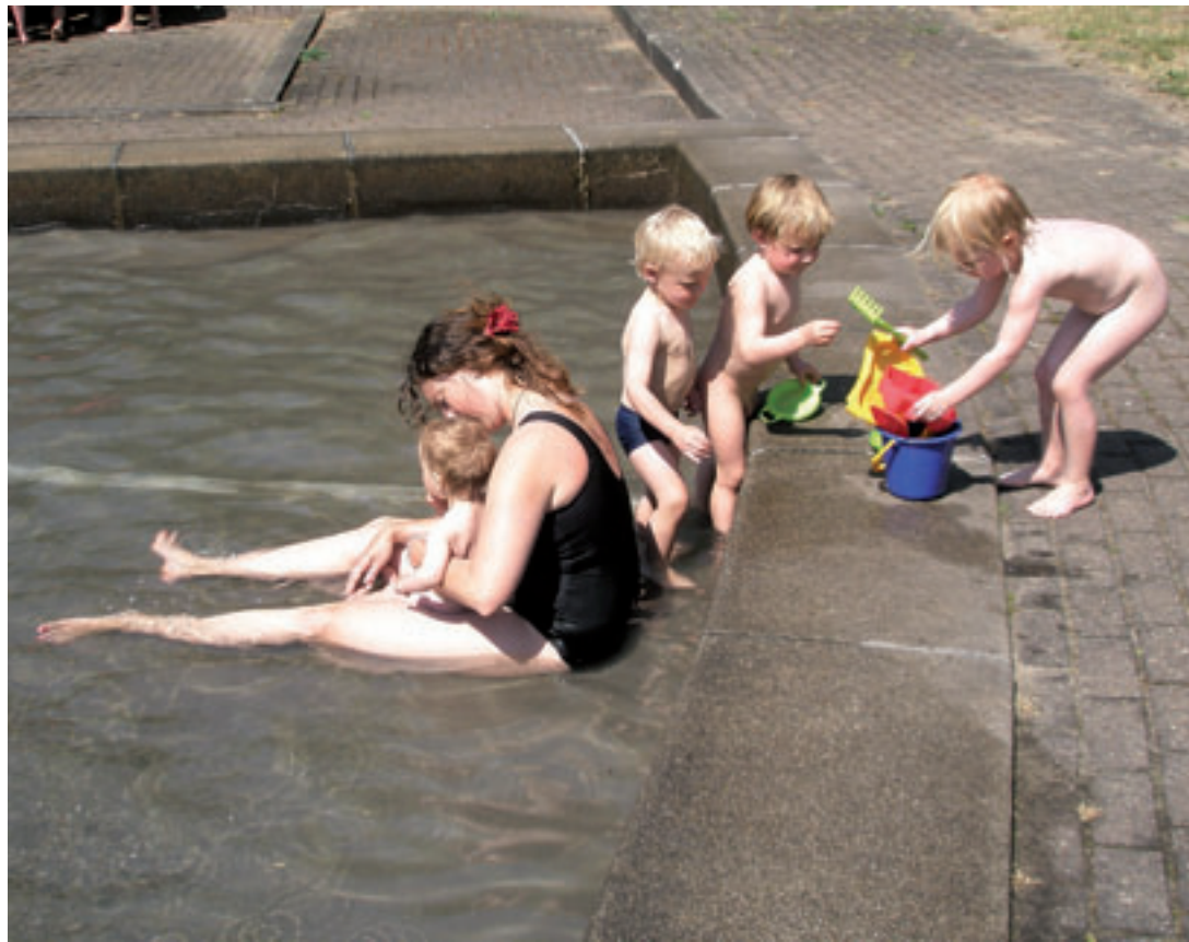
De kleintjes genieten van het water in het pierebadje