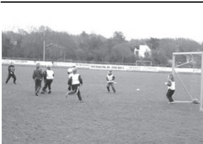
Zaterdag houdt Waterloo voor de jeugd een open dag

Van 9 tot 12 uur spelen teams van de Ark, de Pleiadenschool, het Kompas, de Bosbeek, de Molenweid, de Boekanier en de Jan Campert. 's Middags vanaf 13.00 uur komen de teams van de Hoeksteen, de Duinroos, de Toermalijn, Brederode Dalton, Beekvliet en Vuurtoren Oost in actie. Belangstellenden zijn natuurlijk van harte welkom. Het adres: Sportpark 'De Elta', 2082 XM Santpoort-Zuid. Auto: voor de spoorwegovergang in Santpoort-Zuid linksaf (bordje Terrasvogels) v.d. Bergh van Eysingaplantsoen tot het eind afrijden voor parkeermogelijkheid, daarna circa 50 meter lopen naar ingang complex.