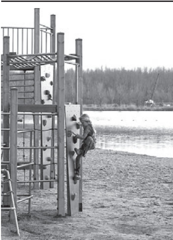
Tijdens de open dag is van alles te doen

Patronaat , Zijlweg 2 Haarlem: Café: Subbaculcha! presenteert Valgeir Sigurdsson. 23.00 uur. Toegang gratis.