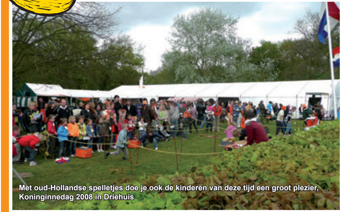
Met oud-Hollandse spelletjes doe je ook de kinderen van deze tijd een groot plezier, Koninginnedag 2008 in Driehuis