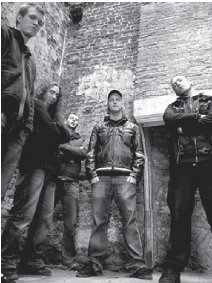
Pound is winnaar van de IJmond Popprijs

Regio - De politie heeft tot zondagochtend 13 drankrijders aangehouden. Drie van hen bleken zo ernstig onder invloed, dat zij direct hun rijbewijs moesten inleveren.