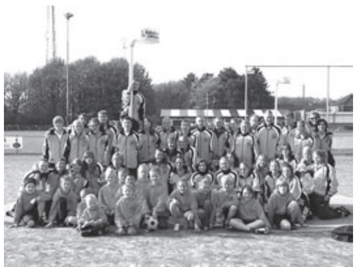
De korfbalsters zien er keurig uit in hun nieuwe outfit

Bereikbaarheid sportpark Groeneveen per trein station Driehuis; bus Haarlem- IJmuiden, lijn 75; auto A22 afslag Santpoort/Driehuis, bij rotonde rechtdoor rijden. Na 200 meter rechts, afslag Groeneveen. Algemeen informatie: www.avsuomi.nl .