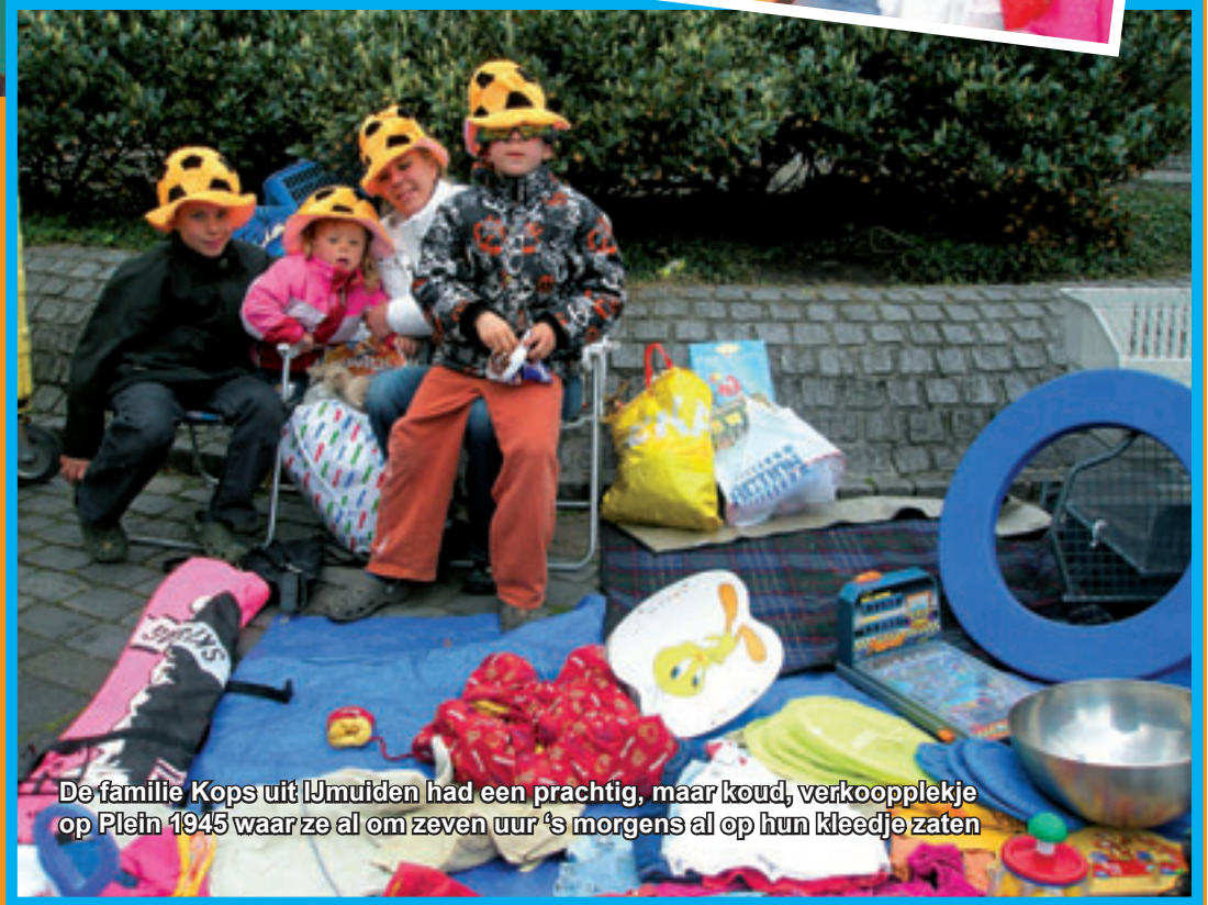
De familie Kops uit IJmuiden had een prachtig, maar koud, verkoopplekje op Plein 1945 waar ze al om zeven uur 's morgens al op hun kleedje zaten