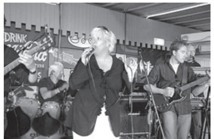
De band Blauw is ook dit jaar weer van de partij

sen en Rob van den Berg, gitaar/zang. De gastvrouwen Lany en Anne verwelkomen de bezoekers met een drankje en een hapje. Diegenen die mee willen spelen of zingen kunnen zich van te voren aanmelden bij tonhelwes@quicknet.nl. Een volledige backline is aanwezig, maar deelnemers dienen wel een eigen instrument mee te nemen.