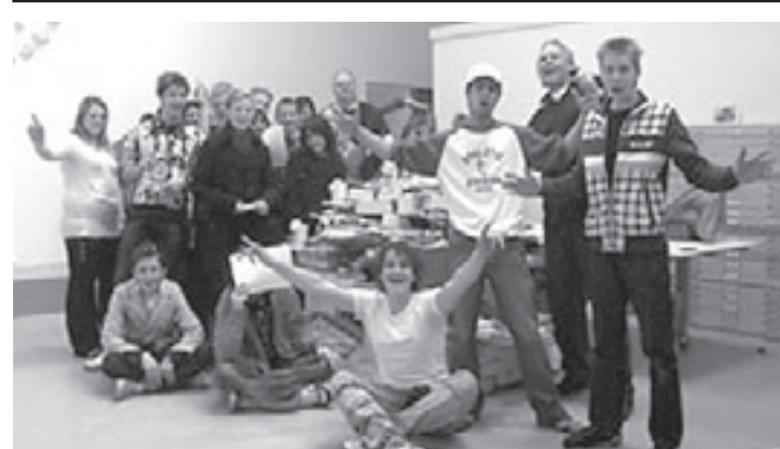
Leerlingen bij het begin van de bouw van de Toren van Babel

De bezoekers krijgen informatie van hulpverleners en van mensen die uit eigen ervaring spreken. Hierna is er gelegenheid om vragen te stellen. Er is een tafel met brochures en andere literatuur om thuis eens rustig na te lezen. Werkgroep Alzheimer Café is overdag bereikbaar onder telefoonnummer 06-33631872.