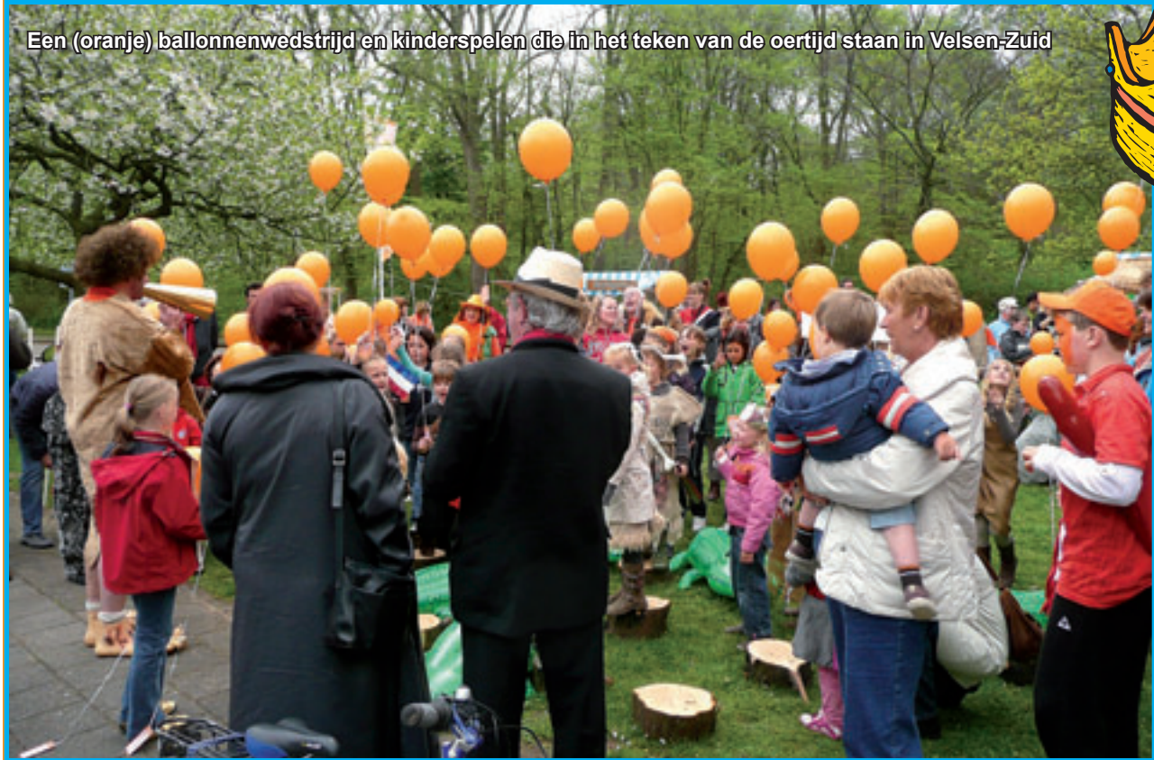
Een (oranje) ballonnenwedstrijd en kinderspelen die in het teken van de oertijd staan in Velsen-Zuid