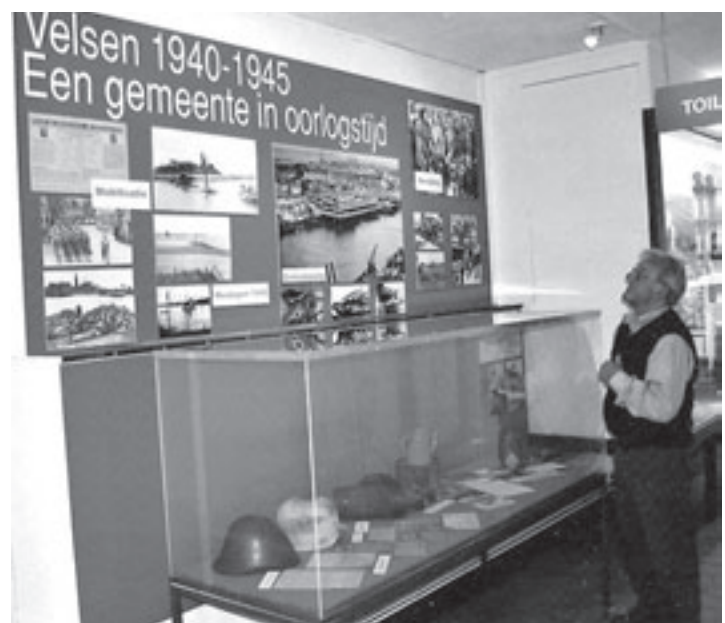
Bijzonder foto's en objecten uit deze turbulente periode van Velsen kunt u thans zien in een kleine expositie die in het IJmuidse Zee- en Havenmuseum is ingericht

De uitvoering van de werkzaamheden kan voor omwonenden enige geluidshinder veroorzaken. Ook het scheepvaartverkeer ondervindt hinder, omdat de meerpalen die een afloopsteiger krijgen tijdelijk buiten gebruik zijn. Rijkswaterstaat heeft zowel omwonenden als de scheepvaart geïnformeerd.