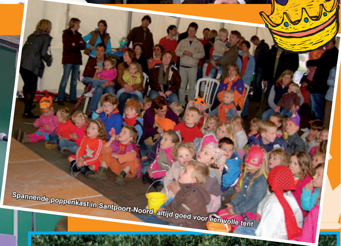
Spannende poppenkast in Santpoort-Noord, altijd goed voor een volle tent