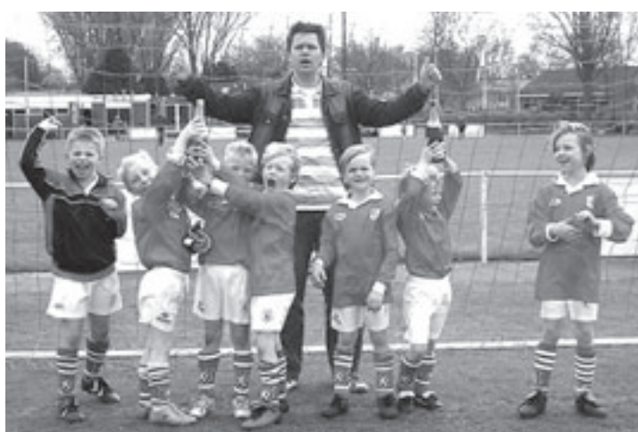
Het trotse team dat kampioen is geworden

Aankomend weekend gaat Akrides in Sporthal 't Vledder in Meppel in de Final Four strijden om het kampioenschap.