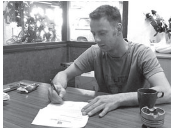
M. Nobels tekent sponsorcontract BC IJmond

Voor vakkundig advies... www.vinkvloeren.nl ASSEDELFT-PURMEREND-HAARLEM