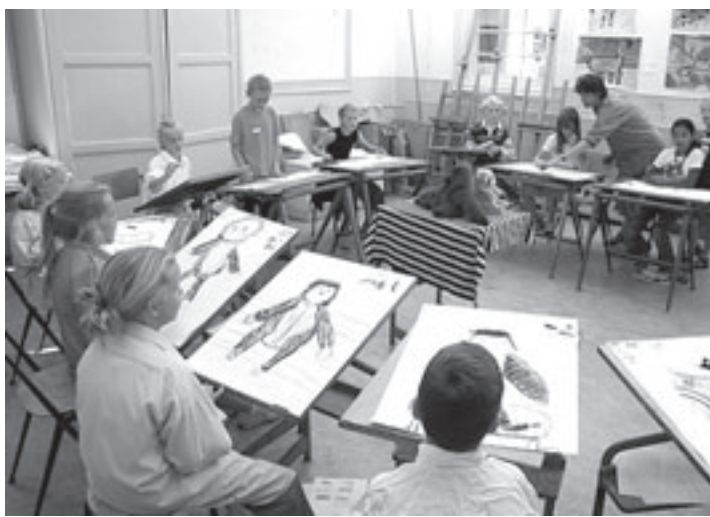
Het Kunstencentrum Velsen is te vinden aan de Troelstraweg 20 in IJmuiden

De Wereldwinkel IJmuiden zit op de hoek van de Lagerstraat/Stolstraat (nabij het Stadhuis) en is elke zaterdag van 10.00 tot 16.00 uur open. De Wereldwinkel in Velsbroek zit in het kerkgebouw 't Kruispunt en is elke eerste, derde en eventueel de vijfde zaterdag van de maand van 10.00 tot 15.00 uur open. Inlichtingen verkrijgbaar via 0255-534967.