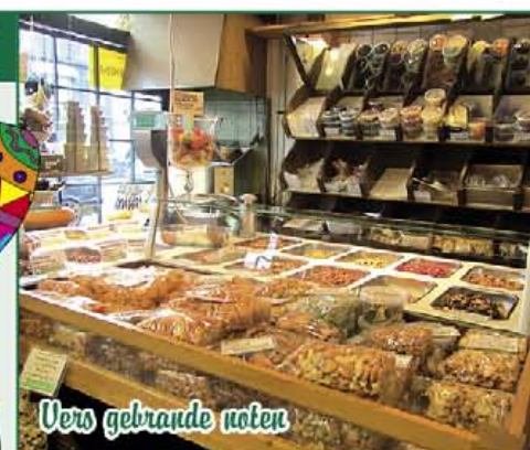
Vers gebrande noten