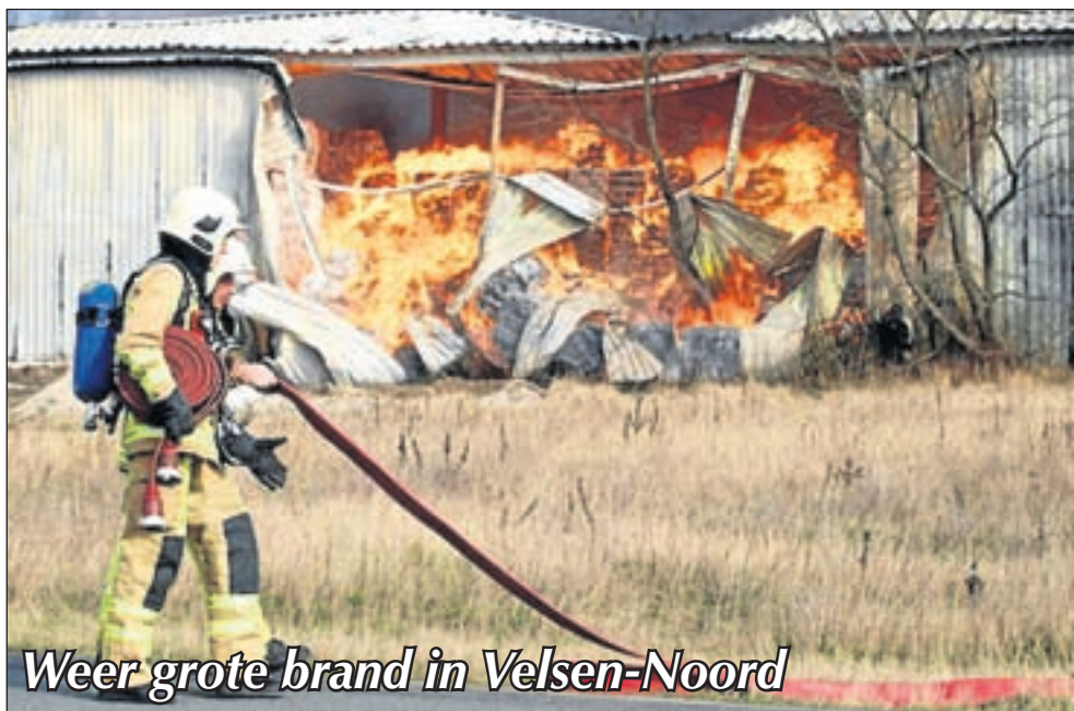
Weer grote brand in Velsen-Noord