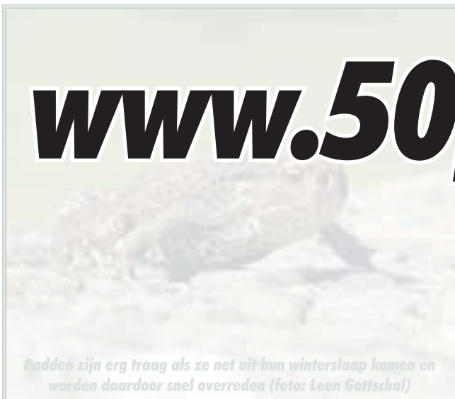
Padden zijn erg traag als ze net uit hun winterslaap komen en worden daardoor snel overreden

Nu het ijs in de sloten is verdwenen, zullen binnenkort de padden de jaarlijks trek naar hun voortplantingswaaier maken. De padden moeten zich vrijmaken van hun winterslaap. Om te voorkomen dat er duizenden worden doodgereden, zijn er in Noord-Holland dertien vrijwilligersgroepen actief. Ondersteund door Landschap Noord-Holland redden de paddenwerkgroepen duizenden levens. Er zijn echter nieuwe vrijwilligers nodig. Kijk op www.padden.nu voor de adressen.