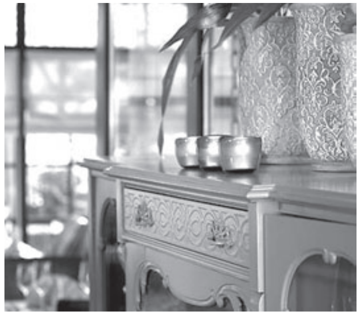
Jacky's Property Development voor al uw woonwensen

tenteams professioneel wordt georganiseerd zijn wij er trots op om tot de groep sponsoren te behoren”. Dit weekend zijn de voorrondes in sporthal het Polderhuis. De eerste wedstrijd begint om 12.30 uur. Publiek is van harte welkom om aan te moedigen! De finale is zaterdag 2 februari vanaf 15.45 uur. De feestavond is ook op zaterdag 2 februari en begint om 21.30 uur met als live muziek "als je voor pret band".