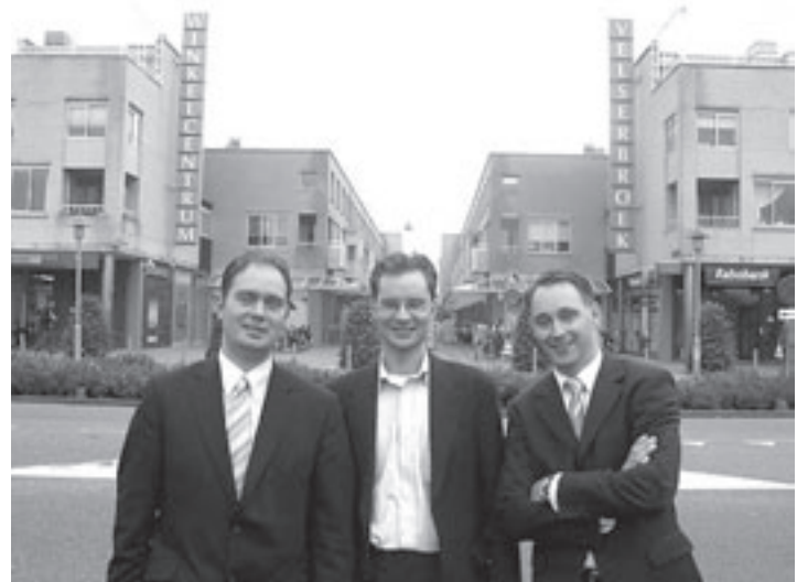
Van Waalwijk van Doorn Makelaars

Negatieve bijeffecten van het niet bewegen door beperkingen kunnen bestreden worden door (hoe moeilijk het ook is) de knop om te draaien en op eigen niveau te gaan 'Nordicken'. Juist voor mensen met een beperking is rustig bewegen een must. In groepsverband is de motivatie om te bewegen groter. Voor aanmelding aan het bewegingsproject Beweeg...Mee...!!!: 0229-239447 of e-mail naar: info@sportwandelschool.nl. Zie ook www.nordicwalkingschool