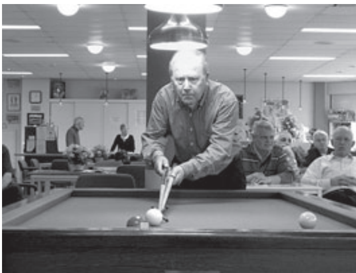
De finalisten van het Nieuwjaarstoernooi van De Hofstede zijn bekend