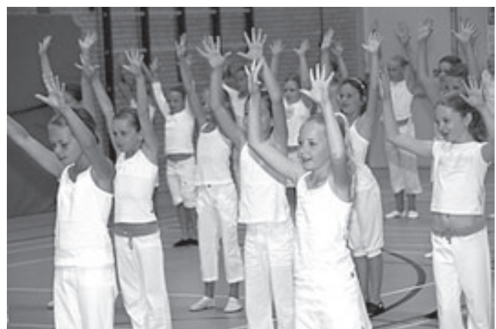
De meiden van Oyama staan al te trappelen om in de Stadsschouwburg te mogen optreden

Ook aan de jongste jeugd is gedacht tijdens de voorrondes. Zoals elk jaar zijn er kinderactiviteiten. Op zaterdag 26 januari is een schminkteam aanwezig. Ook kan er geknutseld worden. Er is ook een filmhoek ingericht. Zondag 27 januari zal Roy van Buuringen de jeugd vermaken met een verassend programma. Velsersbroek is op zoek naar het hooghoudtalent 2008. Iedereen uit Velsersbroek, jong of oud, mag zich aanmelden om twee pogingen te doen om voetbal-jongleerkampioen van Velsersbroek te worden. Gedurende een minuut zoveel mogelijk de bal met de voet hooghouden en het liefst met spectaculaire bewegingen. Dit alles wordt ook tijdens de voorrondes met muziek ondersteund. Ga de uitdaging niet uit de weg en meldt je aan. De zes beste voetbaljongleers uit de voorrondes gaan door naar de finaleavond op 2 februari waar uitgemaakt wordt wie zich Hooghoudkampioen 2008 mag noemen, gadeslagen door honderden toeschouwers. Tijdens het straten voetbaltoernooi op 26 en 27 januari worden om 14.00 en 16.00 uur de voorrondes georganiseerd in de speciaal ingerichte 'Rabobank Hooghoud-arena' van het Polderhuis. Inschrijving op de dag zelf in het Polderhuis. Komend weekeinde is er dus genoeg te doen in het polderhuis voor jong en oud.