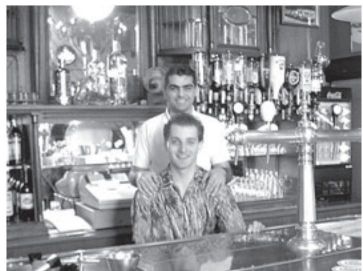
Ook voor een hapje tussen de middag kunt u terecht bij café Montfoort

Er is rekening gehouden de nieuwe voorschriften van de KNVB waarin onder andere de verplichtingen van de betaaldvoetbalorganisaties zijn opgenomen.