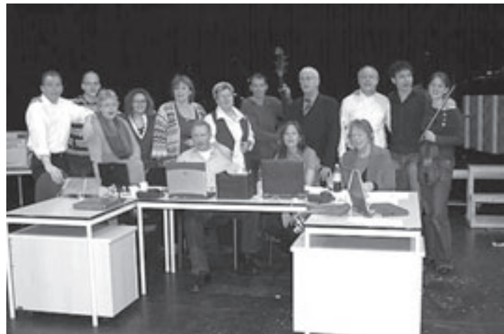
De hele cast van Plug-In