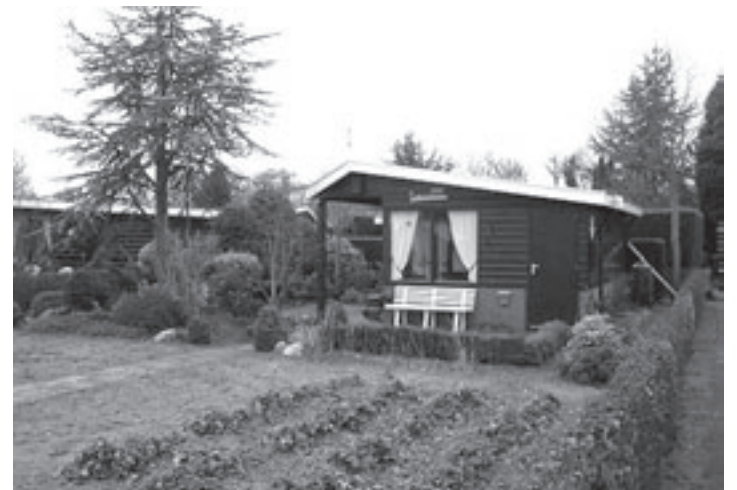
De volkstuinten op De Hofgeest liggen er fraai bij