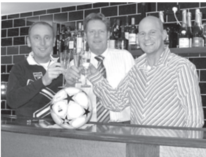
Heel Velsersbroek houdt de adem in, dit weekeinde gaat het Rabobank straten-toernooi van start