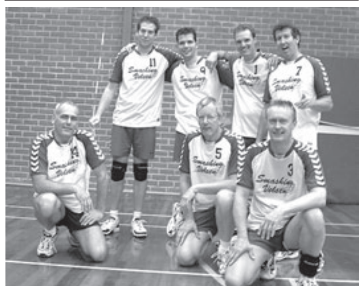
Smashing Velsen heren 2

IJmuiden - De D1-selectie van Velsen is door het nieuwe hypotheekkantoor in hartje Santpoort-Noord, Steengoed Hypotheken, van nieuwe trainingspakken voorzien. Trots als een pauw lopen de spelers van de D1 voor en na hun wedstrijden met het nieuwe trainingspak. Hoe kan dat ook anders, met 'steengoed' op je rug. Op de foto poseert het team trots voor de opvallende pui van Steengoed Hypotheken aan de Broekbergenlaan.