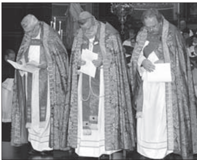
Bisschop Jos Punt te midden van St.-Nicolaaspastoor Joop Stam (links) en de Amsterdamse deken Ambro Bakker

Klanten van PWN en het publiek worden via een speciale jubileumlogo op het jubileum attent gemaakt. Het logo wordt gebruikt bij allerlei te organiseren publieksevenementen, tijdens sportevenementen die PWN sponsort en op alle publicaties van PWN. Het (voorlopige) jubileumprogramma is te vinden op www.pwn.nl/jubileum . Er worden gedurende 2009 nog meer evenementen uitgewerkt.