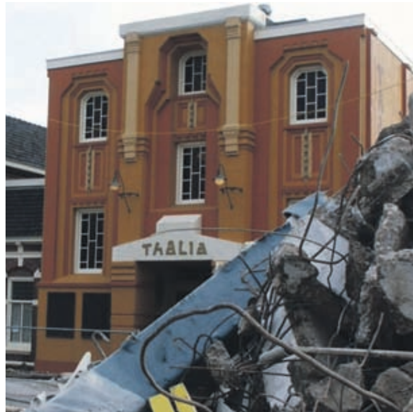
Sloopwerkzaamheden met op de achtergrond Thaliatheater

De sloop van de panden gelegen tussen de Prins Hendrikstaat, Jagerstraat, Breesaapstraat en de Visseringstraat is al in volle gang. De sloop van het pand waar voorheen Rolvink Bouw was gevestigd, is in november vorig jaar afgerond. Het streven is bovengenoemde sloopwerkzaamheden voor de zomervakantie achter de rug te hebben. Tijdens de sloopwerkzaamheden van de panden zijn een aantal keren trillingen waargenomen door de inzet van een te zware sloopmachine. Afgesproken is met het sloopbedrijf de machine te verwijderen van het terrein en