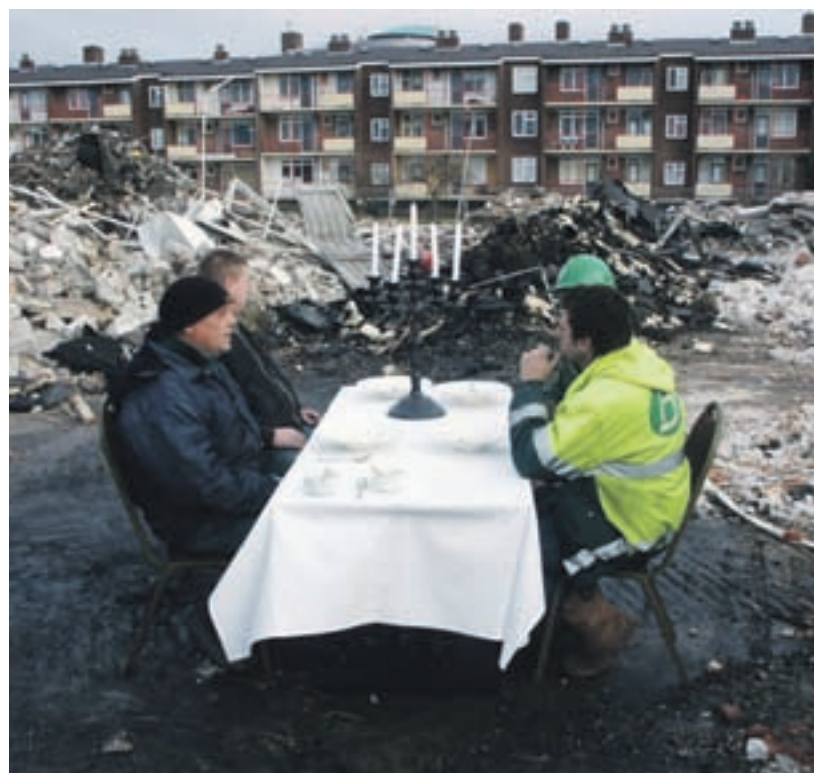
Slopers genieten van een heerlijk bord soep geserveerd door Hotel Restaurant Augusta

Alle partijen werken gestaag aan de herontwikkeling van Oud-IJmuiden. De mooie oude bebouwing en de kleinschaligheid maken Oud-IJmuiden tot een zeer aantrekkelijke omgeving waar wonen, werken en recreëren straks samen gaan. Wonen in Oud-IJmuiden wordt modern leven op historische grond. Met de haven, het water en de boten op steenworp afstand. Met die gedachte in het achterhoofd is er gezocht naar namen voor de nieuwe gebouwen in dit deel van IJmuiden. Het is dan ook niet verwonderlijk dat we uitkwamen op namen van historische boten. Zodra de nieuwbouw begint komt u onder andere de volgende namen tegen op de website, in de krant en in de verschillende brochures: De Doorbraeck, De Zuydvaerder, De Bestevaer, De Brandaen en De Schollevaer. De betrokken partijen gebruiken de namen om hun projecten bij kopers en huurders onder de aandacht te brengen. Of de gebouwen in de toekomst ook deze naam zullen houden, is nog niet bekend.