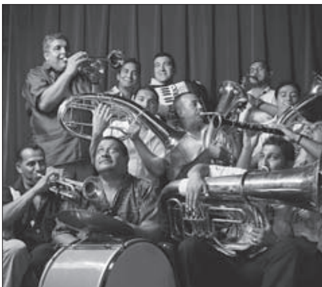
Kocani Orkestar uit Macedonië

De naamswijziging is niet uniek voor Nederland. Eerder wijzigde het bisdom Groningen zijn naam in Groningen-Leeuwarden.