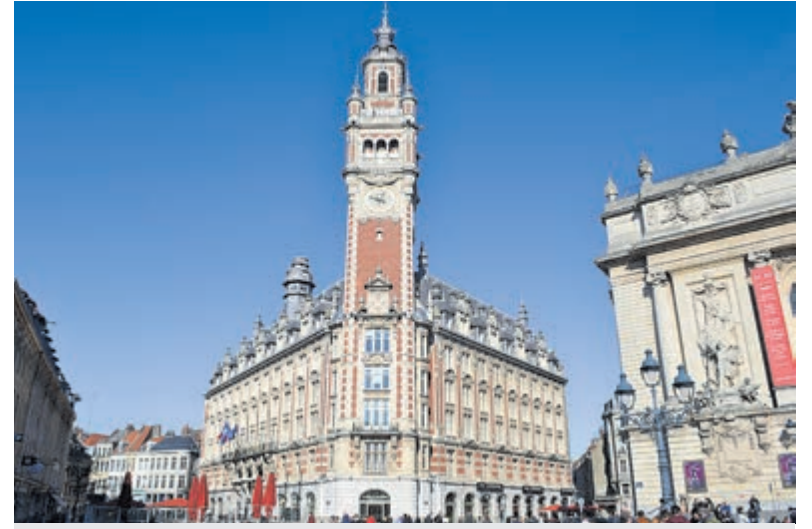
Kamer van Koophandel met belfort.

Wie een weekje over heeft, doet er goed aan om de diverse steden te bezoeken op de route naar Lille. Zo passeer je onder meer Antwerpen, Gent, Brugge en Kortrijk. Allemaal even prachtig met hun eigen sfeer en geschiedenis. Ook steden als Leper en Doornik zijn van hieruit te doen. Combineer dat met Lille en je hebt de ultieme stedenvakantie!