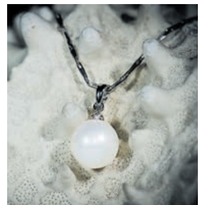
Parels, altijd stijlvol.

Beers & Komen Jewels heeft een spectaculaire eindejaarsactie. Tot en met 31 december 2022 krijgt u een tweede sieraad voor maar 1 euro. Een knaller van jewelste! Dit mag u niet