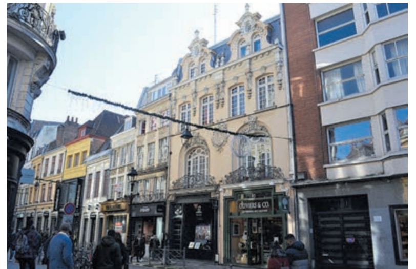
Lille is supergezellig.