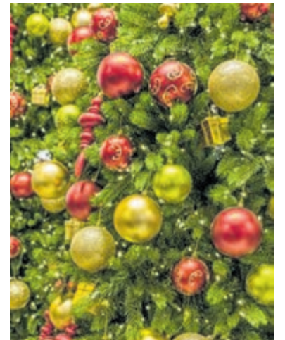
Magische wintersfeer op de jaarlijkse Kerstmarkt.

IJmuiden - Op woensdag 21 december worden het gebouw aan de Briniostraat en het schoolplein van het Technisch College Velsen en het Maritiem College IJmuiden (De Noostraat) omgetoverd in magische wintersferen voor de jaarlijkse Kerstmarkt. Er zijn onder meer kramen met lekker eten en drinken, prachtige lichtjes, cadeautjes en versieringen, mooie muziek en de Kerstman, kortom; alle ingrediënten voor een gezellige Kerstmarkt zijn aanwezig. U bent van harte welkom tussen 16.30 en 20.00 uur. De opbrengst van deze editie zal worden gebruikt voor een donatie aan Kerbert Dierentehuis IJmuiden en voor het opknappen van het schoolplein.