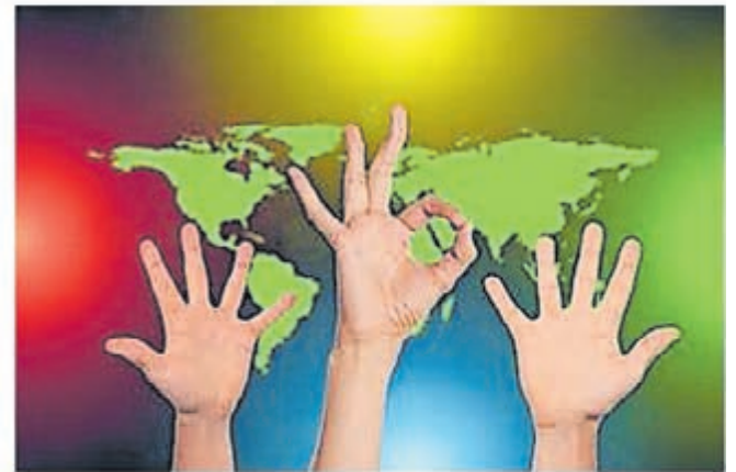
• Bedank altijd je vrijwilliger!

Ieder jaar vindt op 7 december de Nationale Vrijwilligersdag plaats. De Dag staat in het teken van de vrijwilliger. Een uitgelezen kans voor vrijwilligersorganisaties om vrijwilligers te bedanken voor hun inzet. Dat kan met een cadeautje, een feest, een uitstapje, of een kaartje met een compliment.