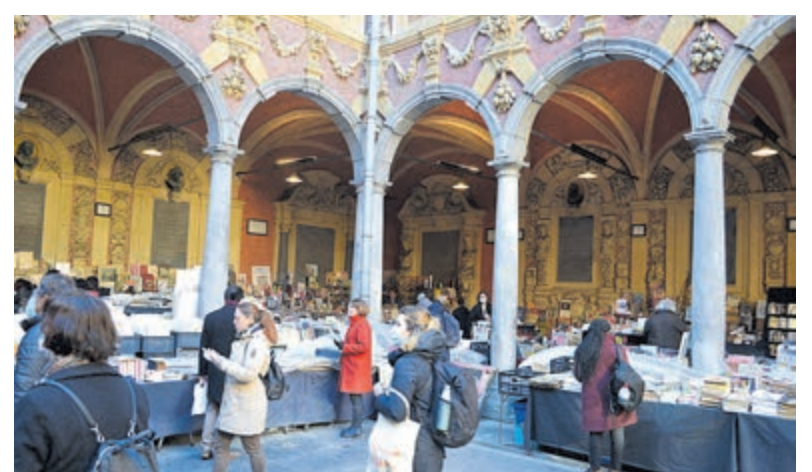
Boekenmarkt in de Oude Beurs.