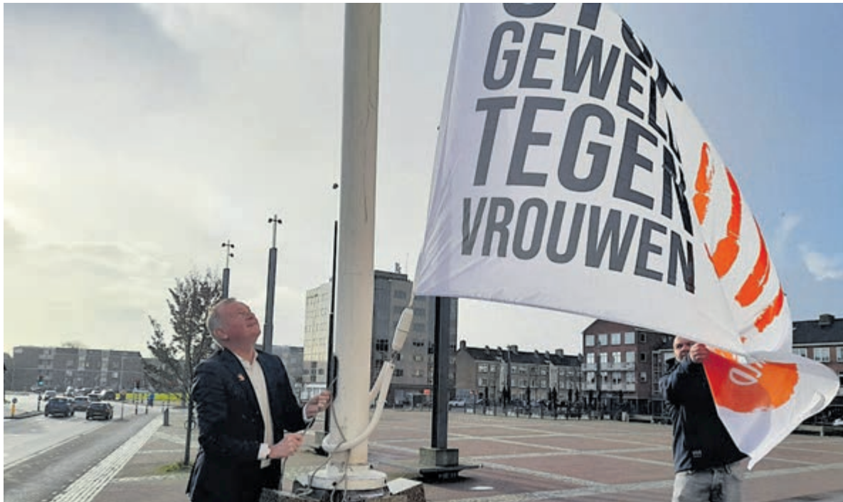
'Stop geweld tegen vrouwen!'