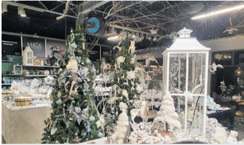
Lekker in de kerstfeer komen? Dat lukt uitstekend bij Welkoop!