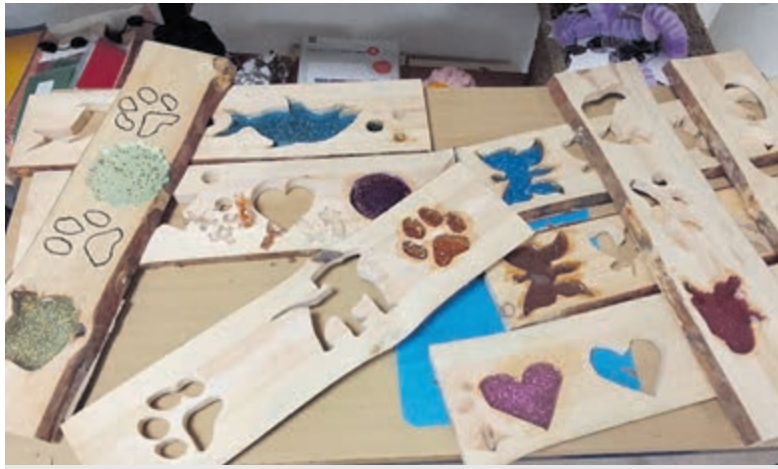
BuitenGewoon heeft vele doorlopende creatieve activiteiten.