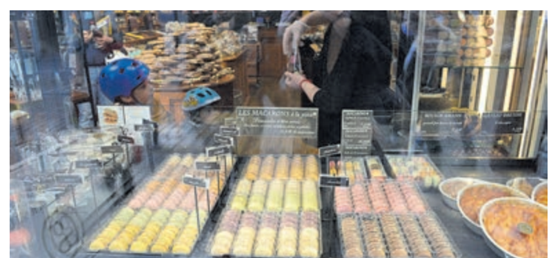
Heerlijke specialiteiten als macarons.