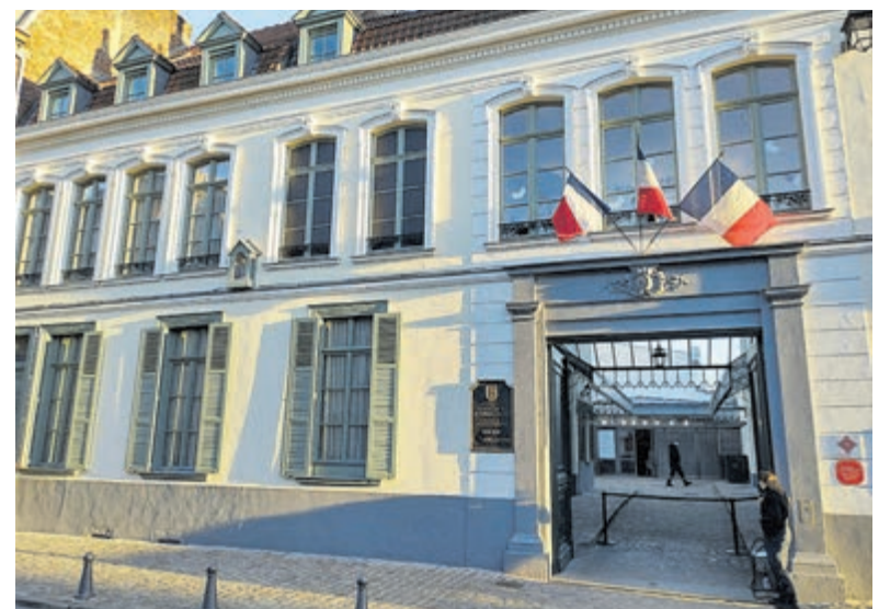
Geboortehuis Charles de Gaulle.