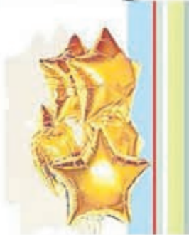
• Jij bent een ster!

HAARLEM – Op woensdag 7 december is het de Nationale Vrijwilligersdag! De gemeente Haarlem en Vrijwilligerscentrum Haarlem & omgeving – BUUV Haarlem (VWC-BUUV) willen alle vrijwilligers in Haarlem en omstreken hartelijk bedanken voor hun vrijwillige inzet het afgelopen jaar.