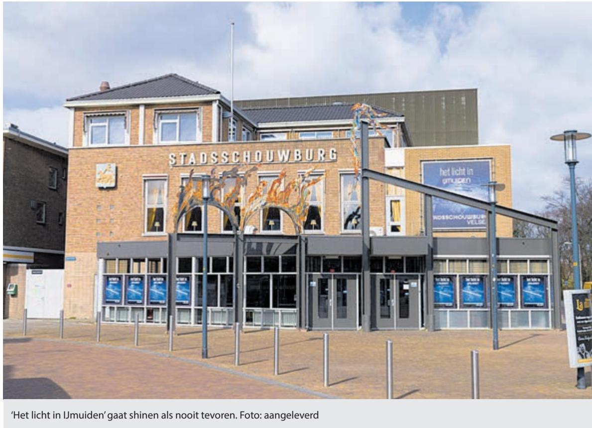
'Het licht in IJmuiden' gaat shinen als nooit tevoren.