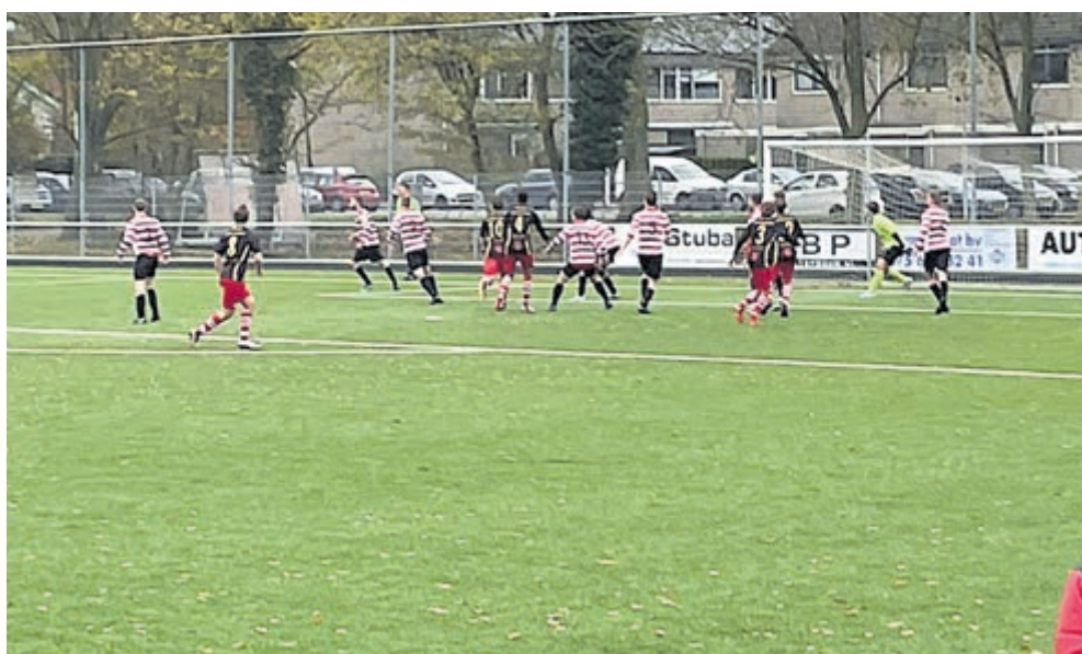
Mega winst voor VSV.

Aanmelden is verplicht. Dat kan eenvoudig via sportpasvelsen.nl/aanmelden , telefonisch of per email via E. Smit, Specialisatie sportstimulering volwassenen & senioren T: 06-15 12 94 01 - E: esmit@velsen.nl