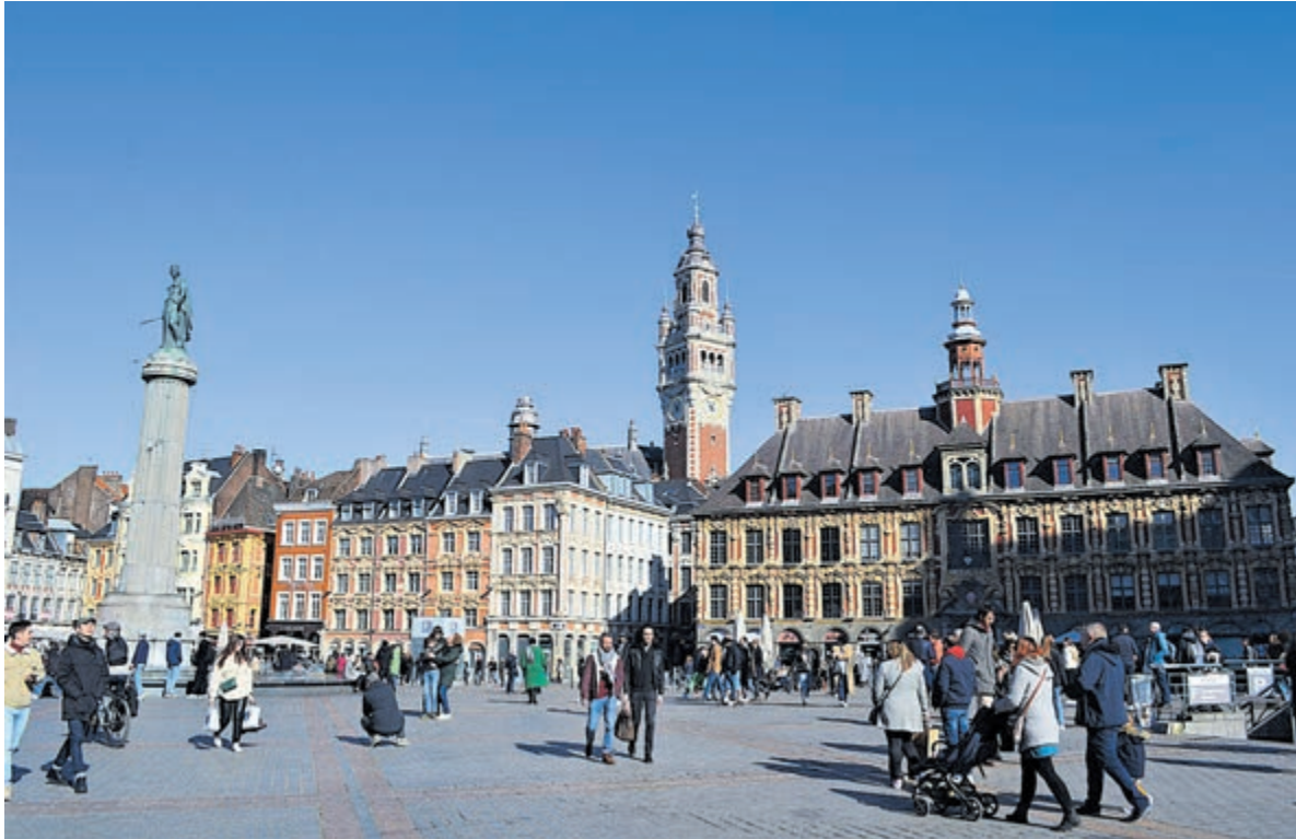
Place Charles de Gaulle.