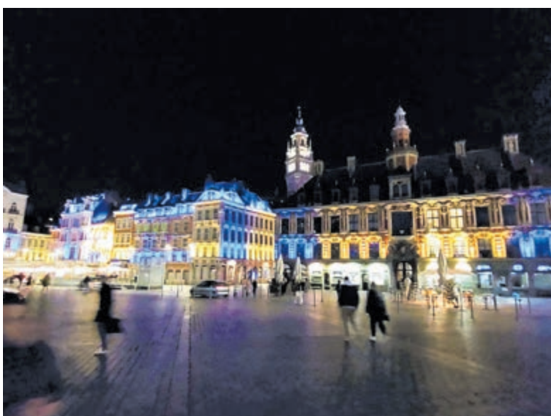
Lille verlicht in kleuren Oekraïense vlag.