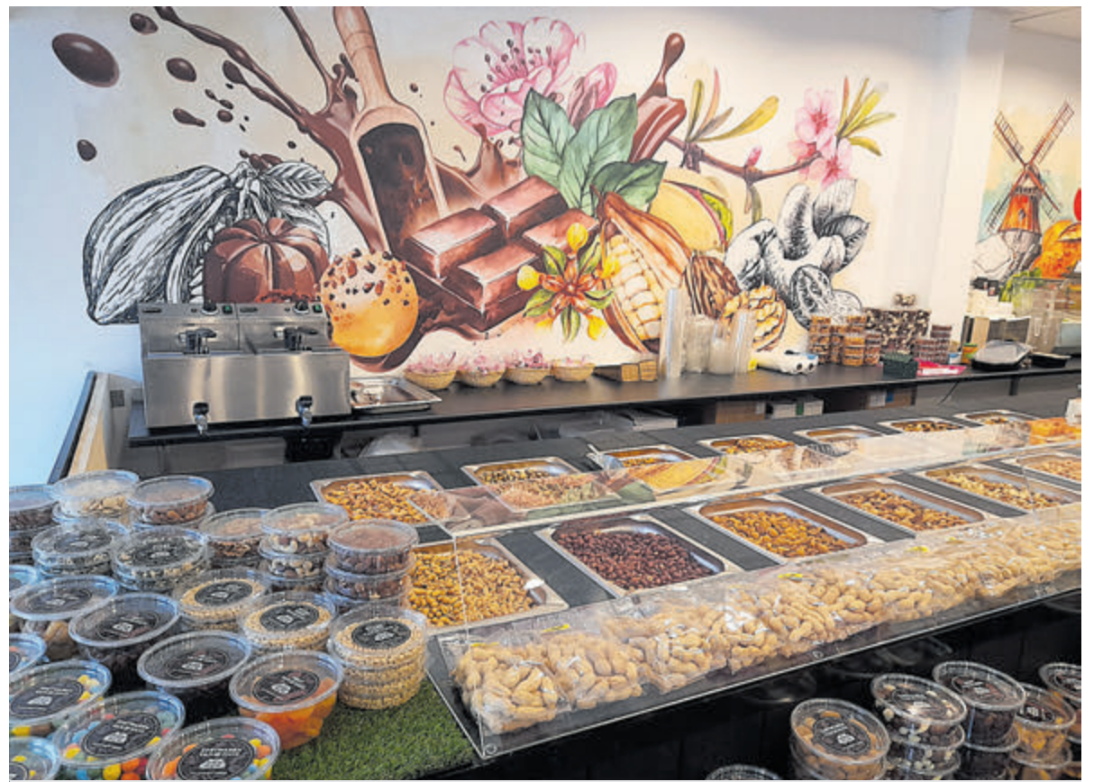
De balie met diverse zoetwaren en vers gebrande noten bij Fromagerie Tradition.

Tussen 17.00 en 19.00 uur staan de complete maaltijden klaar, met keuze uit diverse Hollandse stampotten maar ook Surinaamse gerechten zoals roti en bakkeljauw. Ook voor wild en gevogelte kun je bij Fromagerie Tradition terecht. Kippen die lekker in de wei hebben kunnen dartelen, maar ook eend, fazant en hert ligt in de vitrine. Verder: een mooi assortiment vers gebrande noten, handgemaakte pralinés en heerlijke Franse en Duitse wijnen. Trek in koffie? Neem