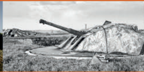
Duinen vertellen oorlogsverhalen NP Zuid-Kennemerland - 12 november