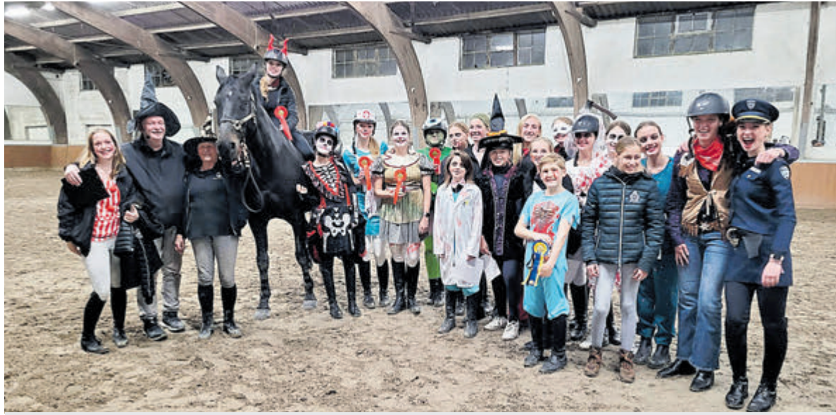
Alle griezelige deelnemers aan de Halloweenpringwedstrijd.