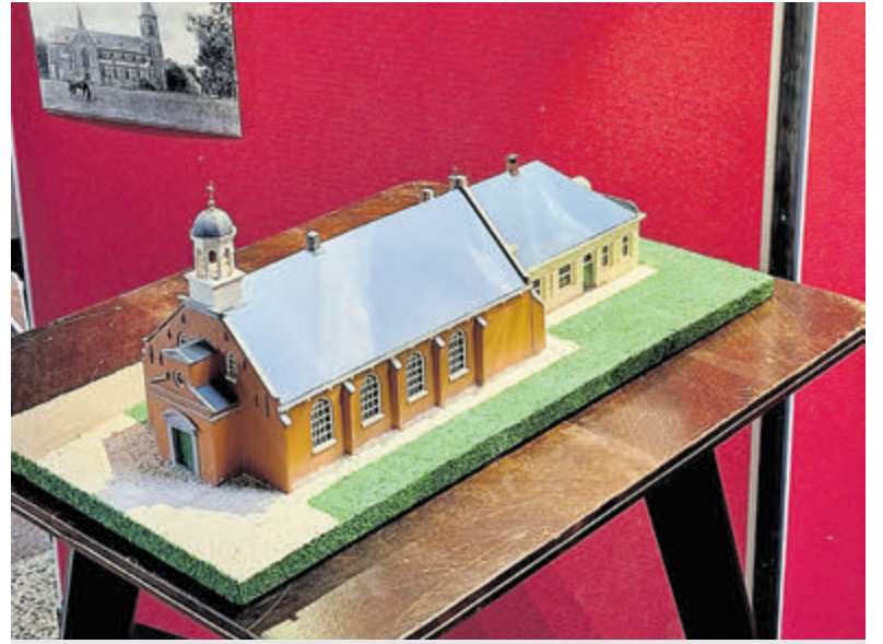
De maquette werd gemaakt door Jan Morren. Foto: aangeleverd

Bruggen, viaducten, kunstwerken, monumentale panden of andere bouwwerken kunnen soms minder stabiel zijn dan dat ze op het eerste gezicht lijken. Omgevingsinvloeden of temperatuurinvloeden kunnen rek, krimp of verzakking van genoemde bouwwerken tot gevolg hebben. Deformatiemetingen zorgen voor het in kaart brengen hiervan. De spoortunnel is dus ook in onderzoek. Tekst en foto: Arita Immerzeel