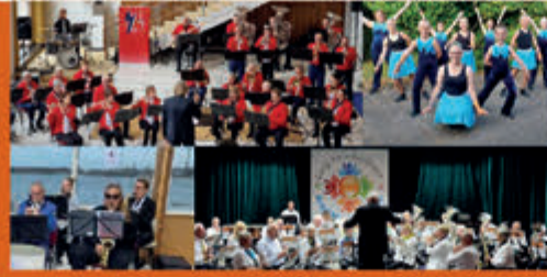
VG-festival Orkesten Stadsschouwburg Velsen - 4 november

Kijk voor alle evenementen en activiteiten in de gemeente Velsen op www.ijmuiden.nl/uitagenda