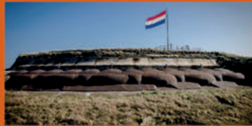
Historisch Forteiland IJmuiden Forteiland IJmuiden - 5 november