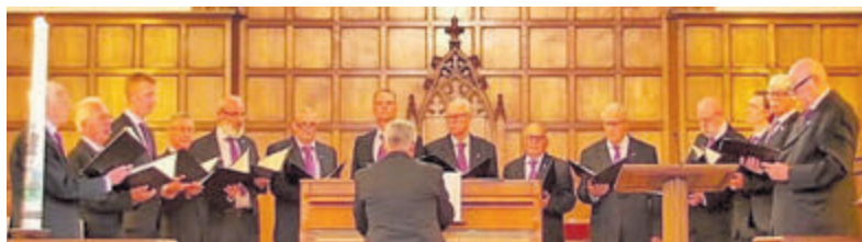
Het Interkerkelijk Mannenkoor Kennemerland.

afwisselend Accordeonband RATS en het Velsers Amusements Orkest in de foyer. Loop even binnen tussen 13.30 uur en 19.00 uur en laat u verrassen. De toegang is gratis! Dit festival wordt georganiseerd door de Culturele Stichting Velsers Gemeenschap (VG) ter gelegenheid van het 70-jarig bestaan. De VG heeft als doel het bevorderen van het culturele leven in Velsen en fungeert als platform voor organisaties op het gebied van (onder meer) zang, muziek, theater en beeldende kunst.