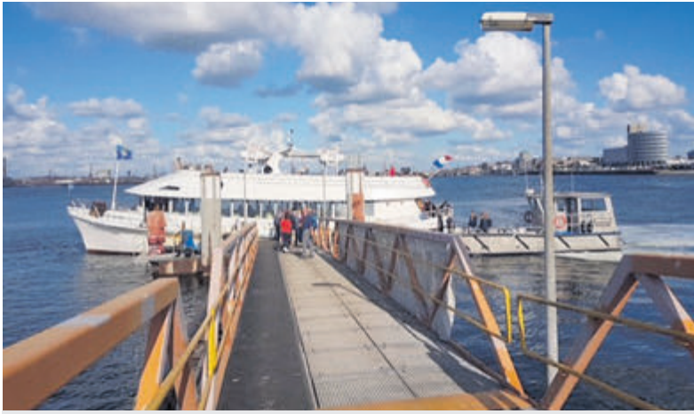
Laatste kans dit jaar om Forteiland te bezoeken.