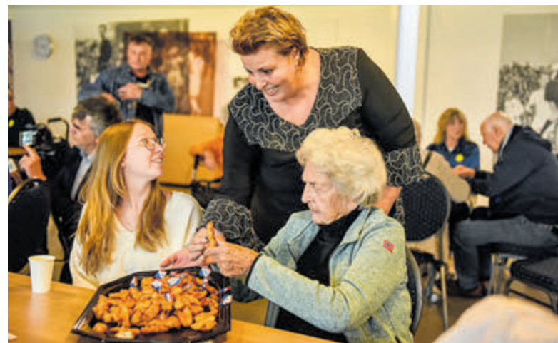
De hele middag waren er diverse activiteiten voor de gasten en natuurlijk versgebakken vis.