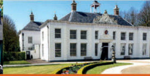
Rondleiding door hoofdhuis en tuinen Buitenplaats Beeckestijn - 5 november