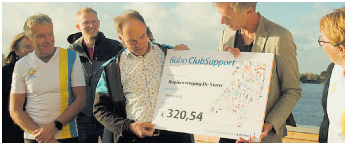
Overhandiging van de Rabo ClubSupportcheque aan roeivereniging De Stern.

Patrick van Keulen is al meer dan honderd jaar een begrip. Je vindt de winkel aan de Lange Nieuwstraat 787 in IJmuiden.