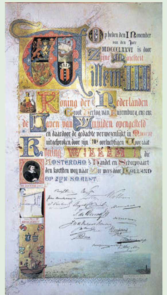
Een door de tijd aangevreten kleurenafdruk van de door koning Willem III bij de opening van het Noordzeekanaal getekende oorkonde, die we als geboorteakte van Ijmuiden beschouwen. Dit exemplaar komt uit een kanaalkist, die bij de viering van honderd jaar Ijmuiden en Noordzeekanaal in 1976 aan leerlingen van de hoogste klassen van de lagere scholen in Velsen is uitgereikt.