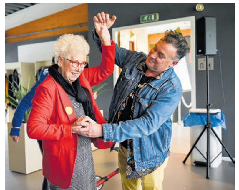
Lekker bewegen op muziek.