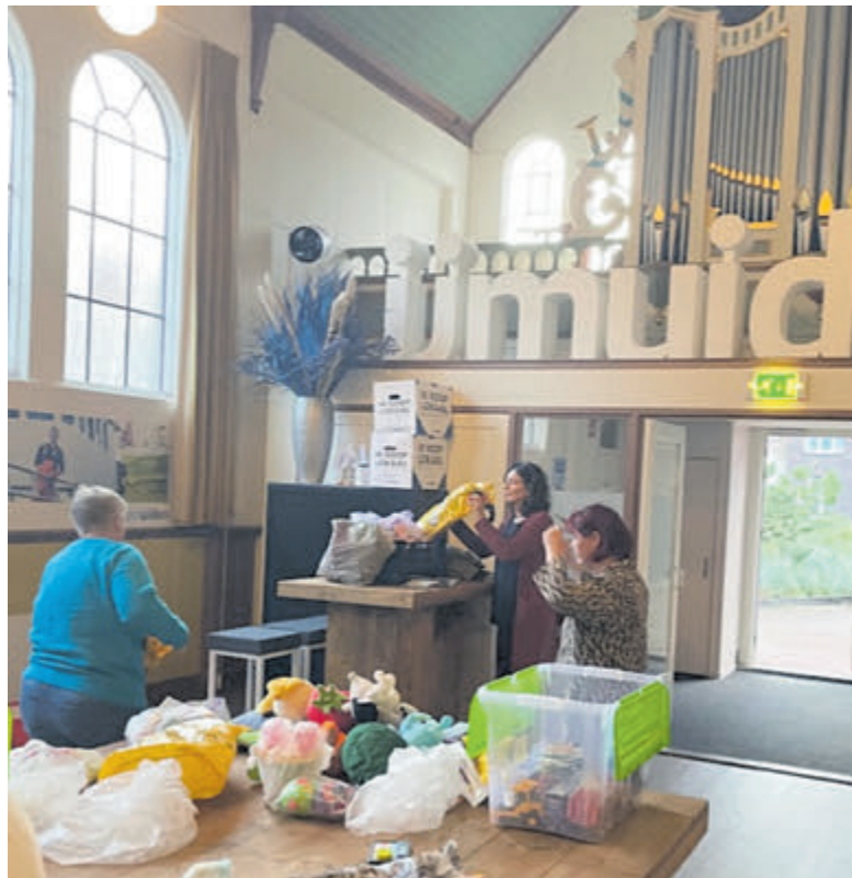
Lukt het ook dit jaar om het kerkje vol speelgoed te krijgen?