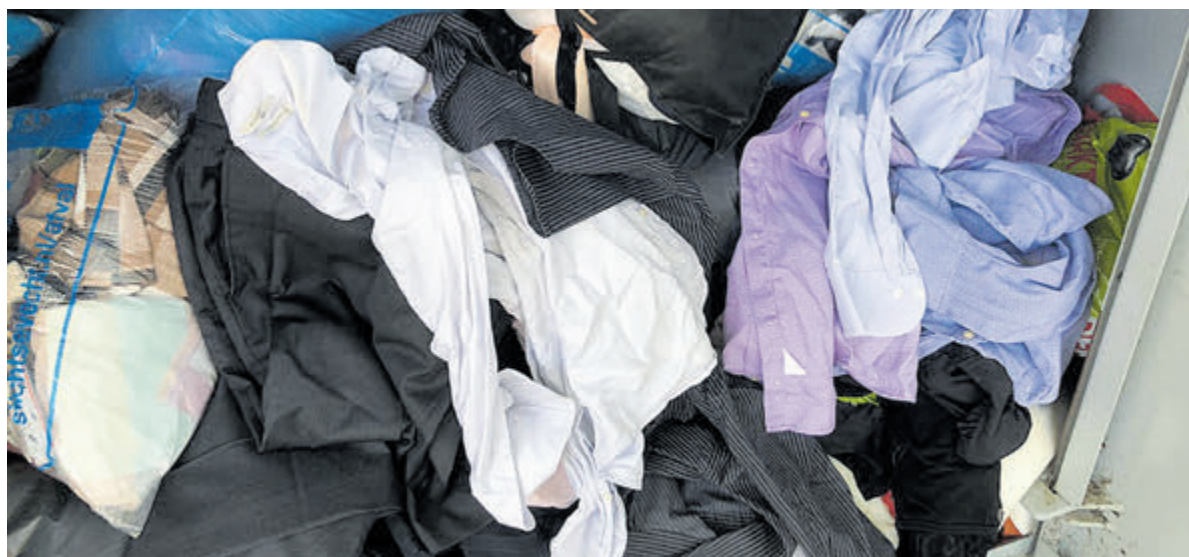
Los ingeworpen kleding is door de vrijwilligers lastiger te verwerken.

geen kussens, matrassen of huisvuil in de containers plaatsen. Ook geen zakken huis vuil of ander afval plaatsen naast de containers. Laten we Velsen netjes houden. Dank u voor uw medewerking!”