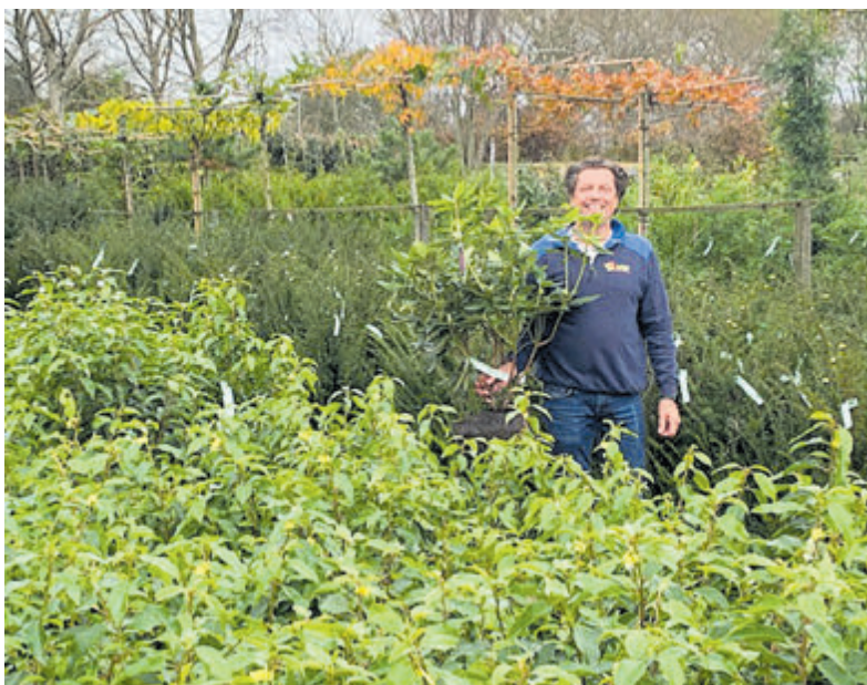
Volop keus bij tuinplantencentrum Loef.

De openingstijden zijn 4, 5, 11 en 12 november van 11.00 tot 17.00 uur. Gratis toegang, gratis parkeren.