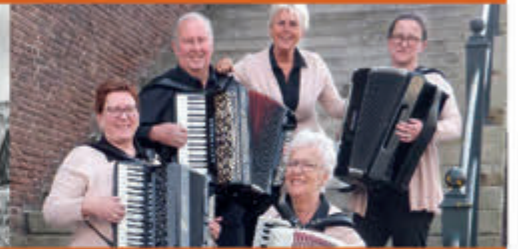
RATS en Shantykoor Nortada Soli Muziekcentrum - 12 november