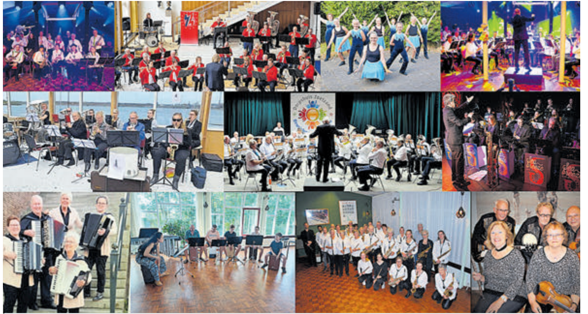
VG-festival Orkesten 2023.

Pop Your Big Art is open op zaterdag en zondag van 13.00 tot 17.30 uur. Tijdens Kunstlijn Haarlem (4/5/11/12 november) al open vanaf 11.00 uur. De toegang is gratis.