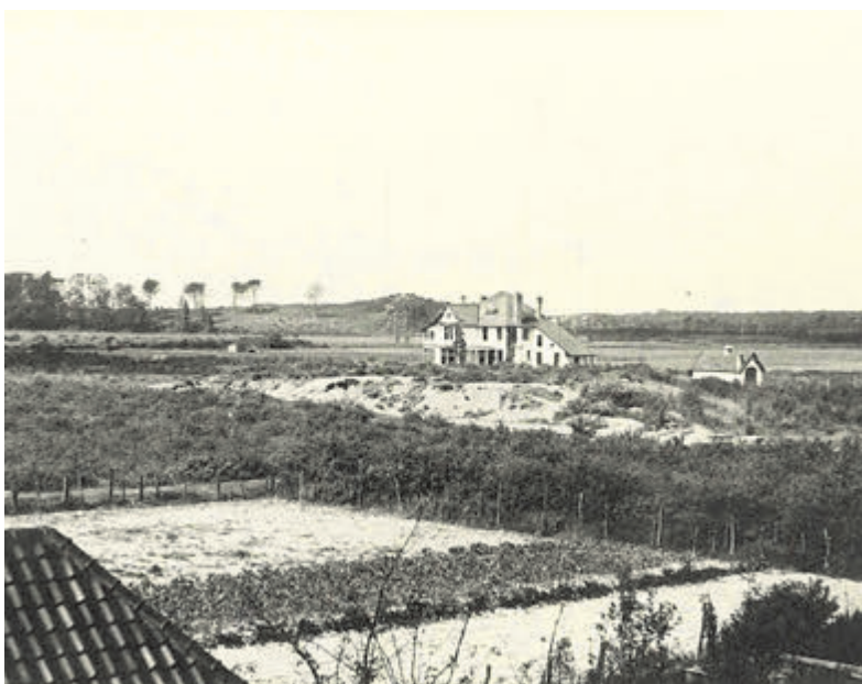
Villa Valkenhoef in de beginjaren midden in het weiland.

Velsen - Op 16 juli 2023 lanceerde schrijver Frans Looij het boekje over het veelzijdige 'leven' van Villa Valkenhoef. In dit bijzondere boekje wordt de geschiedenis van Villa Valkenhoef in Santpoort-Noord beschreven. In het boekje staat onder andere beschreven dat de grond waarop de villa is gebouwd op het oorspronkelijke terrein van Landgoed Duin en Kruidberg heeft gelegen.