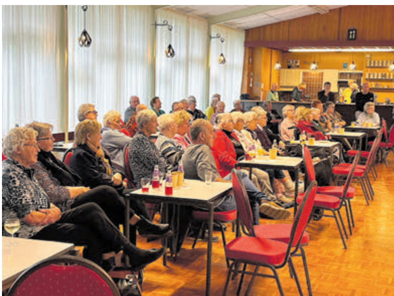
Het jubileumfeest werd een groot succes, mede dankzij de barmedewerkers van muziekvereniging Soli.

de Dinkgrevelaan 17 in Santpoort-Noord. De lesavonden beginnen om 19.30 uur. De cursus duurt 12 avonden en kost 125 euro plus 50 euro examenkosten. In veel gevallen vergoedt uw zorgverzekeraar een deel van de kosten. Meer informatie: info@ehbo-santpoort.nl of bel: 06 16446961.