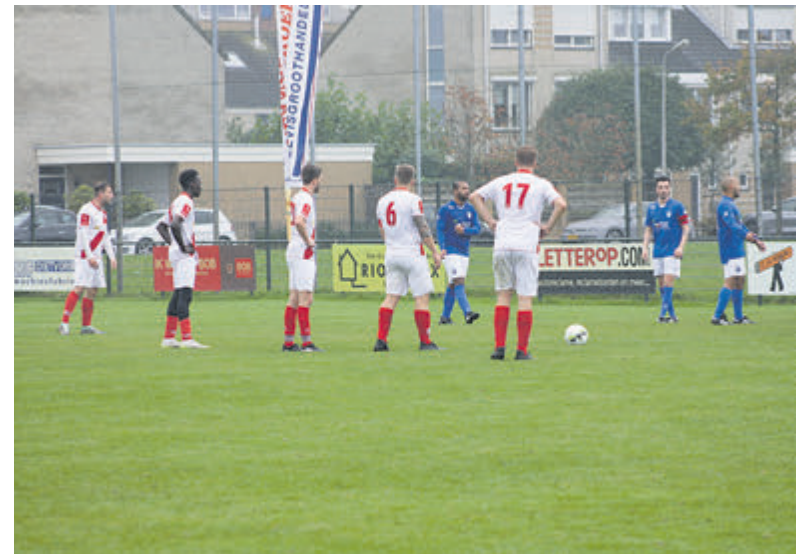
Vijf specialisten van de vrije trap; wie gaat hem nemen?

Na-inschrijven op zondag ter plekke kost meer: voor pupillen en CD-junioren 5 euro, senioren sprint cross en junioren A/B sprint cross 9 euro en senioren lange afstand 12 euro. Voor pupillen en junioren die lid zijn van KAV Holland en AV Haarlem is deelname gratis. Voor het circuitklassement telt voor de dames alleen de 5,4 kilometer, voor de heren alleen de 8,8 kilometer.