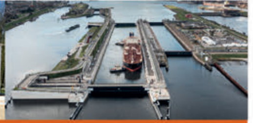
Rondleiding Zeesluis IJmuiden Zee- en Havenmuseum - 5 november