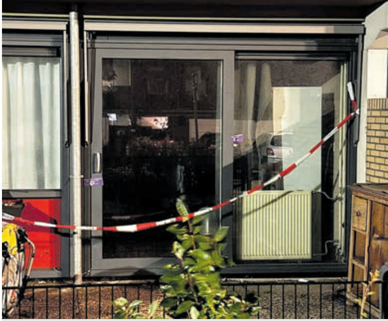
De woning is verzegeld en de politie vraagt iedereen die informatie heeft contact op te nemen.