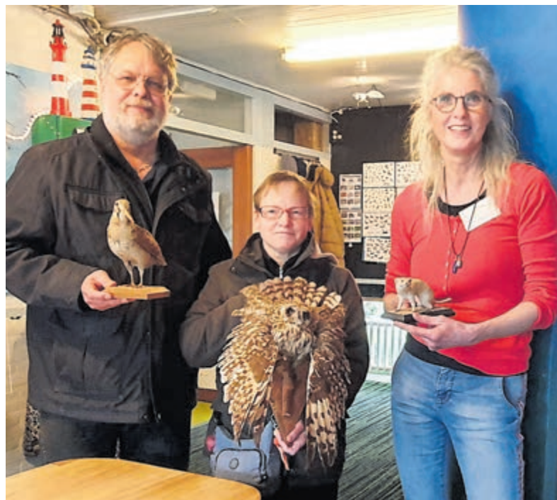
Leuke nieuwe aanwinsten in het natuurmuseum.

De schoolbezoeken starten om 9.00 uur, 10.30 uur en 12.00 uur. Reserveren van schoolbezoeken kan via www.nmewijzer.nl .