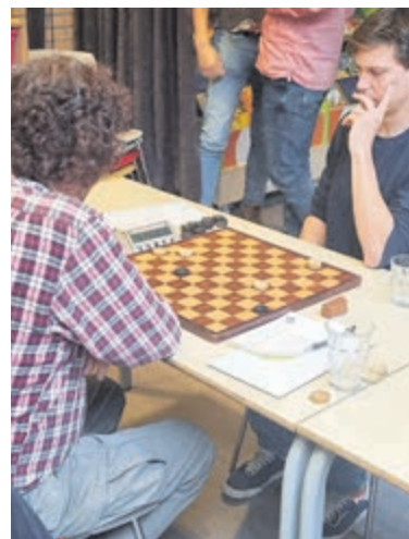
Tuijtel had de winst binnen handbereik maar faalde in afwerking.

concurrentie heeft DCIJ echter op doelsaldo de koppositie veroverd.