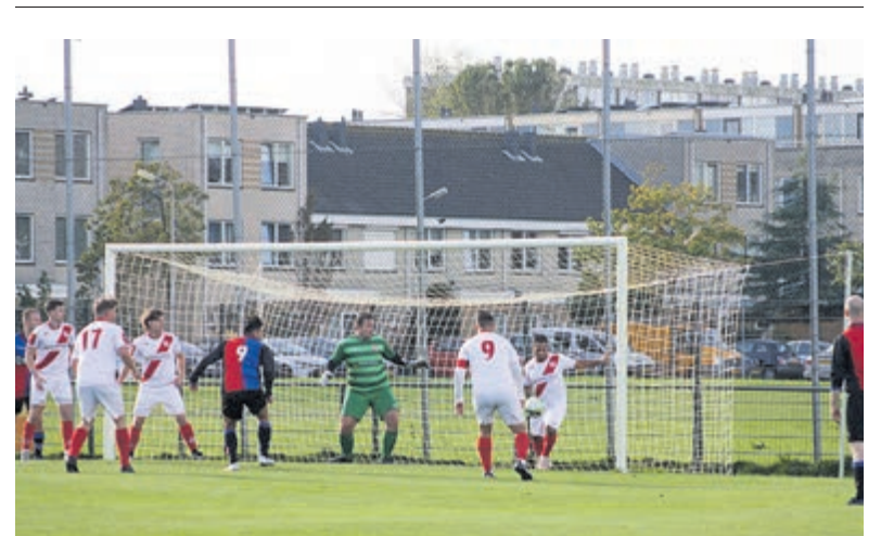
Eindstand werd 3-1.

tweede kwart was een four point play van shooting guard Laurens de Vilder. Na de pauze in het derde kwart werd door Akrides de voorsprong uitgebouwd tot van 73-52 na drie gespeelde kwarten. Zes verschillende Akridessers kwamen tot scoren waarvan Lars Koster met zeven punten het meest productief was. In het vierde en laatste kwart werd de overwinning definitief veilig gesteld. Debutant Quinten Mooij bepaalde met een vrije worp de eindstand op 85-66. Aanstane zaterdag speelt Akrides wederom een thuiswedstrijd en tegenstander voor de NBB Beker is dan Cangeroes uit Utrecht. De wedstrijd in Sporthal IJmuiden-Oost begint om 20.00 uur. Verslag: Archibald Akerboom