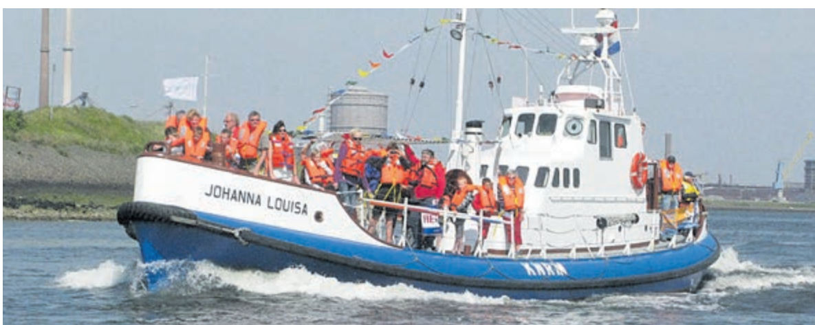
De groep vrijwilligers van de Johanna Louisa is op zoek naar opstappers met een affiniteit met scheepvaart en met name het reddingswerk.

Met de reis wordt aandacht gevraagd voor kanselijkheid voor jongeren op de arbeidsmarkt. Vooral met een visuele beperking is het moeilijk een baan te vinden: slechts drie op de tien mensen met een visuele beperking die kunnen werken, heeft een betaalde baan. De jongeren zijn woensdag 18 oktober om 17.00 de Stad Amsterdam opgegaan vanaf de Trawlerkade in IJmuiden.