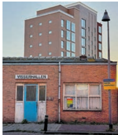
De Visserhallen vormen het bijzondere decor van Teer.

IJmuiden - Van 26 tot en met 29 oktober speelt Theatermanifestatie IJmond Teer, de tweede voorstelling van de zesdelige serie die ze maakt onder de naam de Manifest.