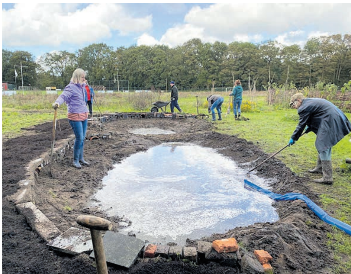
Deze workshop benadrukte niet alleen het belang van Wadi's maar ook de rol van vrijwilligerswerk.

Vooraf vrouwen moedig ik aan om te reageren, want die zijn nog ondervertegenwoordigd in ons chauffeursgezelschap.”