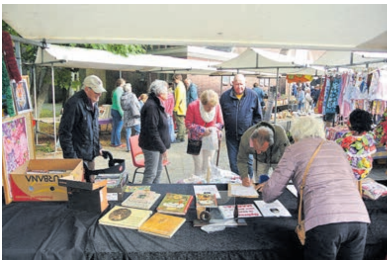
Voor de kraam van de Creatieve groep staat de levensmiddelenmand waarvoor een man de lijst invult. Rechts op de tafel zit pop Jesmaj met een zwarte bos haar.

Maandagmiddag rond 16.00 uur kwam er een melding over een reanimatie binnen bij de politie, die op moment van publicatie geen meldingen kan doen over de toedracht. De woning is verzegeld. Er wordt gevraagd om contact op te nemen met de politie als men meer informatie heeft. De recherche is ook op zoek naar camerabeelden uit de omgeving van de Sam Vlessinghof in de periode van 12 tot en met 16 oktober.