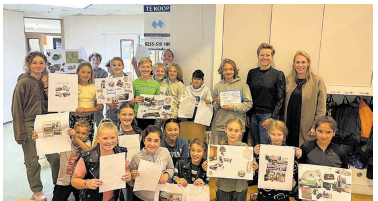
Een superleuke samenwerking tussen de school en de lokale ondernemers.

Toen kwam misschien wel het leukste werk. Het inrichten van een huis. De hele klas ging naar een meubelzaak om dat zogenaamd gekochte huis ook helemaal in te richten. De komende weken gaan ze nog aan de slag met boodschappen doen en andere vaste lasten. Wat een prachtige samenwerking tussen Het Kompas en lokale ondernemers. Iets om trots op te zijn!