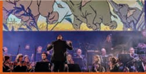
The Cinemusic Experience Stadsschouwburg Velsen - 20 oktober

Kijk voor alle evenementen en activiteiten in de gemeente Velsen op www.ijmuiden.nl/uitagenda