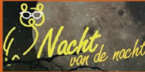
Nacht van de nacht NP Zuid-Kennemerland - 28 oktober