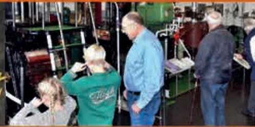
Motorendraaidag Zee- en Havenmuseum - 28 oktober