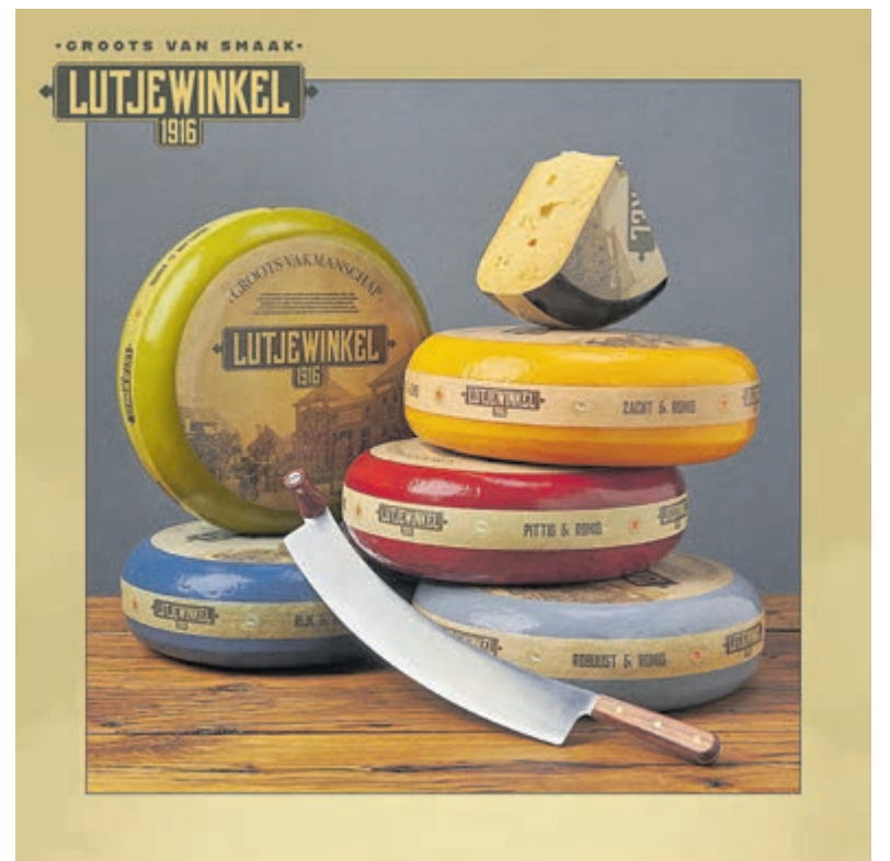
Kom vooral een van de favoriete kazen van Bart Captein proeven.

Dus, zet zondag 22 oktober in je agenda en nodig je vrienden en familie uit voor een onvergetelijke dag vol schattenjachtavonturen op de Grote Snuffelmarkt in Haarlem. Mis dit niet! De markt is van 09.00 tot 16.30 uur geopend.