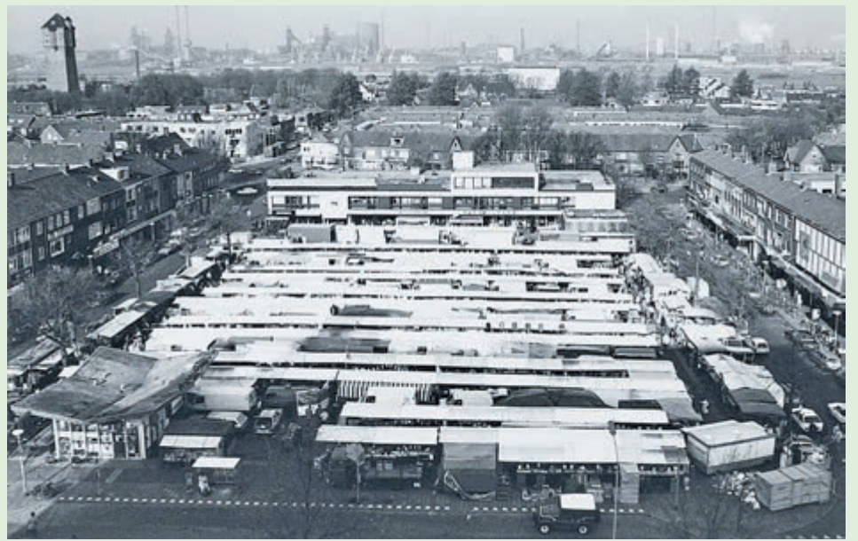
Het Marktpluin met de weekmark, gezien vanaf het gebouw van Scheveningen Radio in noordelijke richting, in november 1986.