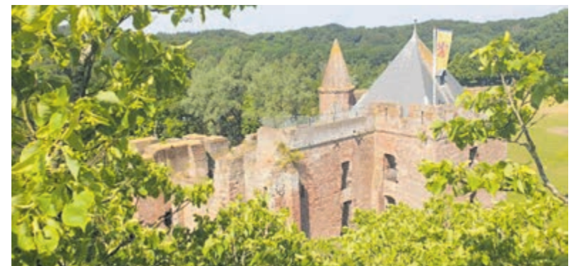
De Heerlijkheid Brederode is geopend voor een spectaculair bezoek.

Deze aanwijzing betekent niet dat iedereen overal onderzocht zal worden op het bezit van gevaarlijke voorwerpen. Dit is alleen mogelijk in combinatie met een aanwijzing van een veiligheidsrisicogebied waarbij de politie preventief kan fouilleren, of in een situatie waarin er aanleiding is om te fouilleren. Bij toepassing van het verbod zijn steeds de aard van de situatie, de concrete gedraging van een persoon en overige feiten en omstandigheden van belang.