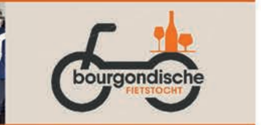
Bourgondische Fietstocht Gemeente Velsen - 29 oktober