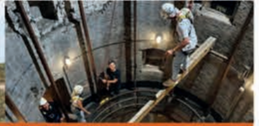
Avontuurlijk Forteiland Forteiland IJmuiden - 22 oktober