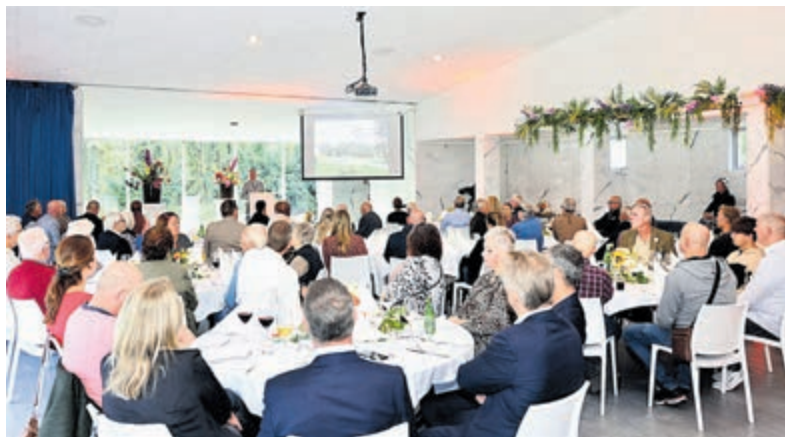
Er waren veel veteranen die gehoor hadden gegeven aan de uitnodiging.

Velsen - Afgelopen zaterdag vond traditiegetrouw Veteranendag Velsen 2023 plaats. Elk jaar wordt een bijzondere plek in Velsen als locatie gekozen, om een erbetoon aan onze veteranen te organiseren. De locatie was dit jaar Begraafplaats Duinhof, te bereiken via de Zeeweg en Slingerduinlaan. Van de ongeveer 250 veteranen in Velsen gaven meer dan 80 mensen gehoor aan de uitnodiging door hun aanwezigheid.