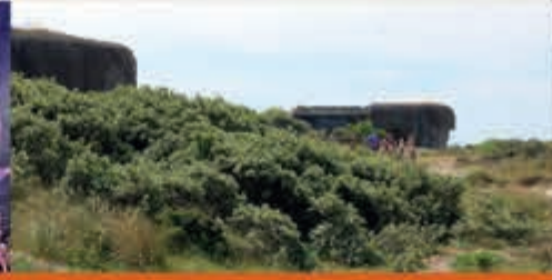
Buitenrondleiding bunkers Bunker Museum IJmuiden - 22 oktober