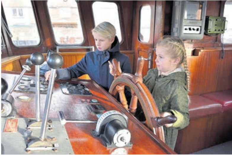
Extra geopend en zaterdag motorendraaidag.

IJmuiden - Het Zee- en Havenmuseum is in de herfstvakantie Noord (zaterdag 21 tot en met zondag 29 oktober) iedere middag, behalve maandag, geopend van 13.00 tot 17.00 uur.