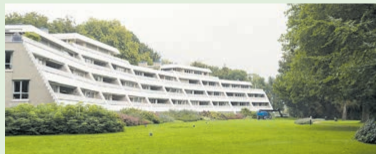
Het imposante bouwwerk lijkt een beetje op een schip.

Stichting Santpoort Tekst: René Stommel