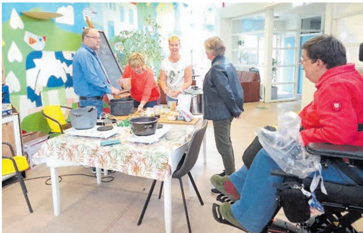
De Burendag was heel erg gezellig.