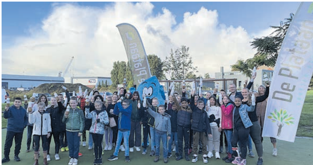
Door het drinken van (kraan) water blijft het lichaam gezond.