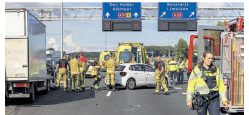
Er werden meerdere hulpdiensten ingezet bij het zeer ernstige ongeval.

Met vragen kunnen weggebruikers en omwonende contact opnemen met het servicepunt van de provincie via telefoonnummer: 0800 0200 600 (gratis) of per e-mail: servicepunt@noord-holland.nl .