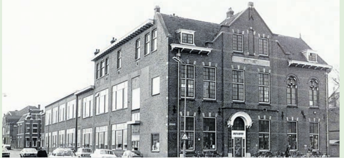
De Brulboei in 1978. inv.no. NL-HlmNHA_1098_6041.