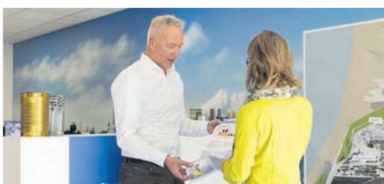
Tata Steel gaat graag in gesprek met de omwonenden.

schermen geplaatst om zo het zicht te ontnemen van omstanders. Rond 15.30 uur meldde de ANWB zo'n 7 kilometer file, goed voor bijna 50 minuten vertraging, op de A9. Om de file sneller op te laten lossen was er tot na de avondspits geen brugopening bij de Brug over het Zijkanaal C, zo verordende Rijkswaterstaat. De Verkeersongevallenanalyse van de politie heeft onderzoek gedaan. Aanvankelijk was ook de A22 richting Beverwijk niet bereikbaar door het ongeluk. Later werd een rijbaan vrijgegeven en werd het ingesloten verkeer via de A22 weggeleid. Rijkswaterstaat meldde rond 16.30 uur dat de A9 weer werd vrijgegeven.