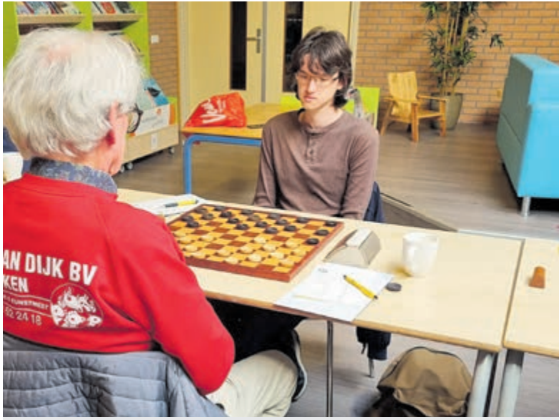
DCIJ mag zich koploper van de hoofdklasse A noemen.