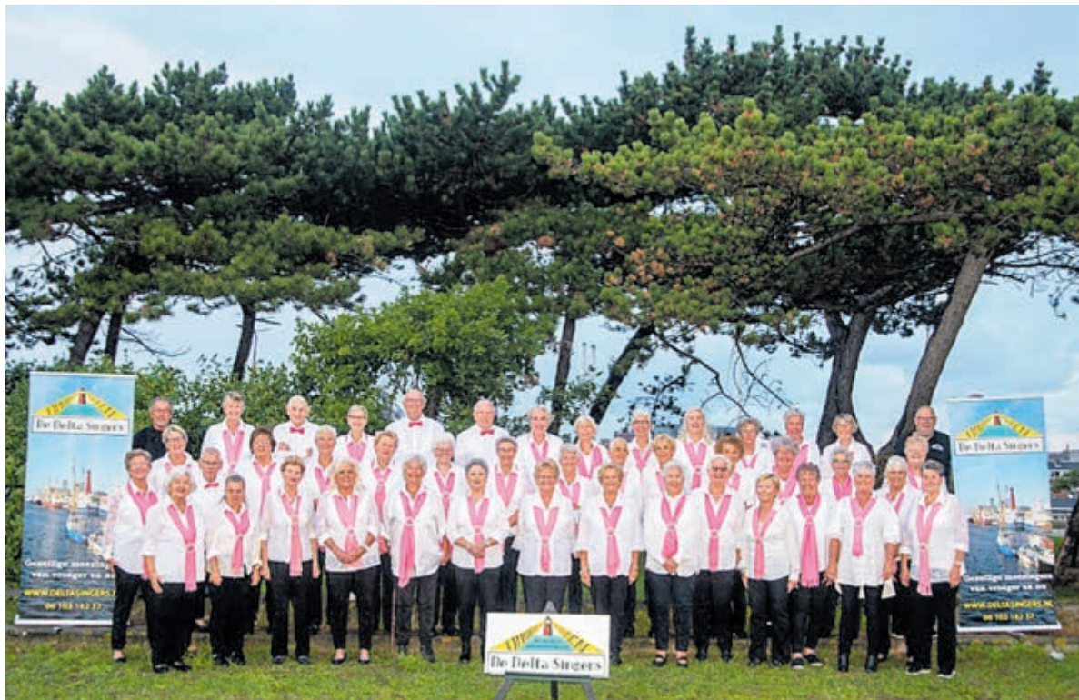
Mooie redenen om een gezellige middag te organiseren.