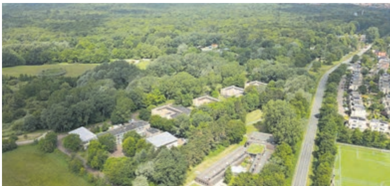
luchtfoto die de mooie ligging van voormalige jeugdinstelling Levvel5 in Driehuis laat zien.

Driehuis - HBB Groep en Brolan Vastgoed hebben afgelopen juli de gebouwen van de voormalige jeugdinstelling Levvel5 aan de Duin- en Kruidbergerweg 1 te Driehuis gekocht. De bestaande panden, aan de rand van het Nationaal Park Zuid-Kennemerland, zijn aangekocht met de ambitie om op deze locatie te herontwikkelen voor een bredere doelgroep, onder andere huisvesting voor jongeren en ouderen.