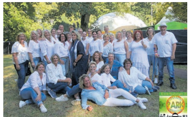
Popkoor Zingsation heeft er ontzettend veel zin in.

complexen. Doel is om vanaf 2028 geen woningen meer te verhuren met een E, F of G label, tenzij er voor deze woningen concrete sloop/nieuwbouwplannen zijn. Huurders die vragen hebben over onze duurzaamheidsplannen of over de energieprijzen kunnen contact opnemen met het Woningbedrijf. Of een kijkje nemen op de website: Stijgende energieprijzen « Woningbedrijf Velsen ( wbvelsen.nl )