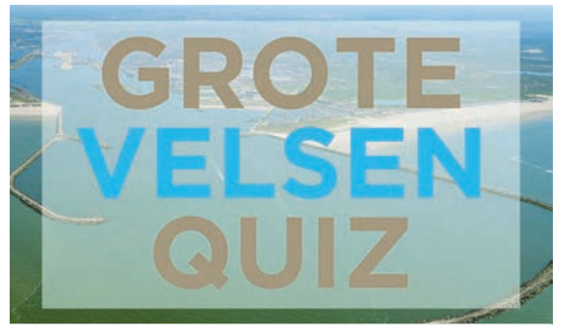
Weet je van alles en nog wat over Velsen? Meld je dan aan voor De Grote Velsen Quiz.