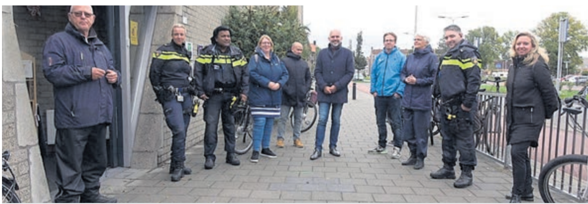
Het was bijzonder dat al deze vertegenwoordigers van diverse organisaties samen aanwezig waren.

De quiz wordt mede mogelijk gemaakt door Citymarketing Velsen | ijmuiden.nl en Businessclub Telstar.