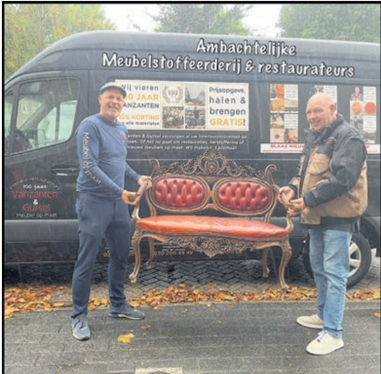
Het meubel wordt op geheel ambachtelijke wijze weer in de oorspronkelijke staat hersteld.

natuur worden begraven? Wat betekent persoonlijke uitvaartzorg? Tevens kunt u kennismaken met ons en een kijkje nemen in de rouwhuis-kamer. Het eerstvolgende spreekuur is donderdag 6 oktober. U bent van harte welkom. Adres: Frans Netscherlaan 12 in Santpoort-Noord.