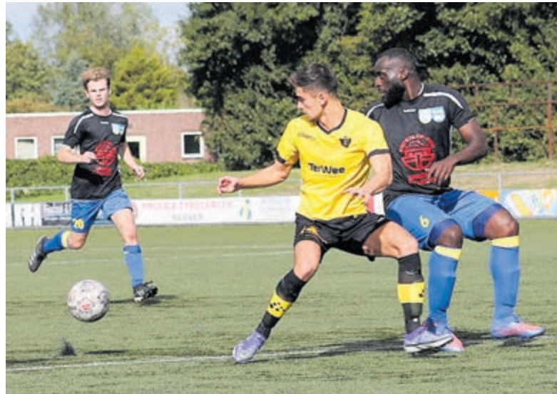
Helaas geen overwinning maar volgende week weer een nieuwe kand.

Driehuis - Door de vele blessures moest trainer Dooijeweerd puzzelen om een waardig elftal op de been te brengen. Toch kreeg Velsen in de vijfde minuut al een kans, maar de inzet van Daan werd gekeerd door doelman van Alcided.