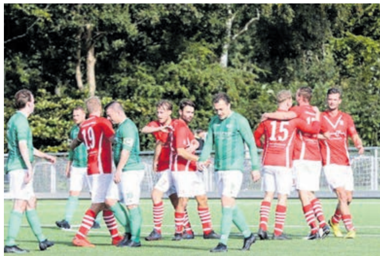
Aanstaande zondag komt Alliance op bezoek bij VSV en dat wordt een spannende pot.

Driehuis -De seizoens-opening van vorige week leverde voor VSV slechts één schamel puntje op, maar afgelopen weekend waren de eerste elftallen succesvoller, waarbij de zaterdag 1 gelijk speelde tegen Roda 23 uit en de zondag 1 een eenvoudige 1-6 zege uit bij Schoten boekte.