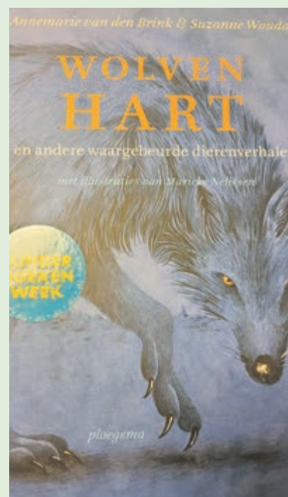
Deze keer wil Sjoerdje graag Wolvenhart en andere waargebeurde dierenverhalen laten zien.