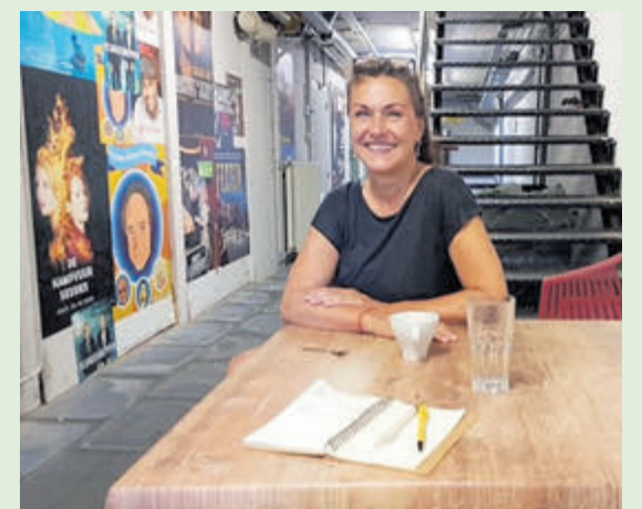
„Ik communiceer via mijn werken”.

Ondertussen dwalen we langs haar werken, die ook te koop zullen zijn. Via een QR-code wordt men naar de website van Dakmar geleid. Er zijn grote blikvangers en kleine werkjes op houten paneeltjes. „Ik werk uitsluitend met olieverf en 17e eeuwse technieken. Mijn atelier is aan huis, hier om de hoek. Ik kan maken wat ik zelf wil, ik communiceer via mijn werken. De kleur groen is favoriet, al werk ik met veel andere kleuren. De schilderkunst van de fijne techniek, daar heb ik mij in bekwamd. Voor een ongeduldig persoon als ik ben, is dat bijzonder, want de fijne details van bijvoorbeeld haar, parels en kant, vragen om heel veel geduld.” Meestal weet Dakmar wel waar een aangekocht werk van haar hand terecht komt. „Ik breng het meestal zelf weg. In het verleden werkte ik ook wel in opdracht, maar dat doe ik niet meer. Het is heerlijk om vrij te zijn in mijn keuzes.” Alles is te koop, behalve de portretten van haar ouders. „Ik heb hen geschilderd, toen ze zo'n jaar of 27 waren. Dat werk is mij te dierbaar, dat zal ik nooit verkopen.” Meer informatie: www.dakmar-scholten.com , www.beeldendkunstenaarsvelsen.nl , www.stadsschouwburgvelsen.nl .