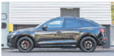
Audi Q5 Sportback 55 TFSI e S edition € 79.950,-