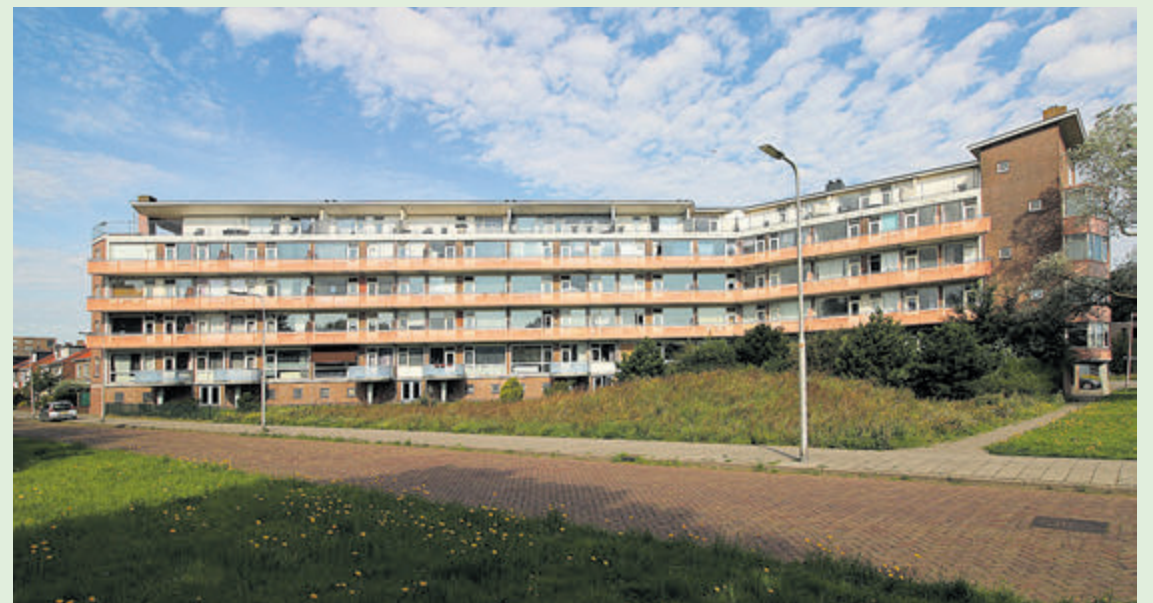
Het geknikte flatgebouw van Staal aan de Dolfijnstraat. Als je een spiegel links of rechts van deze foto houdt, zie je het gebouw aan de Waalstraat.

Met het slopen van de twee gebouwen verdwijnt dus