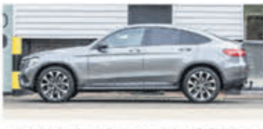
Mercedes-benz GLC-klasse Coupe 250 4MATIC Premium € 49.950,-