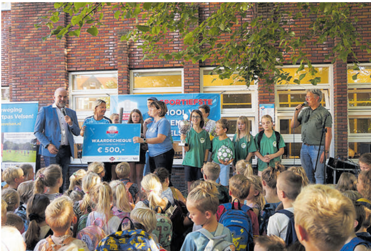
Door zo veel mogelijk deel te nemen aan centraal georganiseerde sporttoernooien in deze gemeente word je de sportiefste school van Velsen.