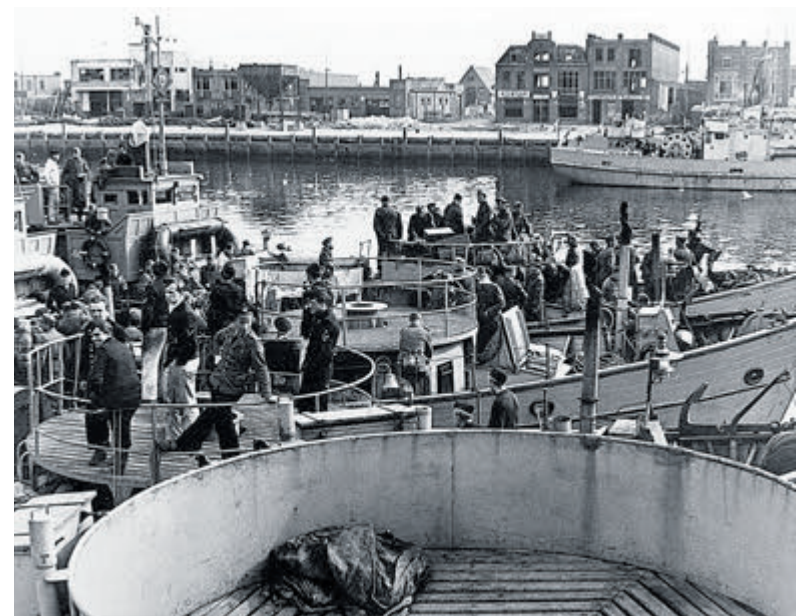
De Kriegsmarine zette zogenoemde 'Vorpostenboote' in om de havenmond en kust te verdedigen. Men gebruikte hiervoor geconfisqueerde vissersschepen of trawlers, zodat ze door de geallieerden werden aangezien als vissers. De schepen waren voorzien van zwaar luchtafweergeschut en/of scheepsgeschut.

In het volgende deel: De jaren 70, waarin Piet Dekker zelf in dienst trad van het SVHB.