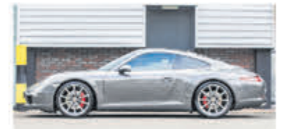
Porsche 911 3.8 Carrera S € 84.900,-