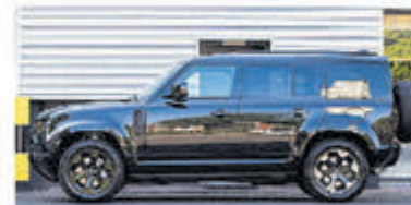
Land Rover Defender 2.0 P400e 110X SE € 115.000,-