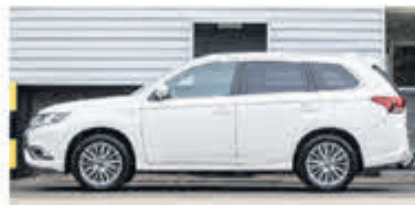
Mitsubishi Outlander 2.4 PHEV S-Edition € 30.750,-