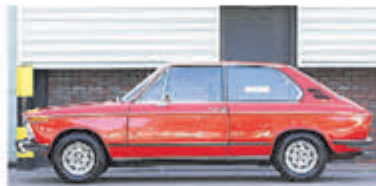
Bmw 2002 1802 Touring € 14.950,-