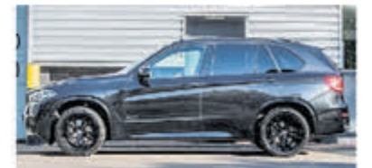
BMW X5 XDrive40e M Sp. Ed. € 54.900,-