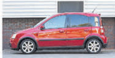
Fiat Panda 1.4 16V Sport € 4.950,-