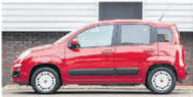
Fiat Panda 0.9 TwinAir Lounge € 5.950,-