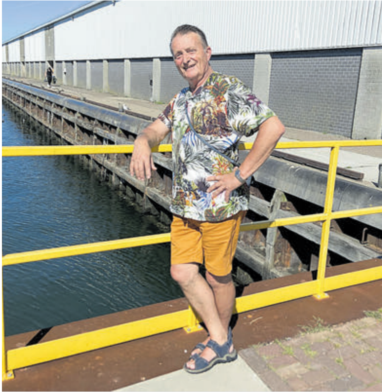
'We moeten het samen doen, iedereen in dit gebied.'