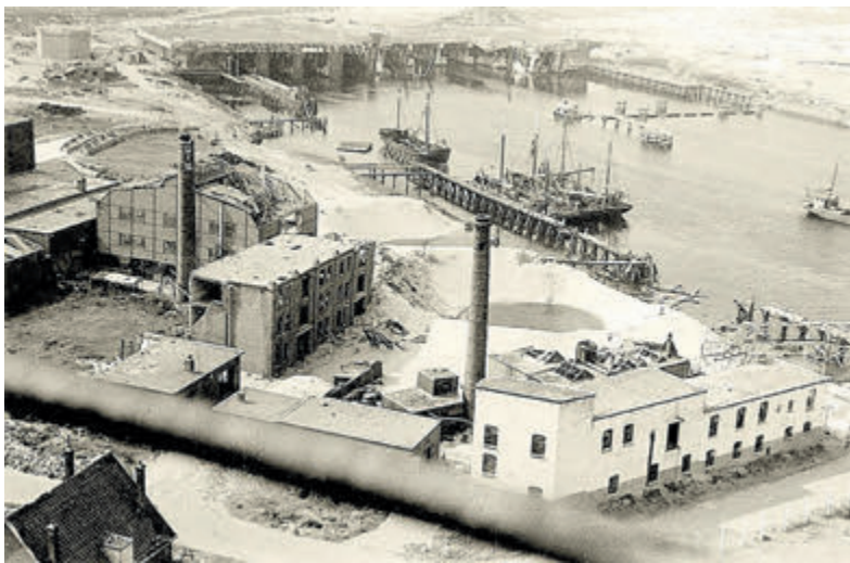
Zicht vanaf de vuurtoren op de haven van IJmuiden. Goed te zien is welke schade een bombardement in de Tweede Wereldoorlog aanrichtte. Op de achtergrond Schnellbootbunker 1, die sinds het bombardement niet meer werd gebruikt en na de oorlog werd gesloopt. Enkele brokstukken van die bunker bevinden zich nu op het terrein van Bunker Museum IJmuiden.

Toen de Engelsen op 14 mei 1940 de beide droogdokken lieten zinken, begonnen de donkerste dagen uit de geschiedenis van het