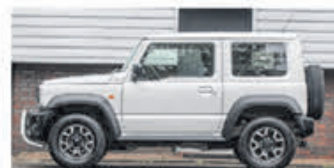
Suzuki Jimny 1.5 Stijl € 36.950,-