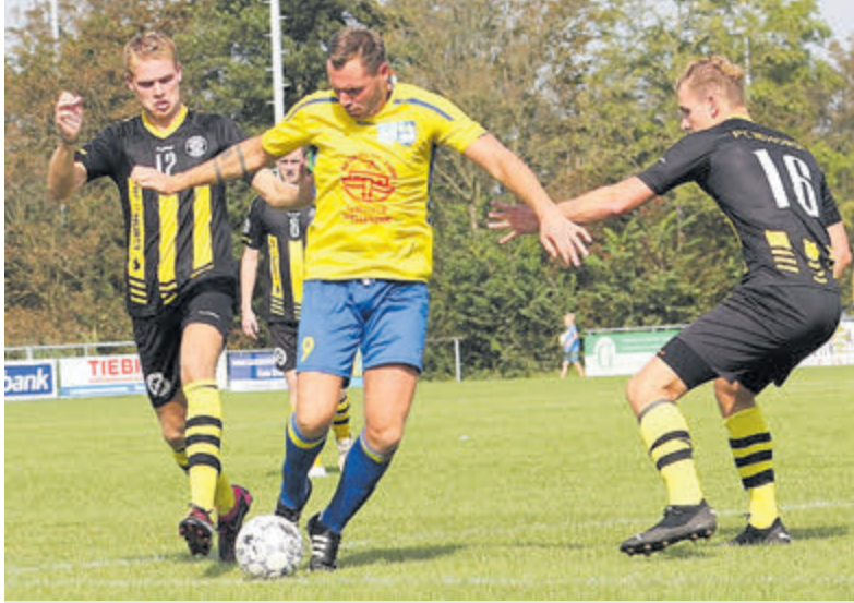
Al met al een prima resultaat: Foto: aangeleverd

Driehuis- Een groot aantal getrouwe RKVV Velsen fans wisten zondag een snikheet Sportpark Cloppenburg in Akersloot te vinden. Dat belooft veel goeds voor de wedstrijden komend seizoen in de 1ste Klasse A West 1 van de KNVB, waarbij er meer in de regio kan worden gespeeld door de mix van zaterdag- en zondag-verenigingen.