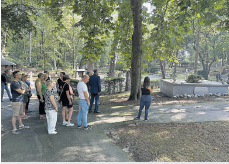
Zeer geslaagde Open Dag op Westerveld.