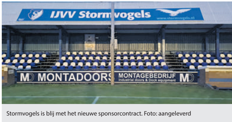
Stormvogels is blij met het nieuwe sponsorcontract.