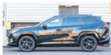
Toyota RAV4 2.5 Hybrid AWD Enrg+ € 37.900,-