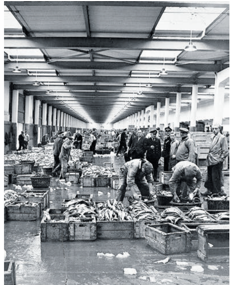
De vishal, waar de vis in vroeger tijden nog in houten kisten werd aangevoerd. Tegenwoordig maakt men gebruik van kunststof kratten.