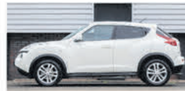
Nissan Juke 1.6 Acenta € 10.900,-