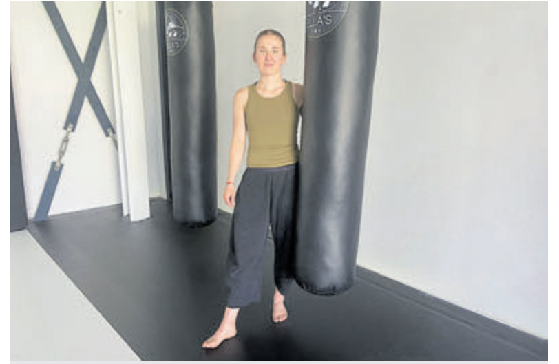
Ervaar zelf hoe kickboksen kan bijdragen aan jouw fysieke en mentale gezondheid bij ELLA's.