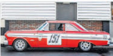
Ford Usa Falcon FUTURA SPRINT € 79.000,-