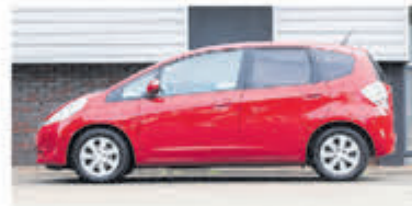
Honda Jazz 1.4 Hybrid Elegance € 11.700,-