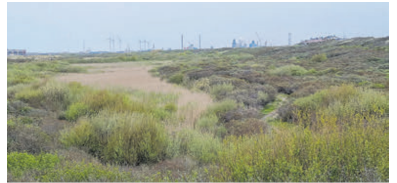
Onderschrift: De biodiversiteit van dit gebied zal worden hersteld.

programma met werken van Beethoven, Schubert, Debussy, Charles Griffes en Poulenc. De variaties op een eigen thema is een van Beethovens mooiste composities, vorm en inhoud zijn volmaakt in balans. 't Mosterdzaadje, Kerkweg 29, Santpoort-Noord 023-5378625. Half uur voor aanvang is de zaal open. Toegang vrij na afloop collecte. Zie ook www.mosterdzaadje.nl .