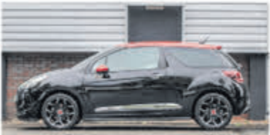
Citroen DS3 1.2 PureT So Red € 10.900,-