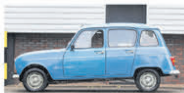
Renault R 4 R 4 € 4.950,-