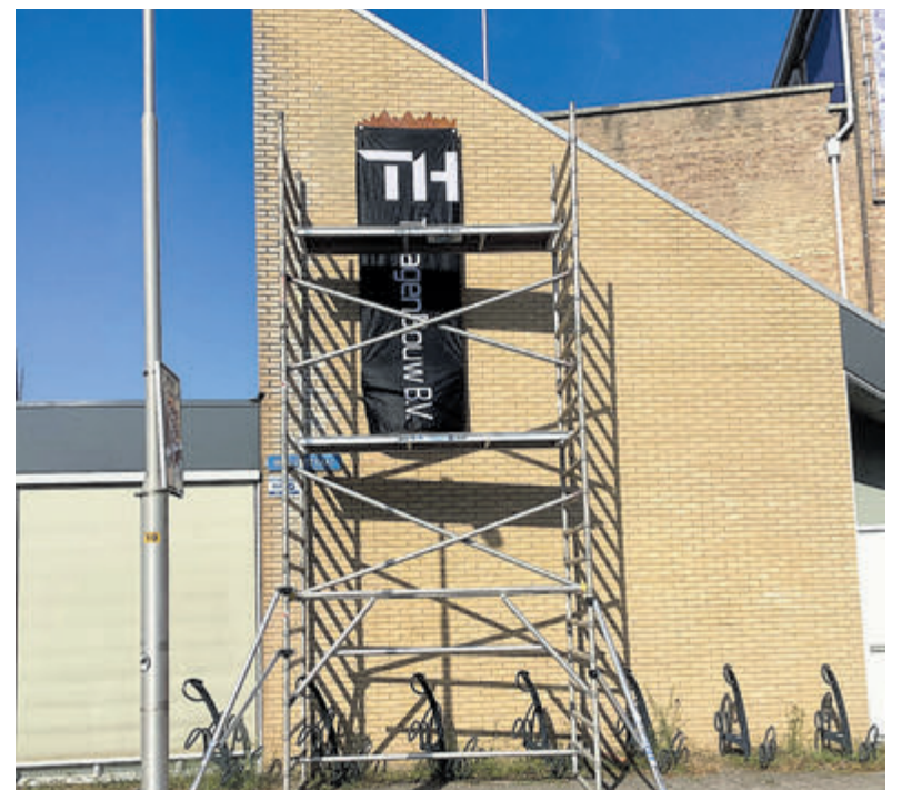
We zijn benieuwd wat op het nieuwe uithangbord van de Stadsschouwburg Velsen staat.

lichte ruimte. Overigens was dat een heel werkje want: „De visschubben vielen bij wijze van spreken uit het plafond.” Ella heeft gediplomeerde kennis op gebied van voeding en darm-gezondheid en burn-out coaching. Aan de hand van deze unieke combinatie aan kennis en kunde combineert ze het fysieke en het mentale aspect. Ervaar zelf hoe kickboksen kan bijdragen aan jouw fysieke en mentale gezondheid. Ze giet sport en gezondheid in een ruig jasje en maakt jou aan de hand van de mooie sport kickboksen wijzer, sterker en weerbaarder. Vissershavenstraat 46. https://www.ellas-training.nl/ .