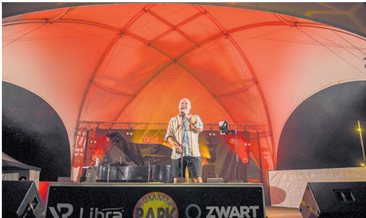
Paul de Leeuw laat de bezoekers even slikken.

Tenslotte komt het productieteam van de Summer Park Sessions aan het eind van het optreden op het podium om het dankwoord en slotapplaus in ontvangst te nemen. Ook de derde editie van het evenement gaat als zeer geslaagd de boeken in.