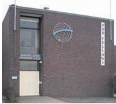
Het gebouw van Odd Fellows.

Velsen-Zuid - De Odd Fellows van de IJmondloge houden op donderdag 21 september weer een zogenoemde 'open avond'. Alle belangstellende inwoners uit Velsen en omgeving zijn deze avond van harte welkom aan de Stationsweg 95 te Velsen-Zuid, om vanaf 19.30 uur kennis te maken met deze ruim 100-jarige Velsense vereniging en hun leden.