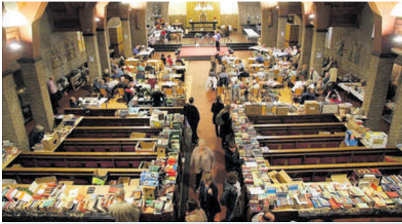
Gun boeken een tweede leven.

Santpoort-Noord – In het kader van het Pinkenweekend 2023 wordt op zaterdag 14 oktober van 9.00 tot 14.00 uur rond de Naaldkerk in Santpoort voor de 90ste keer een pinkenmarkt gehouden. Van oudsher wordt dit weekend