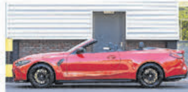
BMW 4-serie Cabrio M4 xDrive Competit € 159.000,-