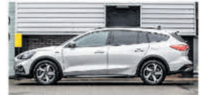
Ford Focus Wagon 1.0 EcoB. Tit. Bns € 24.900,-