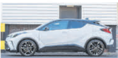
Toyota C-HR 2.0 Hybrid Bns GR S € 32.700,-