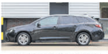
Toyota Corolla Touring Sports 1.8 Hybrid Active € 26.900,-