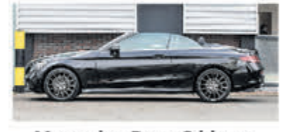
Mercedes-Benz C-klasse 220 d Cabrio Premium Pack € 39.950,-