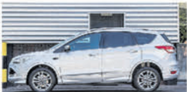
Ford Kuga 1.6 Titanium Pl. 4WD € 16.950,-