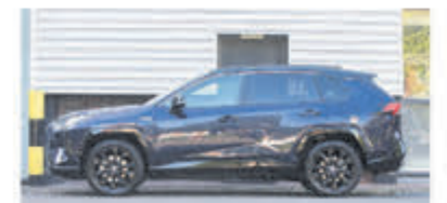
Toyota RAV4 2.5 Hybrid Executive! € 42.900,-

Autobedrijf Turenhout , de occasiondealer van Heemstede en al meer dan 40 jaar uw vertrouwde onderhoudsadres.