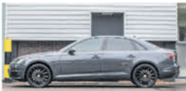
Audi A4 Limousine 2.0 TDI Sport L. Ed. € 19.850,-