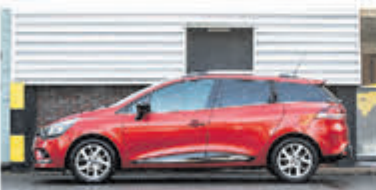
Renault Clio Estate 1.2 TCe Zen. € 15.950,-