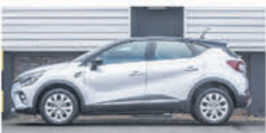
Renault Captur 1.6 Hybrid Intens € 28.950,-