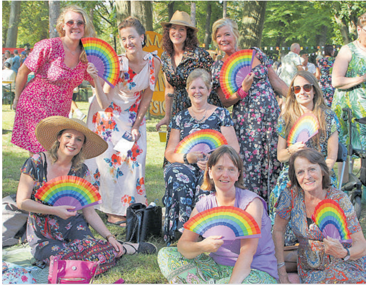
Regenboogwaaiers tegen de hitte.

Velsen - Meer dan zeventig culturele organisaties stonden vrijdag, zaterdag en zondag op de podia van de Summer Park Sessions in park Velsersbeek. Voor het eerst werkte men met twee podia, zodat een doorlopend programma kon worden aangeboden. Maar net als in vorige edities waren er ook een markt, diverse workshops en veel activiteiten voor kinderen. Nieuw was een expositie van beeldende kunst. Het is juist de veelzijdigheid van het aanbod, die ervoor moet zorgen dat de Summer Park Sessions nog groter gaan groeien.