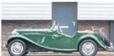
MG TD Roadster € 28.950,-