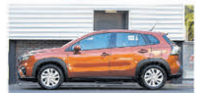
Suzuki S-Cross 1.4 B.jet Comfort SH € 28.950,-