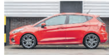
Ford Fiesta 1.0 EcoB. Active € 17.900,-