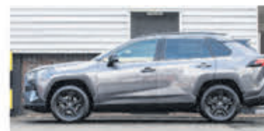
Toyota RAV4 2.5 Hybrid Dynamic € 36.900,-