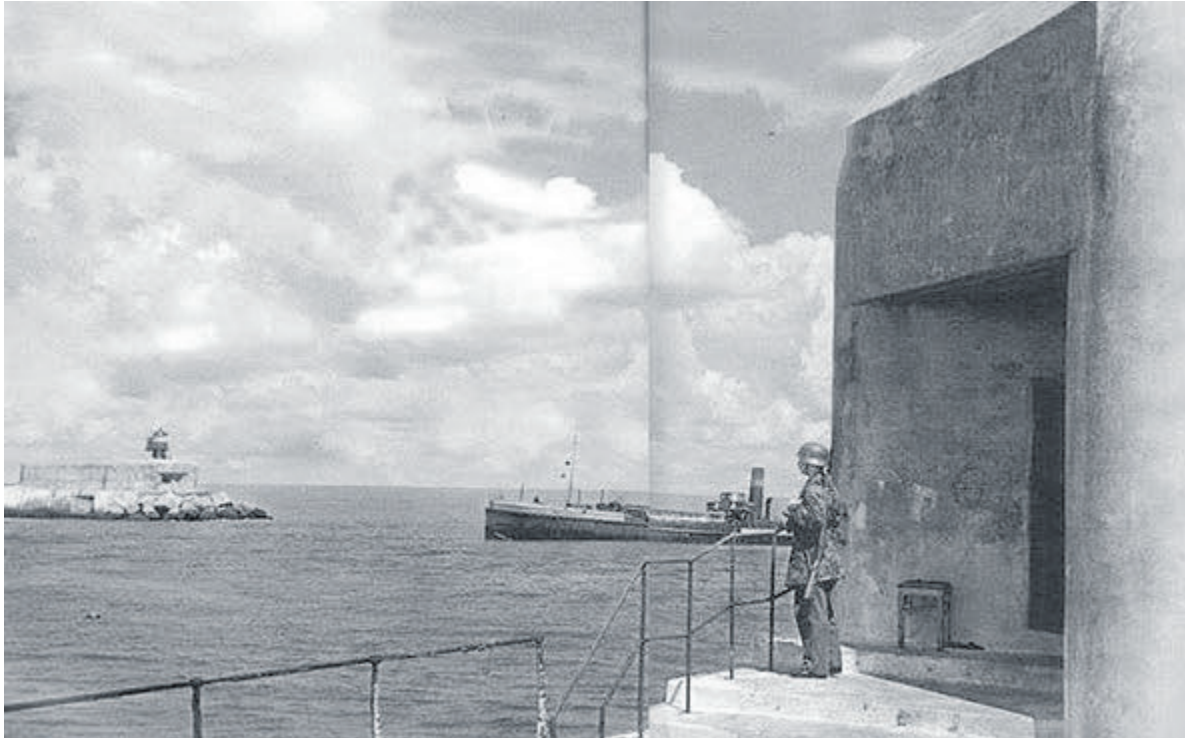
Een Duitse soldaat op de Noordpier, uitkijkend in de richting van de Zuidpier. Op beide pieren stond destijds een bunker van het type S.K. (Sonderkonstruktion), speciaal ontworpen om op de pieren te passen. In de bunker stond een snelvuurkanon van het type Festungspak, een wapen van Tsjechische makelij. Dit type kanon zou vrijwel elk type te verwachten schip kunnen laten zinken.

Met voormalig havenmeester Piet Dekker blikken we terug op de geschiedenis van de haven van IJmuiden. In het eerste deel (7 september 2023) hebben we het ontstaan van de haven toegelicht. In het tweede deel aandacht voor de situatie in de oorlogsjaren en de aansluitende periode van wederopbouw.