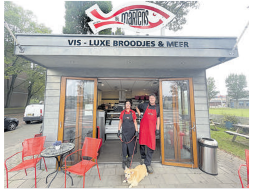
„We moeten wel kwaliteit leveren met die viskenners hier”.

winkel geworden. Er wordt onderling en met het team lekker gekletst en als het niet te druk is dan gaat dat gepaard met een 'koffietje', zoals Loes zegt. 'Een bakkie', dus. Loes: „Moet je je voorstellen, mijn man kreeg afgelopen januari een ongelukje. We werden overstelpt met lieve kaarten. Waar vind je dat?”