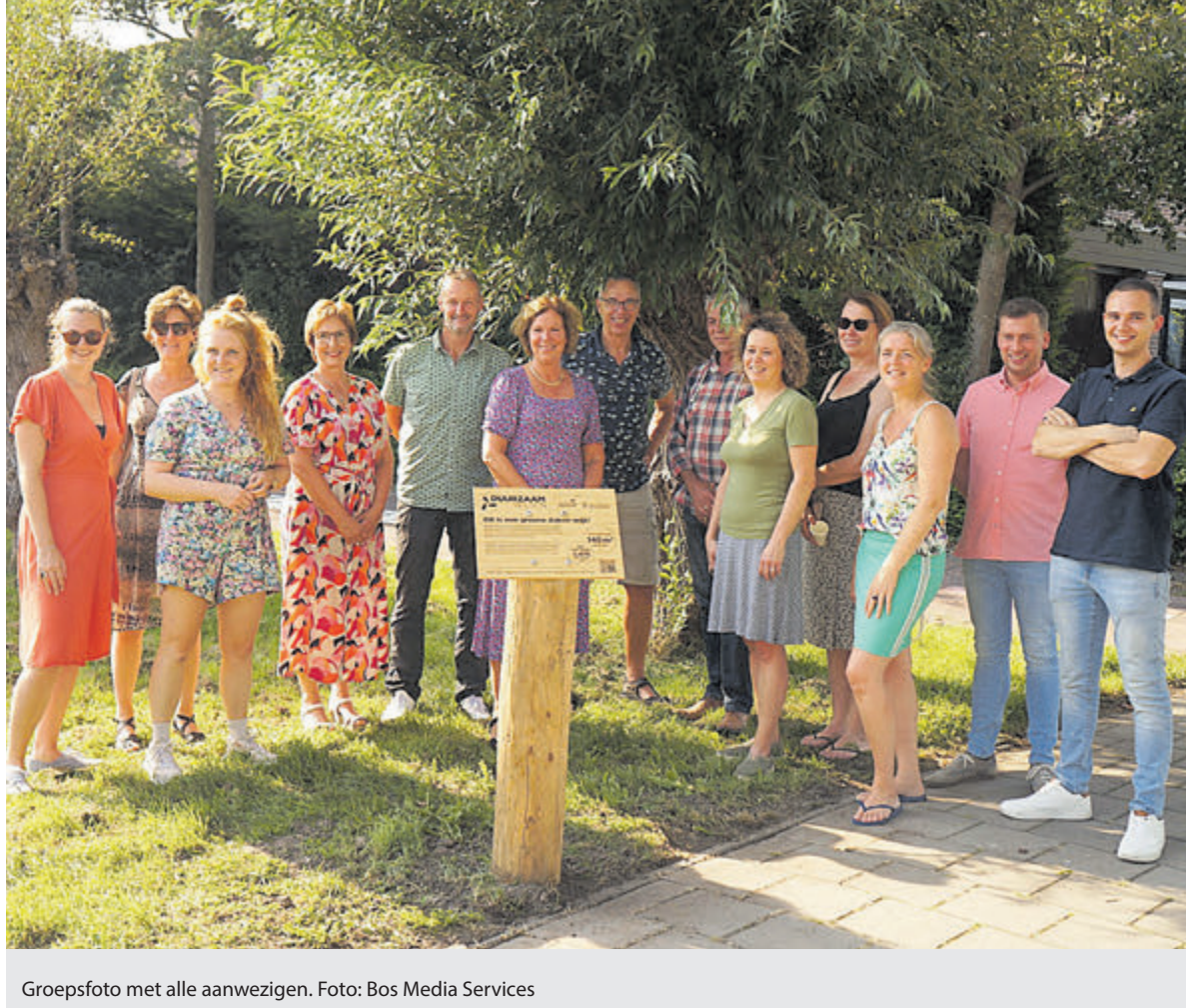
Groepsfoto met alle aanwezigen.

Velsen - Al 121 inwoners van de gemeente hebben inmiddels een zogenaamd groen dak. Dat is een dak waar plantjes op groeien. Eigenlijk een soort tuintje op je huis, vandaar dat de deelnemers de titel dakboswachter hebben gekregen. Samen hebben ze ruim zestienhonderd vierkante meter daktuin, waarmee ze bijdragen aan de biodiversiteit in hun woonwijken en tegelijk hun eigen huis beter beschermen tegen warmte en kou.