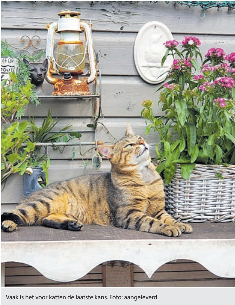
Vaak is het voor katten de laatste kans.

Velsen - Vrijwilligers van stichting Zwerfkatten havengebied IJmuiden verzorgen dagelijks zo'n 120 kansloze katten. Voorheen ging het vooral om het castreren en verzorgen van de vele zwerfkatten in de IJmuidense haven. Na 20 jaar is daar eindelijk het doel behaald en leven er geen zwerfkatten meer. De laatste oudjes zijn veilig overgebracht naar de opvang in Velsen-Noord.