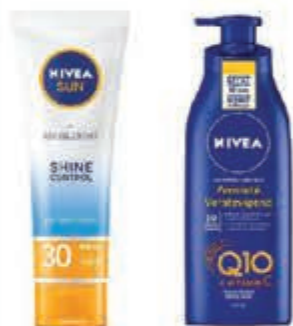
Nivea Compleet assortiment