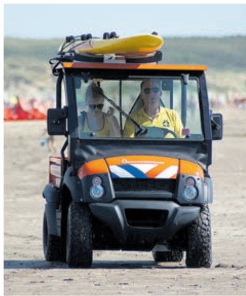
Ook aankomende week zijn de lifeguards weer paraat.

's Middags zijn lifeguards die een bewakingsronde reden snel te water gegaan voor twee zwemmers die in de problemen leken. De twee zwemmers konden niet heel goed zwemmen, maar konden zelfstandig terugkomen.