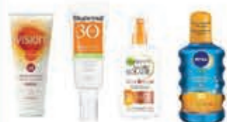
Ambre Solaire, Vision, Nivea Sun & Biodermal Sun