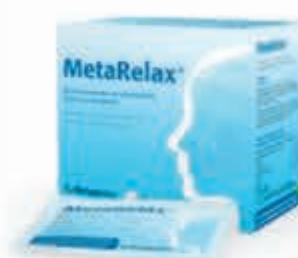
Metagenics Compleet assortiment