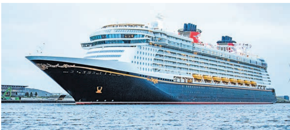
Bas fietste even op en neer naar Amsterdam om de Disney Dream vast te leggen.

Bent u ook geïnteresseerd in wonen in Missiehuis Park? Een toegewijd makelaarsteam staat klaar om al uw vragen te beantwoorden en u verder op weg te helpen. Bekijk hier het aanbod: https://www.missiehuispark.nl/aanbod/ .