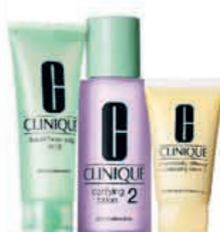
Clinique Compleet assortiment