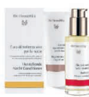
Dr. Hauschka Compleet assortiment