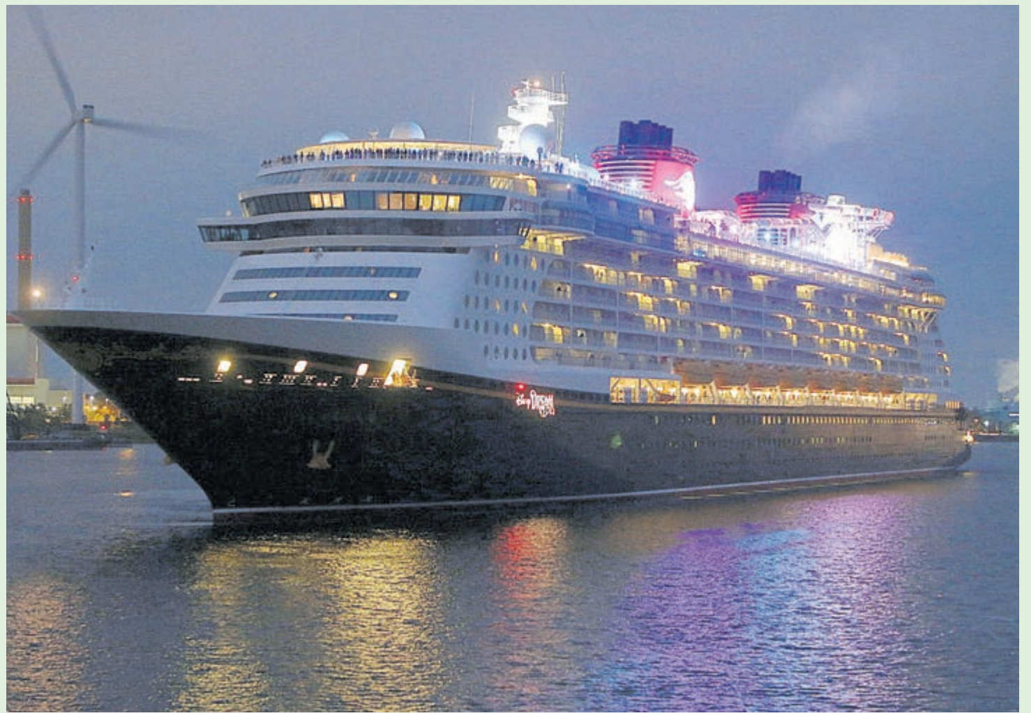
Het is inmiddels donker geworden als de Disney Dream op de Zeesluis IJmuiden afvaart, maar het duister en de verlichting versterken eigenlijk alleen maar de magie die rond dit pretpark-cruiseschip hangt!

Het is het eerste bezoek van de Disney Dream aan Amsterdam en ook de eerste keer dat we dit schip bij IJmuiden kunnen zien. Vorig jaar konden we de oudere en kleinere Disney Magic, ook voorzien van de witte Mickey Mouse oren op de rode schoorstenen, al 'ns bewonderen in de IJmondhaven. Pas drie dagen na de première bij IJmuiden zal de Disney Dream voor de eerste keer in Rotterdam aanleggen, dan komende vanuit het Engelse Southampton en onderweg naar de Noorse Sognefjord.