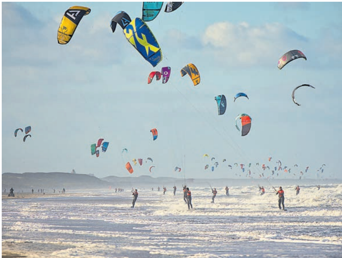
Hoek tot helder doet uiteraard ook IJmuiden aan en is een spectaculair gezicht! Overigens kan de redactie niet zien of deze foto op ons strand is genomen maar dat zullen de kenners ongetwijfeld wel weten.

heel druk heeft. Thuisafspraken voor hulpmiddelen hebben soms wel tot twee weken wachttijd. Hans: „Ook wil ik de mensen laten weten dat ik of een collega op de eerste dinsdag van de maand op de markt in Velsbroek sta. Op de tweede woensdag op de markt in Beverwijk, de derde donderdag van de maand dus op de markt in IJmuiden en de vierde vrijdag van de maand op de markt in Heemskerk.”