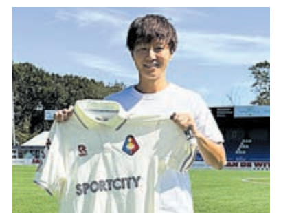
Met het aantrekken van de Japanse spelverdeler heeft Telstar de selectie voor het komende seizoen rond.

mogelijk verwerven van de teamtactiek en het team te helpen verbeteren en de nieuw gestelde doelen voor het komende seizoen te bereiken. Ik beschouw mezelf als een teamspeler met een aanvallende stijl en ben van plan bij te dragen met doelpunten en assists.”