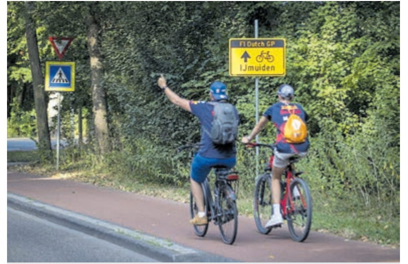
Speciale routekaart voor racefans die op de fiets naar de Dutch Grand Prix gaan.

Hij sluit het gesprek af met: „Ik ga -als het lukt want ik werk bij een supermarkt- het liefst elke dag op pad. Ik heb een app op mijn telefoon waarop ik zie wat er gebeurt. Momenteel is er een grote bulkcarrier onderweg naar Amsterdam.” Dus hij springt weer op de fiets.