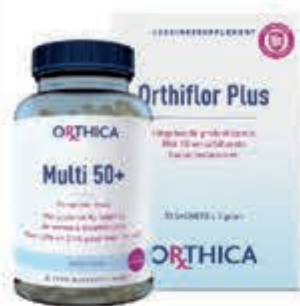
Orthica Compleet assortiment