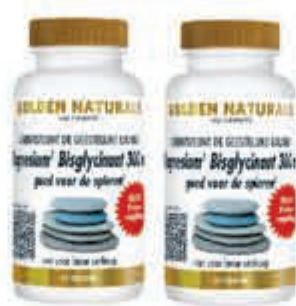
Golden Naturals Alle magnesium