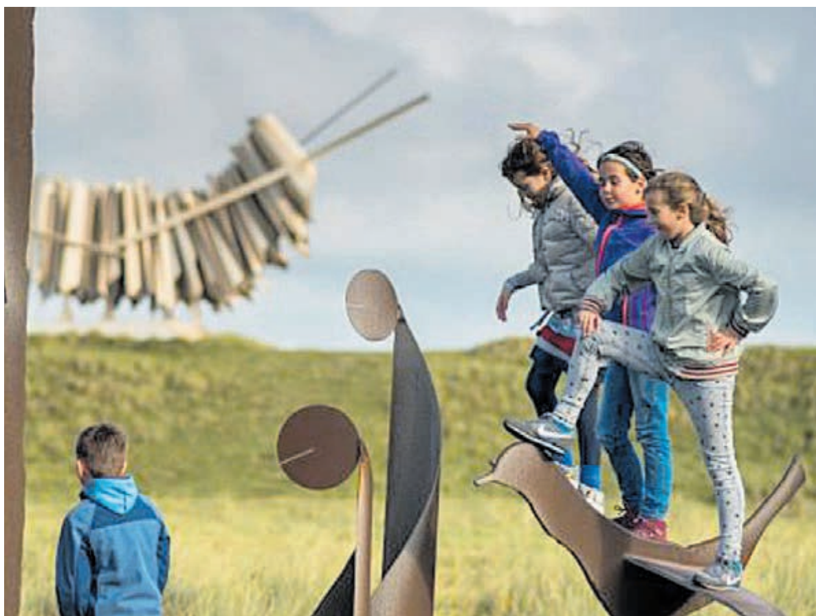
Op avontuur tussen de monsterlijke beelden van staal.

ook veel aandacht besteed aan de sluisen. Of loop mee met een sluiswandeling. Reserveren voor een sluiswandeling is verplicht en kan via de museumwebsite. Voor kinderen altijd vier speurtochten. Het museum is tot en met 1 september geopend op woensdag tot en met zondag van 13.00 tot 17.00 uur. De vrijwilligers verwelkomen u graag. Museumkaart geldig. Adres: Havenkade 55, IJmuiden.