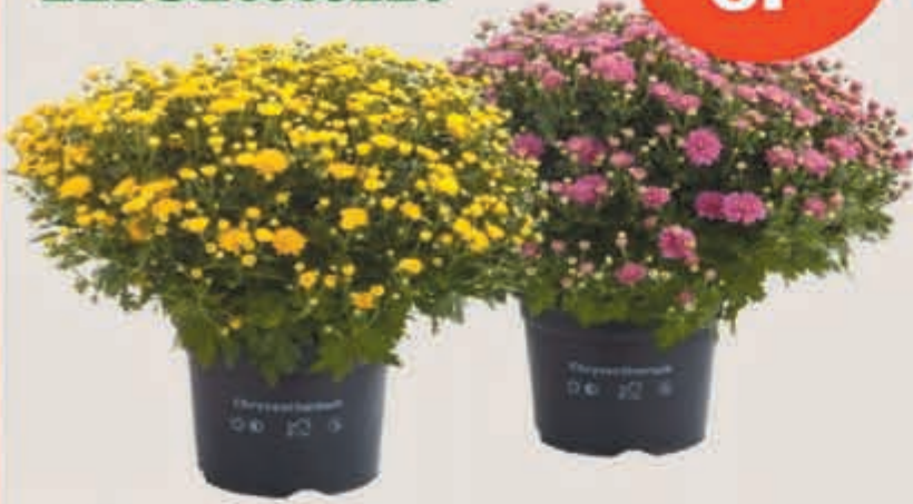
Bolchryasant Ø 19 cm