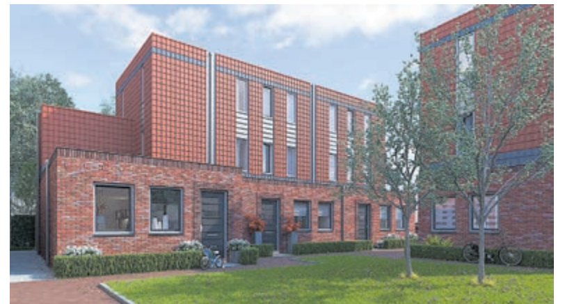
: Er zijn nog enkele woningen beschikbaar op deze unieke locatie.

Er wordt geprobeerd bij de indeling zoveel mogelijk rekening te houden met deelname aan KNLTB-najaarscompetitie of eventuele andere toernooien. Meer informatie via go@tcdegieteling.nl .