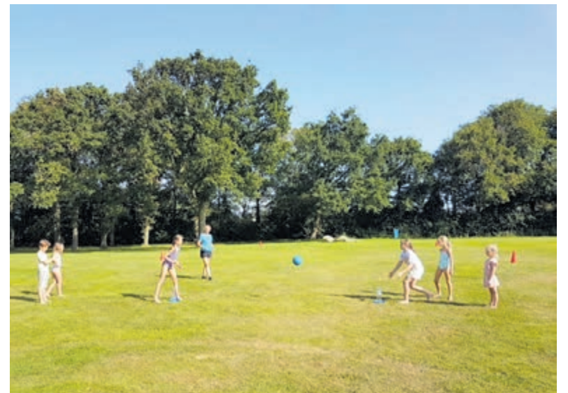
Zomerpret blijkt echt een enorm succes te zijn.

Bezoek aan de katten is niet mogelijk, vanwege de verwachte drukte. Daarom wordt ook verzocht op de fiets te komen, of te parkeren langs de Hoflaan. „We hopen onze enorme voorraad kwijt te raken, zodat er weer ruimte vrij komt in onze huizen“, grinnikt Manon. „De Verkoopgroep bestaat in september drie jaar en heeft al ruim 22.000 euro opgebracht. We zien dit echt als winst situatie. De verkopers zijn hun overbodige spullen kwijt, de kopers zijn blij met hun nieuwe aanwinst, er worden spullen hergebruikt in plaats van weggegooid en de opvangkatten blijven verzekerd van alle zorg die nodig is.“