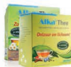
Alkavitae Compleet assortiment