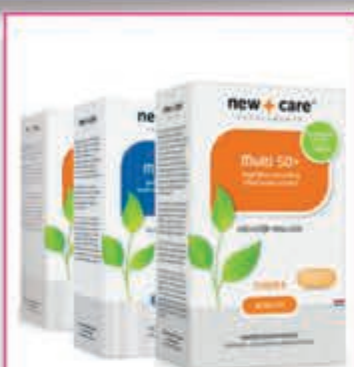
New Care Compleet assortiment

Alkmaar • Bergen • Beverwijk • Castricum • Heemskerk • Santpoort-Noord • Uitgeest • Wormerveer