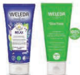
Weleda Compleet assortiment