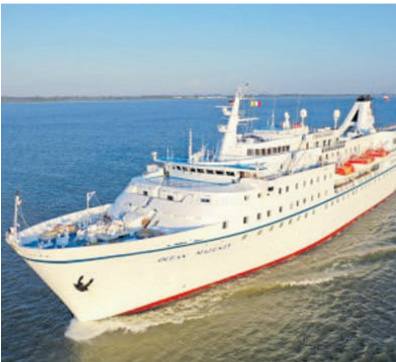
De Ocean Majesty zal naar verwachting vanaf eind augustus operationeel zijn.

Een papieren versie van de overige bekendmakingen ligt bij: Gemeentehuis Velsen, Dorpshuis Het Terras, Buurtcentrum De Dwarligger, Buurthuis De Brulboei, Wijkcentrum De Stek, Wijkcentrum De Hofstede, Bibliotheek IJmuiden, Bibliotheek Velsbroek, uitleenpunt Huis ter Hagen en uitleenpunt de Moerberg. Voor de inzage van stukken kunt u naar het gemeentehuis.