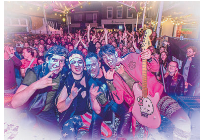
Ook 's avonds was de sfeer top!

troffen die als steekwapen gebruikt kunnen worden en twee boksbeugels. Gedurende het hele dorpsfeest zijn in totaal zeventien gebiedsverboden opgelegd door de burgemeester. Dit betekende dat deze personen gedurende de rest van het dorpsfeest niet meer binnen het veiligheidsrisicogebied aanwezig mochten zijn. Het uitgangspunt is dat het gebiedsverbod voor deze personen ook volgend jaar voor hen geldt voor alle dorpsfeesten in Velsen. Daarnaast legde de organisatie van het dorpsfeest in totaal zeven evenementenverboden op. Dit betekende dat deze personen gedurende het dorpsfeest niet meer op het terrein van het dorpsfeest mochten komen. Burgemeester Frank Dales: „De diverse fouilleeracties van de politie werden goed ontvangen door de bezoekers en gaven hen een veilig gevoel. Ik ben tevreden over het verloop van de afgelopen week en kijk alweer uit naar het volgende dorpsfeest in Santpoort.”