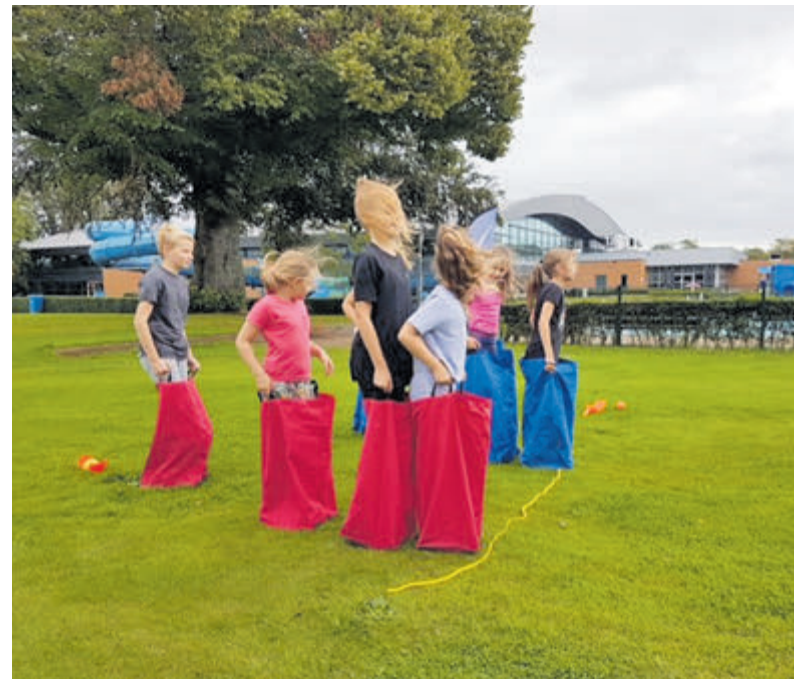
Zaklopen blijkt toch nog een kunst! Foto: Arita Immerzeel

De handicap van Florianne is gekwalificeerd als S9. Ze heeft minder coördinerend vermogen en moeite om haar evenwicht te houden. Dat komt mede door de spierspanning die niet altijd onder controle is. Het is een lichamelijke beperking en zeker niet een mentale kwestie. De selectie voor Parijs wordt later bekend gemaakt. Die bepaling gaat via een ingewikkeld toekenningsstelsel. Tot die tijd bereidt Bultje zich voor op de kwalificatiemomenten bij het High Performance Center in Amersfoort. Bron: Team NL. Foto: KNZB