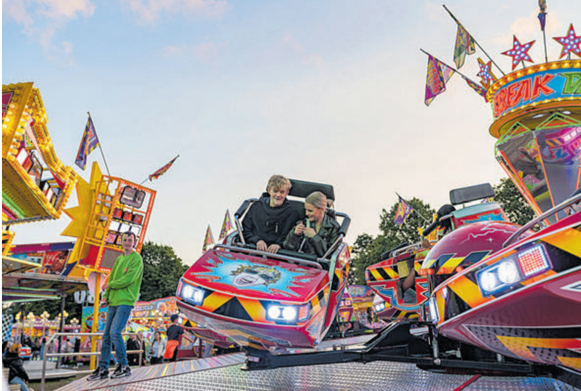
Veilig plezier gemaakt door iedereen.

Santpoort - De 264ste editie van het Dorpsfeest Santpoort was er eentje zoals het hoort: een week met bijna 40 evenementen waarbij saamhorigheid voorop stond. Niet voor niets was het thema dit jaar 'Blik voor elkaar'. Jong en oud genoten volop van alle festiviteiten.