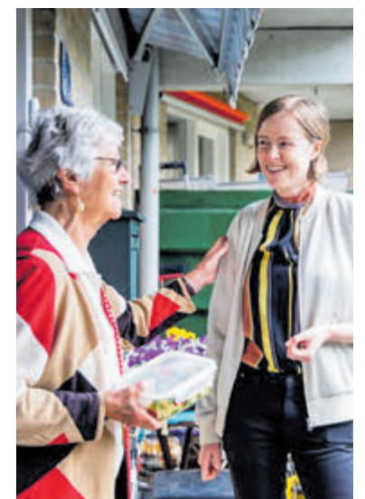
Vrijwilligerswerk vanuit je eigen huis met iets wat je toch al elke dag doet: ideaal!

Stichting Thuisgekookt koppelt hen aan een passende thuishokk die één of twee keer per week kookt. Deze thuishokk woont in de buurt, kookt vrijwillig zodat je alleen de kosten van de ingrediënten betaalt, houdt rekening met smaak- en dieetwensen en kan de maaltijd komen brengen. Zo gaan we terug naar wat vroeger heel normaal was: buurtgenoten die voor elkaar zorgen.