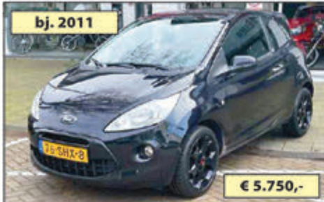
FORD KA 1.2 METAL 5/5