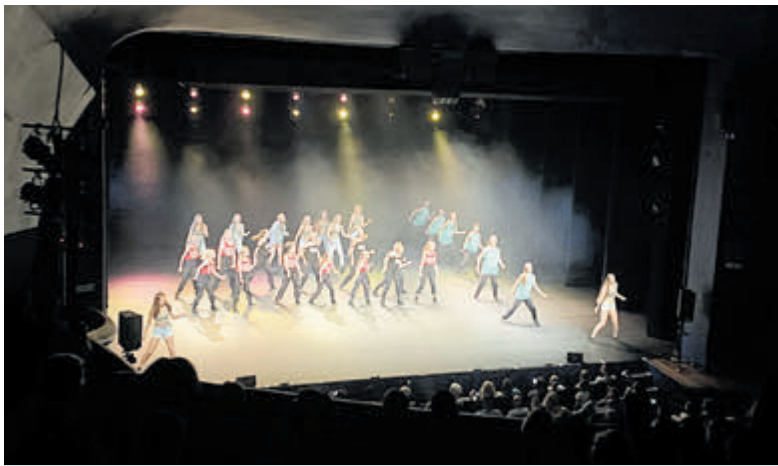
Wat waren de dansers aan het stralen!

Groep B: start om 11.00 uur in Oud-Velsen en volgt hetzelfde programma alleen in omgekeerde richting uiteraard. Om 11.00 begint de rondleiding door en om de kerk. Vanaf 12.00 uur is er in de kerk gelegenheid om een lekker broodje en koffie of thee te kopen. Rond 13.00 uur wandelen we met de gids, via de tuinen naar Museumhuis Beeckestijn, waar om 14.00 de rondleiding start. Deze eindigt om 15.00 uur. U kunt dan op eigen gelegenheid weer terug naar Oud-Velsen. Deelname aan een van de rondleidingen kost 10,00 euro per persoon (exclusief lunch). Aanmelden kan via: www.engelmunduskerkoudvelsen.nl .