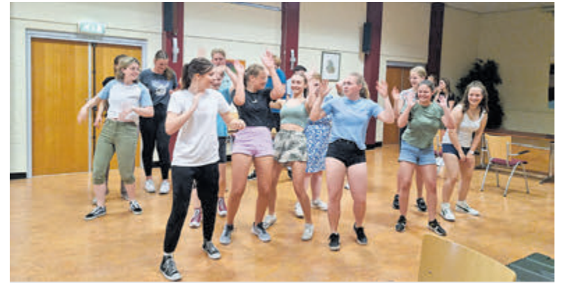
Een geslaagde eerste doorloop van All Shook Up door de Jonge Stem.

Er zijn jongen geboren in de grote veldbroedplaats van een meeuwenkolonie op de kop van het eiland, dat gedeelte is daarom niet toegankelijk voor publiek. Maar er blijft genoeg moois te zien en te ontdekken. Meer informatie: www.ijmuidenserondvaart.nl . Er is één afvaart op woensdag: 12.45 uur. Om 15.15 uur vaart u terug.