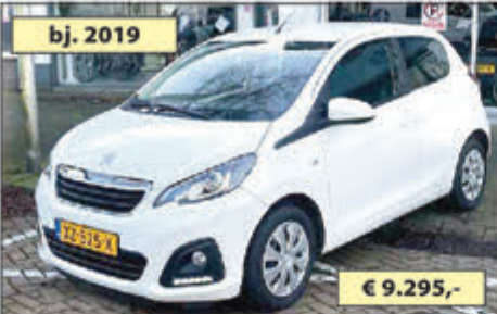
PEUGEOT 108 1.0 E-VTI