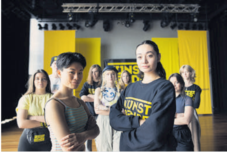
Steun je club of vereniging.

Velsen - Iedereen verdient een club! Een plek waar je elkaar ontmoet, elkaar sterker maakt en helemaal jezelf kunt zijn. Daarom ondersteunt de coöperatieve Rabobank al 20 jaar verenigingen door heel Nederland. Vanaf 29 mei kunnen clubs zich weer inschrijven om mee te doen aan de stemcampagne van Rabo ClubSupport, inschrijven kan tot en met 22 augustus 2023. Daarna krijgen Rabobank leden de kans om te stemmen op hun favoriete club.