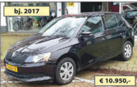
SKODA FABIA 1.0 ACTIVE