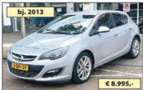
OPEL ASTRA 1.4 T