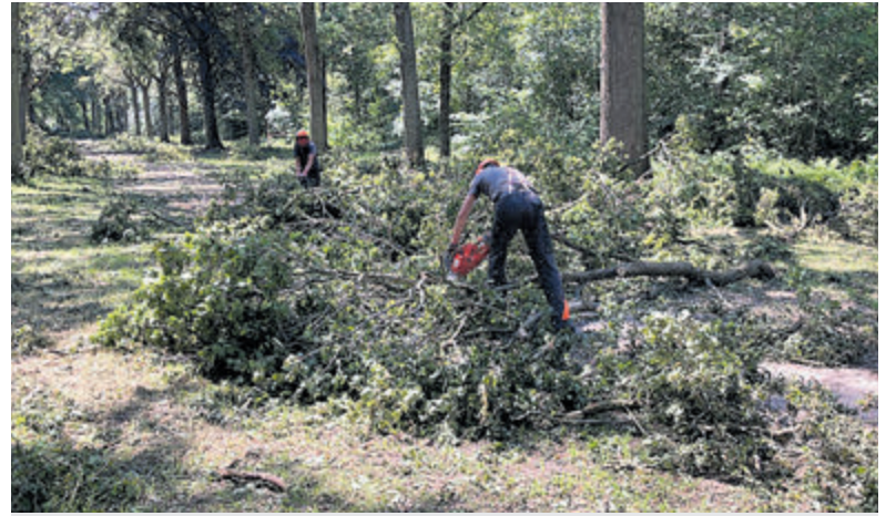
De dagen direct na de storm is met hulp van een flinke groep boswachters uit het land en vrijwilligers begonnen met het opruimen van omgewaaide bomen.

ISBN: 978-94-646-8848-1, Aantal pagina's: 36, Prijs: 16,50 euro, incl. verwerk- en verzendkosten naar Nederland en België. Binnenkort ook verkrijgbaar via Bol.com.