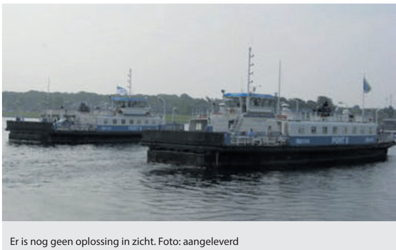
Er is nog geen oplossing in zicht.

IJmuiden - De afgelopen jaren heeft er in verschillende vormen tijdelijk een tweede pont gevaren in Velsen. Dit is een groot succes. Dagelijks steken zo'n 5.000 fietsers het Noorzeekanaal over met de pont. Dat een structurele tweede pont voor de bereikbaarheid van de IJmond noodzakelijk is, wordt breed gedragen. Provincie Noord-Holland ondersteunt nadrukkelijk de noodzaak en heeft hier geld voor gereserveerd.