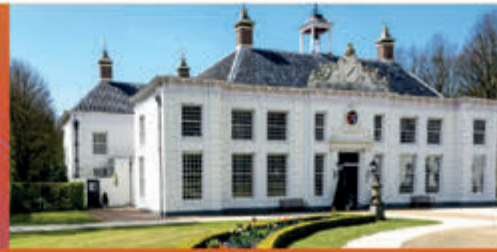
Rondleiding door hoofdhuys en tuinen Buitenplaats Beeckestijn - 16 juli