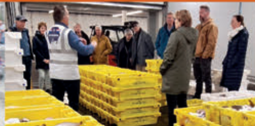
Rondleiding Visafslag IJmuiden Visafslag IJmuiden - 20 juli