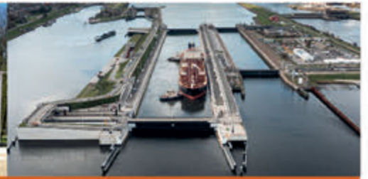
Rondleiding Zeesluis IJmuiden Zee- en Havenmuseum - 18 juli