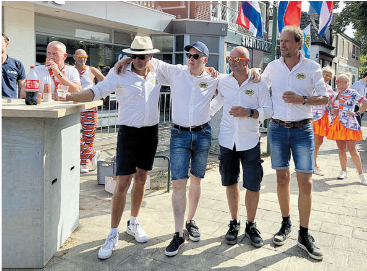
Een bewogen afscheid van het oude bestuur.