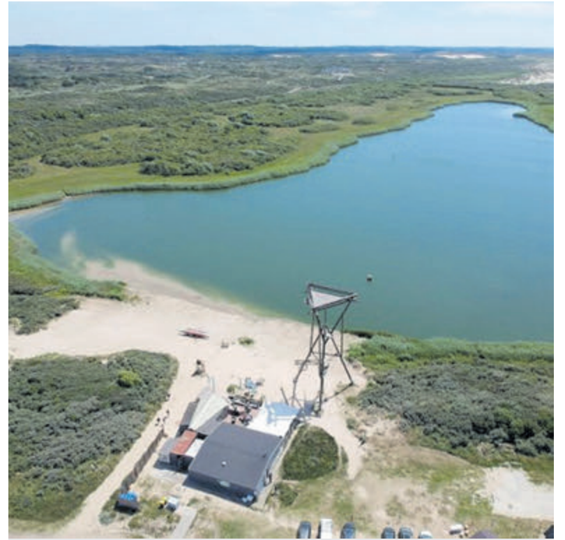
De tocht voert langs de bunkers.

Meer weten en aanmelden: https://loveittrailit.nl/blogs/events/run-the-festung .