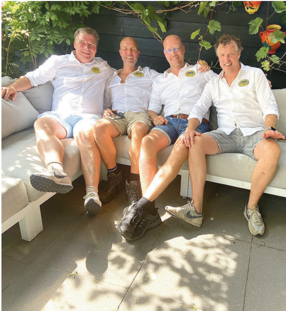
Het nieuwe bestuur vindt voor de drukte echt losbarst even tijd om zich voor te stellen.