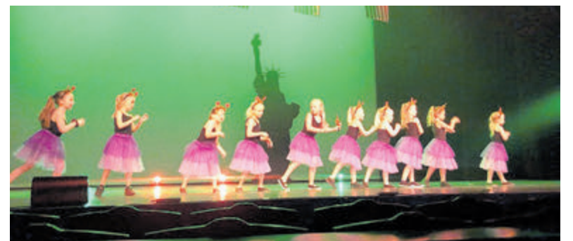
Het werd een spectaculair optreden van Footloose.

twee keer opgetreden tijdens het Summerparksfestival en op 17 september tijdens de reünie van het 70-jarig bestaan van De Jonge Stem dat gevierd gaat worden in De Wildeman in Santpoort. Wil je alvast een voorproefje kom dan kijken op het festival of meld je aan voor de reünie. Voor alle oud-leden: houd deze datum vrij vanaf 16.00 uur. Meer informatie volgt via de socials (Facebook, Instagram).