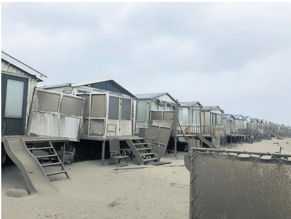
Er waren geen persoonlijke ongelukken maar de schade is gigantisch.

IJmuiden aan Zee - Woensdag woei de wind in Noord-Holland met ongekende kracht, ook over de strandhuisjes op het grote strand. Het werd zelfs windkracht 11 met ongekende windstoten.