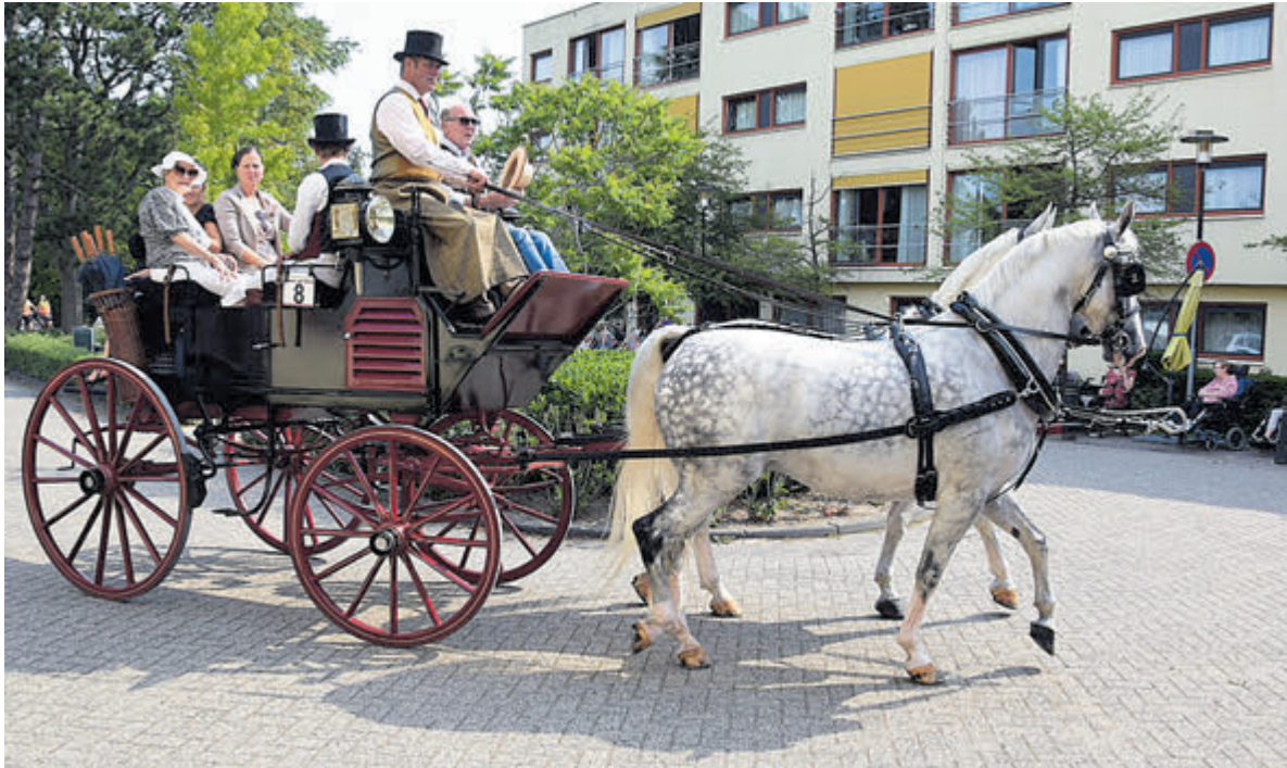
Een prachtig schouwspel onder een stralend zonnetje.