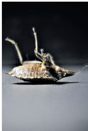
Laat de vakantiepret niet vergallen maar wees wel alert.

Ontdek je na thuiskomst bedwantsen? Aarzel dan niet en neem direct contact op met een professionele ongediertebestrijder om het probleem grondig aan te pakken. Zelf bedwantsen bestrijden is namelijk onbegonnen werk. Voor meer informatie of professioneel advies, kijk op Beestjeskwijt.nl .