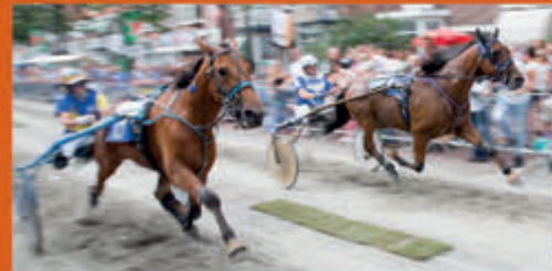
Zomerfestival IJmuiden.nl Kennemerlaan - 19 t/m 23 juli