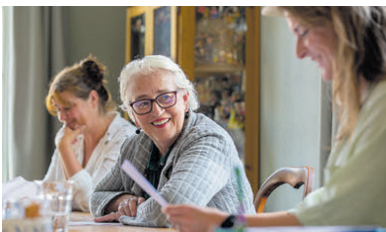
Samen lezen is goed voor je taalbeheersing en sociale contacten.

Solo-expositie met lenticulaire fotografie van Iris Planting. Gratis te bezoeken in de weekenden tot en met 30 juli. Zaterdag van 11.00 uur tot 17.00 uur, zondag van 12.00 tot 17.00 uur (behalve zondag 16 juli.)