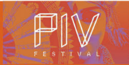
PIV Festival De Ven Spaarnwoude - 15 juli

Kijk voor alle evenementen en activiteiten in de gemeente Velsen op www.ijmuiden.nl/uitagenda