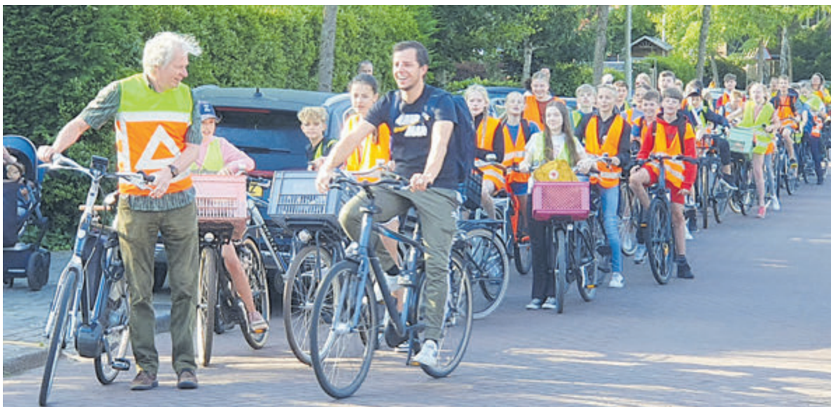
De volgende dag vertrokken alle groep 8-ers van de Parnassiaschool alsnog op de fiets naar Hoeve Vreedesteijn in Egmond Binnen.

modal shift." De afdeling Fietsersbond Velsen maakt deel uit van de Fietsersbond Regio Haarlem. Zij komt op voor de belangen van de fietsers in Velsen-Noord, Velsen-Zuid, Velsbroek, Santpoort-Noord, Santpoort-Zuid, IJmuiden en Driehuis. Dat doen zij door betrokken te zijn bij nieuwe plannen van de gemeente, maar ook door zelf knelpunten aan te dragen en zo nodig door actie te voeren. Ook proberen ze het fietsen in onze omgeving veilig en comfortabel, en dus aantrekkelijk te maken.