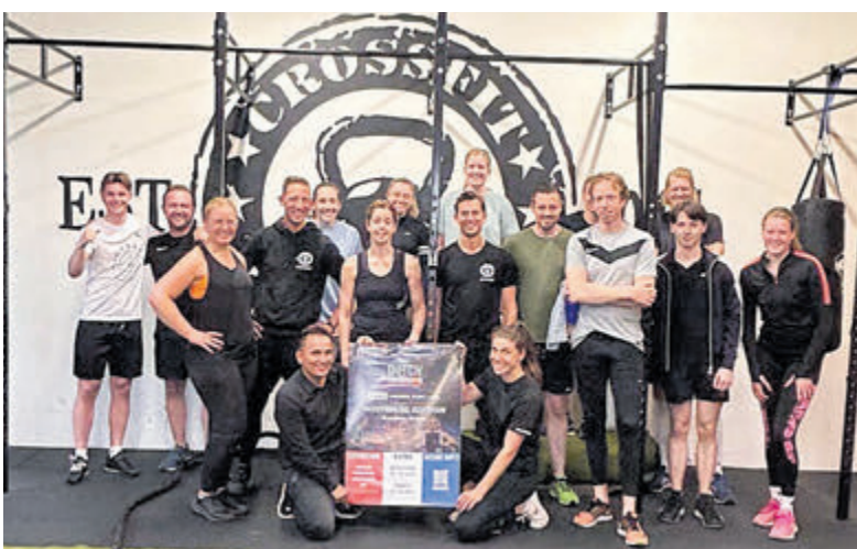
Al die zweetdruppels waren niet voor niets.

was een groot feest! Nu is het tijd voor nog een gezellig afsluitend festival in nog één keer de vertrouwde zaal in het Polderhuis in Velsersbroek. In de zomervakantie staat namelijk een grote verbouwing op de planning en zal Feel Good Moves voortaan een eigen mooie danszaal in het Polderhuis krijgen.