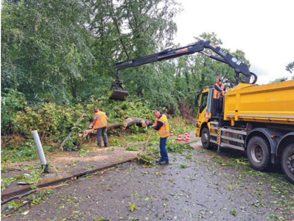
De buitendienst van gemeente Velsen is samen met externe bedrijven druk bezig met opruimwerkzaamheden na storm Poly. Duidelijk is geworden dat bomen instabiel zijn. Daarom blijft de noodverordening van kracht tot uiterlijk 21 juli voor de gemeentelijke parken.