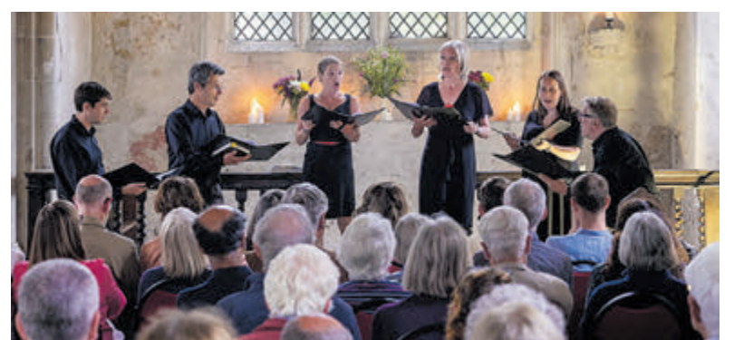
Ervaar op 16 juli Engelse traditionele koorzang door het Engelse koor Cambridge Vocal Consort.

Bij Watervrienden IJmuiden wordt opgeleid voor het nationale ZwemABC. Ook is er een speciale groep voor kinderen van 7 tot 12 jaar, die om wat voor reden dan ook nog geen zwemdiploma hebben gehaald. Zij kunnen in kleinere groepen en op hun eigen niveau starten met de zwemlessen. Voor meer informatie kijk op www.watervriendenijmuiden.nl .