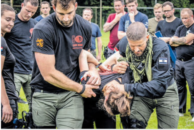
Een geslaagde training gericht op het overmeesteren en arresteren van verdachte personen.