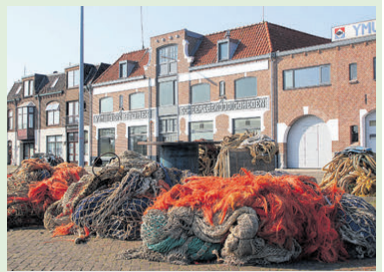
Typisch IJmuider kaaivulling op de Trawlerkade.