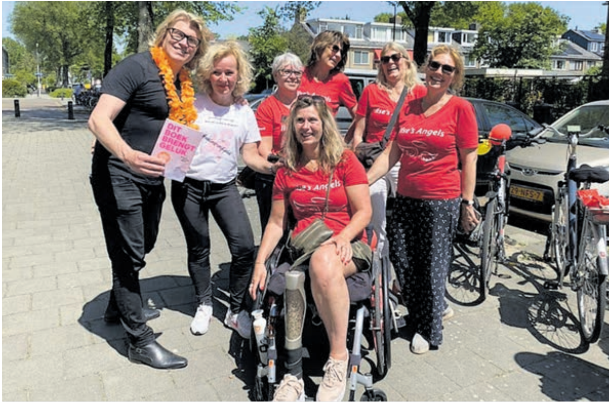
Het was een hele fijne zonnige bijeenkomst waarbij Hans Klok geen act opvoerde, maar zijn persoonlijke verhaal deed.