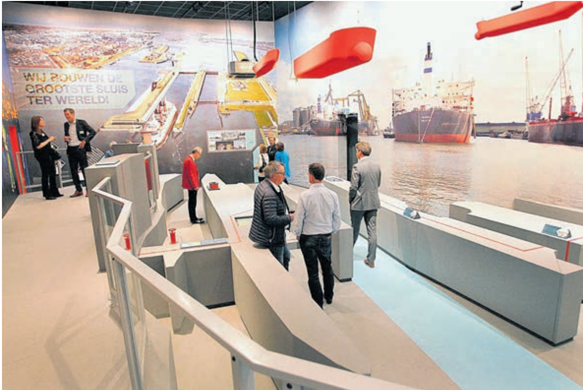
SHIP toont op dit moment parallel aan de vaste opstelling een expositie over selectieve onttrekking in samenwerking met Rijkswaterstaat.