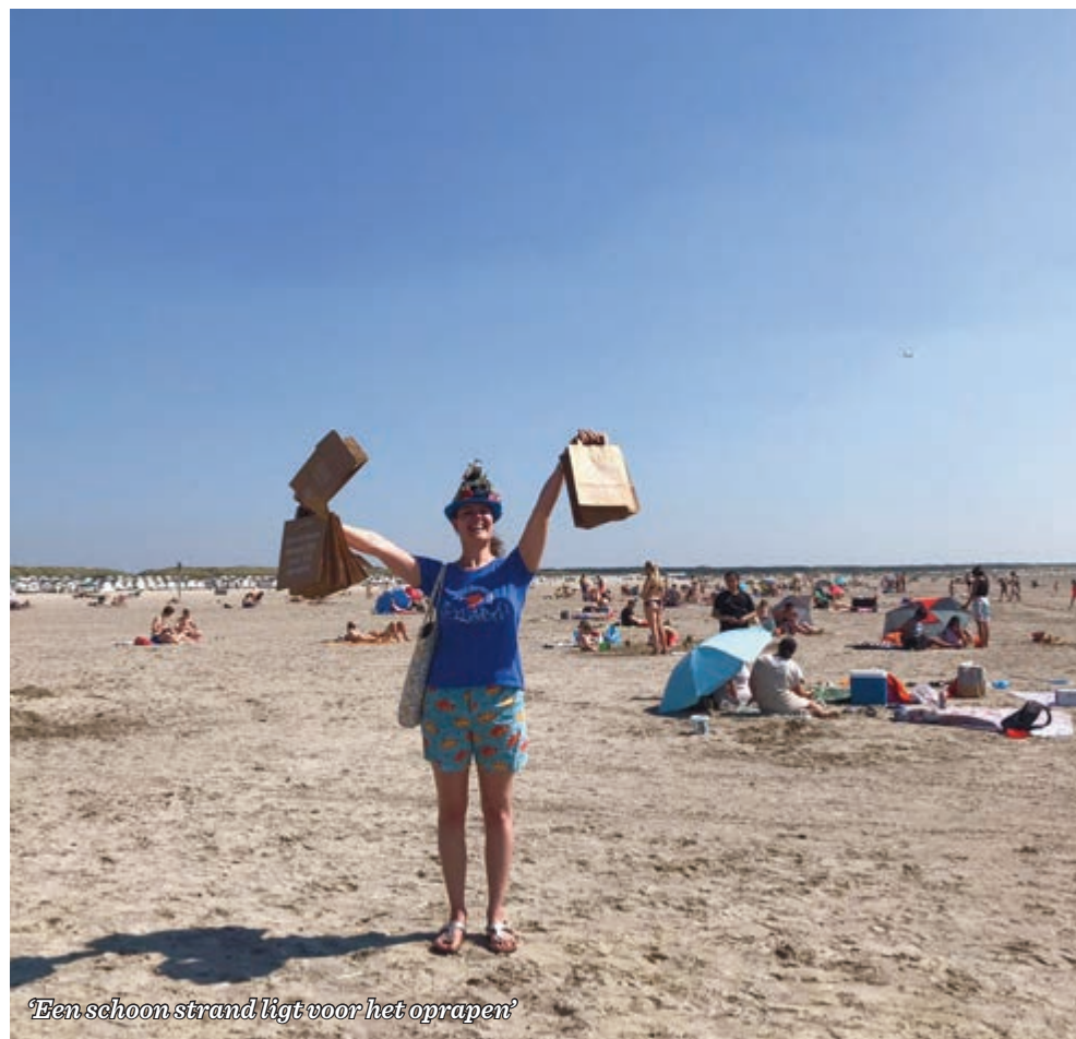
'Een schoon strand ligt voor het oprapen'

uit aan bezoekers. Hiermee konden zij afval naar de prullenbakken brengen. Deze 'Nederland Schoon' zakjes staan in Velsen bij elke strandopgang en kunnen bezoekers gratis pakken. Veel bezoekers wisten dat of hadden zelf al een vuilniszak meegenomen.