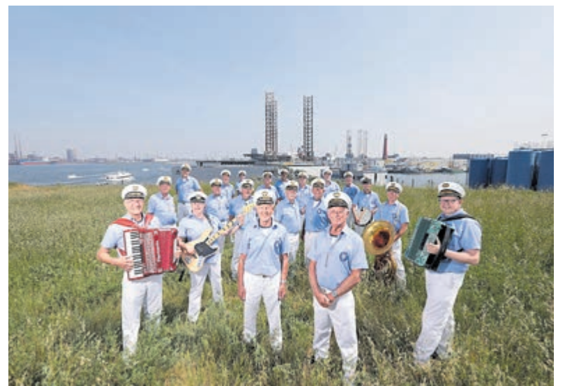
Het is volgens de Raddraaiers wel weer nodig om de kelen te smeren.

rijk tot arm) en liggen verspreid over heel Nederland. Je beleeft de Museumhuizen op een unieke wijze: door al je zintuigen in te zetten; heel anders dan door vitrines kijken en achter koordjes blijven staan. Hoe klonk Den Haag in 1904? Hoe ruikt het in de keuken van Jugendstil villa Rams Woerthe? Ga zitten op de rococo stoelen en maak de deurtjes van de kussenkast (voorzichtig) open. Kijk op www.museumhuizen.nl voor tickets en openingstijden.