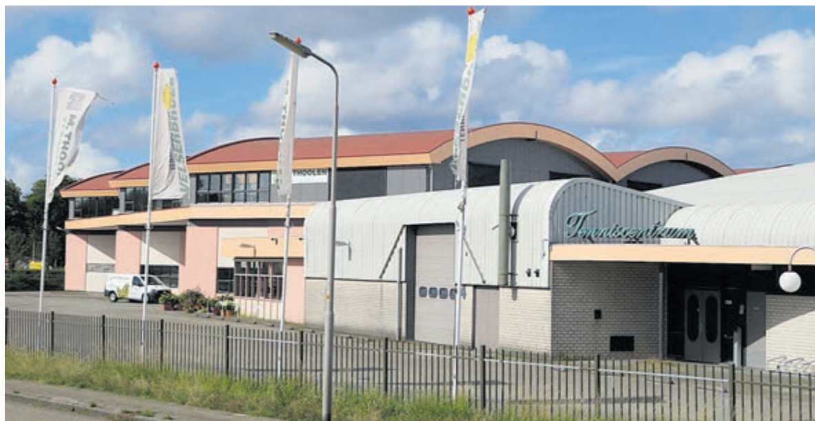
Er is geen plaats meer voor tennisliefhebbers in deze hal.

Via een mededeling op de eigen website van het tenniscentrum dankt het bedrijf de tennissers voor de gezellige jaren.