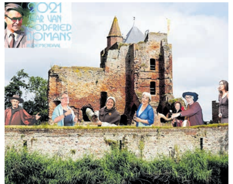
Het verhalenweekend staat in het teken van Godfried Bomans.