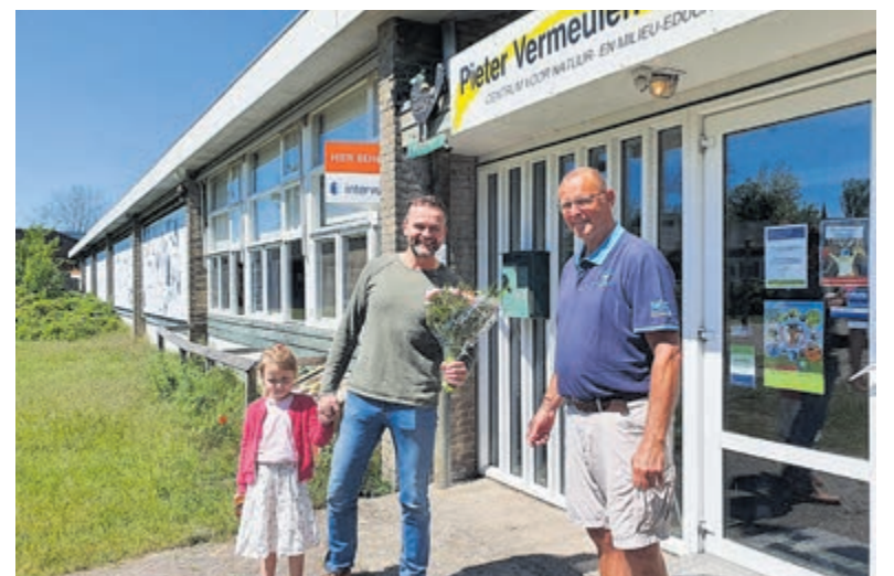
De eerste bezoekers werden feestelijk onthaald.

De digitale collecte is nog tot eind juni. Op de website en Facebookpagina van Rode Kruis IJmond kunt u een donatie doen in de digitale collectebus of via https://rodekruis.digicollect.nl/ rode-kruis-afdeling-ijmond