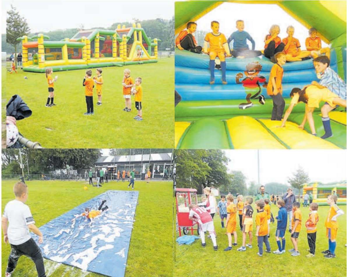
Er werd volop genoten van het oranje festival bij v.v. IJmuiden.