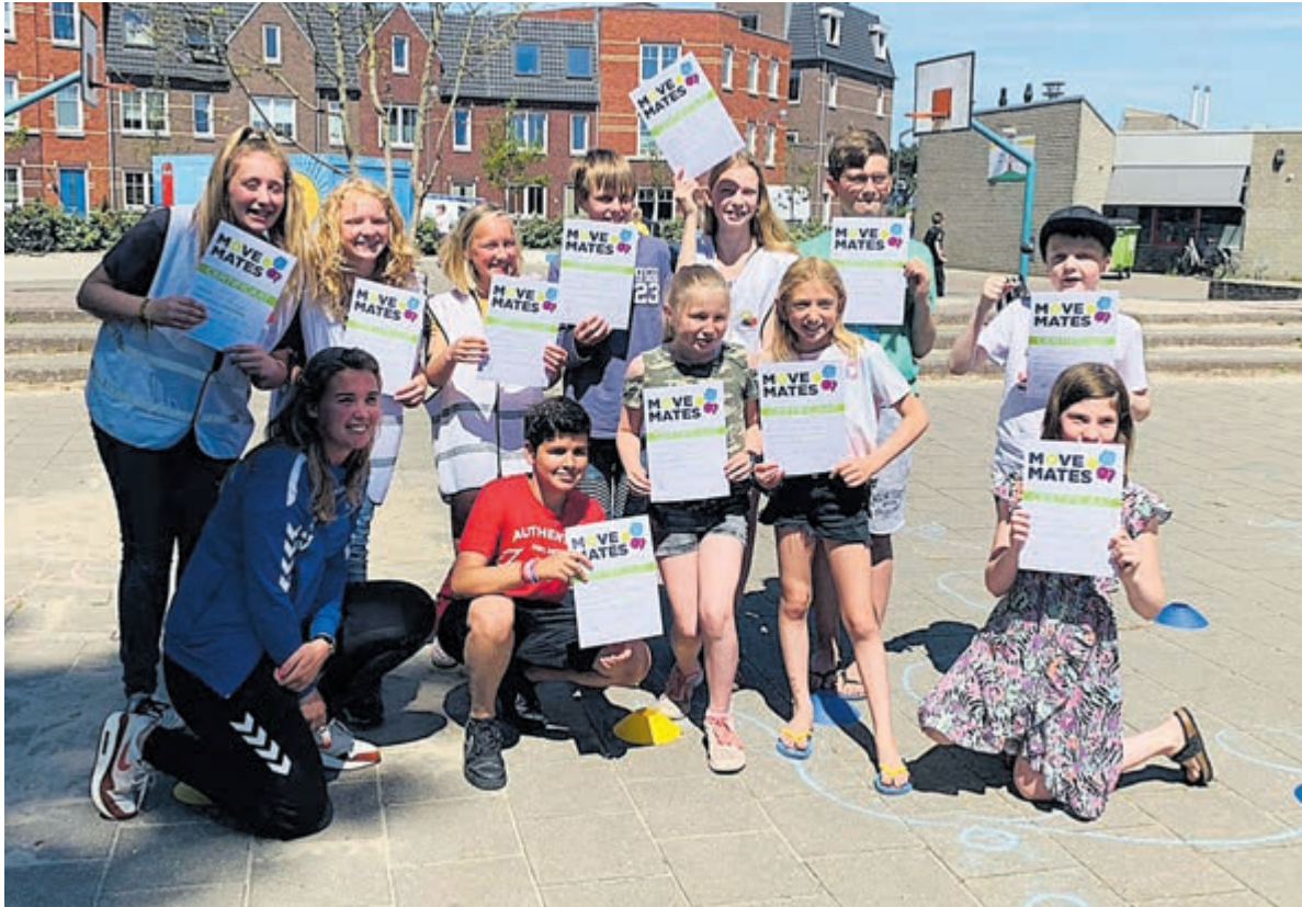
Met de Move Mates probeert de school eigen leerlingen in te zetten om de kwaliteit van de pauze en andere schoolgerelateerde activiteiten te verbeteren.