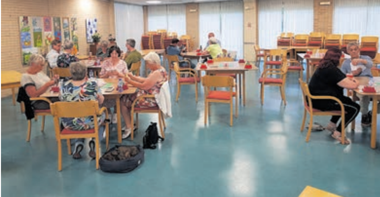
Bij De Jump is vol enthousiasme begonnen aan de zomercompetitie.