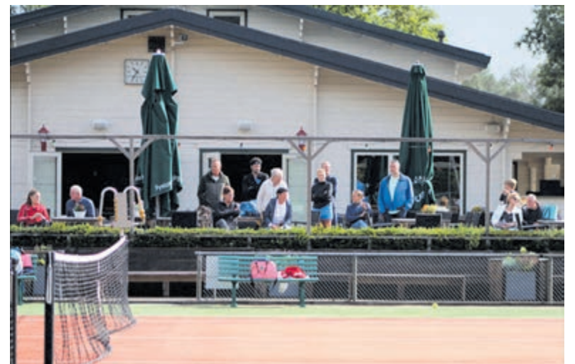
Ook niet-leden mogen meedoen aan de zondagscompetitie in de winter.

Deze winter koppelcompetitie is geen KNLTB competitie en is toegankelijk voor zowel leden als niet-leden van LTC Hofgeest. Er wordt gespeeld op 11 zondagmiddagen in de winter. De wedstrijden duren een uur. Je slaat 10 minuten in en speelt 25 minuten vanaf de ene helft van de baan en 25 minuten vanaf de andere helft van de baan. Per gespeeld uur kun je maximaal 12 punten halen. De deelnemers worden op sterkte ingedeeld. Na afloop kun je gezellig een