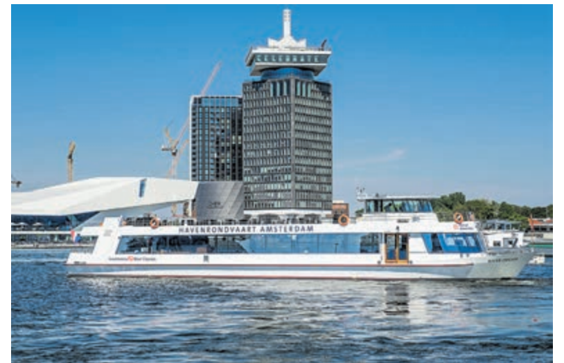
De Havenrondvaart Amsterdam moet uitgroeien tot een nieuwe attractie voor bewoners in de Metropool Regio Amsterdam, Nederland en toeristen uit het buitenland.

Initiatiefnemers van de Havenrondvaart Amsterdam zijn Port of Amsterdam, havenpromotie-organisatie Amports en Amsterdam Boat Cruises. De rederij neemt op dit moment per rondvaart maximaal 50 personen mee aan boord. Bij versoepeling kunnen dit er meer worden. Amsterdam Boat Cruises biedt de rondvaart door de haven drie keer per week aan. Vertrek- en eindpunt van de twee uur durende tour is de NDSM-werf in Amsterdam-Noord ter hoogte van de MS Van Riemsdijkweg 45. Aan boord is een audioguide beschikbaar die het verhaal van de haven – dat aan de hand van vijf generaties wordt verteld – in meer talen aanbiedt.