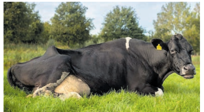
Het gebeurt maar heel weinig dat koeien gedurende hun leven zo'n grote melkproductie realiseren.

vertrouwde en veilige manier het hardloopevenement te organiseren. Ook dit jaar heeft het bestuur de conclusie getrokken om alle energie te steken in de organisatie van een Pierloop Velsen in 2022. Deze staat nu gepland op zondag 11 september met start en finish nabij het Leonardo Hotel IJmuiden Seaport Beach (voorheen Apollo).