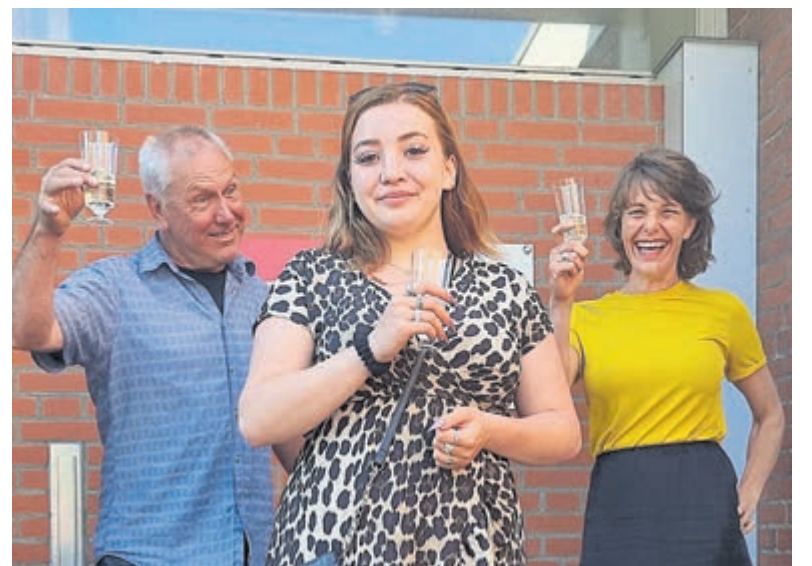
Bij de felicitaties werd getoost met bubbels.

wonen, het Havenbedrijf, wijkplatforms IJmuiden Zuid en Noord en vele andere. Wilt u zelf een tegel sponsoren, mail: info@rcvelsen.nl.