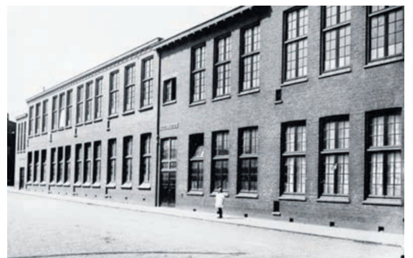
De Fröbelschool in IJmuiden.

Contactgegevens: Museum de Schat van Simpelveld, Kloosterstraat 68, 6369 AE Simpelveld. info@deschatvansimpelveld.nl. Zie ook: www.deschatvansimpelveld.nl.