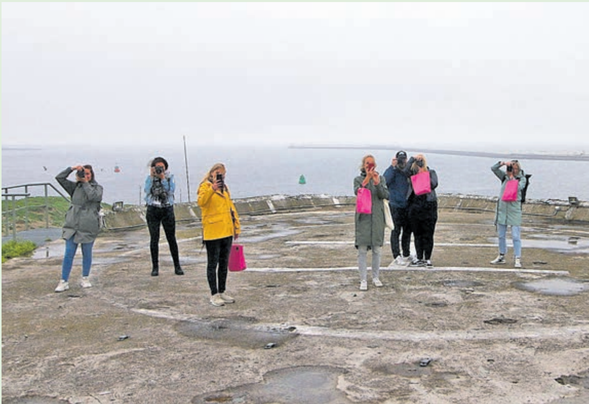
Een groep Instameeters neemt vanaf het helikopterplatform op Forteiland de foto's op de korrel.