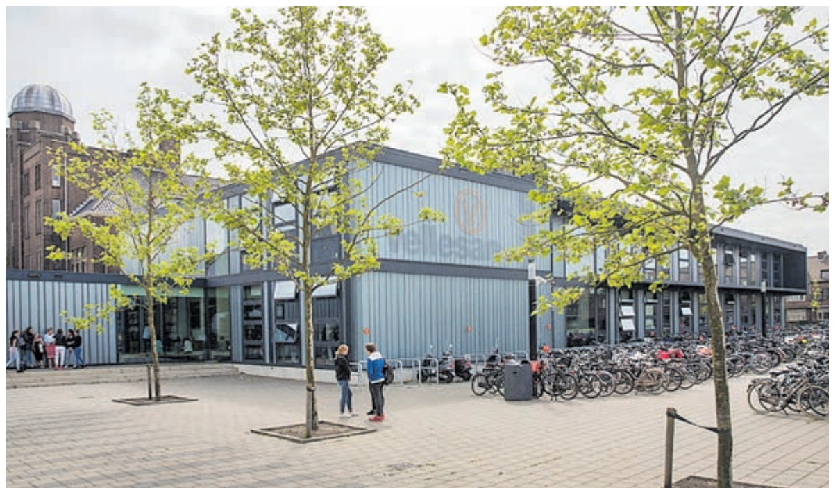
Het Vellesan College betreurt de ontstane situatie ten zeerste.

Tegen het besluit kan gedurende een periode van zes weken nog bezwaar worden gemaakt, daarna wordt het besluit onherroepelijk. Tijdens het inspraakproces werd ook melding gemaakt van overbewoning van panden, zwerfafval en overlast van (uitgaans)publiek. Hier zal naar worden gekeken.