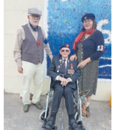
Normandië, 6 juni 2019. Een Engelse veteraan woont diverse herdenkingen van D-day, toen 75 jaar geleden, bij. Twee Velsenaren bedankten hem, verkleed als Frans verzet. Zij dragen een verse poppy.

IJmuiden - Velsen wil een bijvriendelijke gemeente zijn. Door het selectieve maaibeeld bloeien in onze bermen daarom paardenbloemen, madeliefjes, kattenkruid en nog veel meer kleurig moois. Zo kleuren klaprozen nu in Velsen veel bermen rood. Tevens brengen klaprozen in bloei D-day in herinnering. 6 juni was het 77 jaar geleden, dat de geallieerden in Normandië de bevrijding van Europa inzetten. 'Onder elke klaproos ligt een dode' zegt men sindsdien in Frankrijk. En de klaproos, in het Engels poppy genaamd, werd het symbool om de invasie te herdenken. Er worden kransen van gemaakt, die op graven en bij gedenktekens worden neergelegd. En een poppy wordt ook wel gedragen uit respect voor alle mensen, die sneuvelden.