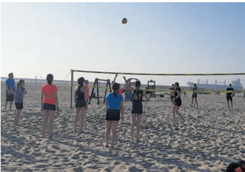
Zowel volwassenen als kinderen vanaf 8 jaar zijn welkom op het strand.

de Nederlandse Bridgebond kwam dan toch in het weekend. De zomercompetitie staat open voor leden en niet-leden van De Jump en wordt gespeeld op maandagavond in Velsershooft. Aanmelden op de zondag ervoor via Robert@dejum.nl. De kosten voor niet-leden bedragen € 2,- per paar.