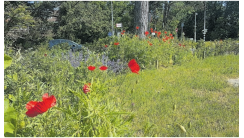
Klaprozen, ookwel poppy's genoemd, op de Zeeweg.

De foto's en video's die de Instagrammers hebben gemaakt zijn terug te vinden door te zoeken op #instameetvelsen21.