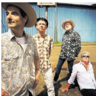
The Bayou Mosquitos.

Santpoort - In 't Mosterdzaadje wordt een inhaalslag geleverd nu de concerten weer doorgang mogen vinden.