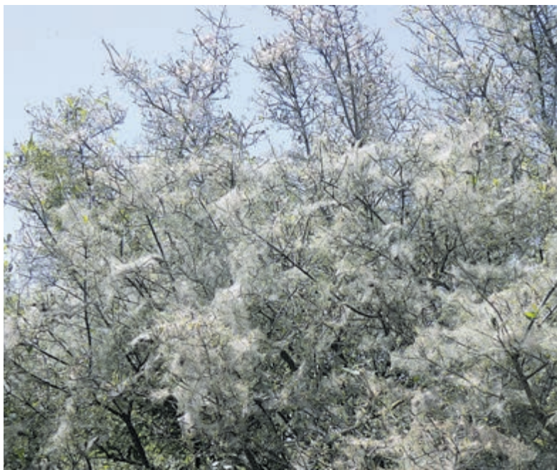
De eikenprocessierups is weer in opmars, zoals hier in Ijmuiden.

Ijmuiden - Het is volop lente en dat betekent dat de eikenprocessierups weer in groten getale kan worden aangetroffen in de bomen. Wees hierop bedacht, want de haartjes van deze rups kunnen veel leed veroorzaken, zoals een jeukende huid en irritatie aan ogen, luchtwegen en het maagarmkanaal. Blijf dus uit de buurt van de rups en (voormalige) nesten van deze dieren. Ben je al in aanraking gekomen met de haartjes en heb je last van de hierboven genoemde klachten? Ze gaan over het algemeen binnen twee weken weer over. Je kunt een crème met aloë vera, menthol of calendula gebruiken om de jeuk te verminderen. Bij zwellingen of benauwdheid raadpleeg je een huisarts. Rode bultjes op de huid door de eikenprocessierups? Zet de föhn erop! Het verwarmen van de huid helpt om de uitslag te verminderen.