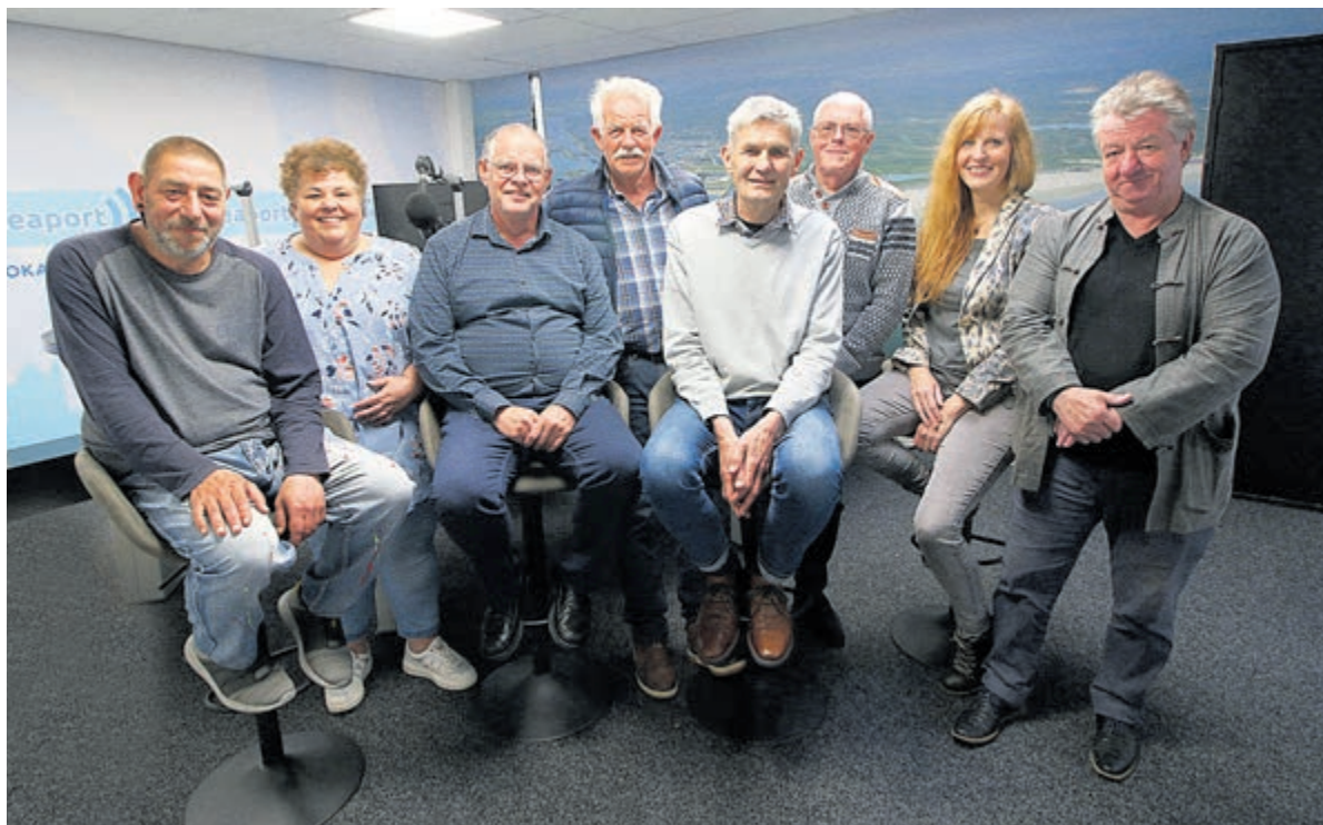
De vaste gasten zullen iedere week rouleren.

Veel onduidelijkheid is er nog over de periode na 2025. De huidige regering stelt zich op het standpunt niet over het eigen graf heen te willen regeren. Daarom weten de gemeenten nog steeds niet op welke bedragen ze vanaf 2026 mogen rekenen. Ook in Velsen bevindt de wethouder financiën zich hierdoor in een spagaat: „We hebben een schatting gemaakt van wat de algemene uitkering vanuit het Rijk in 2026 zou kunnen zijn. Maar dat bedrag mogen we van de provincie niet meenemen in de begroting. Als we dat inderdaad niet doen, hebben we zowel in 2026 als in 2027 een gat van 7,5 miljoen euro. Daarom stellen we voor om het bedrag voor 75% in te boeken.” En er is nog iets dat zorgen baart: het Rijk hanteert het zogenaamde trap-op-trap-af-systeem voor het bepalen van de hoogte van de uitkeringen aan de gemeenten. Simpel gezegd: als het Rijk minder gaat uitgeven, krijgen de gemeenten ook minder. Verwoort: „Als het Rijk de gemeenten bezuinigingen oplegt, wordt het misschien tijd om met hooivorken en fakkels naar Den Haag te gaan.”