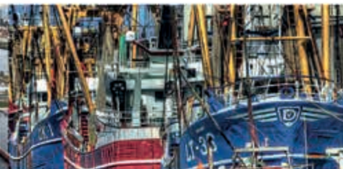
Rondleiding Visafslag IJmuiden Visafslag IJmuiden - 25 mei