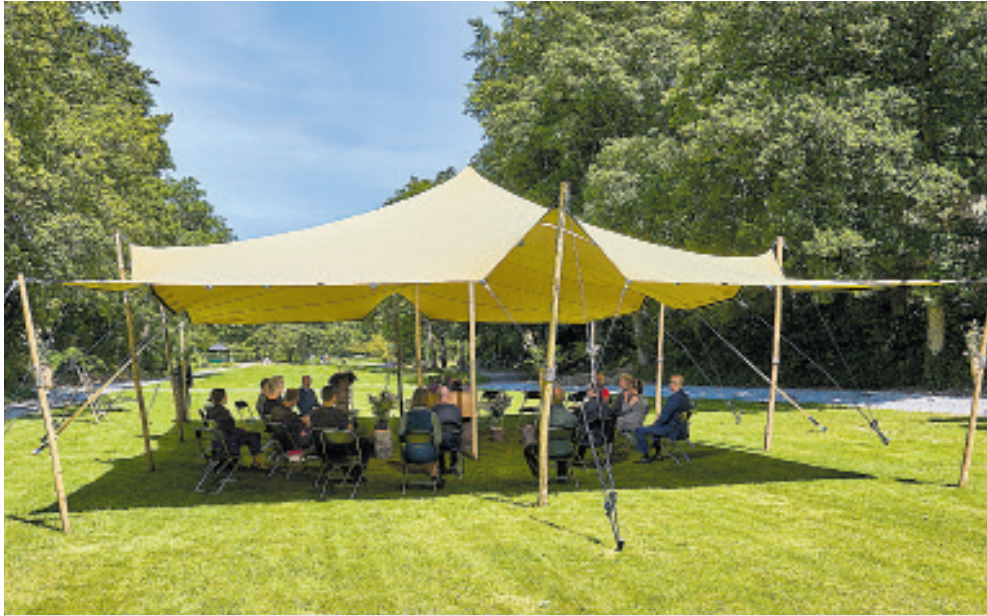
De buitenaula op Gedenkpark Westerveld.