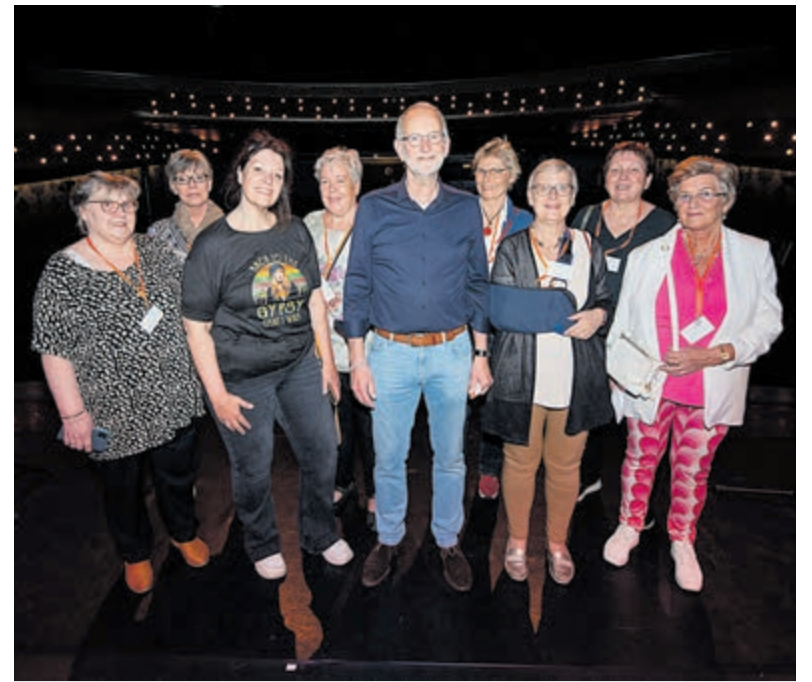
Na maanden voorbereiding was het dan ook een geslaagd evenement.

Tickets zijn vanaf nu te bestellen via www.summerparksessions.nl of via de website van de Stadsschouwburg & Filmtheater Velsen.