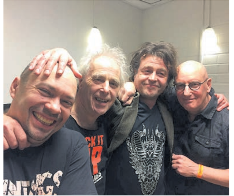
De Bintangs mogen natuurlijk niet ontbreken op het Havenfestival.