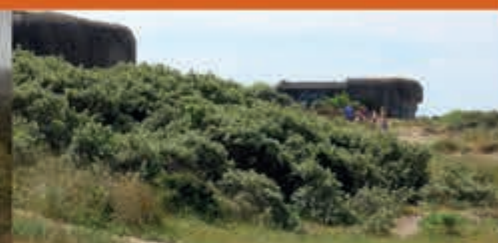
Buitenrondleiding bunkers Bunker Museum IJmuiden - 28 mei