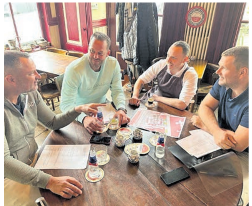
Na weken plannen is het eindelijk bijna zo ver.

Het hele team van Grand Café Staal zegt: „Wij kijken ernaar uit om samen met de Velsenaren een fantastisch evenement neer te zetten!”