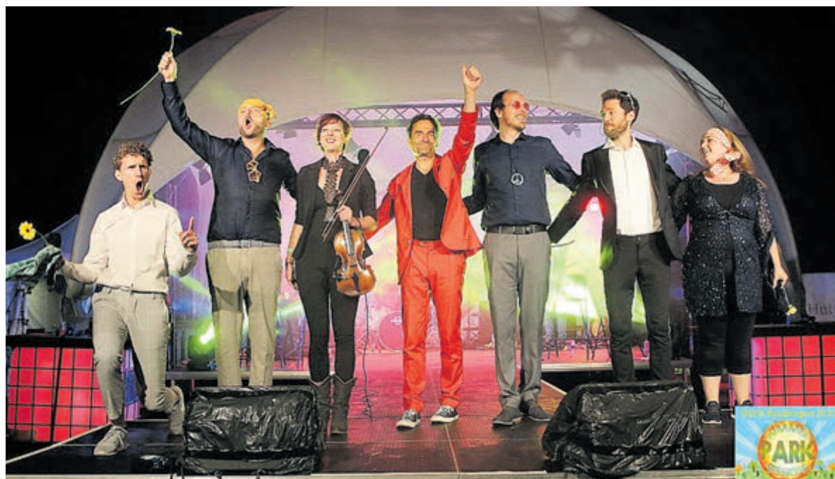
Summer Park Sessions was afgelopen jaar een waanzinnig succes!