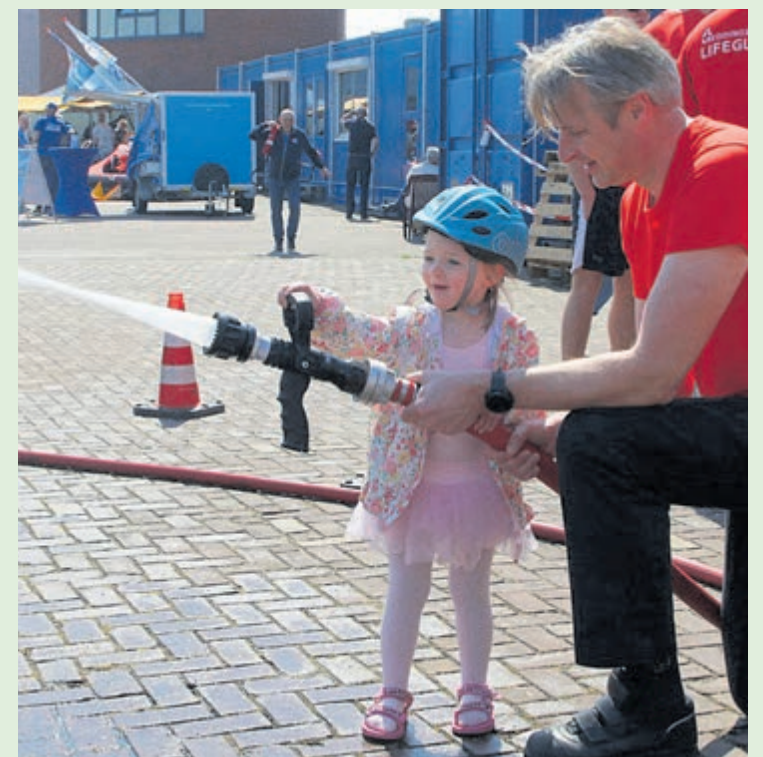
Jong geleerd is oud gedaan.

Zo tegen halverwege de middag meldde KNRM IJmuiden op haar Facebookpagina dat alle vaartochten vol zaten. Maar naast de vaartochten was er op de kant natuurlijk ook van alles te zien en te beleven. Zo konden diverse reddingvaartuigen en films worden bekeken, liepen redders en andere vrijwilligers rond om te vertellen over het reddingwerk en waren er kraampjes met informatie over de KNRM en de Stichting Vaarwens. Voor kinderen waren er diverse spelletjes en activiteiten. Zo kon onder toezicht van de Jeugdbrandweer de brandspuit worden bediend. De inwendige mens kwam ruim aanbod; de hapjes en drankjes konden onder het genot van live bluesmuziek worden genuttigd op het terras. In en op het water bij IJmuiden konden de bezoekers van Reddingbootdag 2023 genieten van de diverse activiteiten onder een strakblauwe hemel met aange-naam voorjaarszonnetje!