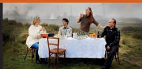
Onder de rook van de Hoogovens Hoogovensmuseum - t/m 27 mei