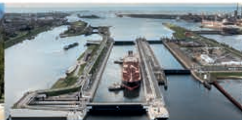
Rondleiding Zeesluis IJmuiden Zee- en Havenmuseum - 23 mei