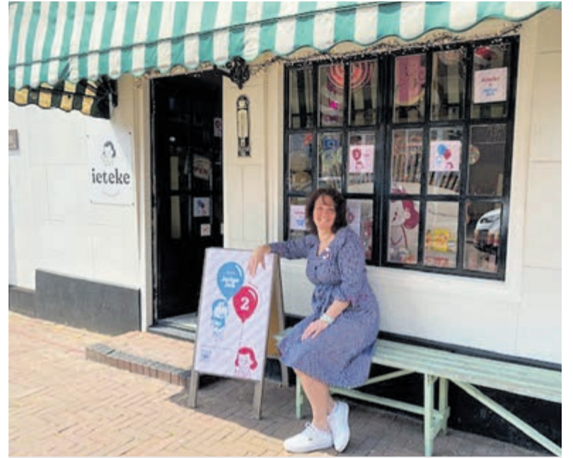
Ieteke gaat kinderen voor wie traktaties niet zo vanzelfsprekend zijn verrassen.

De kippenworkshop wordt op woensdag 31 mei gehouden om 19.00 uur. Aanmelden kan uitsluitend via welkoop.nl/kippenworkshop . Voor deze workshop zijn slechts 35 plaatsen beschikbaar en vol is vol. Kosten voor deelname zijn 17,50 euro (12,50 voor klantenpashouders).