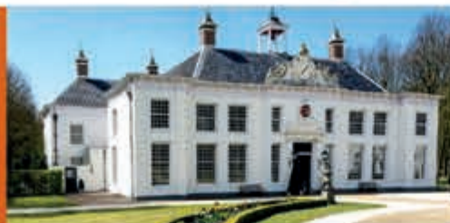
Rondleiding door hoofdhuis en tuinen Buitenplaats Beeckestijn - 21 mei

Kijk voor alle evenementen en activiteiten in de gemeente Velsen op www.ijmuiden.nl/uitagenda