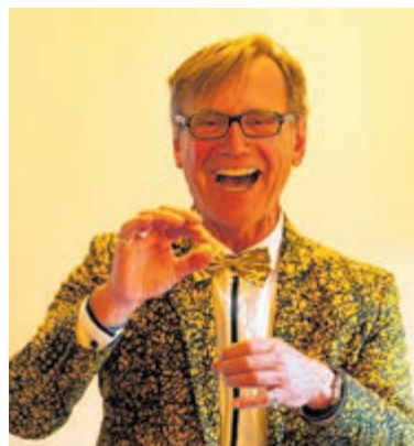
Lachen is écht gezond.

grappen gelachen. Er wordt zonder reden gelachen. Omdat lachen gezond is, goed tegen stress. En vooral, van lachen blijf je positief. In deze presentatie vertelt hij waarom hij dat is gaan doen, waarom lachen gezond is. En er zullen ook enkele oefeningen gedaan worden om kennis te maken met zijn werkwijze. Kom je ook lachen? 22 mei in Bibliotheek IJmuiden van 11.00 - 12.00 uur. De toegang is gratis.