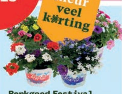
Perkgoed Festival Colours Ø 12 cm 4 stuks 13.96 10.47

Hagelingerweg 210 (hoek Biezenweg) Tel.: 023 - 537 03 57