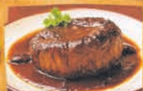
Jos' Tournedos met jus