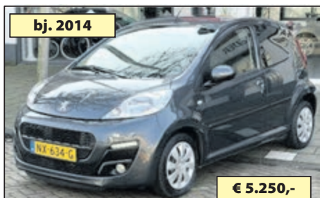
bj. 2014 PEUGEOT 107 1.0 PREMIÈRE € 5.250,-