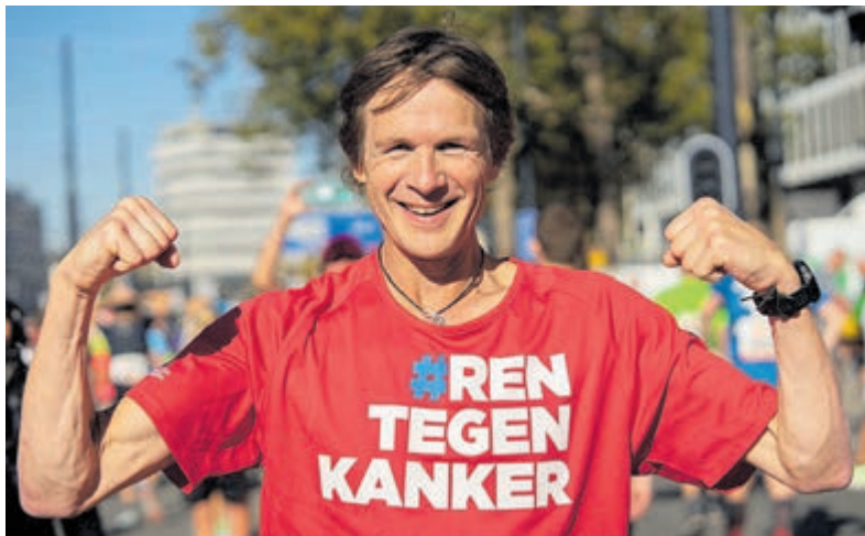
Schrijf je op tijd in voor de Vissenrun!

Velsen - IJmuiden maakt zich op voor een bijzonder sportief weekend. Op zaterdag 30 mei vindt voor het eerst de VissenRun plaats: een hardloopevenement dat niet alleen nieuw is, maar ook een nostalgisch karakter heeft. Speciaal voor deze jubileumeditie keert de oude, geliefde Pierloop namelijk nog één keer terug.