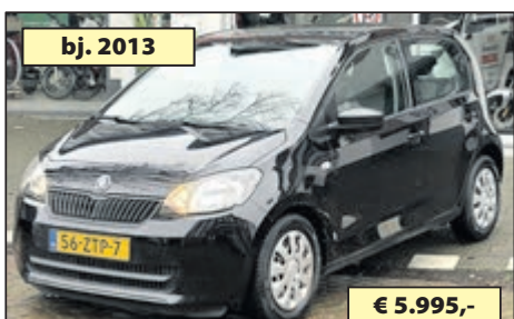
bj. 2013 ŠKODA CITIGO 1.0 GRT. ARCTIC € 5.995,-