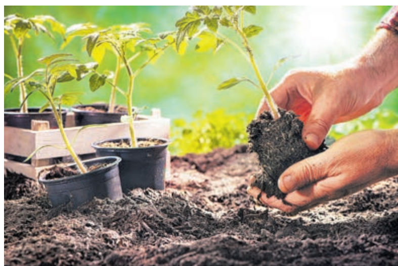
Ook heel leuk voor Moederdagplantjes- en cadeautjes.

Santpoort - Op zaterdag 9 mei organiseert Amateur Tuinders Vereniging De Hofgeest in Santpoort-Noord een gezellige en toegankelijke stekken-