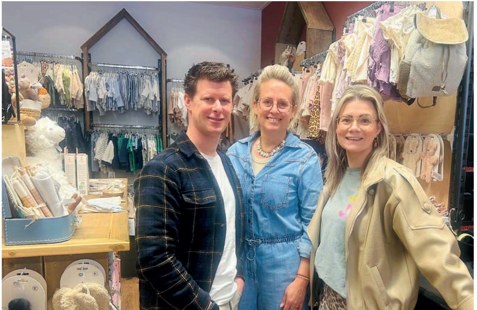
Het dreamteam van 7Days Fashion dat maakt dat het winkelen een feestje is voor jong en oud.