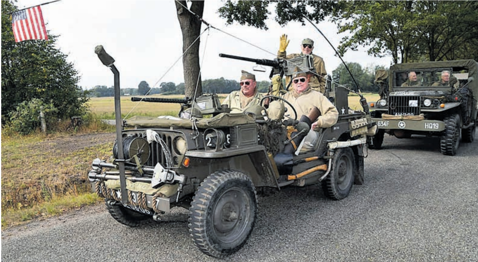
Keep them rolling en zwaai ze toe!