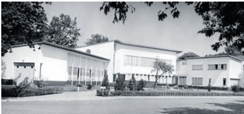
Dudok heeft een grote stempel gezet op Velsen.