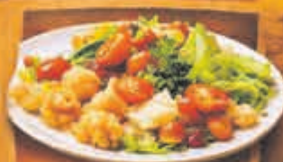
Vis-, Kip- & Vegetarische Gerechten