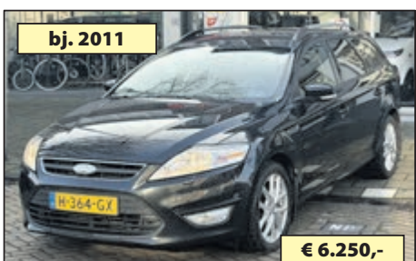
bj. 2011 FORD MONDEO WAGON 1.6 ECO € 6.250,-