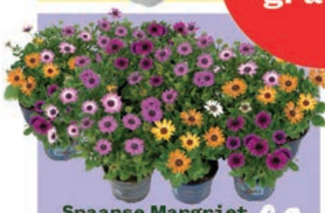
Spaanse Margriet Ø 10,5 cm 4 stuks 7.96 5.97