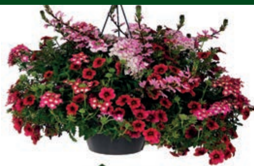
Perkgoed hangpot Ø 27 cm Festival Colours of Blooming Joy. 17.99