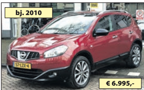
bj. 2010 NISSAN QASHQAI 1.6 CONNECT EDITION € 6.995,-