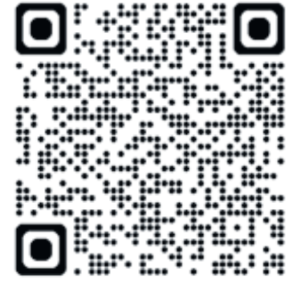
QR code naar de website van de gemeenteraad

De hele agenda met bijbehorende stukken staat op de website van de gemeenteraad.