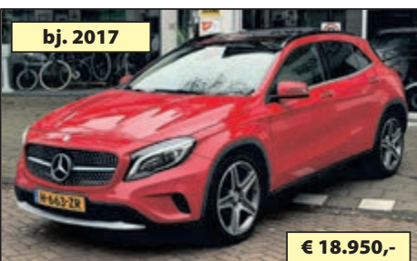
bj. 2017 MERCEDES GLA 200 AUTOMAAT € 18.950,-