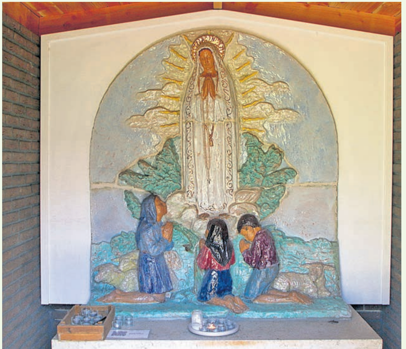
Het beeldhouwwerk in de kapel met de voorstelling van de verschijning van Maria aan de drie herderskinderen bij Fatimá.