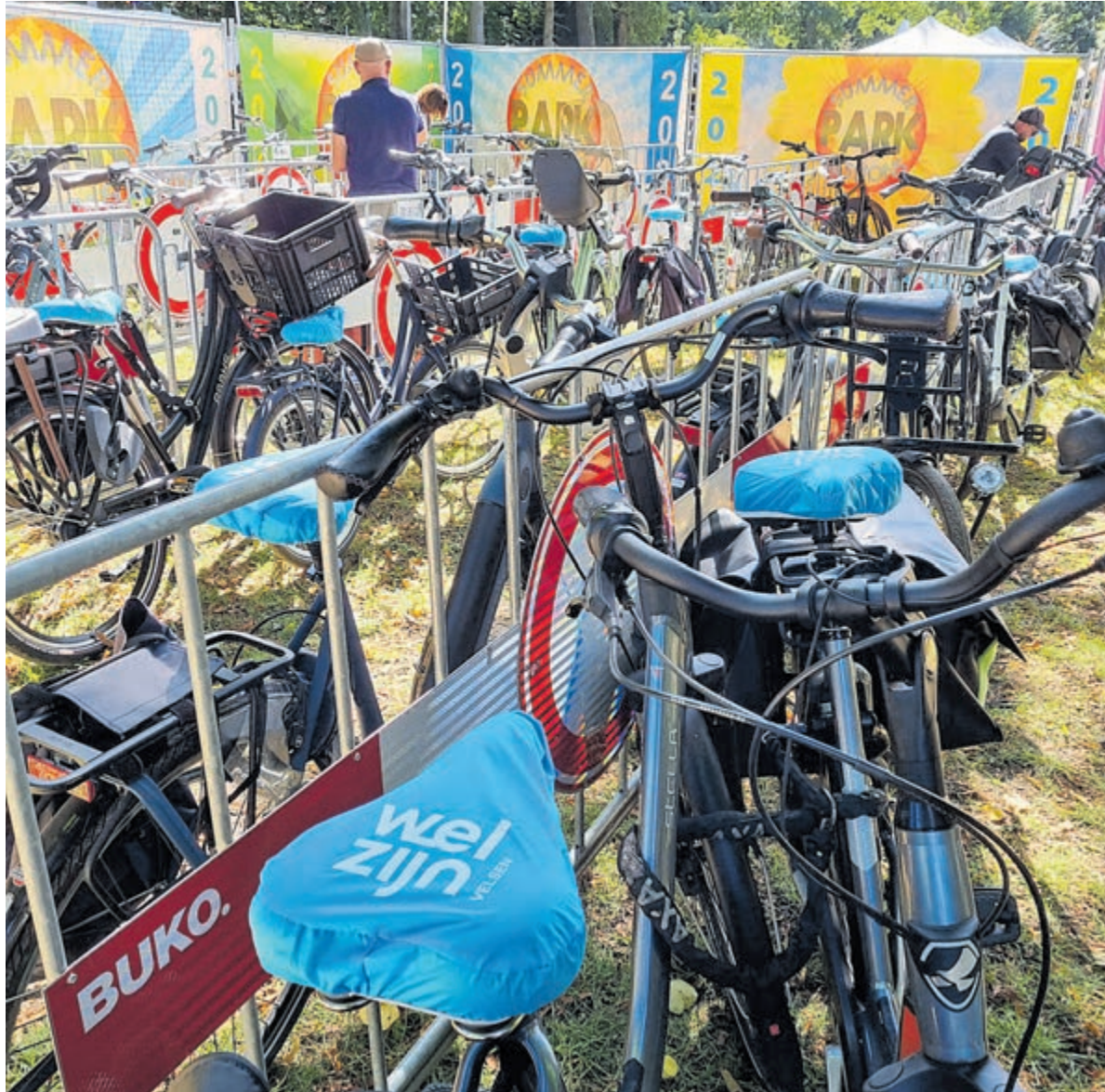
Met Fiets door de Tijd brengt Welzijn Velsen inwoners samen en laat het zien hoe verleden, heden en toekomst met elkaar verbonden zijn.