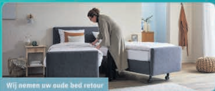
Wij nemen uw oude bed retour