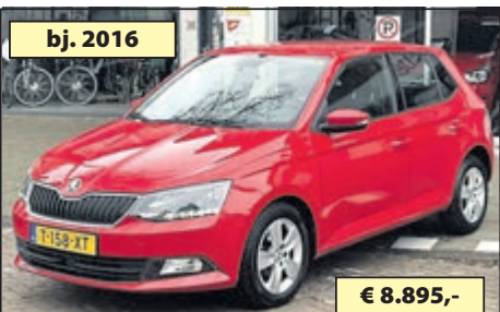
bj. 2016 ŠKODA FABIA 1.0 AMBITION € 8.895,-