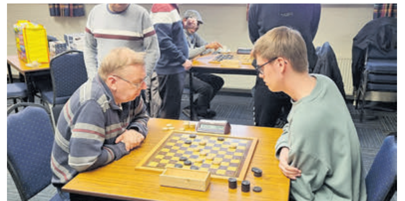
Voor Doornbosch (rechts op foto) was het de laatste kans in de B-categorie.

De open dag begint om 11.00 en zal rond 15.00 uur eindigen. FCC Wijkeroog, t.o. Wijkeroogstraat 168 in Velsen-Noord.