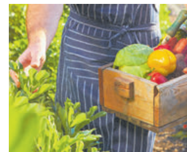
Een moestuin is leuk en lekker.

Kweek in verhoogde bedden met zijkanten - je hebt geen last van oprukkend gras, het verdeelt de tuin in hanteerbare delen en je hoeft minder te bukken. Ga niet voor breder dan 1,2 meter, zodat je het midden vanaf beide kanten kan bereiken.