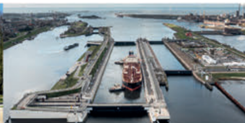
Rondleiding Zeesluis IJmuiden Zee- en Havenmuseum - 9 mei