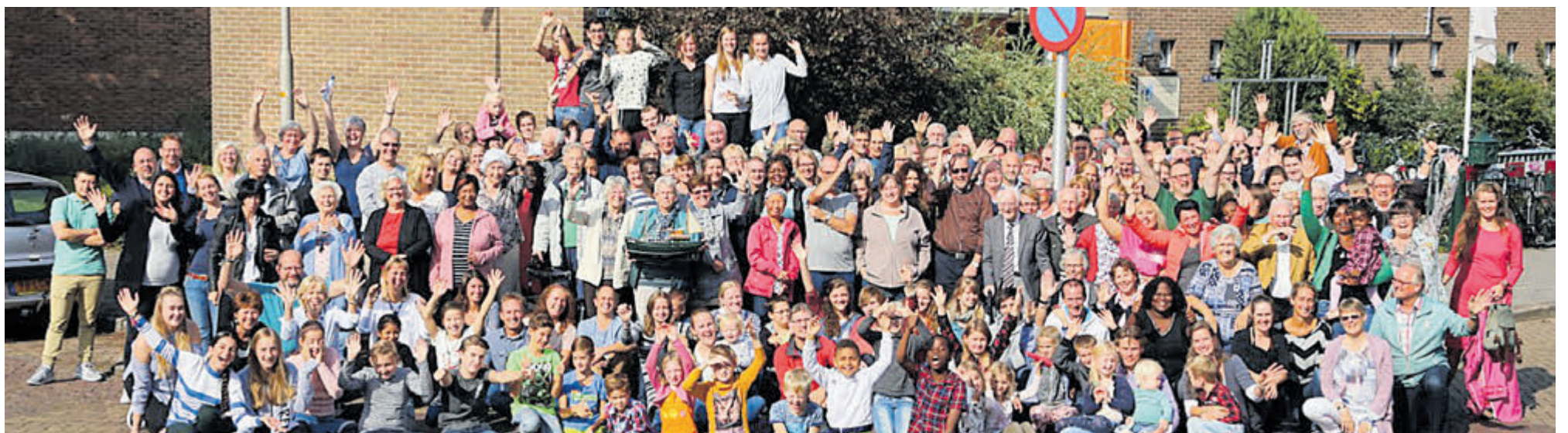
Een grote en warme gemeenschap in IJmuiden.

Wilt u na het lezen van de uitgebreide tekst ook nog stukken inzien? Dan kunt u telefonisch contact opnemen met de gemeente Velsen. Het Klant Contact Centrum kan u aan de balie geen informatie geven over bekendmakingen die een zaaknummer hebben.