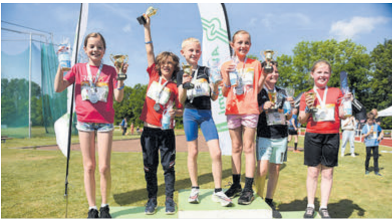
Bij de finish ontvangen alle deelnemers een mooie medaille als herinnering.

Santpoort-Noord - Zondag 14 mei is het weer tijd voor de 81e Krinkels Pim Mulierloop. Deze hardloopevenement, georganiseerd door atletiekvereniging Suomi, belooft een feest te worden voor het hele gezin!