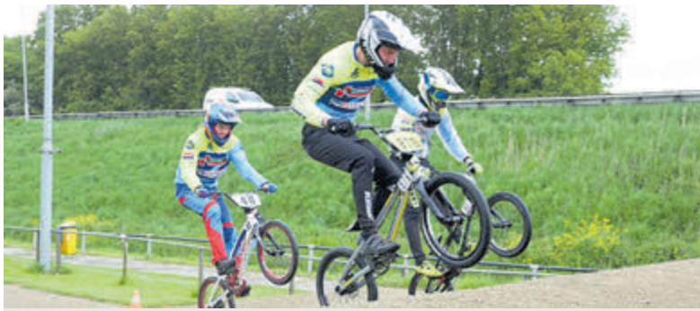
Op de crossbaan worden verschillende parcours uitgezet.

Velsen-Noord - Op zaterdag 13 mei 2023 zal FCC Wijkeroog de deuren weer openen voor iedereen die eens wil kijken of BMX zijn of haar sport is. De baan van Wijkeroog is afgelopen jaren groots verbouwd en ook daarom de moeite waard om eens te bezoeken. Met een lengte van bijna 400 meter en veel uitdagende heuvels kan deze fietscrossbaan, langs de oprit van de A22 voor de Velsertunnel, de laatste jaren rekenen op veel belangstelling uit de regio.