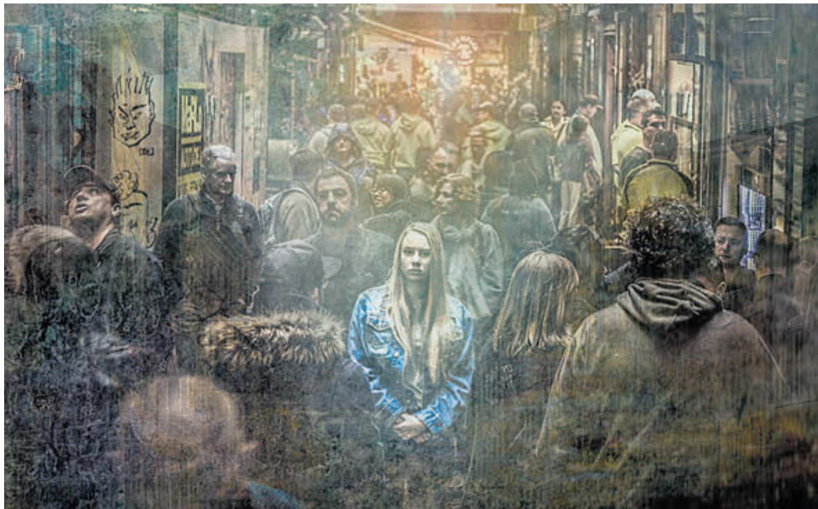
De mentale gezondheid van jongvolwassenen in GGD-regio Kennemerland staat onder druk.

Ieder half jaar in juni en december zendt de overheid rond 12:00 uur een NL-Alert testbericht uit. In het bericht is duidelijk aangegeven dat het om een testbericht gaat. Met het NL-Alert testbericht kun je ervaren hoe het is om een NL-Alert te ontvangen. Het eerstvolgende testbericht wordt uitgezonden op maandag 5 juni 2023 rond 12.00 uur.