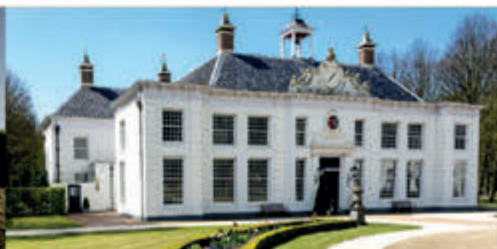
Rondleiding door hoofdhuis en tuinen Buitenplaats Beeckestijn - 7 mei