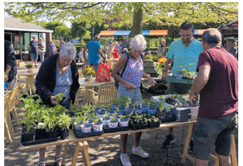
Stekkenmarkt bij De Hofgeest.

Santpoort-Noord - Op zaterdag 13 mei wordt er door de tuinleden stekken van groenten en planten verkocht bij Amateur Tuinders Vereniging De Hofgeest in Santpoort-Noord. Ook zijn er jonge fuchsaplanten te koop en dahliaknollen voor lage prijzen. Daarnaast is er een boekenkraam met tweedehands boeken, waaronder een aantal zeer interessante antieke collectorsitems. Iedereen is van harte welkom, ook niet-tuinleden. De kantine is geopend voor een heerlijke kop koffie met iets lekkers erbij. Kom dus gezellig langs, er is ruime parkeergelegenheid. De stekkenmarkt is van 9.30 uur tot 12.00 uur bij ATV De Hofgeest, Spekkenwegje 2, 2071 KC Santpoort-Noord.