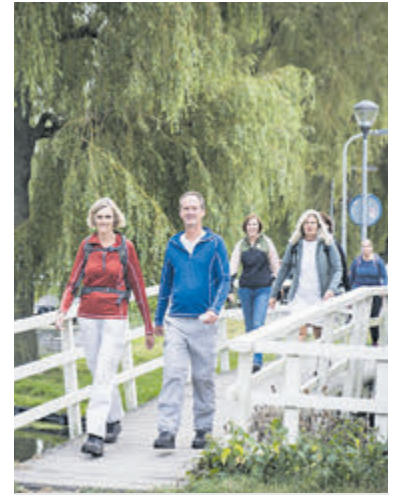
Wandel gezond Velsen rond, want dat is gezond.

die collecteert voor de Rode Hulp. Dan gaat het boek verder over haar eigen jeugd in Arnhem, waar de koude-oorlogsmentaliteit, brave burgerlijkheid en het racisme van haar vader uiteindelijk onverdraaglijk worden en de belofte van revolutie haar naar Amsterdam zal lokken. Locatie: De Hofstede Aletta Jacobsstraat 227 Velsersbroek. Aanvang 20.00 uur, zaal open 19.30 uur. De toegang is gratis voor leden van de Historische Kring Velsen. Niet-leden wordt een bijdrage van 3 euro gevraagd. U kunt zich aanmelden voor deze lezing via secretariaat@historischekringvelsen.nl .