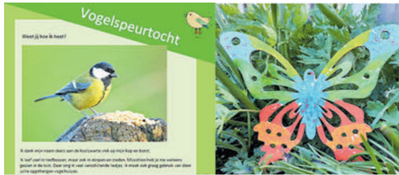
Een leuke vogelspeurtocht voor kinderen en volwassenen.