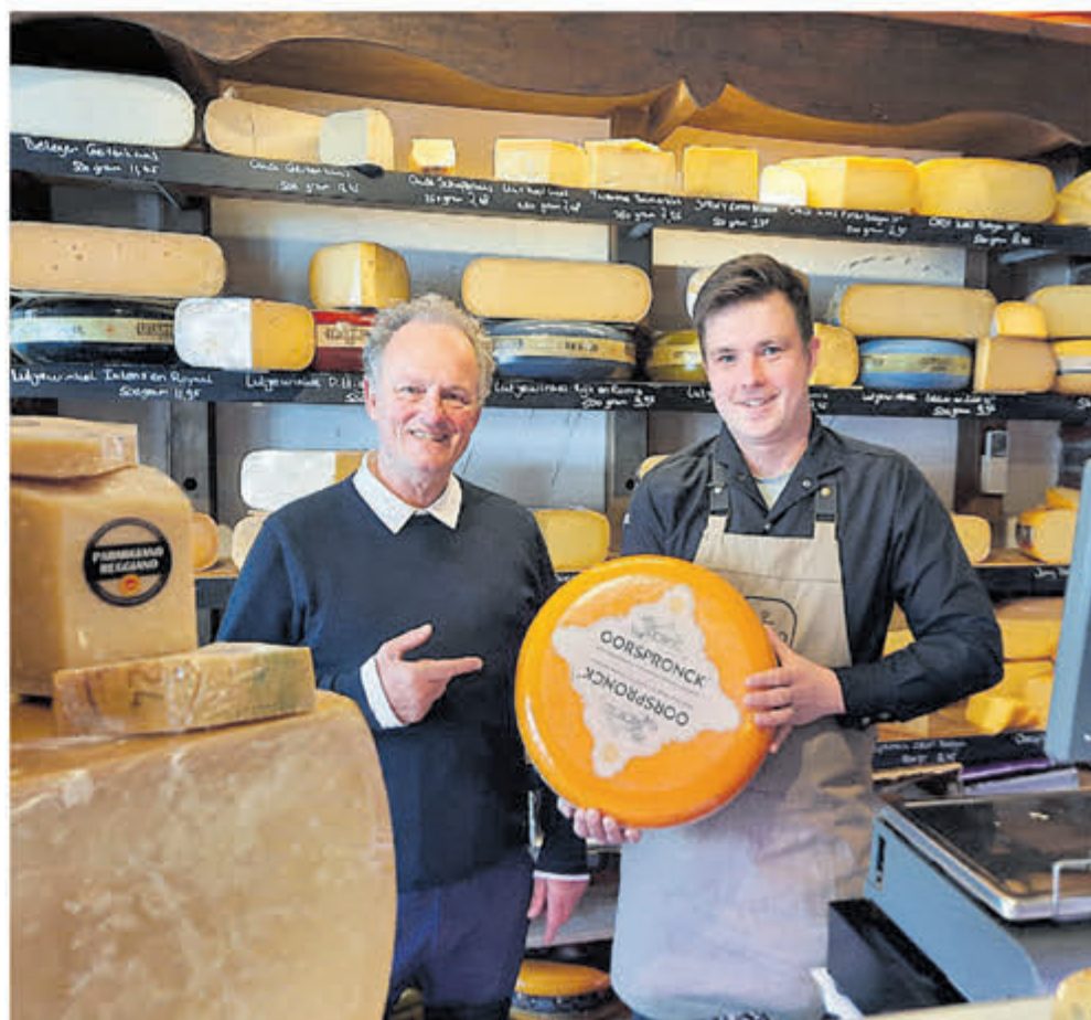
'Pondje graskaas voor de Voedselbank Velsen.

Vragen, een overlijden melden? 06 300 93 482 info@pattyduijn.nl — www.pattyduijn.nl