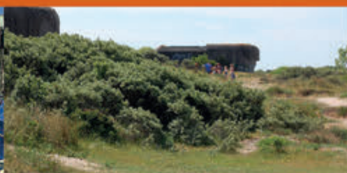
Buitenrondleiding bunkers Bunker Museum IJmuiden - 12 & 14 mei