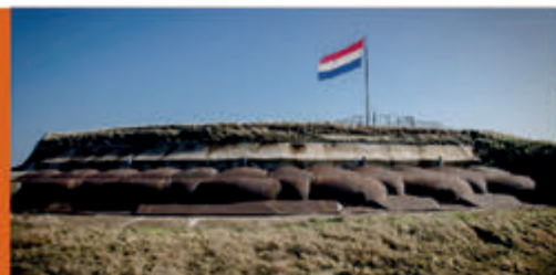
Historisch Forteiland IJmuiden Forteiland IJmuiden - 7 mei

Kijk voor alle evenementen en activiteiten in de gemeente Velsen op www.ijmuiden.nl/uitagenda