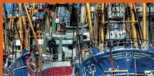
Rondleiding Visafslag IJmuiden Visafslag IJmuiden - 11 mei