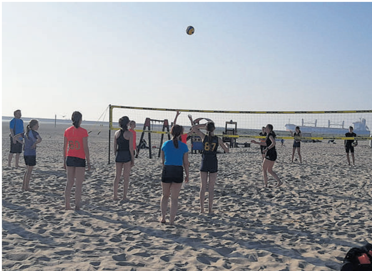
Beachvolleybal op het IJmuidse strand is heel leuk voor jong en oud.

Halverwege de ochtend gaat de kinderkermis op Plein 1945 open. Ongetwijfeld zullen hier veel zuurverdiende centjes hun verdere wegen hebben gevonden. Maar ach, het gaat om de gezelligheid, toch? Tegen het einde van de ochtend, als er bijna geen doorkomen meer aan is op de anders zo stille Lange Nieuw, ga ik, gewapend met een doosje oranjetompoezen, mijns weegs om op te laden voor een bezoek aan het volgende programmapunt vandaag, op het oranjeveld in Driehuis.