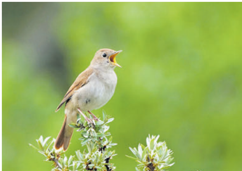
Het herkennen van de zang is de beste manier om de nachtegaal te vinden.

Gelukkig is de coronaperiode al een tijdje voorbij maar het is wel noodzaak dat iedereen onze jongeren in de gaten houdt en zo goed mogelijk begeleidt op hun weg naar volwassenheid. De kans ligt op de loer dat een hele generatie last blijft houden van de afgelopen zware jaren.