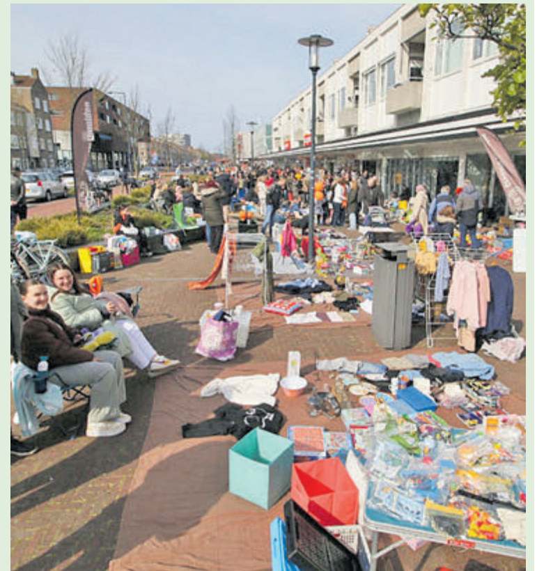
Gezellige drukte op de Lange Nieuwstraat tijdens de vrijmarkt op Koningsdag.