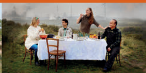
Onder de rook van de Hoogovens Hoogovensmuseum - t/m 27 mei