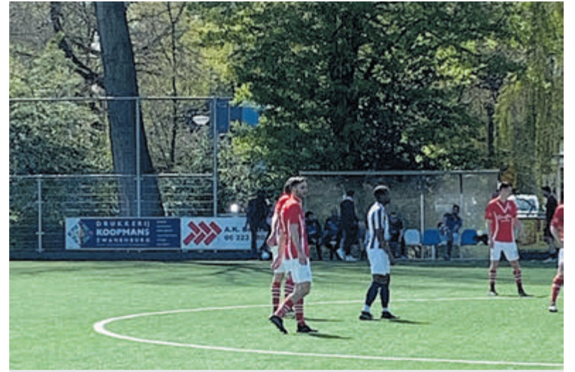
Het was een spannende krachtmeting voor VSV.