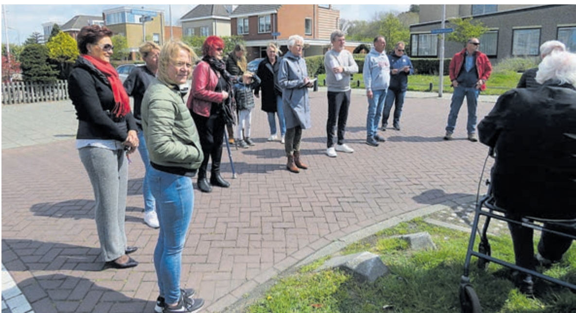
Zaterdag maakte een cameraploeg van RTV Seaport opnames op de locatie, ook kwamen enkele buurtbewoners aan het woord.

IJmuiden - De puinhoop rond de vuilcontainers aan de Doorneberglaan is omwonenden al langere tijd een doorn in het oog. De containers staan tijdelijk op een klein stukje gras, recht tegenover het pand van het Apostolisch Genootschap, maar steeds wordt er illegaal afval naast gedumpt. Een bewoner van de wijk zegt: „Ik heb het idee dat mensen uit alle delen van Velsen hierheen komen om hun vuil te storten. Soms zijn het busjes van bedrijven, soms mensen die hier boodschappen doen in het winkelcentrum en dan meteen hun afval hier storten. Als je ze er op aanspreekt, krijg je te horen dat iedereen het zo doet.” Zaterdag maakte een cameraploeg van RTV Seaport opnames op de locatie, ook kwamen enkele buurtbewoners aan het woord. „Als de gemeente deze containers niet snel weghaalt, zet ik ze bij het gemeentehuis en bij de burgemeester thuis voor de deur”, aldus een van hen. De containers werden enkele