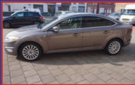
Ford Mondeo 1.6 16V Ecoboost 160 PK 5 drs bj. 2012 € 9.250,-