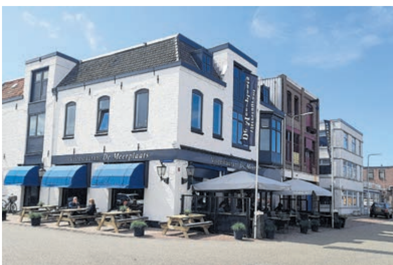
Visrestaurant De Meerplaats