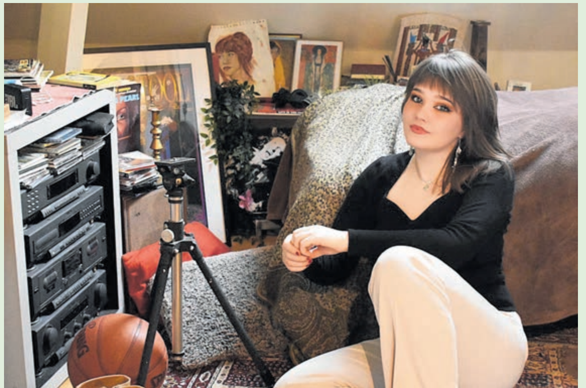
'Ik wil corona nergens de schuld van geven'.