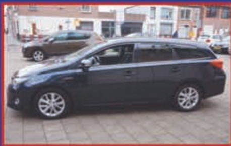
Toyota Auris 1.8 Hybrid 136 PK automaat Touring Sports bj. 2015 € 12.950,-