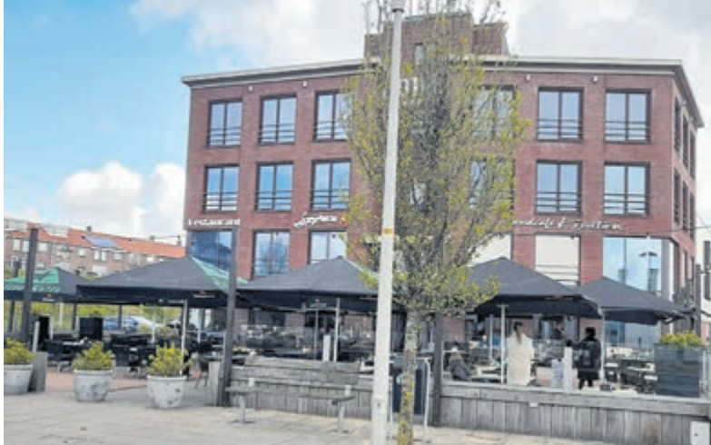
Restaurant Spijkers en Grandcafé Kruiten.

Velsen - Ruim een week geleden mochten de terrassen voor het eerst sinds maanden weer open. De verplichte sluiting in verband met de COVID-19-pandemie heeft er bij de horecabedrijven flink ingehakt en sommige bedrijven zagen zich genoodzaakt het bijltje erbij neer te gooien. De bedrijven die nog wel overeind staan, hebben het zwaar. Desalniettemin zijn ze vol goede moed en staan ze weer voor de gasten klaar. Het zijn veelal de hartverwarmende reacties van het publiek die de ondernemers motiveren om opnieuw hun beste beentje voort te zetten.