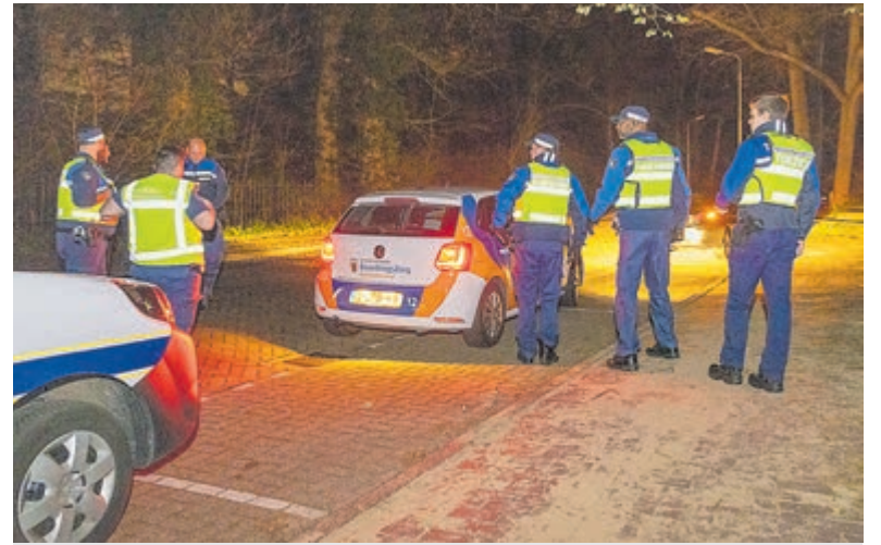
Er werden geen aanhoudingen verricht of boetes uitgedeeld.

IJmuiden - Zaterdag werd op de steiger van Seaport Marina een zeehond aangetroffen. De vrijwilligers van RTZ Velsen dachten aanvankelijk dat het dier terplekke zou overlijden, het lag te stuiteren. Ze hebben een rehydratatiemiddel toegediend en na overleg met de zeehondenopvang in Stellendam besloten om de zeehond mee te nemen naar de eigen loods. Daar werd hetzelfde middel opnieuw toegediend en bij een controle na drie uur bleek het dier weer in redelijke conditie te zijn. De zeehond was voorzien van een tag aan de flappen, daaruit kon worden opgemaakt dat het dier afkomstig was uit Duitsland. Dezelfde zeehond werd op 19 april ook al door vrijwilligers van RTZ Velsen gespot in de haven van Seaport Marina, maar toen in betere omstandigheden. Het dier is inmiddels op transport gegaan.