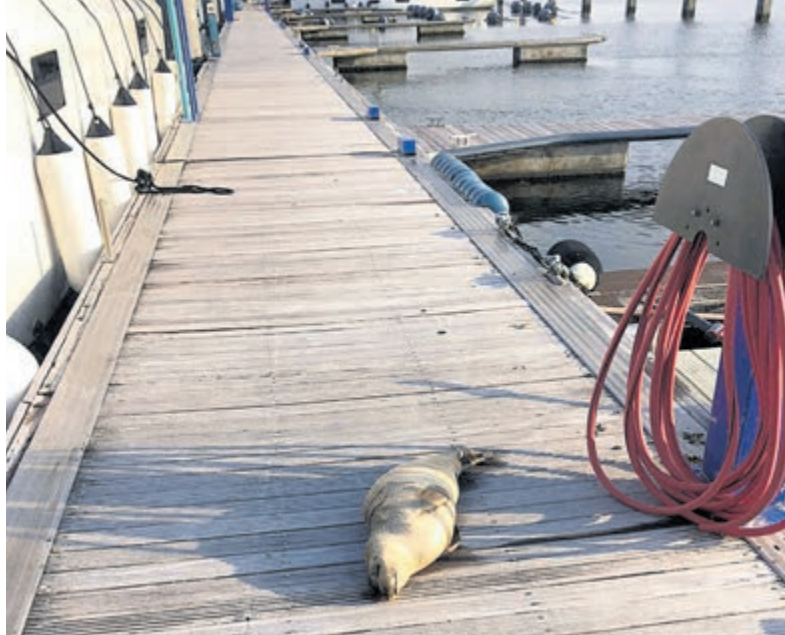
De zeehond heeft het steigeravontuur overleefd.

IJmuiden - Zaterdag werd op de steiger van Seaport Marina een zeehond aangetroffen. De vrijwilligers van RTZ Velsen dachten aanvankelijk dat het dier terplekke zou overlijden, het lag te stuiteren. Ze hebben een rehydratatiemiddel toegediend en na overleg met de zeehondenopvang in Stellendam besloten om de zeehond mee te nemen naar de eigen loods. Daar werd hetzelfde middel opnieuw toegediend en bij een controle na drie uur bleek het dier weer in redelijke conditie te zijn. De zeehond was voorzien van een tag aan de flappen, daaruit kon worden opgemaakt dat het dier afkomstig was uit Duitsland. Dezelfde zeehond werd op 19 april ook al door vrijwilligers van RTZ Velsen gespot in de haven van Seaport Marina, maar toen in betere omstandigheden. Het dier is inmiddels op transport gegaan.