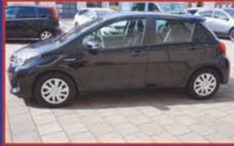
Toyota Yaris 1.5 Full Hybrid 100 PK 5 drs automaat Aspiration bj. 2016 € 10.500,-

Onderhoud en APK voor alle merken. Gespecialiseerd in airco en EV voertuigen.