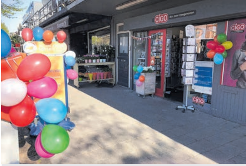
Het is een feestje om bij Cigo Havana House langs te gaan!