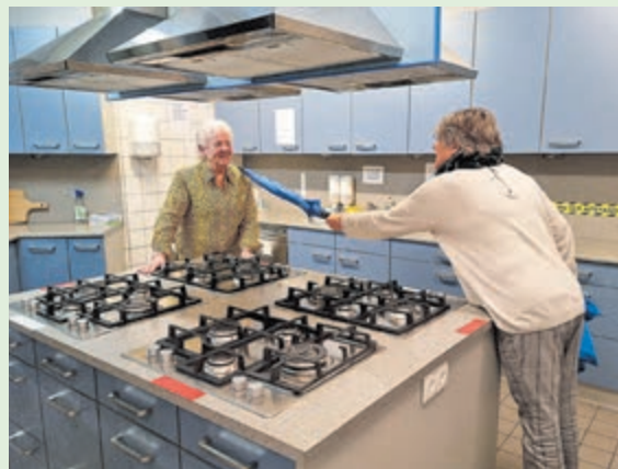
Gre krijgt de paraplu van het Sociaal wijkteam Velsen overhandigd als een bedankje voor haar vrijwillige inzet.

Ik pleit er voor dat de fietsen genummerd worden maar dat schijnt qua privacy moeilijk te liggen.