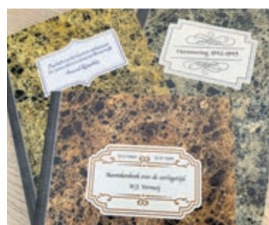
De dagboeken beschrijven de situatie tussen 1943 en de bevrijding.

De indrukwekkende boeken, beperkte oplage, kosten samen slechts € 24,- en deze week van Herdenking en Vrijheid krijgt u "Slachtoffers van WO2 in de IJmond" van journalist Bart Vuijk (NHD) er gratis bij. Bestellen via pr@museumkennemerland.nl en ze worden binnen 24 uur in de IJmond thuisbezorgd. Of € 24,- overmaken naar NL97RABO0107370034 t.n.v. S. Weterings, en vermeld uw adres.