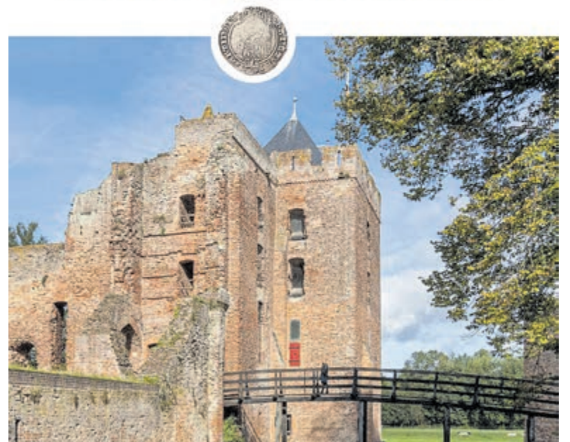
Omslag van het boek.

Ruïne van BREDERODE HOLLANDS KASTEEL MET EEN BEWOGEN VERLEDEN