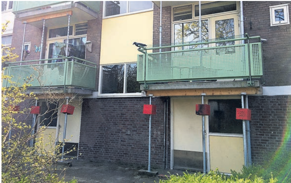
Ondanks de sloopplannen worden de balkons eerder aangepakt.