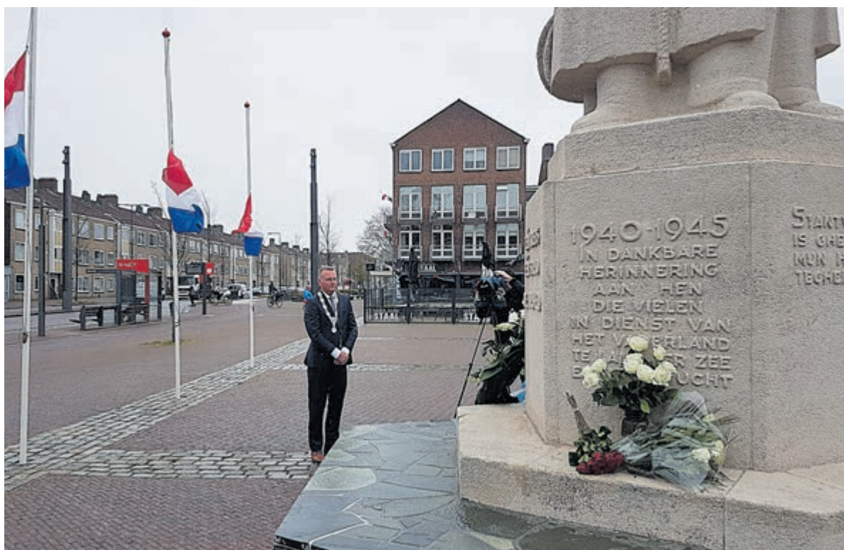
De herdenking op Plein 1945.

Velsen - Zoals ieder jaar werden ook nu op 4 mei de oorlogsslachtoffers van de Tweede Wereldoorlog herdacht. Door coronamaatregelen om verspreiding van het beruchte virus te voorkomen, vond de herdenking ook dit jaar weer aangepast en zonder publiek plaats.