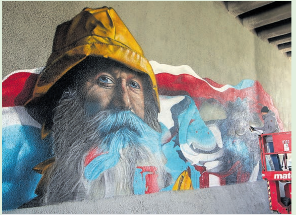
De markante visser van Karski en Beyond, tijdens het afronden van de muurschildering onder de Julianabrug.