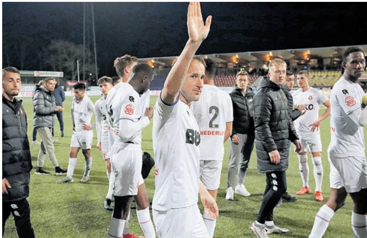
Helaas weer een domper op het laatste moment. De teleurstelling is groot.

In de toegevoegde tijd viel een vrije trap van Jong PSV tussen alles en iedereen en in een ouderwetse scrimmage eindigde de bal achter doelman Doornbusch. 2-2 en een kater, een hele grote.