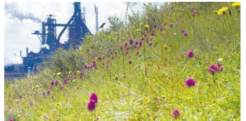
Bloeiend hondskruid (zeldzame orchidee) op het terrein van Tata Steel, met de Hoogovens op de achtergrond.

op het Technisch College Velsen en het Maritiem College in IJmuiden. De leerlingen uit de derde klas werken sinds 1 maart, onder begeleiding van hun maatschappijleer-docent, aan een uitdagende opdracht: niet alleen bestuderen zij een actueel mensenrechtenthema, ze worden ook gevraagd om er een actie voor op te zetten. Op 19 mei, bij de presentatie door deze leerlingen van hun project, wordt een winnaar aangewezen door een jury. De winnaar mag € 250,- aan het gekozen thema en de bedachte actie besteden en de winnende school ontvangt een wisseltrofee. De Soroptimisten organiseren deze wedstrijd samen met de scholen en zorgen dit jaar dat het evenement corona-proof kan plaatsvinden: via een live stream op 19 mei kunnen geïnteresseerden de uitreiking volgen. Opgeven voor deze interessante avond kan via GoudenS.T.E.M.VMBO@gmail.com . Meer informatie over de soroptimistenclub: https://www.soroptimist.nl/haarlem/