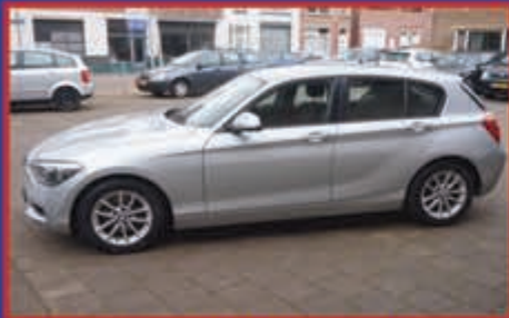
BMW 116 i 136 PK 5 drs Business Line bj. 2012 € 9.950,-