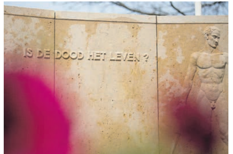
De route voert langs urnengraven en graven van verzetslieden.

Op 4 mei organiseert het Comité 4 en 5 mei Velsen de jaarlijkse