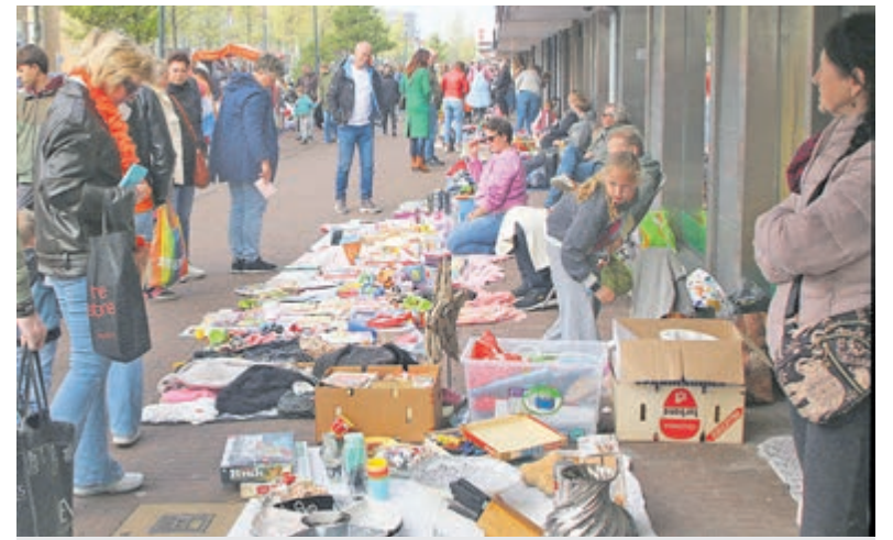
Voor de vrijmarkten zijn hartstikke leuk om te bezoeken en koopjes te scoren.

Ook in Santpoort-Noord is het gezellig op het Landje van Scholz, met diverse activiteiten en livemuziek. Er wordt geknutseld, er is een dansworkshop, er zijn kinderspelen en een poppentheater. Let op: voor activiteiten als het penaltyschiets moet je lid zijn van de Oranjevereniging. De laatste uurtjes is er livemuziek door Bob en the Blue Band. En dan dinsdag weer allemaal aan het werk en naar school maar op Koningsdag kleurt heel Velsen oranje.