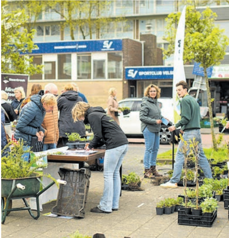
De dag stond in het teken van ontmoeten, samenwerken en een groenere leefomgeving.