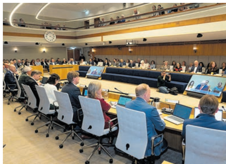
Woensdag werden de vervolgstappen besproken in de raad.