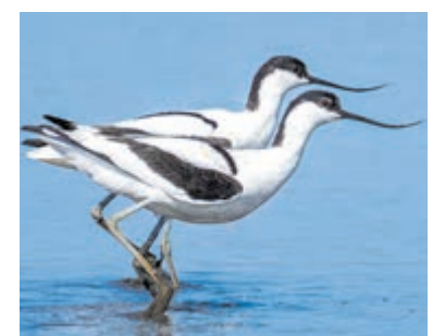
Kluten in het Landje van Gruijters.

De vrijwilligers hebben het beheer van dit gebied in 2027 op zich genomen na overleg met Spaarnwoude Park. De afgelopen jaren zijn veel maatregelen genomen zoals de aanleg van twee broedelandjes. Om het gebied geschikt te houden voor de vogels, zijn er twee keer per jaar werkdagen. Ook zijn er verschillende werkgroepen, zoals de zeisploeg die pitrus en riet maaien. Nadere informatie is te vinden op landjevanguijters.nl .