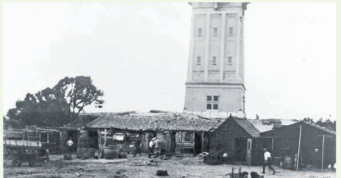
De Musschenbuurt aan de Wijk aan Zeeërweg in 1918.