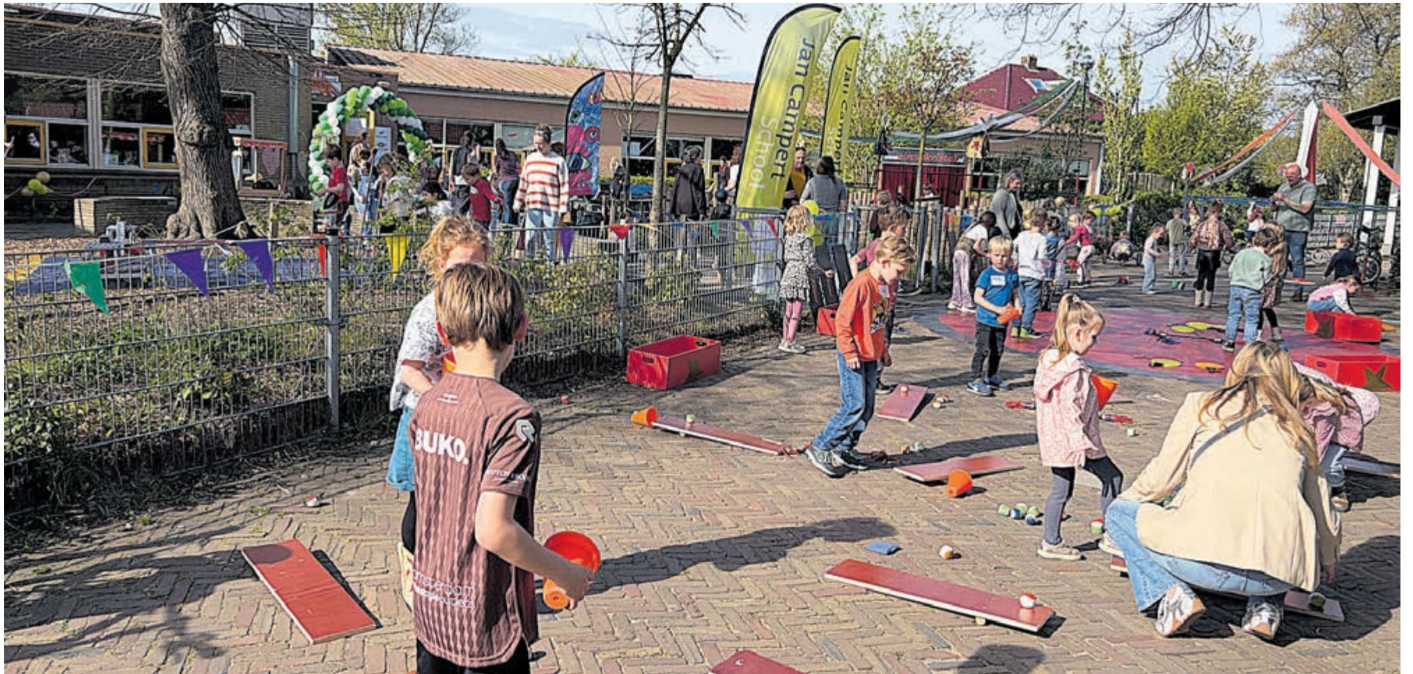
De circusdirecteur heeft alle spellen uitgelegd en de kinderen mogen lekker zelf rondlopen om alles te ontdekken.