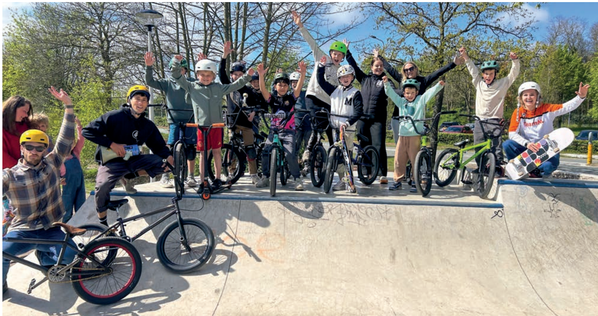
De kinderen maken even tijd voor de foto en gaan dan weer los.