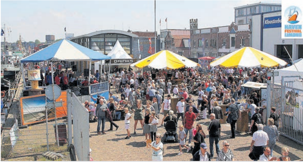
Tijdens dit feestjaar wordt het echte, rauwe karakter van de IJmond naar voren gebracht.