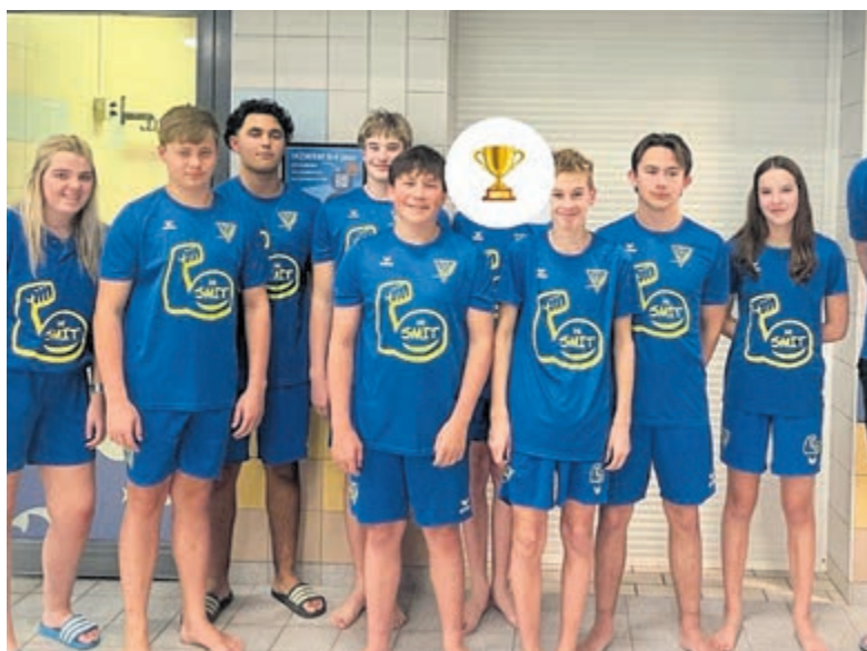
Het was een prachtig en leerzaam seizoen.

Velsen - Het was erop of eronder voor het waterpoloteam O16 van VZV afgelopen maandag. Al lange tijd werd er uitgekeken naar de wedstrijd tegen De Meeuwen: de nummer één tegen de nummer twee. Aan de sfeer lag het in ieder geval niet, want de tribune zat vol met enthousiast publiek. De wedstrijd ging lange tijd gelijk op. Beide teams gaven niets toe en hielden elkaar continu in balans. Pas in de laatste minuten werd het duel beslist, helaas in het voordeel van De Meeuwen. De eindstand: 15-17. Coaches Maurice en Demi kijken, ondanks het resultaat, met trots terug op een prachtig en leerzaam seizoen. Samen met Dani en de spelers verlaten ze het zwembad met opgeheven hoofd. Want trots, dat zijn ze zeker op deze kanjers.