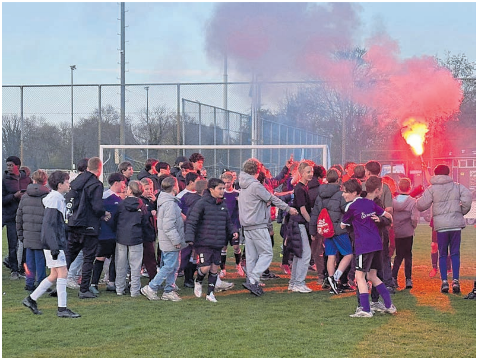
Fééstje, daar op Sportpark Driehuis.

zich het hele toernooi het meest sportief gedragen volgens de scheidsrechters. Maar niet alleen zijn zij sportief, alle teams schudden elkaar na de finalewedstrijden de hand en er wordt onderling geknuffeld. De hele sfeer op het sportpark is sportief en gezellig en zo hoort het ook. Het waren weer heerlijke saamhorige sportweken voor de scholen. Nu op naar 20 mei, dan vertegenwoordigen de vier winnaars Velsen in de regiofinales.