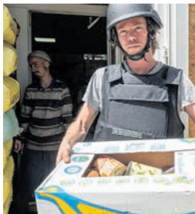
Inzamelingsactie voor Oekraïne.

Velsen - Al ruim vier jaar duurt deze oorlog al. Gelukkig kunnen wij ons niet voorstellen hoe het moet zijn in het oosten van Oekraïne waar de huizen kapot worden geschoten en de mensen meer in schuilkelders