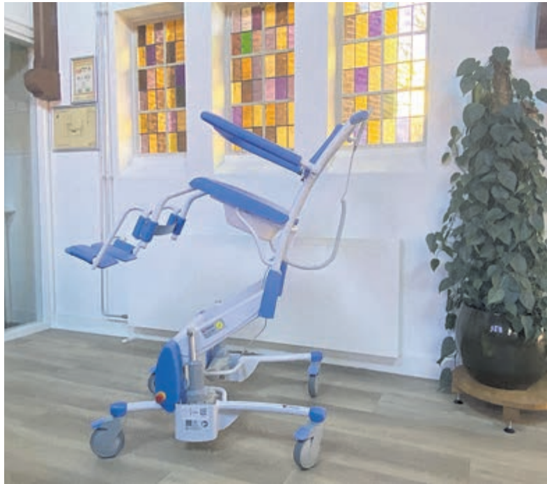
Behalve het verhoogde fysieke comfort en de verbeterde veiligheid en ergonomie zorgen de stoelen ook voor meer ontspanning en waardigheid.

Santpoort – Met trots vertelt Hospice de Heideberg dat het project ‘optimaal comfort en ontspanning in de laatste levensfase’ is afgerond. Dankzij de financiële bijdrage van maar liefst 17.491,85 van Stichting Roparun, is een belangrijke stap gezet in het verbeteren van de kwaliteit van zorg en het welzijn van de gasten in De Heideberg.