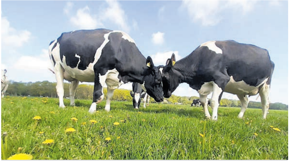
Als de koeien van Boerderij Westerhoeve naar buiten mogen dan kunnen we pas spreken van een echte lente.