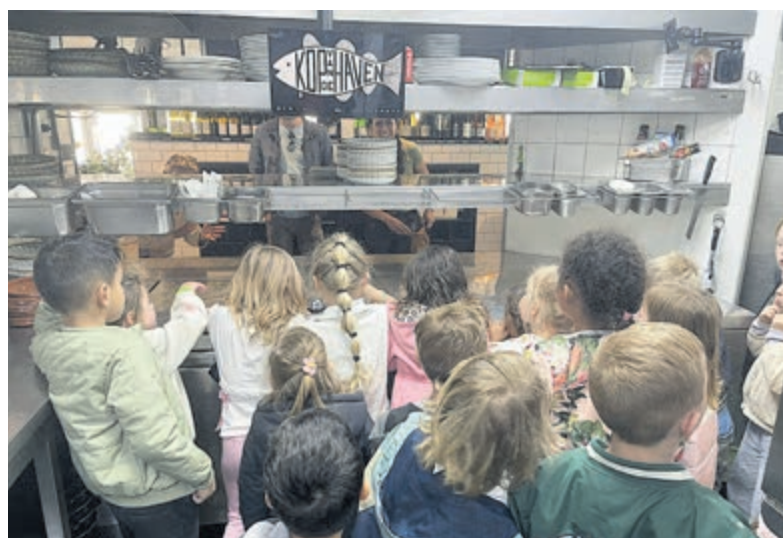
Feestelijk en leerzaam bezoekje.

IJmuiden - Twee kleutergroepen van basisschool De Origen brachten deze week een bezoek aan het IJmuidense restaurant Kop van de Haven. Het uitstapje sloot aan bij hun thema: 'aan tafel'. Na wekenlang te hebben gewerkt rond het onderwerp restaurants, kregen de kinderen nu de kans om zelf een kijkje achter de schermen te nemen. In de keuken zagen ze hoe de kok gerechten bereidt en het personeel vertelde enthousiast over het werk in de horeca. Op een begrijpelijke manier werd uitgelegd wat er allemaal komt kijken bij het runnen van een restaurant. Ook proeven hoorde er natuurlijk bij. De kleuters genoten van verse kibbeling en sloten het bezoek feestelijk af met een ijsje.