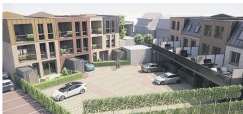
Bijzonder project in Oud-Ijmuiden. Foto: aangeleverd

Start: woensdag 22 april. Eindigt op Koningsdag (maandag 27 april). Openingstijden: Dagelijks: 14.00 tot ongeveer 21.30. Koningsdag: vanaf 10.30 uur. Tip: Het zal op Koningsdag lekker druk zijn en dat is extra gezellig maar voor die tijd is het een goed idee om langs te gaan om extra te genieten van de attracties. Foto: aangeleverd