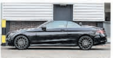
Mercedes-benz C-klasse 220 d Cabrio Premium Pack € 41.900,-