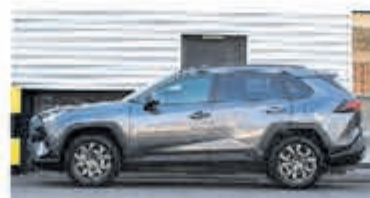
Toyota RAV4 2.5 Hybrid Executive € 43.900,-