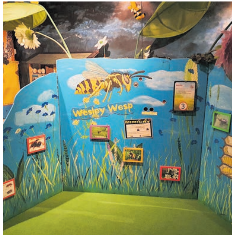
Kleurrijke panelen met verrassende informatie en veel spelletjes en doe-dingen over insecten en bodemdierjes

Driehuis - Op zoek naar een leuk uitje tijdens de meivakantie? Kom dan naar de tentoonstelling 'Kriebelbeestjes' in het Pieter Vermeulen Museum te Driehuis.