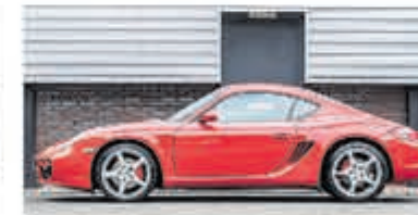
Porsche Cayman S Tiptronic Uniek 80.000 km € 29.950,-