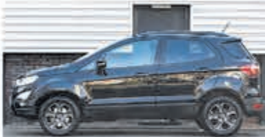
Ford EcoSport 1.0 EB Titanium € 18.900,-