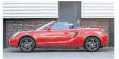
Toyota MR 2 1.8-16v VVT-i € 7.950,-