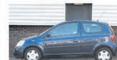
Toyota Yaris 1.3 VVT-i Sol € 4.950,-