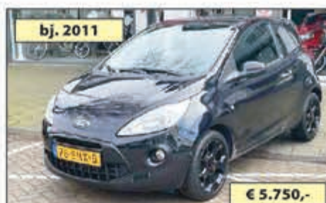
bj. 2011 FORD KA 1.2 METAL S/S € 5.750,-

AL 45 jaar een begrip in de IJmond en omstreken