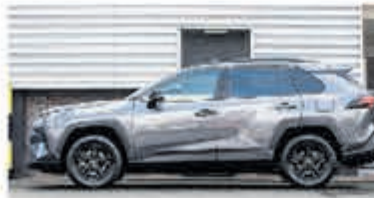
Toyota RAV4 2.5 Hybrid Dynamic € 36.900,-