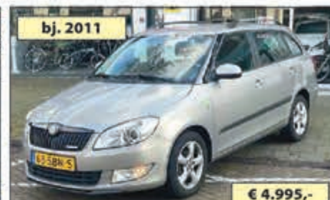
bj. 2011 SKODA FABIA COMBI 1.2 TDI GREENLINE DIESEL € 4.995,-