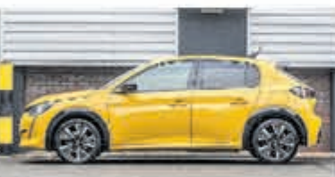
Peugeot 208 1.2 PureTech GT-Line € 25.950,-