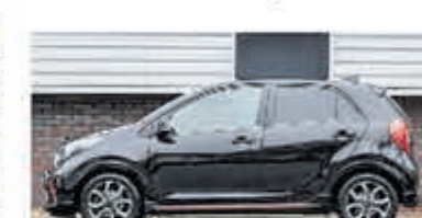
Kia Picanto 1.0 DPi GT-Line € 17.900,-