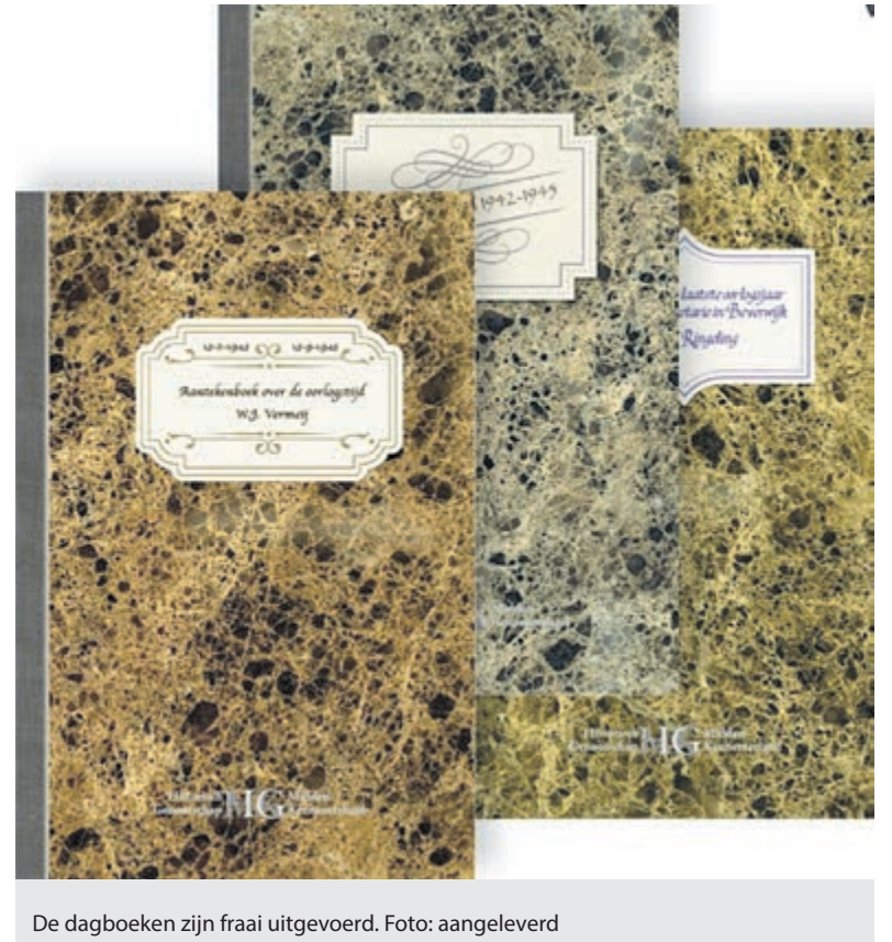
De dagboeken zijn fraai uitgevoerd.

Maak 15 euro over naar NL97RABO0107370034 t.n.v. S. Weterings, en vermeld uw adres. Binnen een paar dagen krijgt u ze in de IJmond gratis thuis bezorgd. Of mail naar pr@museumkennerland.nl .