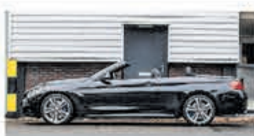
BMW 4-serie Cabrio 440i Cent Hi Exec € 41.950,-