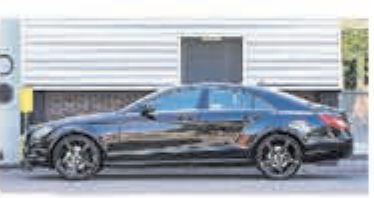
Mercedes-benz CLS-klasse 350 € 20.750,-