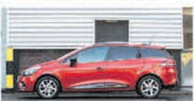
Renault Clio Estate 1.2 TCe Zen. € 15.950,-