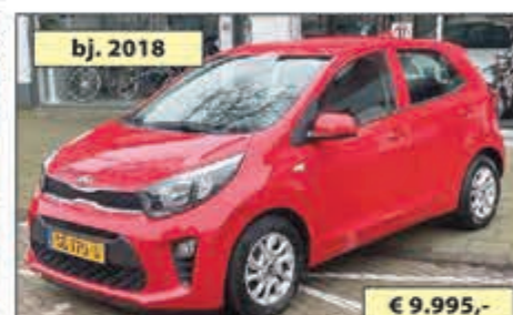
bj. 2018 KIA PICANTO 1.0 CVVT € 9.995,-