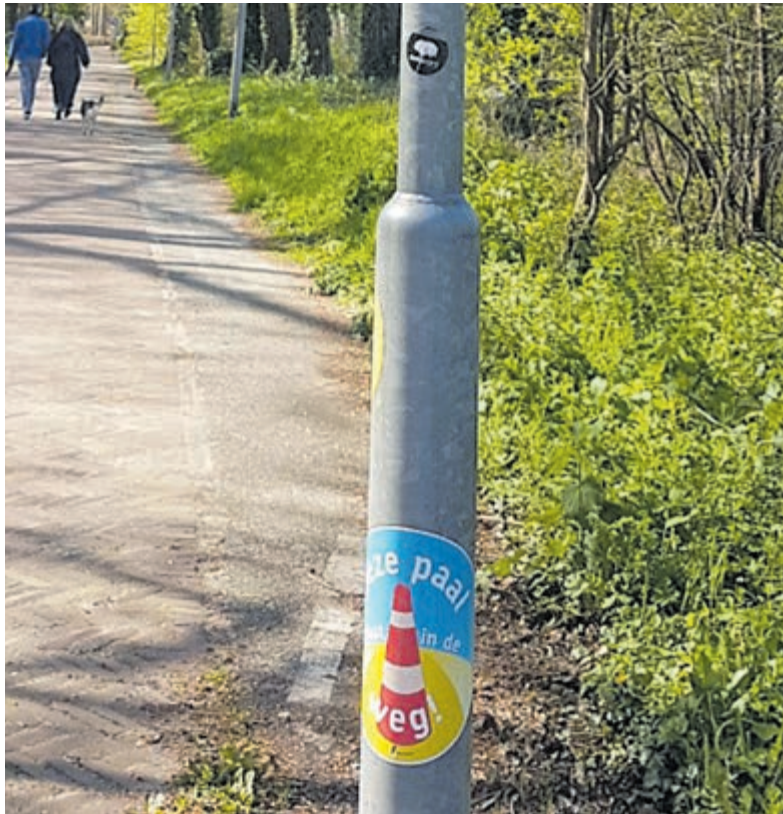
Vele stickers op palen langs fietspaden in Velsen met de tekst 'deze paal staat in de weg' attenderen de lokale overheid sinds afgelopen najaar op mogelijke onveiligheid voor de fietser.

Velsen - De Fietsersbond Nederland startte in het najaar van 2022 een campagne tegen palen op fietspaden. Deze obstakels leiden namelijk tot een groot percentage eenzijdige fietsongelukken. De campagne is bedoeld om landelijke en lokale overheden te attenderen op gevaarlijke situaties en op te roepen tot maatregelen om het fietsverkeer in goede banen te leiden. Men kon milieuvriendelijke stickers aanvragen, die op palen geplakt konden worden. Ook in Velsen zijn veel stickers geplakt. Ook op palen die niet op het fietspad staan, maar er vlak naast, binnen één stoepetegel vanaf het zogenaamde vergevingsgezinde fietspad. Als je maar heel eventjes uitwijkt, maak je als fietser namelijk ook kans op een onaangename aanvaring met die paal. Voorbeelden van genoemde stickers zijn in heel Velsen te vinden, zoals op de Hagelingerweg of de Van den Vondellaan. Op de foto is een sticker te zien, die op een paal in het bos op de Driehuizerkerkweg in Driehuis naast de sportvelden geplakt is. Of het Velsen gaat helpen met het terugdringen van het aantal fietsongelukken? Tekst: Arita Immerzeel