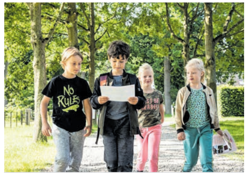
Zoek, speur en puzzel mee.

Velsen - De Fietsersbond Nederland startte in het najaar van 2022 een campagne tegen palen op fietspaden. Deze obstakels leiden namelijk tot een groot percentage eenzijdige fietsongelukken. De campagne is bedoeld om landelijke en lokale overheden te attenderen op gevaarlijke situaties en op te roepen tot maatregelen om het fietsverkeer in goede banen te leiden. Men kon milieuvriendelijke stickers aanvragen, die op palen geplakt konden worden. Ook in Velsen zijn veel stickers geplakt. Ook op palen die niet op het fietspad staan, maar er vlak naast, binnen één stoepetegel vanaf het zogenaamde vergevingsgezinde fietspad. Als je maar heel eventjes uitwijkt, maak je als fietser namelijk ook kans op een onaangename aanvaring met die paal. Voorbeelden van genoemde stickers zijn in heel Velsen te vinden, zoals op de Hagelingerweg of de Van den Vondellaan. Op de foto is een sticker te zien, die op een paal in het bos op de Driehuizerkerkweg in Driehuis naast de sportvelden geplakt is. Of het Velsen gaat helpen met het terugdringen van het aantal fietsongelukken? Tekst: Arita Immerzeel