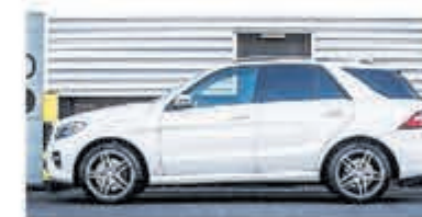
Mercedes-benz M-klasse 350 € 34.950,-