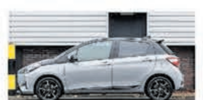
Toyota Yaris 1.5 Hyb Bi-Tone Plus € 17.950,-

Turenhout de occasiondealer van Heemstede en al meer dan 40 jaar uw vertrouwde onderhoudsadres.