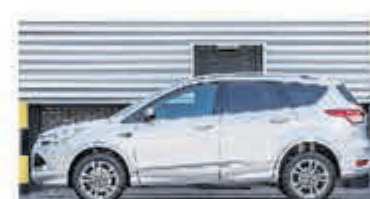
Ford Kuga 1.6 Titanium Pl. 4WD € 18.450,-