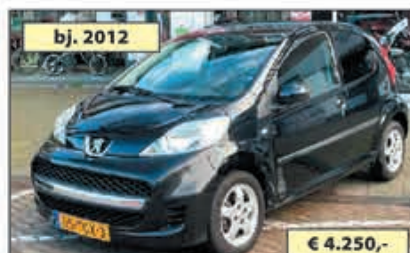
bj. 2012 PEUGEOT 107 1.0-12V BLACK & SIL € 4.250,-