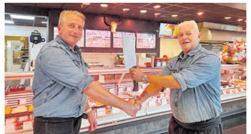
De slagersbijl wordt overgedragen aan Kokkelkoren.

worden. Voor de vaste klanten is hij inmiddels een bekende verschijning, want hij draait al ruim een half jaar mee in het team. Hij vertelt: „Ik zie de toekomst voor de slagersbranche zonnig in. De consument kiest voor kwaliteit en wij bieden die kwaliteit.”