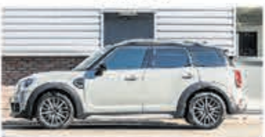
Mini Countryman 2.0 Cooper D € 16.950,-