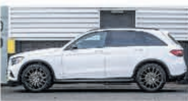
Mercedes-Benz GLC-klasse 250 d 4MATIC Luchtvering € 39.900,-