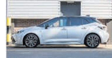
Toyota Corolla 2.0 Hybrid Dynamic € 26.700,-