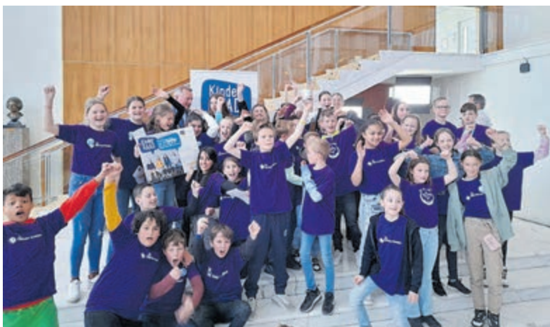
Het was een spannende dag voor de leerlingen uit groep 7 van de basisscholen Floriant, Kompas, Origon, Rozenbeek, Toermalijn en Zefier.

Velsen - Hoe werkt de gemeenteraad precies? En hoe kun je proberen om steun van andere raadsleden te krijgen voor jouw plan? Leerlingen van zes basisscholen mochten vorige week plaatsnemen op de raadszetels in het gemeentehuis. Elke school had een plan bedacht voor de gemeente Velsen en het beste idee zou daadwerkelijk worden uitgevoerd. Een mooie uitdaging voor de kinderen, die vooral bedoeld was om ze spelenderwijs bij te brengen hoe je als raadsfractie soms moet lobbyen om je voorstel om te kunnen zetten in een concreet project.