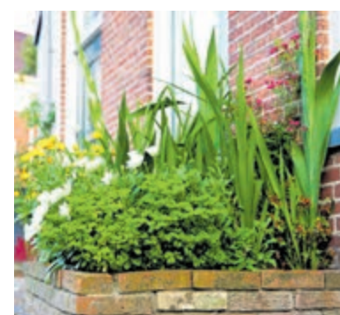
Ook een garage of schuur langs de straat kan wel wat gevelgroen gebruiken.

Met gevelgroen maak je je buurt aantrekkelijk, maar ook klimaatbestendig. Tussen de planten kan regenwater bijvoorbeeld rustig de grond inzakken (geen wateroverlast bij hoosbuien). De verkoelende