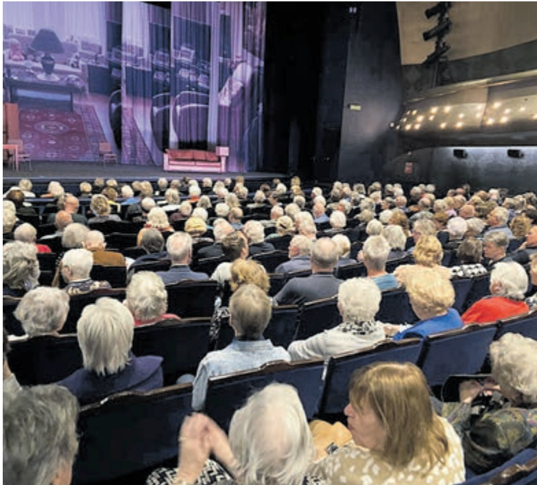
Een zaal vol heel geïnteresseerde mensen.