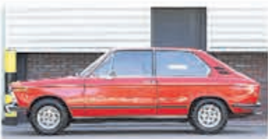
BMW 02-serie 1802 Touring € 14.950,-