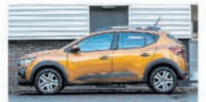
Dacia Sandero 1.0 TCe Comfort € 22.950,-