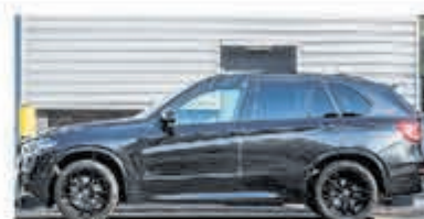
BMW X5 xDrive40e M Sp. Ed. € 56.900,-