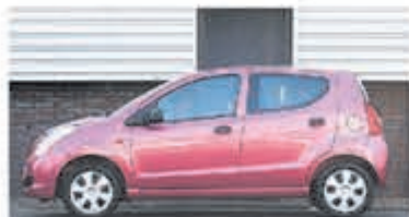
Suzuki Alto 1.0 Comfort € 4.700,-