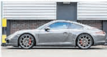
Porsche 911 3.8 Carrera S € 84.900,-