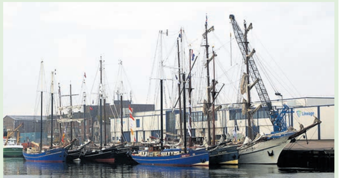
Enkele deelnemers van de 33ste Race of The Classics, afgelopen zaterdagmorgen vroeg aan de Trawlerkade.

Tegen half twee liep het eerste zeilschip weer binnen, spoedig gevolgd door de andere tien deelnemers. Verder op zee zag ik dat de laatste zeilen weer gestreken werden, dus blijkbaar was er toch voldoende wind op zee om onder zeil te gaan. Ondanks de regen, variërend van miezer tot stort, heb ik genoten van de zeilschepen, m'n portie weer binnengehaald en m'n sailgevoel weer wat opgekrikt.