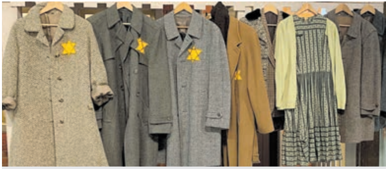
Op 4 mei 14.30 in de Dorpskerk Santpoort Noord.