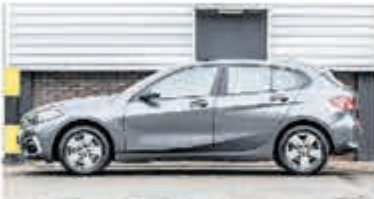
BMW 1-serie 116d Sp.Line Edition € 25.950,-