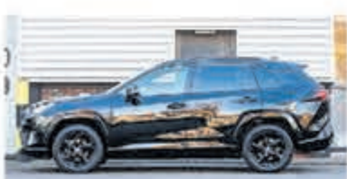
Toyota RAV4 2.5 Hybrid AWD Enrg+ € 39.950,-