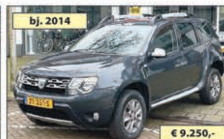
bj. 2014 DACIA DUSTER € 9.250,-