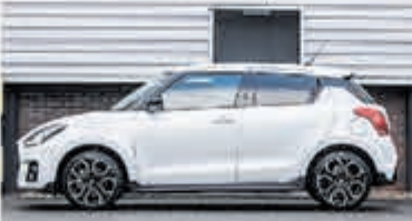
Suzuki Swift 1.4 Sport Sm. Hyb. € 22.700,-