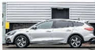
Ford Focus Wagon 1.0 EcoB. Tit. Bns € 26.900,-