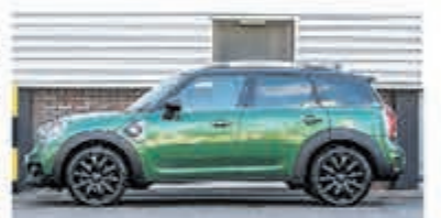
Mini Countryman 1.5 Co.S E ALL4 Chill € 35.950,-