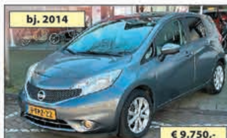
bj. 2014 NISSAN NOTE 1.2 DIG-S TEKNA € 9.750,-