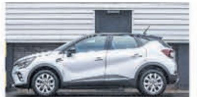
Renault Captur 1.6 Hybrid Intens € 28.950,-