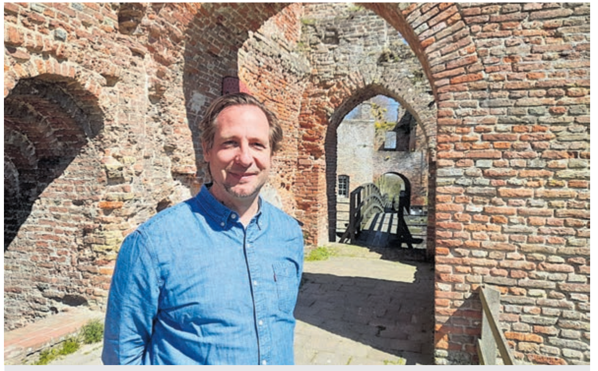
Volgens Oosterhoff leent deze locatie zich goed om mensen met verschillende interesses bijeen te brengen.

Met een 25 jaar horecaervaring, 10 jaar onderwijservaring en studies kunstge-