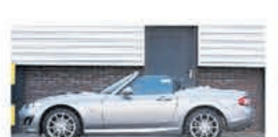
Mazda MX-5 2.0 S-VT Executive € 17.950,-