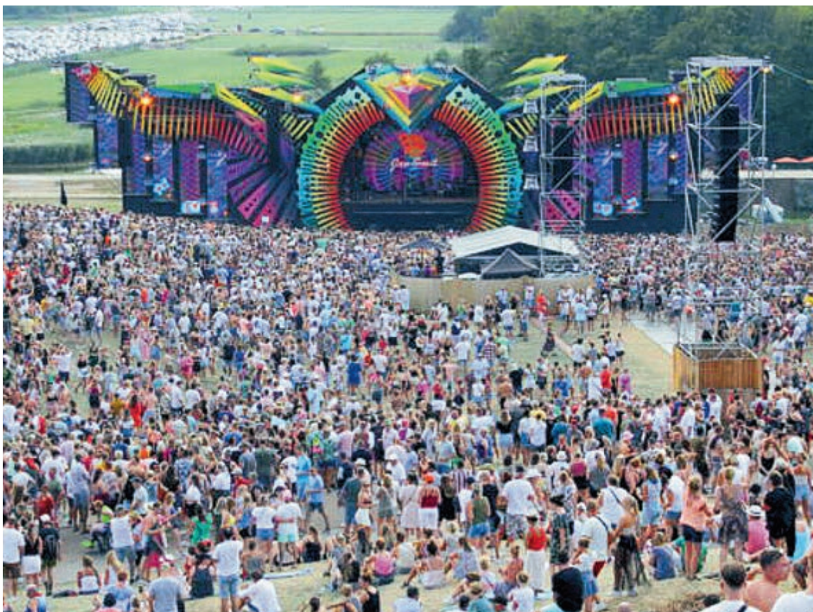
Vorig jaar was het bloedheet maar top!

Benieuwd naar de allernieuwste afslankmethodes? Breng dan een vrijblijvend bezoek aan Beauty & Afslankstudio Velsbroek aan de Klompenmakerstraat 7. Voor meer informatie: 023- 5490556 www.afslankstudiovelsbroek.nl .