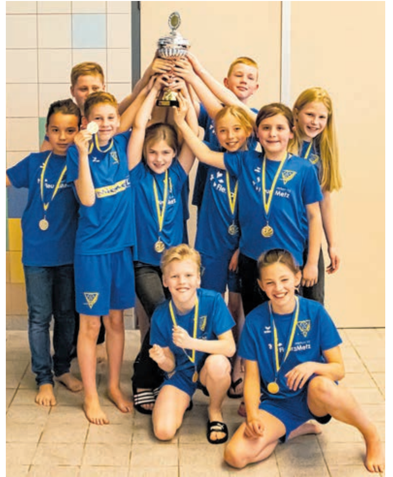
De waterpoloërs mogen zich nu echt kampioen noemen.