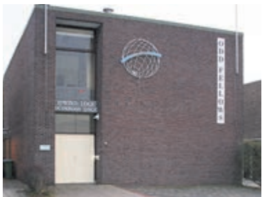
Het markante gebouw van de Odd fellows in Velsen.

Regio - De Velsense Odd Fellows hopen ook dit jaar weer een aantal nieuwe belangstellenden voor hun loges te ontmoeten in hun markante gebouw aan de Stationsweg 95 in Velsen-Zuid. Met deze oproep richten zij zich tot alle inwoners in de regio IJmond en Zuid-Kennemerland, die geïnteresseerd zijn in het doen en laten van de Odd Fellows in het algemeen en van vermelde loges in het bijzonder. De Velsense loges zijn momenteel de enige twee loges in vermelde regio.