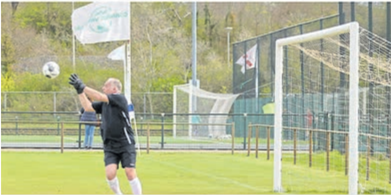
Mooie familietradities bij Stormvogels.