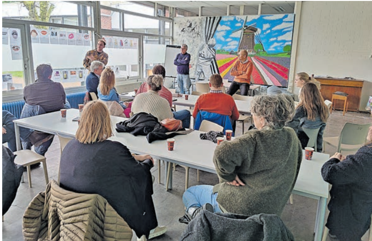
De opgedane kennis kunnen de deelnemers straks inbrengen in de bijeenkomsten van de klankbordgroep.

Santpoort - Er is een bewonersenquête gehouden onder alle volwassen inwoners van Santpoort-Zuid plus een aantal inwoners van Santpoort-Noord die vlak bij de locaties Handgraaf en De Elta wonen. Dit in het kader van het onderzoek naar een opvanglocatie asielzoekers. (AZC)