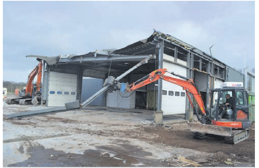
De sloop van de oude panden is begonnen.