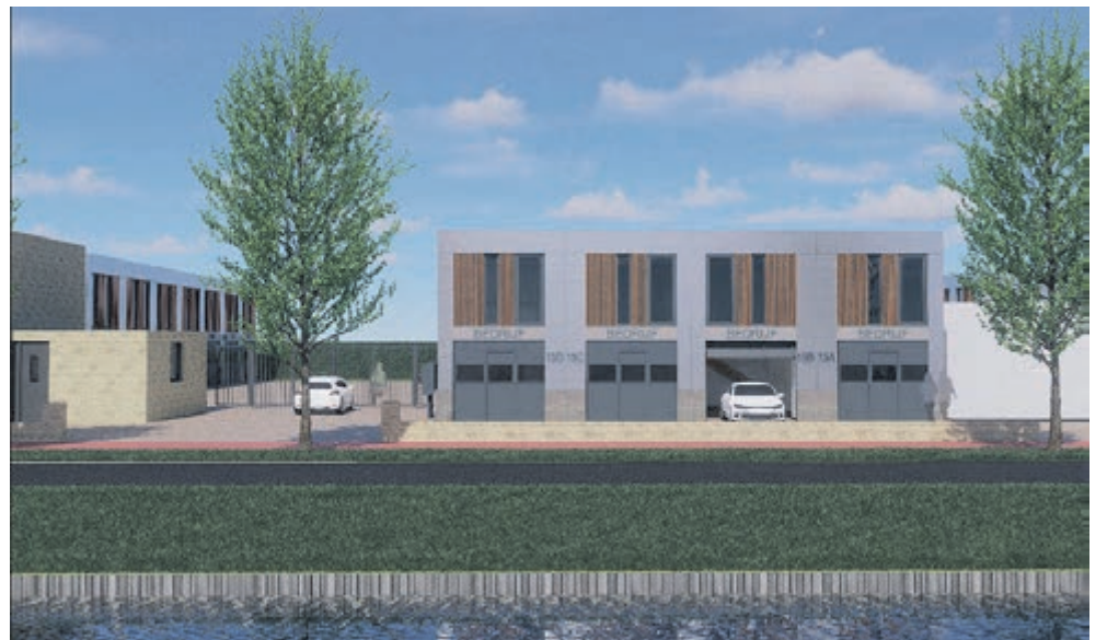
Beeld van hoe de nieuwe bedrijfsunits eruit gaan zien.