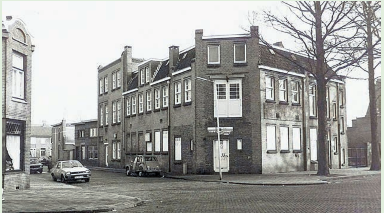
Badhuis hoek Hadleystraat-Snelliusstraat bestemd voor afbraak ten behoeve van nieuwbouw, gezien in zuidoostelijke richting, januari 1982. Foto: Noord-Hollands Archief / Beeldcollectie van de gemeente Velsen, inv.nr. 8399

Op zaterdag 15 juli 1916 wordt de badinrichting voor het publiek geopend. De was- en strijkinrichting in hetzelfde gebouw wordt pas ruim twee maanden later, eind september geopend. In de badinrichting bevinden zich acht kuipbaden op de begane grond en tien douches op de eerste verdieping. De prijzen zijn 30 cent voor een '1e klasse bad' (kuipbad) en 15 cent voor een '2e klasse bad' (stortbad, douche), beiden van maximaal dertig minuten. Een koopje, zou je denken, maar het zijn voor die tijd best wel uitgaven voor de gewone man. Daarnaast zijn er meer-baden abonnementen. Het badhuis is open op doordeweekse dagen geopend van 9 tot 9 en op zaterdag zelfs tot 11 uur 's avonds. Op zondag is het gesloten. In 1917 worden de openingstijden steeds verder beperkt vanwege de door de Eerste Wereldoorlog heersende kolenschaarste. Al snel stijgen de tarieven vanwege de kosten. Een verzoek aan de belastingen om de Coöperatieve Wasch, Strijk- en Badinrichting als 'inrichting van algemeen nut' te beschouwen en daarmee vrij te stellen van 'personele belasting', om daarmee de tarieven laag te houden, wordt in 1918 afgewezen. Toch