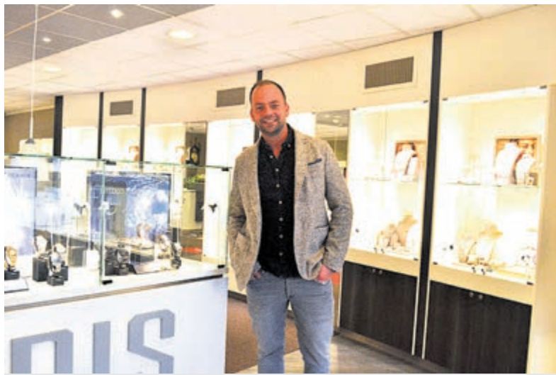
Mitchel Ris helpt en adviseert u graag.