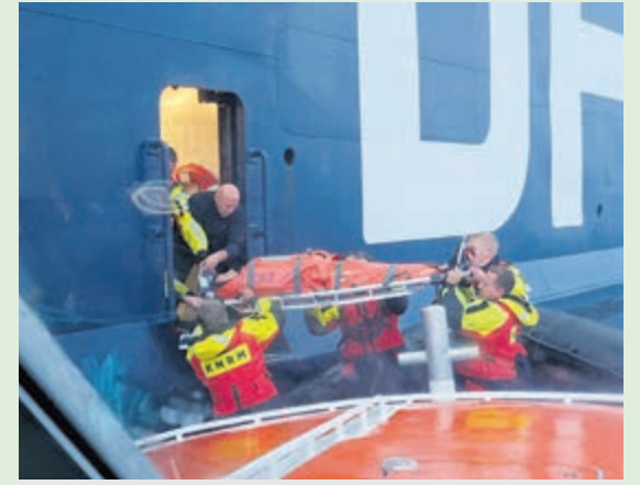
Een medische evacuatie door de redders van KNRM IJmuiden vanaf de DFDS King Seaways 2022.

Als de kapitein van een schip aan de Kustwacht een medisch probleem meldt, wordt altijd de Radio Medische Dienst (RMD) geraadpleegd. De RMD wordt gevormd door zelfstandige huisartsen met kennis van de maritieme wereld. De arts bepaalt of de situatie zo ernstig is dat een helikopter de patiënt moet ophalen