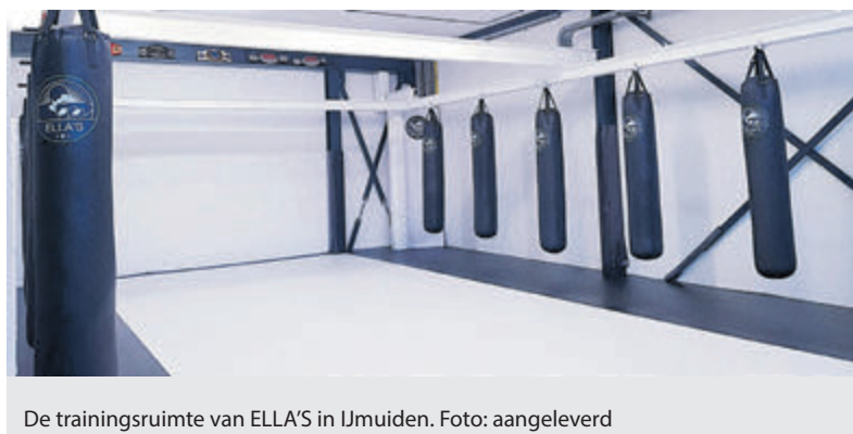
De trainingsruimte van ELLA'S in IJmuiden.

IJmuiden - In een karakteristiek en stoer pand, onderdeel van 'Les Halles' aan de Visserhavenstraat 46, zit ELLA'S, het kickbox coaching centre van Ella Grapperhaus; 'Stevige en rauwe training in een bedrijvige omgeving'.