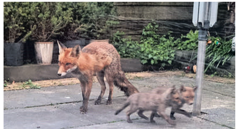
De vos en haar welpjes spelen in de tuin.

Stichting Santpoort Tekst: Annette Koster