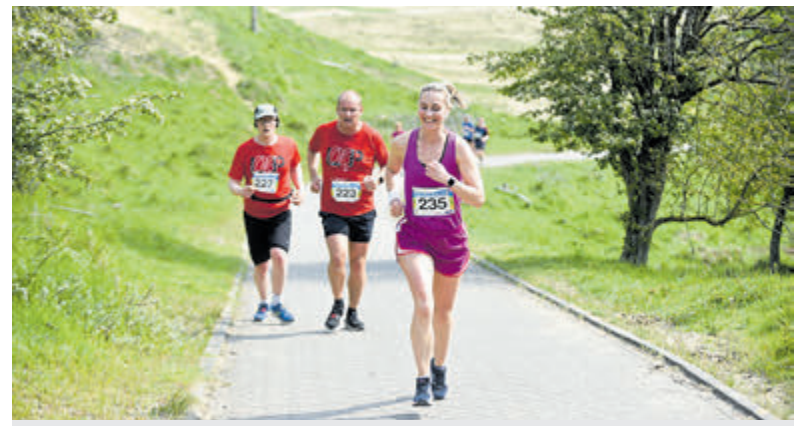
Schrijf je nu in voor de Krinkels Pim Mulierloop.

Beauty & Afslankstudio Velsbroek aan de Klompenmakerstraat 7. Voor meer informatie: 023- 5490556 www.afslankstudiovelsbroek.nl .