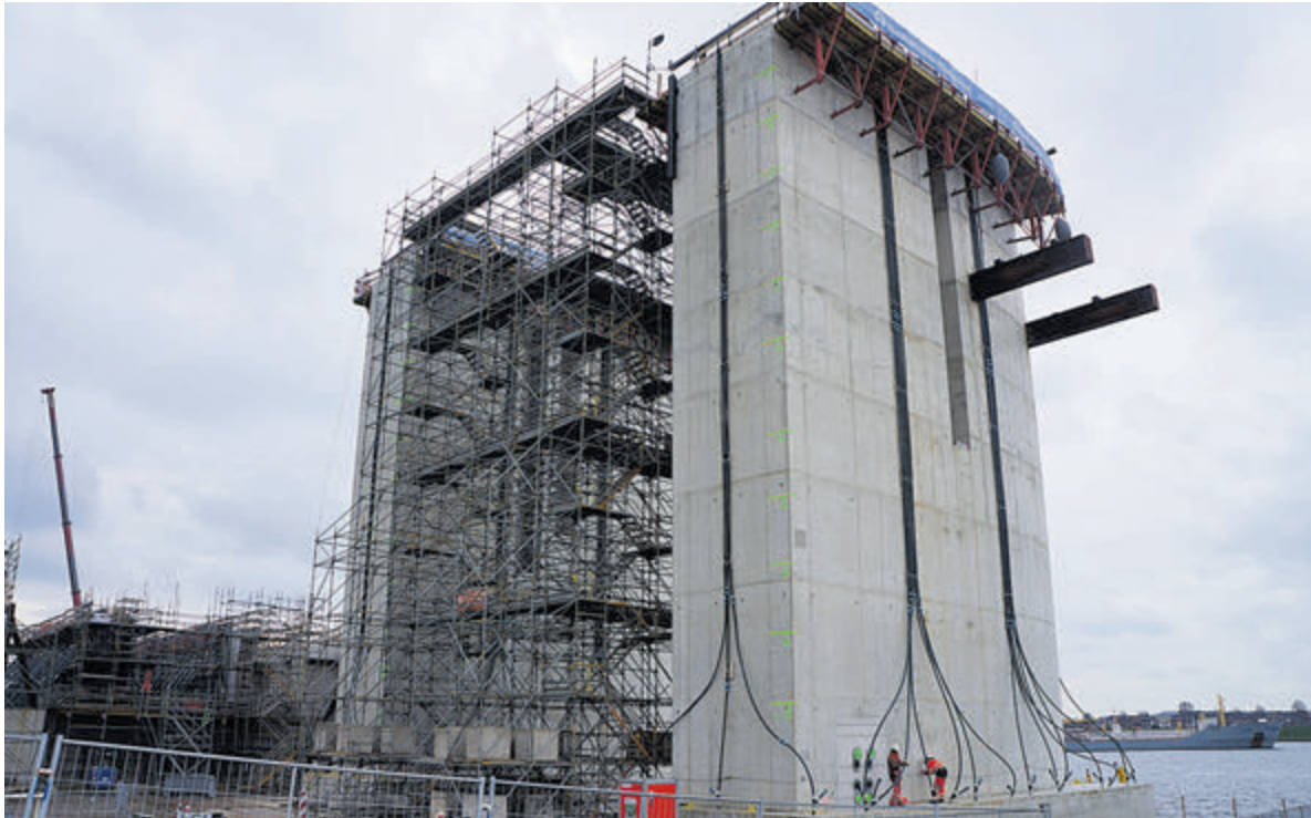
De mannen die aan het werk zijn lijken heel kleine poppetjes.