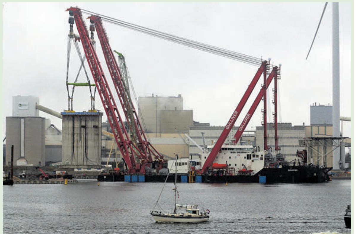
De Gulliver verplaatst de eerste zoutdampijler van de bouwplaats naar de bouwkuip in de monding van het Binnenspuikanaal.

Zaterdagmorgen rond tien over half elf wordt de eerste pijler opgetild. Langzaam maar zeker manoeuvreert de Gulliver de betonnen kolos naar de eindbestemming: de bouwkuip in de monding van het Binnenspuikanaal. Hier laat de Gulliver de pijler langzaam zakken in het water zakken en vult de holle pijler zich met water. Na enkele uren is de pijler afgezonken en moeten duikers aan het werk. Op vijfen-