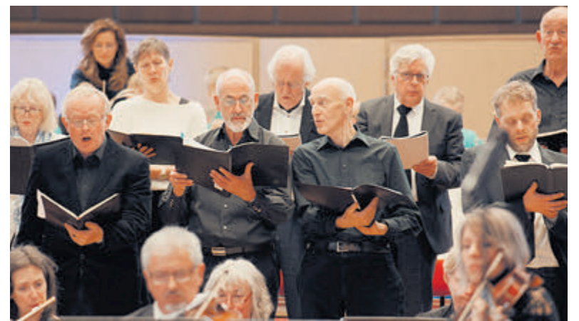
Samen de Mattheus zingen.

Alle Velsersbroekers van één tot twaalf jaar mogen meedoen aan deze wedstrijd. Het enige dat ze moeten doen is hun feestelijk versierde fiets laten zien ter hoogte van de Zeeman. Daar zijn bestuursleden van de Dorpsvereniging aanwezig. Speciaal