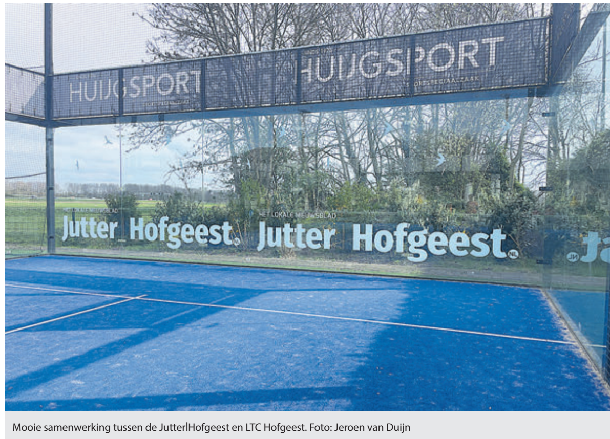
Mooie samenwerking tussen de Jutter|Hofgeest en LTC Hofgeest.

Een papieren versie van de overige bekendmakingen ligt bij: Gemeentehuis Velsen, Dorpshuis Het Terras, Buurtcentrum De Dwarsligger, Buurthuis De Brulboei, Wijkcentrum De Stek, Wijkcentrum De Hofstede, Bibliotheek IJmuiden, Bibliotheek Velsbroek, uitleenpunt Huis ter Hagen en uitleenpunt de Moerberg. Voor de inzage van stukken kunt u naar het gemeentehuis.