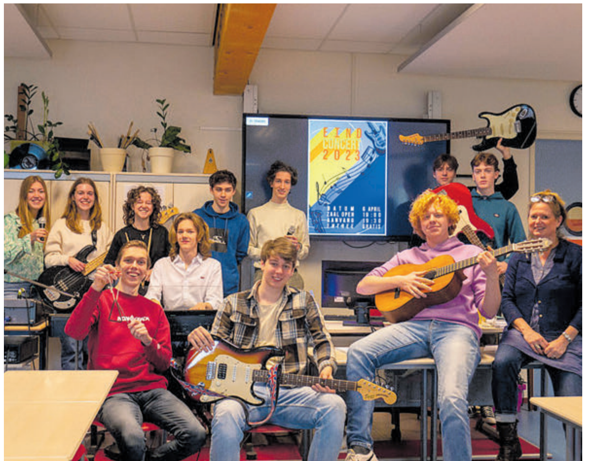
De examenklas muziek van het Felisenum.