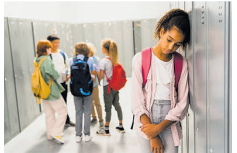
De Verenigde Naties hebben 21 maart uitgeroepen tot Internationale Dag tegen Racisme en Discriminatie.

De Verenigde Naties hebben 21 maart uitgeroepen tot Internationale Dag tegen Racisme en Discriminatie vanwege het zeer gewelddadige optreden van de overheid in Zuid-Afrika in 1960 ten tijde van het apartheidregime toen er gedemonstreerd werd tegen discriminerende pasjeswetten. De politie schoot 69 demonstranten dood.