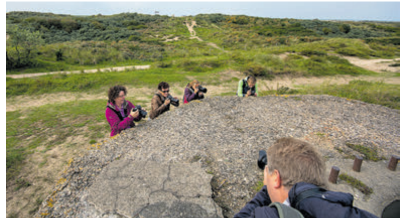
Workshop Bunkerfotografie.