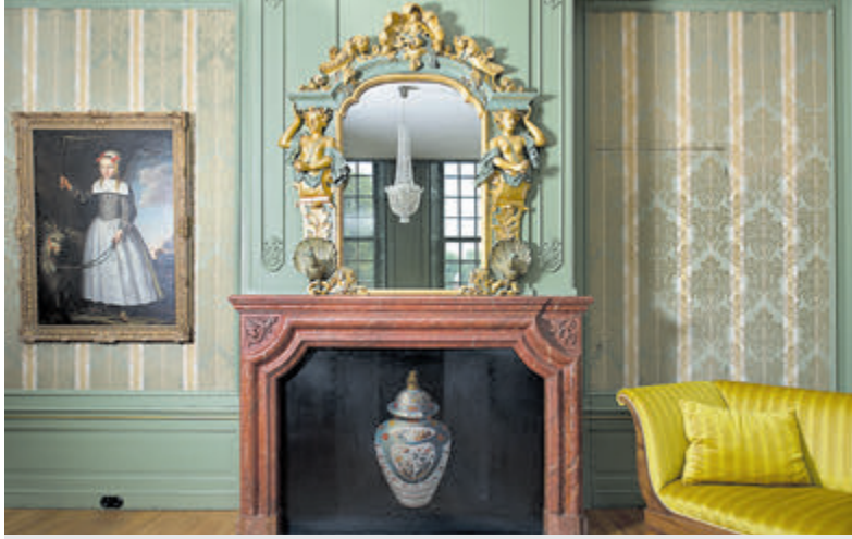
Beeckestijn is een van de weinige buitens die in zijn geheel bewaard is gebleven.