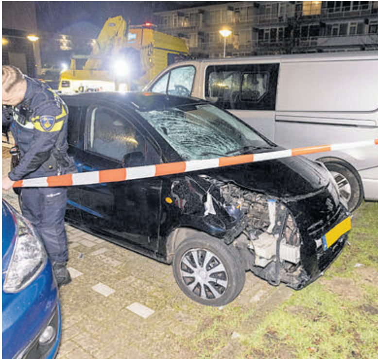
De auto biedt een schokkende aanblik.