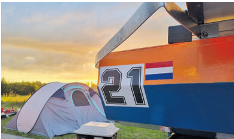
Het bouwen van de solar boot is een uitdaging op zich, waarbij de studenten leren over technologie, duurzaamheid en teamwork.

Op woensdagochtend 22 maart zijn de planten in de tuinen gezet. Er staat ook lavendel en blaustrumpf, dit zijn planten waar herten niet van eten, de hoop is dat ze daarom ook de andere planten met rust zullen laten.