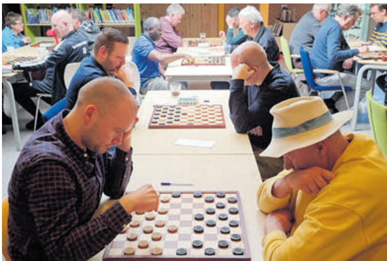
Alleen spelers die in een kust- of vissersdorp geboren zijn, wonen of dammen waren uitgenodigd.

IJmuiden - De damsport kent veel toernooien met een open inschrijving. Hierdoor kun je als leek soms een grootmeester treffen. Afgelopen zaterdag organiseerde Damclub IJmuiden (DCIJ) echter een toernooi waaraan slechts een select gezelschap mocht meedoen. Alleen spelers die in een kust- of vissersdorp geboren zijn, wonen of dammen waren uitgenodigd.