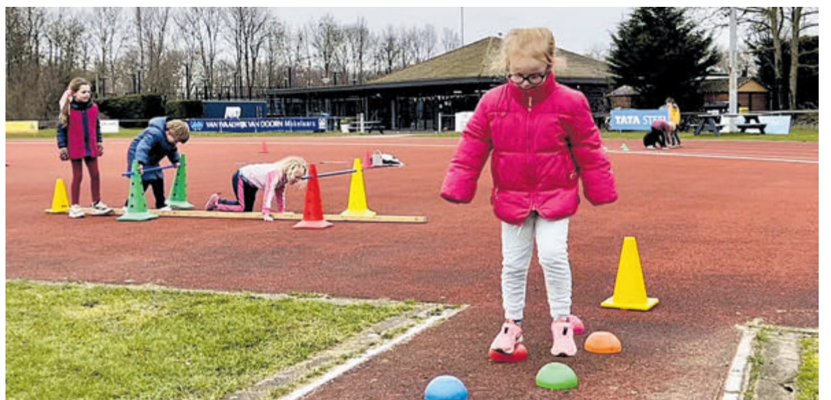
Alle basisonderdelen van bewegen komen aan bod.

Meer weten? Neem contact op via info@avsuomi.nl . Of kijk op www.avsuomi.nl voor meer informatie.