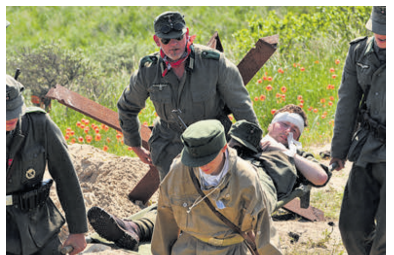
Historisch weekend in de bunkers 2017.