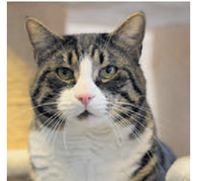
Duncan zit op de kattenafdeling van Kerbert Dierentehuis maar hij is een beetje schuw.

prijzen gesponsord door verschillende bedrijven.