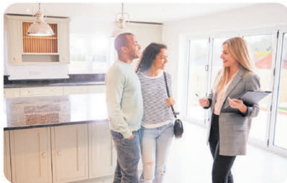
Je neemt een kijkje én kunt gelijk vragen stellen aan de huidige eigenaar.

zen Route is de ideale manier om met jouw huizenzoektocht te beginnen. Open Huizen Route locaties Ben je al een tijdje op zoek naar je droomhuis? Dan is de Open Huizen Route handig om een groter zoekgebied te verkennen. Wie weet staat die ene mooie woning wel in een andere buurt. Het voordeel van de bezichtiging is dat je de huidige eigenaren ontmoet. Zij kunnen je alles over de buurt