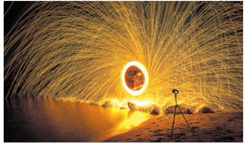
Nachtfotografie met staalwol.

Jaap: „Ik ben altijd op zoek naar het unieke plaatje, qua belichting, compositie en alles. Onderwerpen die nog nooit op juist die manier zijn vastgelegd. Ik ben geen fotograaf die mééloopt, ik wil zelf bepalen wat ik doe, de vrijheid hebben. Geen photoshop ook, alles is 'realtime'." Allebei: „Het fotograferen van evenementen, zoals de Vissenloop, het Havenfestival, het Historische Weekend van het Bunkermuseum en het Zomerfestival is ook fijn om te doen door de gezelligheid, de verbondenheid en de warmte van de mensen." Hou ze in de gaten, al deze fotografen van FishEye.events.