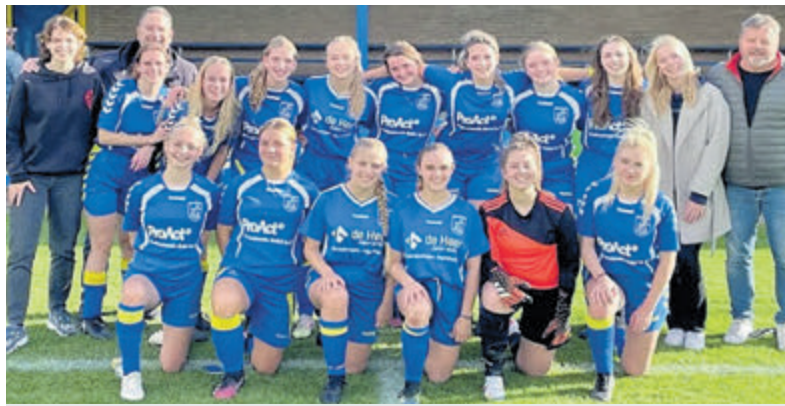
De dag is voor alle meiden tot en met 20 jaar.