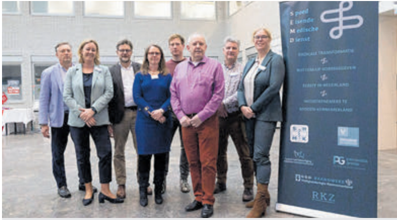
Op maandag 20 maart 2023 tekenden alle partijen tijdens een grote bijeenkomst een intentieverklaring.