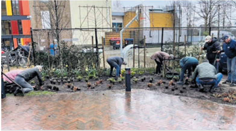
Vorige week woensdag zijn de planten in de tuinen gezet.