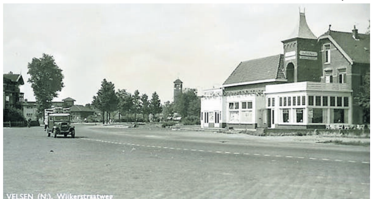
VELSEN (N.), Wijkerstraatweg

Enmaal in Kamp Amersfoort aangekomen begon de ellende, van honger, lijfstraffen, slechte hygiëne en andere ontberingen. Na ongeveer drie maanden kwam daar een eind aan en werden ze op transport gezet naar de werkkampen in het oosten van Duitsland, met name in de omgeving van Braunschweig en Leipzig waar de kampen nog erger waren dan in Amersfoort. Dit duurde tot het vroege voorjaar in 1945 toen de Amerikanen, ze bevrijdden. Maar helaas voor 65 jongemannen uit Velsen-Noord, Beverwijk, Uitgeest, Haarlem en Amsterdam kwam dit allemaal te laat. De herdenking op zondag 16 april vind plaats om 11.30 uur op het Stationsplein in Beverwijk.