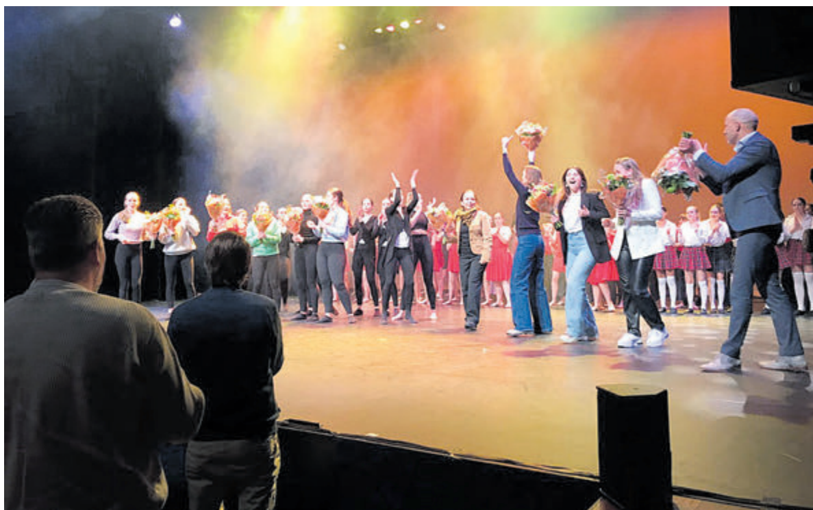
Een groep getalenteerde, fijne en hardwerkende leerlingen verzorgde een spetterende avond.

Zeeland, ook in de grotere landgoedbossen op de Oude Duinen. Binnen het duingebied kunnen ze bijna overal worden gespot, van de zeereep tot in de binnenduinen. Bossen en struiken, afgewisseld met open plekken, vormen het favoriete leefgebied. De kans om ze te zien is het grootst langs bos- en struweelranden in halfopen duin. Ze houden van rust, dus ga op zoek in terreinge-deelten waar niet al te veel mensen komen. De meeste reeën worden gezien het vroege voorjaar, maar je kan ze ook in andere delen van het jaar tegenkomen. Het meest actief zijn ze in de ochtend- en avondschemering. Vaak is het dan ook heel rustig in het duin, dus sowieso een mooi moment om er op uit trekken.