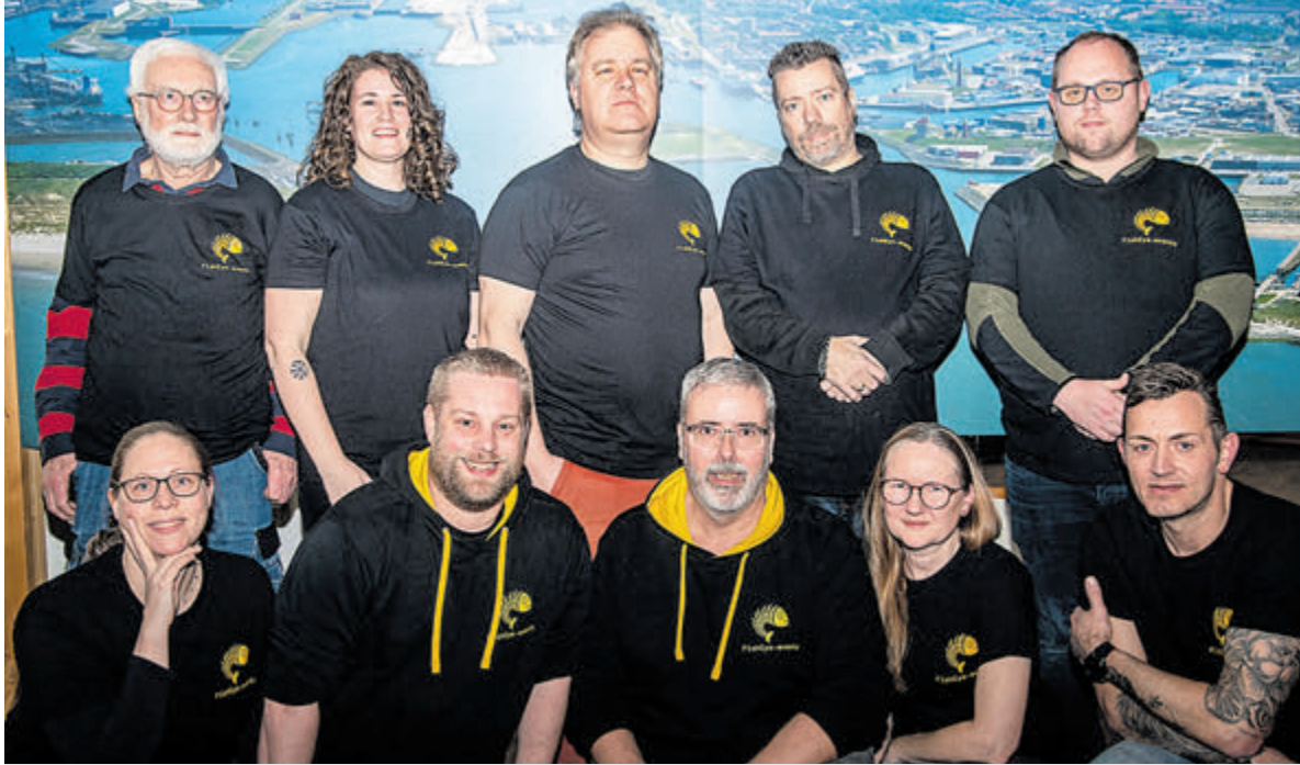
Team FishEye.events.

IJmuiden - Je ziet hun foto's overal op Facebook in diverse groepen. Je ziet ze op Instagram. Je ziet ze ook vaak in de Jutter|Hofgeest. Foto's van de getalenteerde en creatieve fotografen die Velsen rijk is. Een aantal van hen heeft zich verenigd in een groep onder de naam FishEye.events. Het doel is om de schoonheid en stoerheid van IJmuiden en heel Velsen te laten zien waarbij iedere fotograaf wel zijn of haar eigen specialiteit of insteek heeft.