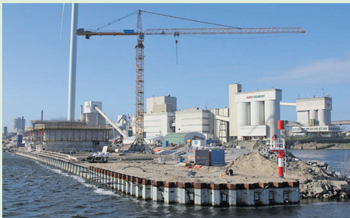
De landtong aan de noordzijde van het Binnenspuikanaal. Op de oever worden nu de pijlers (de bouwwerken in de steigers rechts op de foto) en later de betonwanden van de zoutdam opgebouwd. Op de achtergrond zien we het complex van de CEMJ.