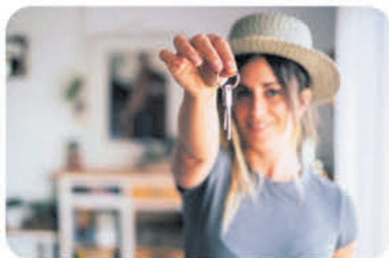
Met deze tips is jouw droomhuisje binnen handbereik!

Kijk naar de mogelijkheden van een Starterslening. Dit is een aanvullende lening op je reguliere hypotheek voor je eerste woonhuis. Deze lening kan het verschil overbruggen tussen de prijs van de woning en je maximale hypotheek. Veel gemeenten bieden een Starterslening aan, dus vraag naar de mogelijkheden bij jouw gemeente.