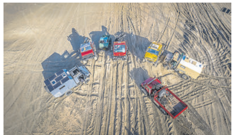
Umimogs en Groter.