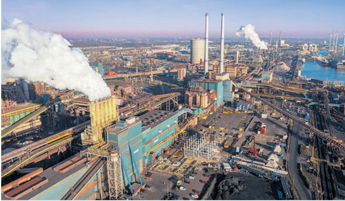
De in aanbouw zijnde ontstoffingsinstallatie bij de Pelletfabriek.

Velsen - Deze week bracht het RIVM een rapport uit over depositie - het neerslaan van stoffen - in de IJmond. Het instituut heeft onder meer onderzocht hoeveel PAK's en metalen in het stof zit wat in de IJmond op de grond wordt aangetroffen. De onderliggende metingen zijn afgelopen najaar uitgevoerd en is een vervolg op vergelijkbare RIVM-onderzoeken uit najaar 2020 en voorjaar 2022.