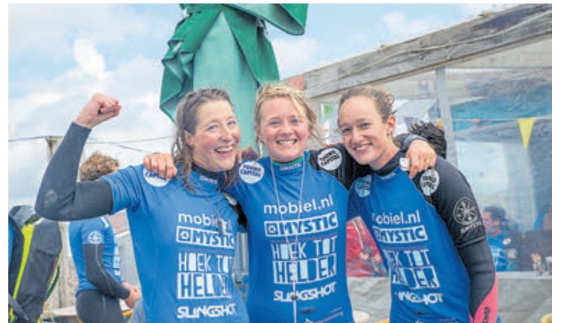
Hoek tot Helder 2017.