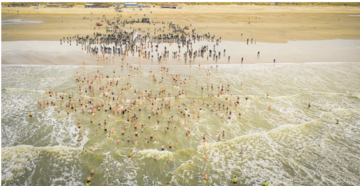
Nieuwjaarsduik 2023