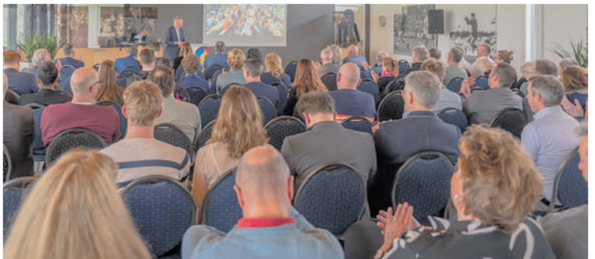
Het thema van de vijfde Evenemententop was 'Duurzaam verbonden'

De oudste vertelde vervolgens het verhaal van de Uittocht uit Egypte, (de Exodus), Joden verlost van slavernij, op weg naar een nieuw begin. Samen dronken we de limonade, doopten de matses (ongezuurd brood) met de bittere kruiden (waaronder radijs) in een zoete saus en sloten af met lekkere hapjes, gemaakt door moeders. Jodendom ziet de Uittocht uit Egypte als het begin van een nieuw leven. Christendom ziet de opstanding van Jezus ook als een nieuw begin.