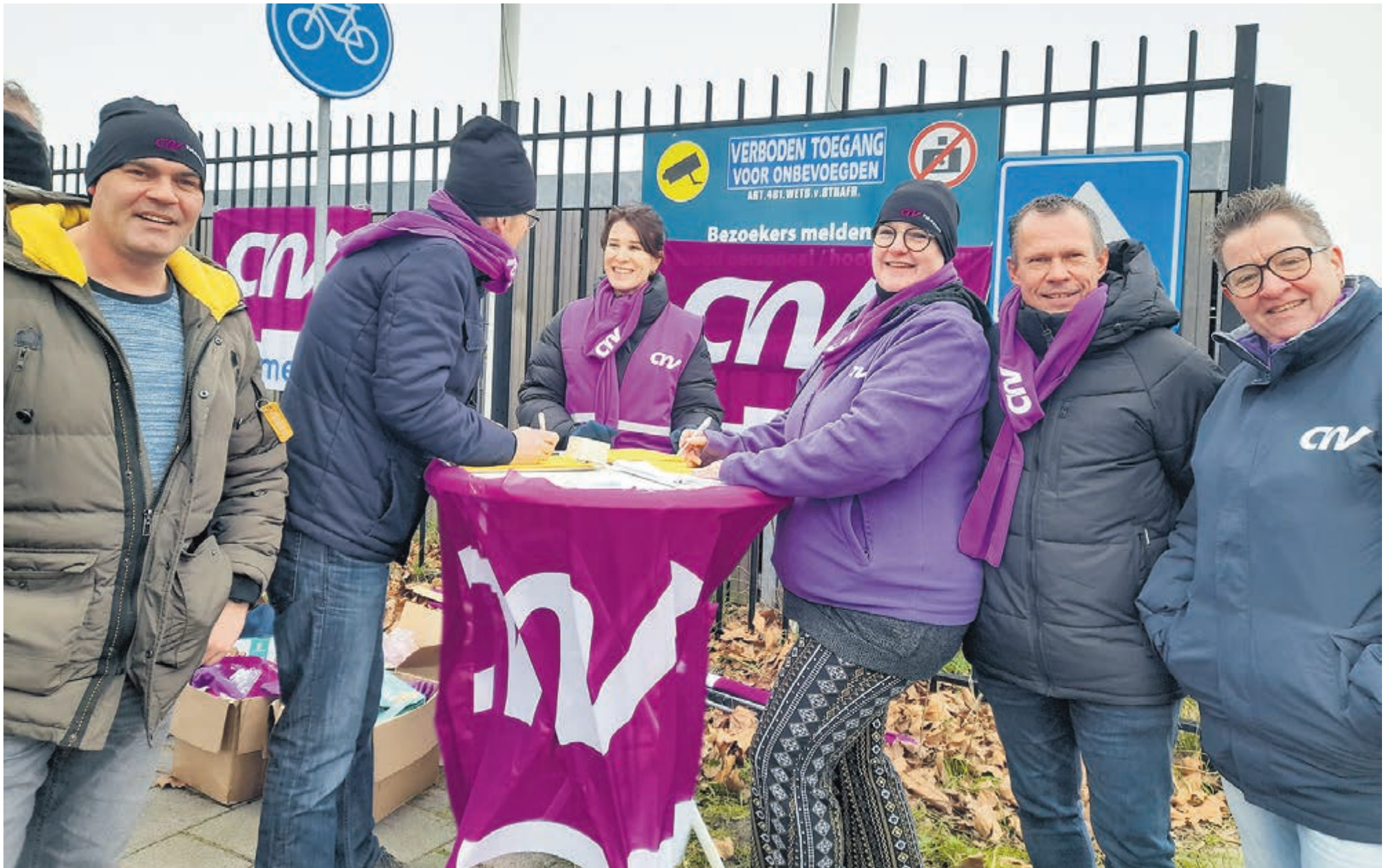
Chaufeurs in het streekvervoer staken voor een hoger loon en een verlaging van de werkdruk.