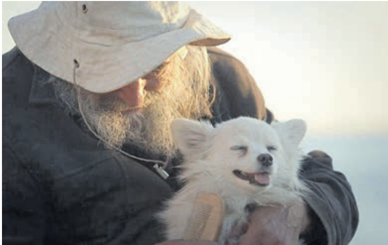
Scene uit de film Where are you Adam?