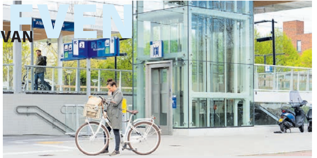
Goed bereikbare locaties zorgen voor kortere reistijden en minder verkeersbewegingen.

genheid om de inzet van nieuwe technologieën te versnellen. In de wegbeheerdersrol wordt bijvoorbeeld prioriteit gegeven aan fietsers op de doorfietsroutes, door gebruik van slimme sensoren bij verkeerslichten. In de rol van concessiebeheerder wordt het gebruik van deelfietsen gestimuleerd. Daarnaast zorgt de provincie dat er goed om gegaan wordt met de schaarse ruimte. Rond stationsgebieden wil de provincie zoveel mogelijk woningen, bedrijven en voorzieningen treffen. Goed bereikbare locaties zorgen voor kortere reistijden en minder verkeersbewegingen. De provincie Noord-Holland pakt haar rol met het oog op grote maatschappelijke opgaven zoals de woningbouwopgave en klimaatdoelstellingen. Zo blijft Noord-Holland leefbaar en bereikbaar, voor nu en in de toekomst.