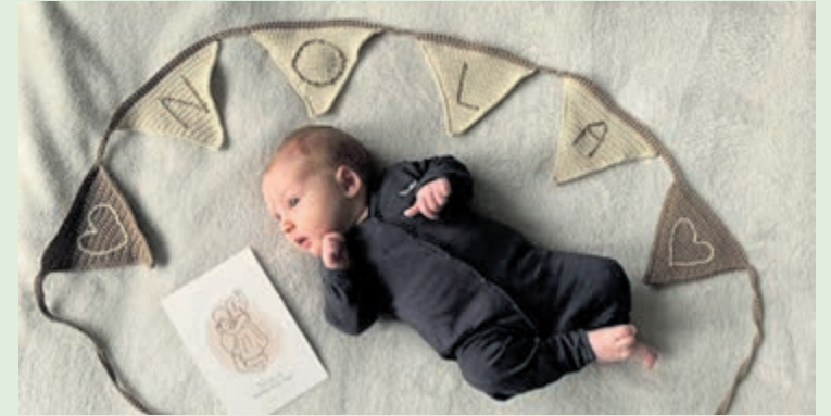
Nola maakt dat iedereen in de wolken is.