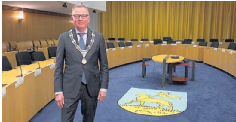
De Kinderraad Velsen heeft als doel kinderen te laten kennismaken met politiek.