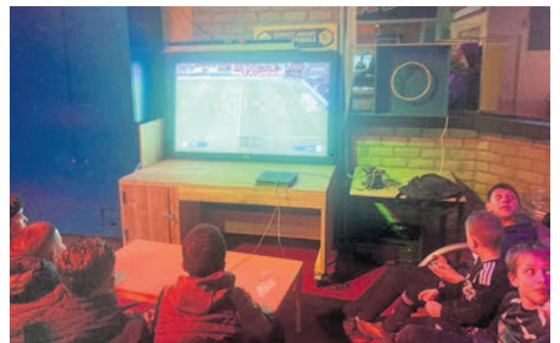
Meer dan veertig jongeren spelen mee.