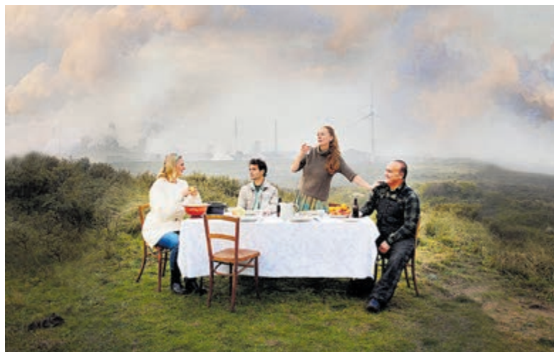
Een familiedrama rond onder andere Tata Steel in het Hoogovensmuseum.