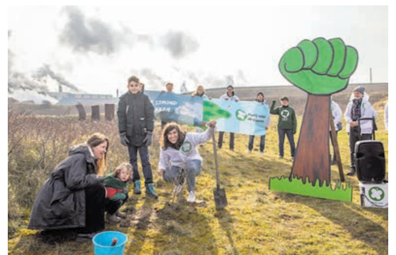
De actie bij Tata Steel was onderdeel van de Team Planet Estafette, een veertiendaagse estafetteloop van de Partij voor de Dieren door Noord-Holland.

Voor meer informatie zie www.pietervermeulenmuseum.nl .