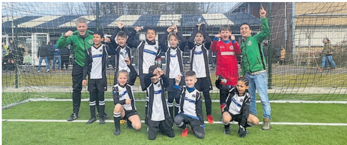
Kansen dwing je af...

Met vragen over de uitvoering van de aanleg van glasvezel kunnen inwoners contact opnemen met Circet Nederland. Zij helpen graag op werkdagen van 8:00 tot 16:30 uur en zijn bereikbaar via 088 - 18 18 190 of deltafibernetwerk.veenendaal@circet.nl . Inwoners kunnen via de postcodecheck op www.deltanetwerk.nl de voortgang van de aanleg van het glasvezelnetwerk op hun adres bekijken.