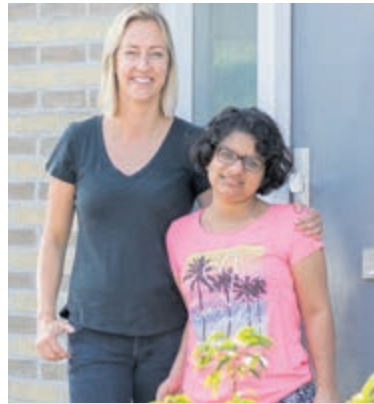
In het gezinshuis wordt kleinschalig gewoond en geleefd met elkaar.

langs te komen om in een persoonlijk gesprek al uw vragen te laten beantwoorden. U kunt op de volgende manieren contact opnemen: door te bellen met Letty Wardenaar 0647675185 of stuur een e-mail naar: wonen@ookvoorjou.com. Voor aanvullende informatie kunt u ook terecht op de website: www.stichting-ookvoorjou.nl.