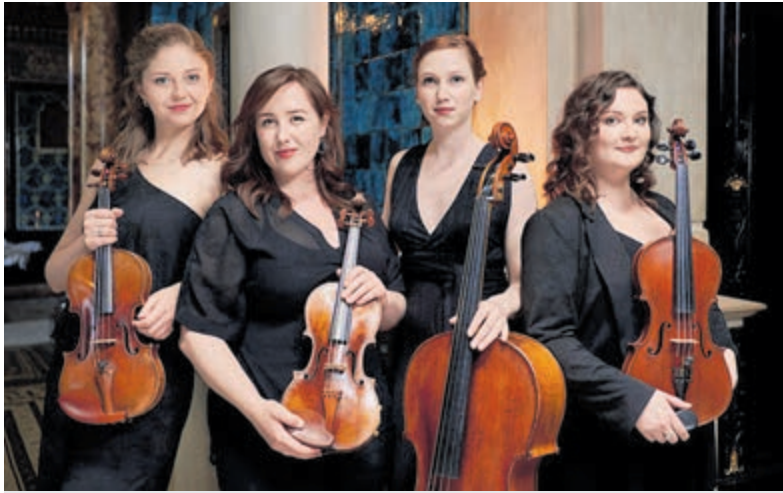
De leden van het Alkyona Kwartet.