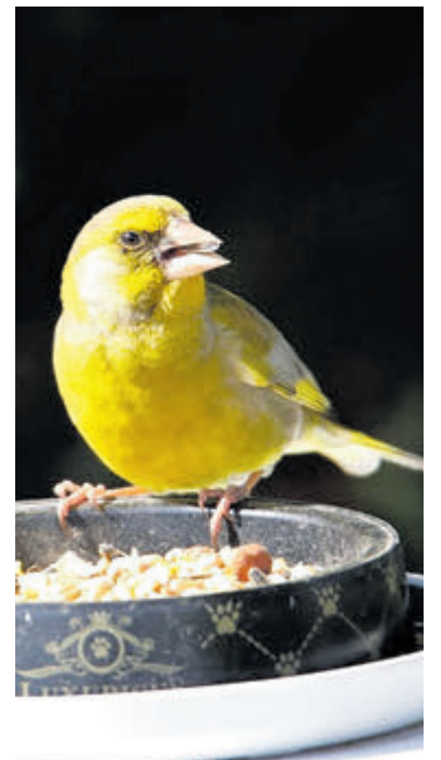
Dit is een Groenling. Als je lief voor vogels wil zijn volg je de tips van het Vogelhospitaal.

Water aanbieden is wenselijk, mits het niet vriest. „Bij koud weer kunnen vogels erdoor onderkoeld raken als ze erin gaan badderen, dus zet ook geen warm water in de tuin,“ aldus het hospitaal. „Suiker in water is eveneens een slecht idee, omdat dit