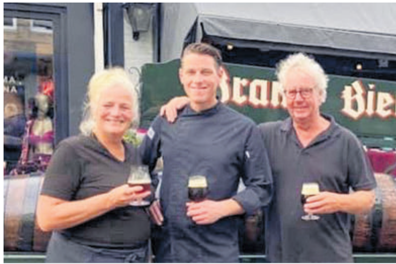
Het team van 't Palet. Tijd voor een nieuw hoofdstuk.