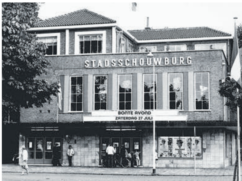
Onder de titel LICHT UIT LICHT AAN worden van 21 tot en met 28 juli 2024 diverse voorstellingen geprogrammeerd.

IJmuiden - Vanaf 1 augustus 2024 ondergaat Stadsschouwburg & Filmtheater Velsen een ingrijpende verbouwing, waarvoor de deuren tijdelijk gesloten zullen worden. Het historische gebouw, dat dateert uit 1938 en zich bevindt aan de Groeneweg 71 in IJmuiden, wordt gerenoveerd waarbij de kenmerkende sfeer van de huidige zaal behouden blijft.