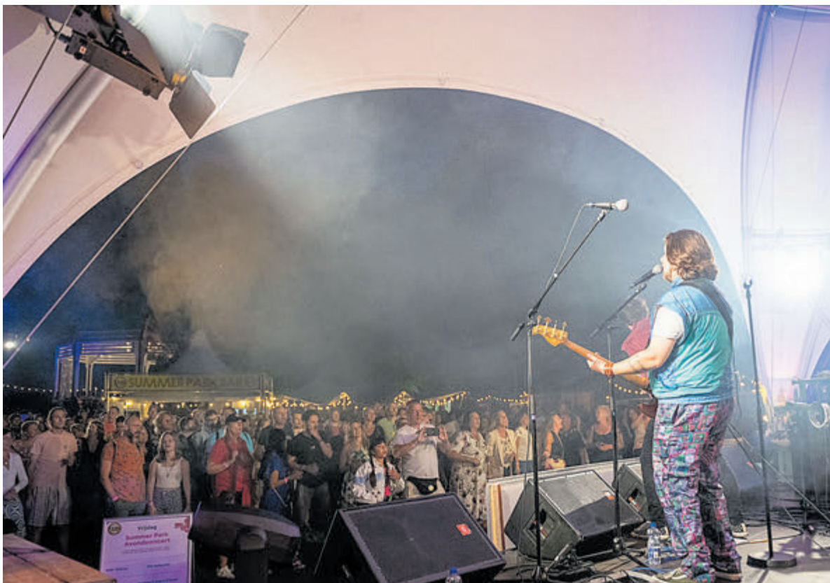
Velsen kan zich weer gaan verheugen op het inmiddels bijna legendarische Summer Park Sessions.