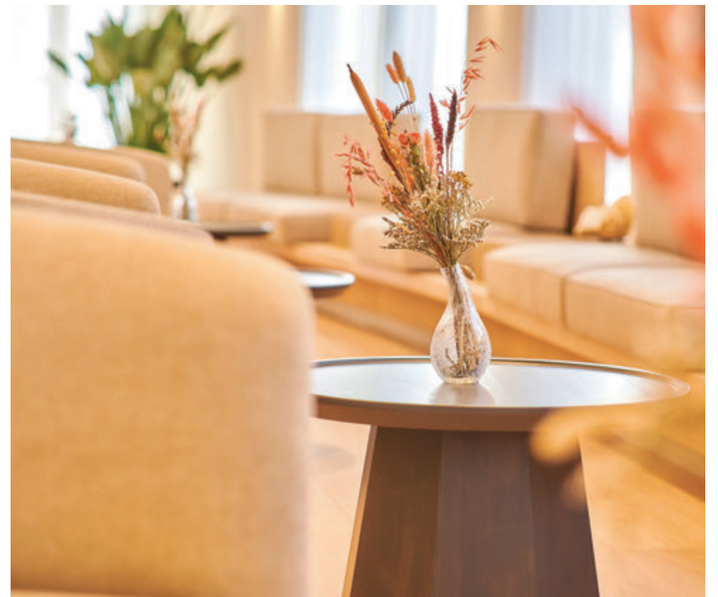
Tijdens de rondleiding op 4 februari krijgt iedereen een kijkje achter de schermen en kunnen alle ruimtes, waaronder de nieuwe Lindezaal, rustig worden bekeken.