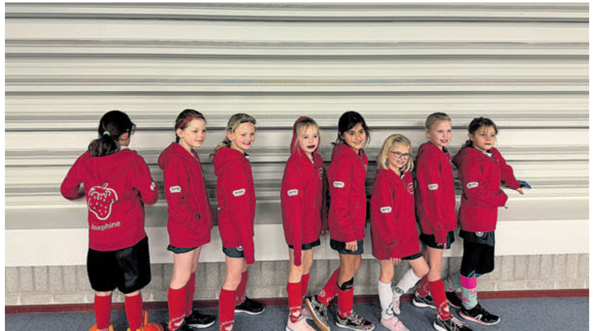
De meiden stralen in hun nieuwe hoodies.

Driehuis - Aventel, dé lokale partner voor zakelijke telefonie en internet, ondersteunt met trots hockeyclub KHC Strawberries. Binnenkort zal langs de velden een mooi doek te zien zijn, en extra opvallend straalt Team Meisjes 09 Groen in gloednieuwe, stijlvolle hoodies. Deze specifieke steun benadrukt niet alleen de betrokkenheid van Aventel bij de sport, maar ook de toewijding aan de jonge talenten van Team Meisjes 09 Groen. Het doek en de hoodies zijn een warm gebaar van waardering voor KHC Strawberries. Na een winter van binnen hockeyen kijkt iedereen uit naar het buitenseizoen dat alweer voor de deur staat. Aventel hoopt samen met KHC Strawberries bijzondere momenten te beleven, zowel op als buiten het veld.