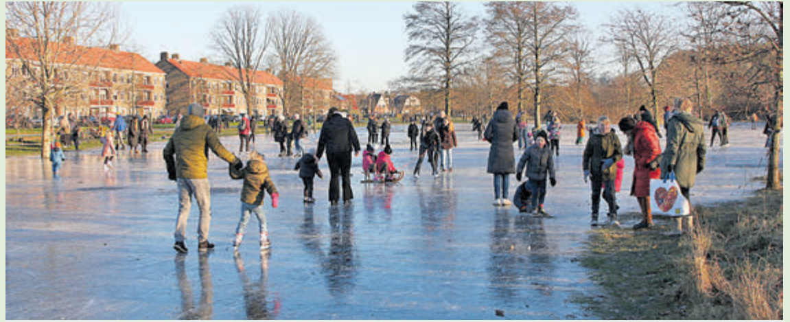
Ijspret op het bevroren ondergelopen veld langs de Heerenduinweg.

Voor schaats- en ijspretliefhebbers heeft het hoge grondwater ook zo z'n voordelen. De vorst van vorige week heeft geleid tot een spontane natuurijsbaan op het ondergelopen gebied langs de Heerenduinweg tussen het zwembad De Heerenduinen en het Schapenlandje. Vorige week dinsdag, na een nacht met enkele graden vorst, maakten hier al enkele schaatsers hun eerste voorzichtige slagen. Helaas won IJmuiden het niet van