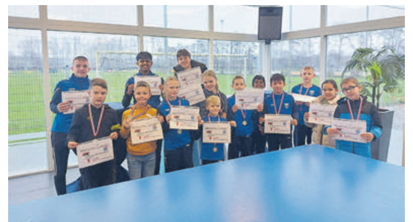
De enthousiaste jeugd van FC Velsenoord met de vouchers voor AZ-PEC Zwolle.

Op 1 maart sluit het inschrijfformulier en begint de organisatie aan de programmering, later dit jaar zal dan duidelijk worden wat er allemaal te doen en te beleven is op het culturele openingsfeest van seizoen 2024 – 2025 in Park Velserbeek.