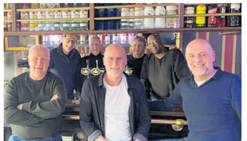
Het organisatiecomité van de reünie.