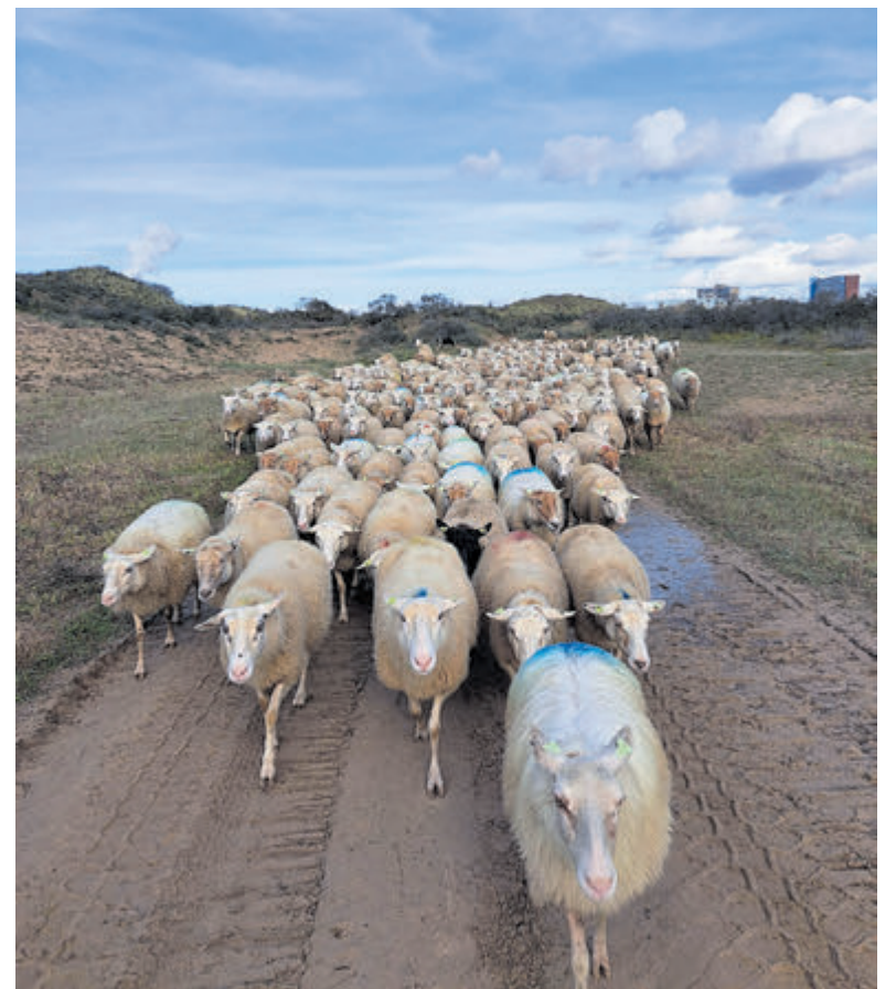
De kudde schapen op landgoed Duin en Kruidberg.

De bewoners zien ook volop kansen om – ook met inzet van lokale vrijwilligers – allerlei dagelijkse zaken voor de toekomstige bewoners van het centrum zo te regelen dat zij daar een aangename woonomgeving en nuttige tijdsbesteding hebben: „Denk daarbij aan werk, school, taallessen, samen eten met buurtbewoners en dergelijke. De interculturele ontmoetingen die dat oplevert, zijn vaak vruchtbaar, verdiepend en interessant voor alle betrokkenen.” Verder ziet de groep kansen voor een herinrichting van de sportvelden van SV Terrasvogels, zodat deze vereniging er juist ook beter van wordt.