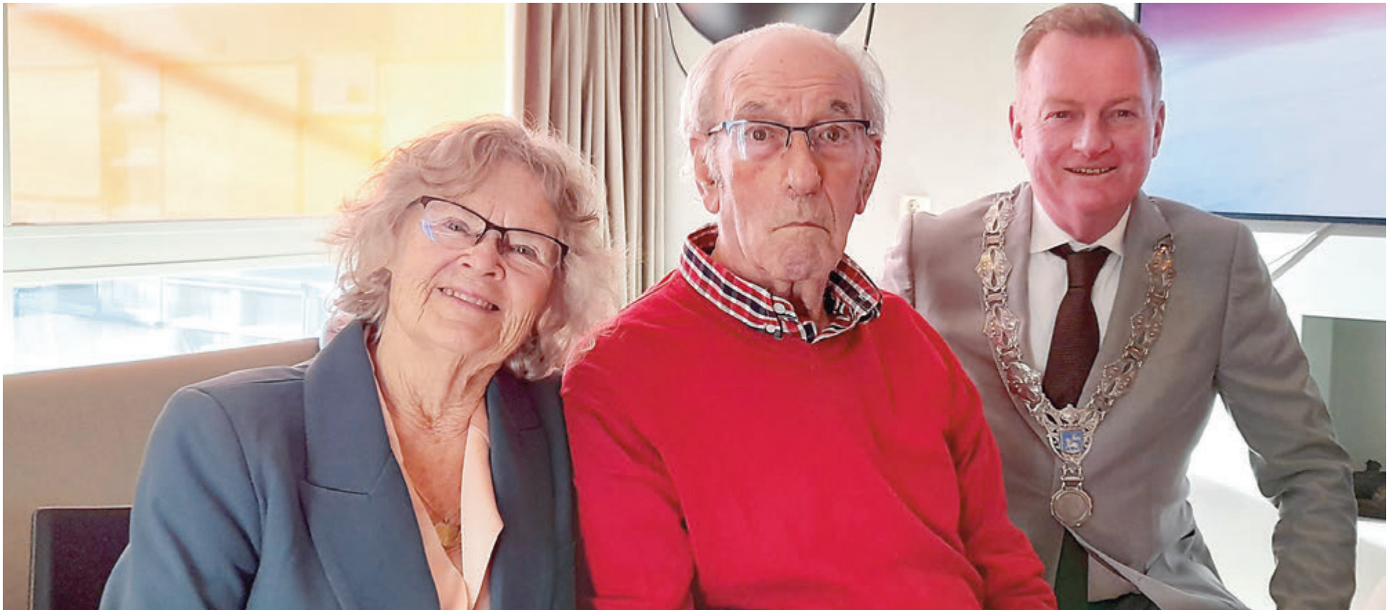
Helaas woont het echtpaar door omstandigheden niet meer bij elkaar maar ze kijken terug op een fijn huwelijk.