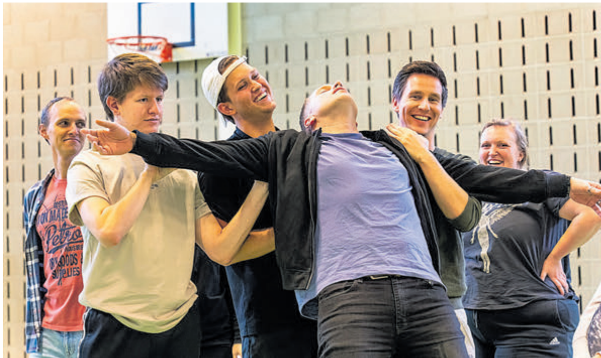
Een hilarische hitmusical op de planken gezet door Unidos.