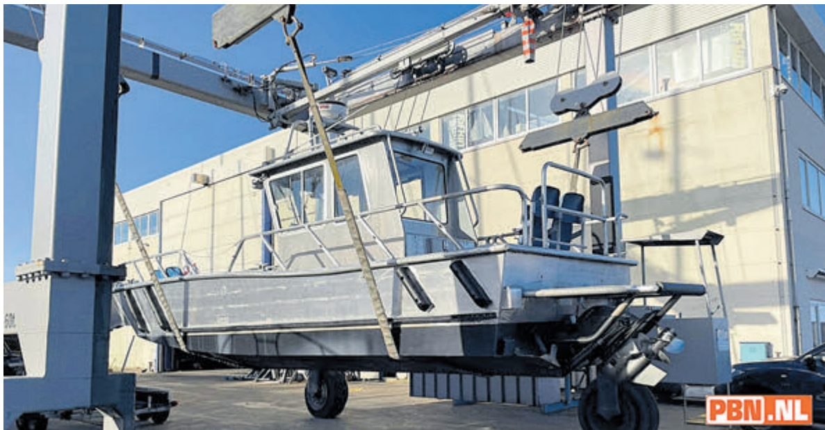
De naam 'De Kleine 8' heeft een historische betekenis.

Een papieren versie van de overige bekendmakingen ligt bij: Gemeentehuis Velsen, Dorpshuis Het Terras, Buurtcentrum De Dwarsligger, Buurthuis De Brulboei, Wijkcentrum De Stek, Wijkcentrum De Hofstede, Bibliotheek IJmuiden, Bibliotheek Velsbroek, uitleenpunt Huis ter Hagen en uitleenpunt de Moerberg. Voor de inzage van stukken kunt u naar het gemeentehuis.