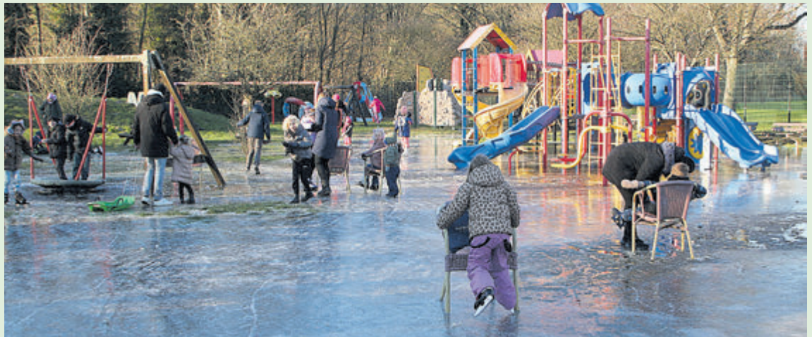
Bij speeltuin De Veilige Haven werd van de watersnood een ijsdeugd gemaakt!

Winterswijk, die dezelfde avond de eerste Nederlandse schaatsmarathon op natuurijs van deze winter organiseerde. Woensdag lokten het ijs, het winterse zonnetje in een strakblauwe lucht en de vrije woensdagmiddag veel ouders met kinderen naar de Heerenduinweg. Het leverde mooie beelden van winters vermaak met ijs-, slee- en schaatspret op. Met een spontane en geïmproviseerde "zopiekraam" trakteerde het tegenover gelegen tankstation Shell Post IJmuiden de ijsgangers op warme chocolademelk. Dit gebaar werd zeer gewaardeerd!