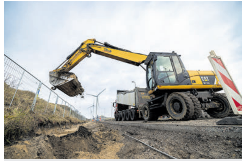
Een bulldozer werkt aan het bouwrijp maken van de grond waar het windscherm gebouwd gaat worden.

Voor het tweede jaar op rij werden Velsense kunstenaars opgeroepen deel te nemen aan de decemberexpositiewedstrijd in Bibliotheek IJmuiden. Dit jaar deden 23 deelnemers mee. Tot 9 januari kon in de bibliotheek gestemd worden op de werken. 'The Basterd' van Ton is de winnaar. De afbeelding is geschilderd op het karton van de barbecue die Ton aanschafte. „Ik wilde het karton niet zo maar weggooien en heb het dus gebruikt om dit kunstwerk op te maken. De ondergrond sluit aan bij de afbeelding.“ Ton schildert elke vrijdagochtend bij KunstForm. „Ik denk dat mijn medecursisten en docent Afke heel trots zijn.“ Ton Wijker volgt Jomary Bierenbroodspot op.