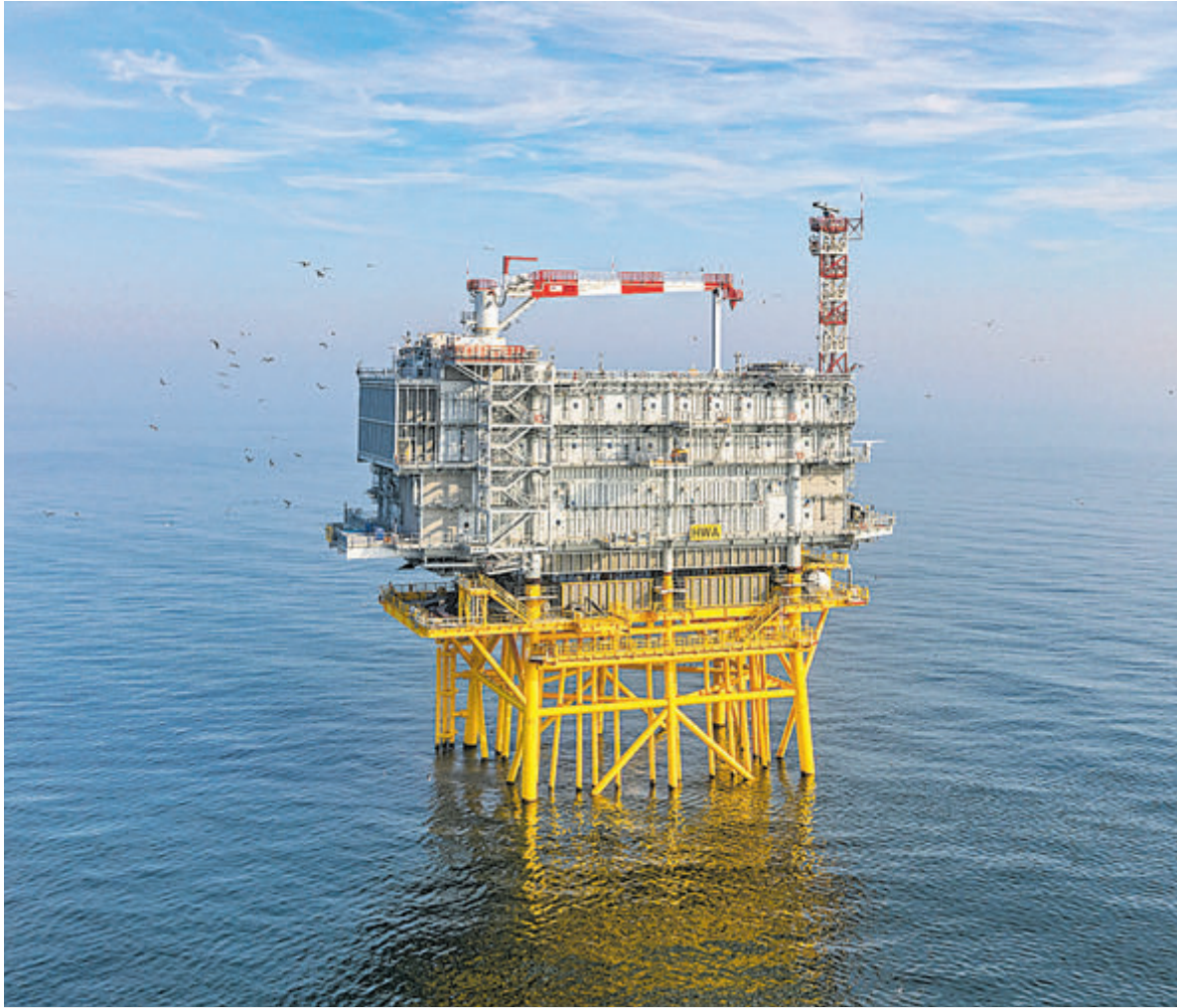
Het Platform Hollandse Kust (West Alpha).