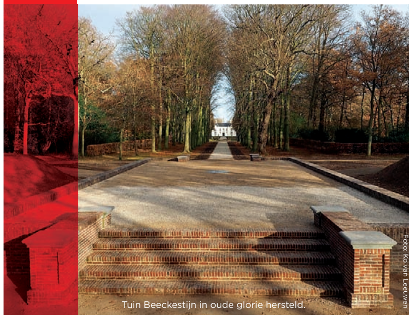
Tuin Beekestijn in oude glorie hersteld.