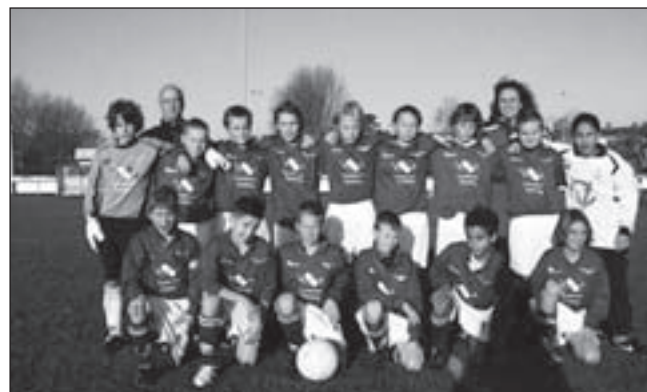
Stormvogels D2 ziet er prachtig uit in het nieuwe tenue, dankzij sponsor Lindeman Holding

Voor de jeugd zijn de prijzen verdeeld in onder- en bovenbouw. Verder is er een leuke 'Klaas'-herinnering voor iedereen. De loop wordt gesponsord door Praktijk voor Fysiotherapie Ben Ebbeling. Meer informatie: www.avsuomi.nl